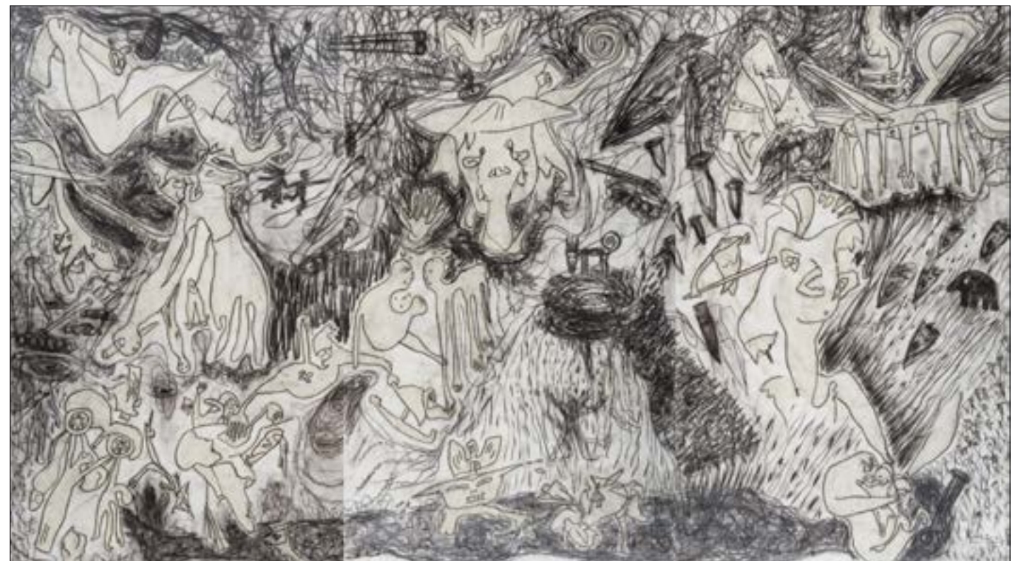
«مذبحة» (ترينيك - وسائط مختلطة على كانفاس - 200 × 3602 سنتم - 2009)