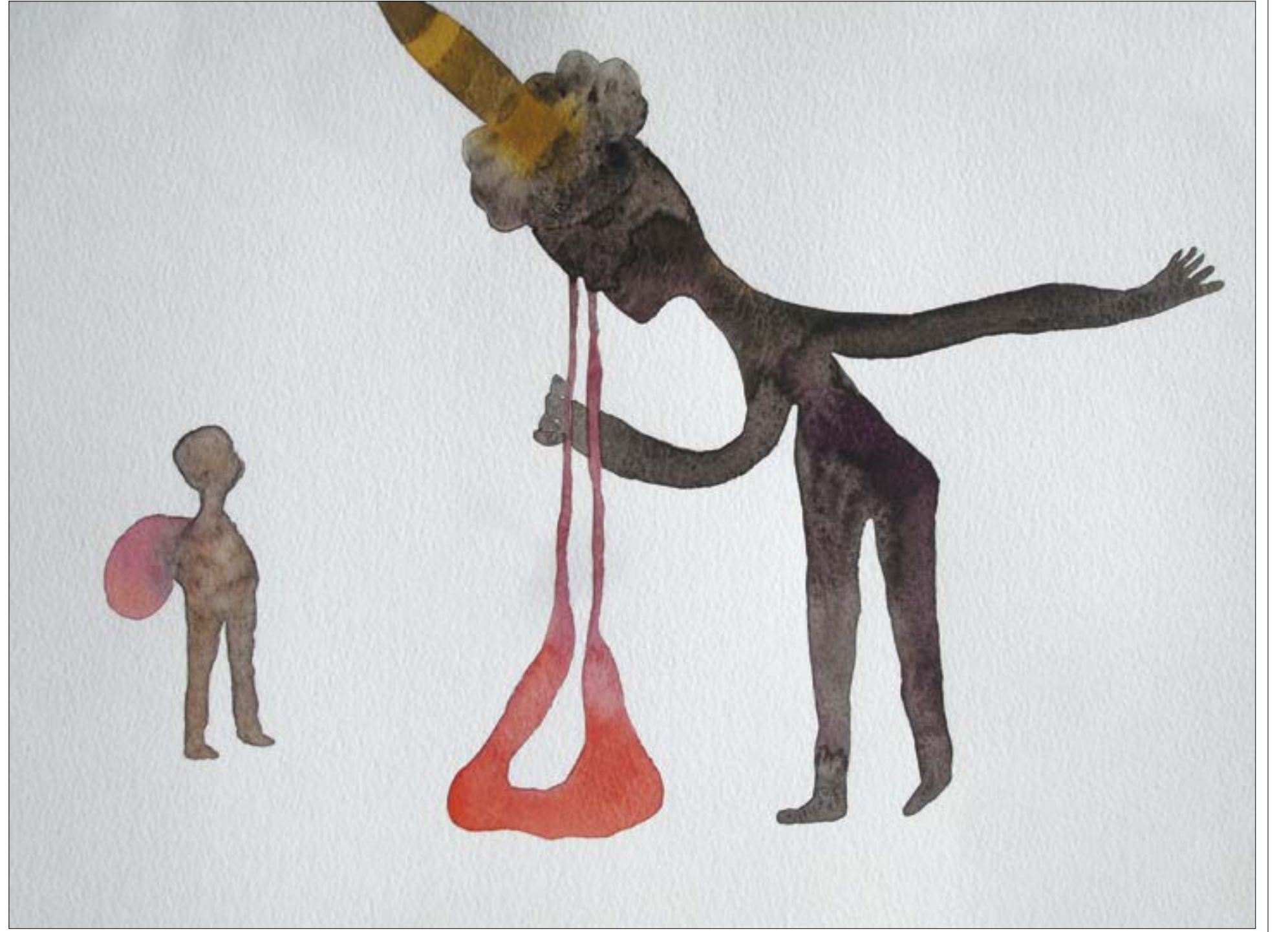
من سلسلة «الحرب» (الوان مائية على ورق - 26 × 36 سنتم - 2006)

تحت عنوان «فصول هن يوميات الازمنة الراهنة» الذي تولّت تقييمه الأكاديمية والناقدة نائلة تماراز، يضيء معرض الفنان اللبناني الجديد على ثلاثين عاماً من الممارسة الشغوفة في مسيرة خارجية عن المألوف: حرب 2006، نزوح شعوب الشرق الأوسط، سياق الحجر وكارثة انفجار مرفأ بيروت عام 2020... كلها تجد مكانها الأقسام الخمسة من المعرض