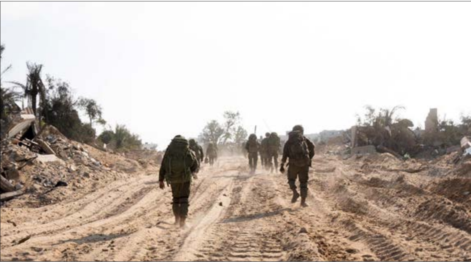
بعذ الجيش الإسرائيلي المدة لتنفيذ عملية رفح. ويستلم الأميركيون ذلك في ممارسة الضغوط على «حماس»

تعرّضت للتحريض والانتقاد من قبل المستوطنين وعلى رأسهم بن غفير وسموتريتش بإدعاء التساهل مع الفلسطينيين والتشدد مع المستوطنين في الضفة الغربية التي تولى مسؤوليتها». بدوره، علّق زعيم المعارضة، يائير لابيد، على الاستقالة، معتبراً إياها «مراً مُثرباً وخيبراً»، مردفاً: «كان من المناسب أن يحدو نتخايها حدوه». أما الكاتب في «هارتس»، عاموس هرثيل، فقد رأى أنه «من المستحيل نسيان حقيقة أن هناك شخصاً واحداً يرفض حتى الآن قبول أي مسؤولية عن الكارثة التي حدثت في عهد، وإلى حد كبير نتيجة لسياساته». رئيس الوزراء بنيامين نتنياهو.»