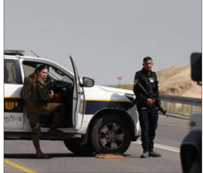
وفي مدينة نابلس، حيث شهدت عدة قرى قريبة منها اقتحامات واسعة، أصيب شاب برصاص الاحتلال، فيما شنّ الجيش حملة اعتقالات في مدينة الخليل وبلداتها، حتى بلغت حصيلة الاعتقالات، منذ مساء الأربعاء حتى صباح الخميس، 25 مواطناً على الأقل من الضفة، بينهم طفل وأسرى سابقون. وقد تركّزت عمليات الاعتقال في محافظة الخليل، فيما توزّعت بقية الاعتقالات على محافظات: رام الله، طولكرم، جنين، سلفيت، والقدس، وإلى جانب ذلك، تواصل قوات الاحتلال تنفيذ عمليات اقتحام وتكثيف واسعة، وأعداءات بالضرب الحزج، وتهديدات بحق المعتقلين وعائلاتهم، بالإضافة إلى حوادث التخريب والتدمير الواسعة في منازل المواطنين.

الأميركية اعترفت بهجوم واحد فقط خلال 48 ساعة، ولم تعلق على العملية العسكرية الواسعة التي نفذتها قوات صنّعاء منتصف الأسبوع الجاري، ومن إجمالي سبع عمليات نفذتها تلك القوات، وأعلنت العملاقة للشحن التوقف عن المرور في البحر الأحمر، قالت شركة «كارينغال كورپوريشن» الأميركية - البريطانية، «حارس الأزدهار» من جهة أخرى. وبعدما أعلنت شركة «ميرسك» العملاقة للشحن التوقف عن المرور في البحر الأحمر، قالت شركة «كارينغال كورپوريشن» الأميركية - البريطانية، «حارس الأزدهار» من جهة أخرى. وبعدما أعلنت شركة «ميرسك» العملاقة للشحن التوقف عن المرور في القيادة المركزية في بيان باخر عملية، وهي التي لم تطلن «أنصار الله»، عنها، وتجاهلت العمليات السابقة التي تعدّ الأوسع منذ بدء