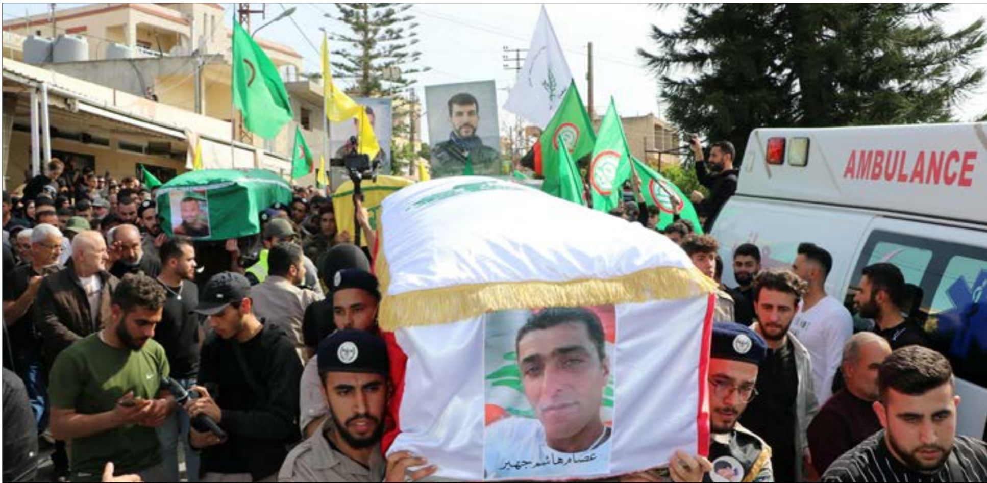
تسليم شهداء حذرة الثورة لمس

في إطار «بينغ بونغ» الرسائل النارية التي يتبادلها حزب الله مع العدو الإسرائيلي، سُجِّل أمس تطور لافت تمثل بقصف حزب الله للمستعمرات الإسرائيلية بصواريخ ثقيلة من طراز «بركان» وغيره، بعدما حصر استخدام هذه الصواريخ في المرحلة السابقة باستهداف المواقع العسكرية بصواريخ ثقيلة من طراز «بركان» التي كانت سائدة منذ الثامن من تشرين الأول الماضي. يأتي ذلك في رسائل أميركية تشير إلى عدم الرغبة بالتصعيد، وهو ما عبّر عنه مستشار الأمن القومي الأميركي جاك سوليفان، عقب زيارة وزير الدفاع الإسرائيلي يواف غالانت أخيراً إلى الولايات المتحدة لطلب تسريع شحنات