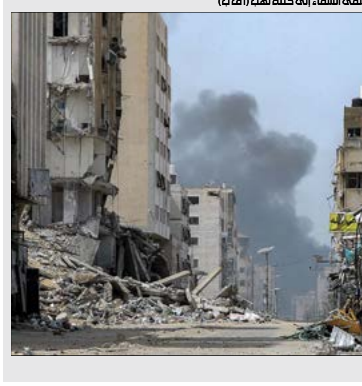
اسرائيل تحوّل منطقة مستشفى الشفاء إلى كتلة لهب

عسكرية السابع من أكتوبر، في مقابل ما حققه جيش العدو. وخلصت الوثيقة إلى أن «حماس» استطاعت تحقيق 10 منجزات، أهمها عنصر المفاجأة وقدر الخسائر الكبرى في صفوف جيش الاحتلال ومستوطنيه في مستوطنات غلاف غزة، وثانها، هو وضع المخالفة باقامة الدولة الفلسطينية المستقلة على طاوله صنّاع القرار في المجتمع الدولي. ويضاف إلى ذلك، الحصول على دعم المنقّفين في الغرب للمقاومة ومبرراتها الأخلاقية لقتال إسرائيل، وبمساهمة في تفكك تماسك المجتمع الإسرائيلي، من خلال استخدام ورقة الاسرى والمختطفين في التاتير على الوعي الجمعي في الجبهة الداخلية الإسرائيلية، ومضاعفة حدة الغتمة ضد المستوطنين السياسي والأمني، كذلك، نجحت المقاومة في تفعيل جبهات مساندة خارجية في اليمن ولبنان ساهمت في تهجير نحو 80 ألف مستوطن من شمال فلسطين المحتلة، ومضاعفة عزلة دولة الاحتلال السياسية، والحصار البحري الفعال وما تسبب به من آثار اقتصادية وسياسية حادّة على اقتصاد الدولة. وفي مقابل كل منجزات «حماس»، تحدّثت الوثيقة عن منجز منغوي التطوع والتفاني لدى مئات الآلاف من الجنود وعائلاتهم».