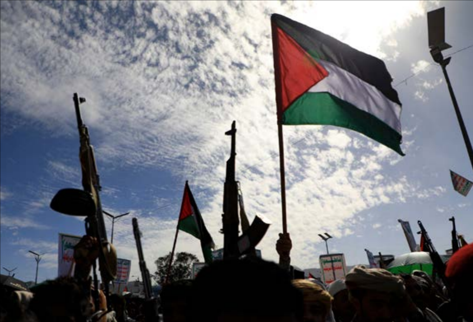
«انصار الله، نجحت في تصوير هجماتها على انا مصدر فخر للشعب العربية (اف بي)

عند قدرة «أنصار الله» على تقديم محتوى باللغة الإنكليزية لإشراك الجماهير الغربية، وخاصة في ما يتعلق بغزة. ورصدت المجلة كيف لجأ المسؤولون اليمنيون إلى نشر البيانات الرسمية باللغة الإنكليزية بدلاً من العربية لزيادة انتشارهم. وقال أحد الباحثين فيها إن «جهود الحوثيين في هذا المجال تعكس مدى أهمية قنوات التواصل الاجتماعي لكسب الراي العام العالمي». هكذا، تغيّرت النظرة إلى اليمن خلال