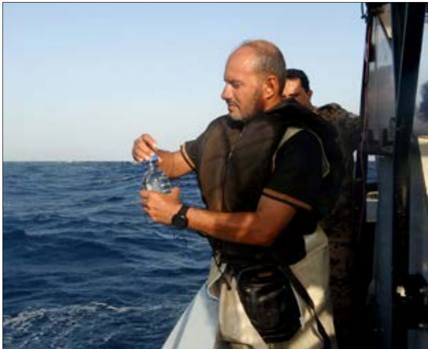
تصاعدت أزمة اللقمة بين الشركات الملاحية وتحالف «حارس الزدهار»