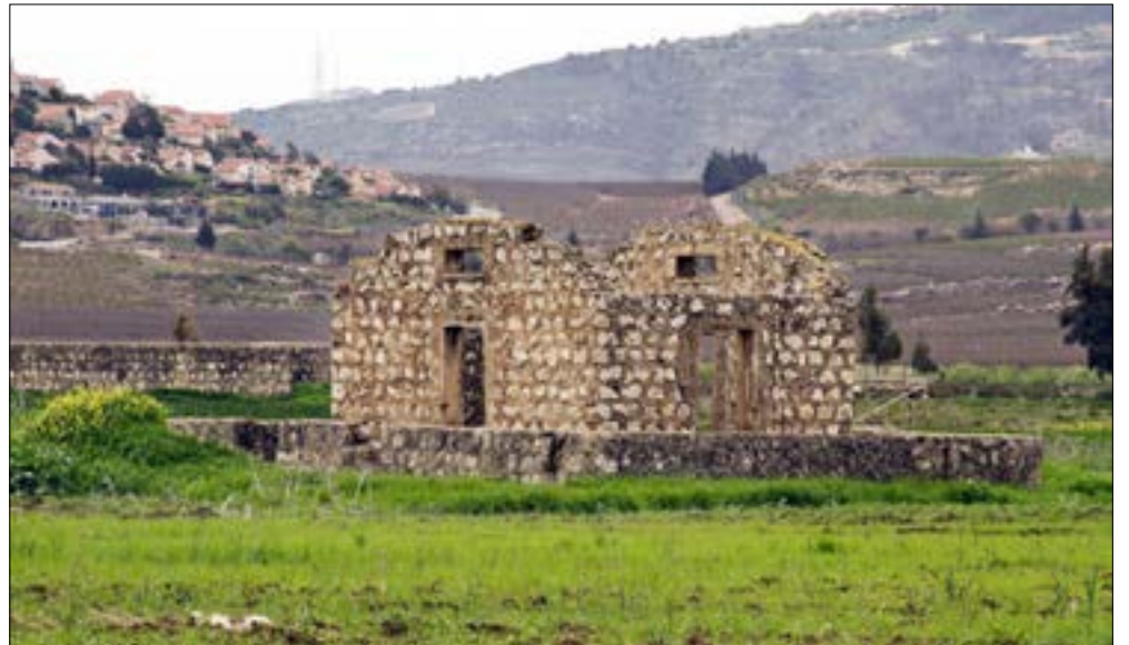
دُمر المستشفى بالكامل في عدوان 2006 (كامل جابر)

وسّعت قوّات الاحتلال الصهيوني في الأيام الماضية هجماتها على مناطق جنوب لبنان، من الناقورة غرباً حتى شبعا ومزارعها في الشرق. هجمات عبر المسيرات أو قصف مدفعي مُركّز على مختلف المناطق بينها الزراعيّة، أو تلك التي تتمتع بغطاء نباتي كثيف.