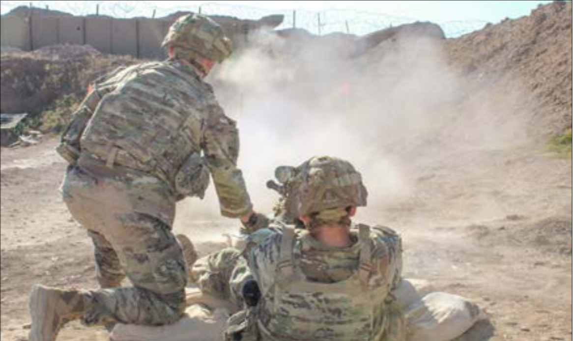
استخدمت فئلك المقاومة الموامد المبركية في سوريا، لمرافع مفي 12 ساعة فقط

غزة. وقد تجد حكومة محمد شياع السوداني، والتي تخضع لضغط أميركي في المقابل لوقف الهجمات التي تشنها المقاومة العراقية على القواعد الأميركية في العراق وسوريا، في هذا الإجراء، متنفساً لها باعتبار أنه يحظى بتوافق عراقي، وفي الوقت نفسه لا يجرّحها أمام الأميركيين. ويأتي خفض النفط، في حال الخفي فيه، ليمنّل قراراً عراقياً مقدّماً، بعدما فشلت القمّة العربية والإسلامية الطارئة التي انعقدت قبل أيام في الرياض