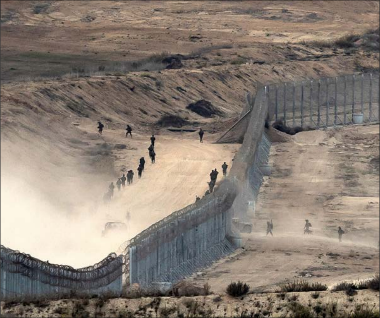
لم تستطع القوّات البرية أخراق خطوط الدفاع الولبة للمقاومة في بيت حانون

تحوّلت سجون العدو إلى جحيم لا يطاق، يعاني فيه الأسرى من شتى أنواع الانتهاكات والإعتداءات التي تتفدّها قوات الاحتلال بحقهم، والتي تصل إلى حدّ القتل المباشر، كما جرى أمس مع أسير فلسطيني، لم يعلن عن هويته حتى الآن. فقد أعلنت إدارة مصلحة السجون استهداف أسير في سجن مجدو، من مولد عام 1990، كان قد اعتقل في شباط 2023، بعدما شعر بوكرة صحية ونُقِل إلى عيادة السجن، حيث أعلن طاقم العيادة وفاته والتحسس مزامع الاحتلال، وهذا هو الأسير الثالث الذي يستشهد في عملية اعتقال منذ بدء العدوان على قطاع غزة، بعد الأسيرين: