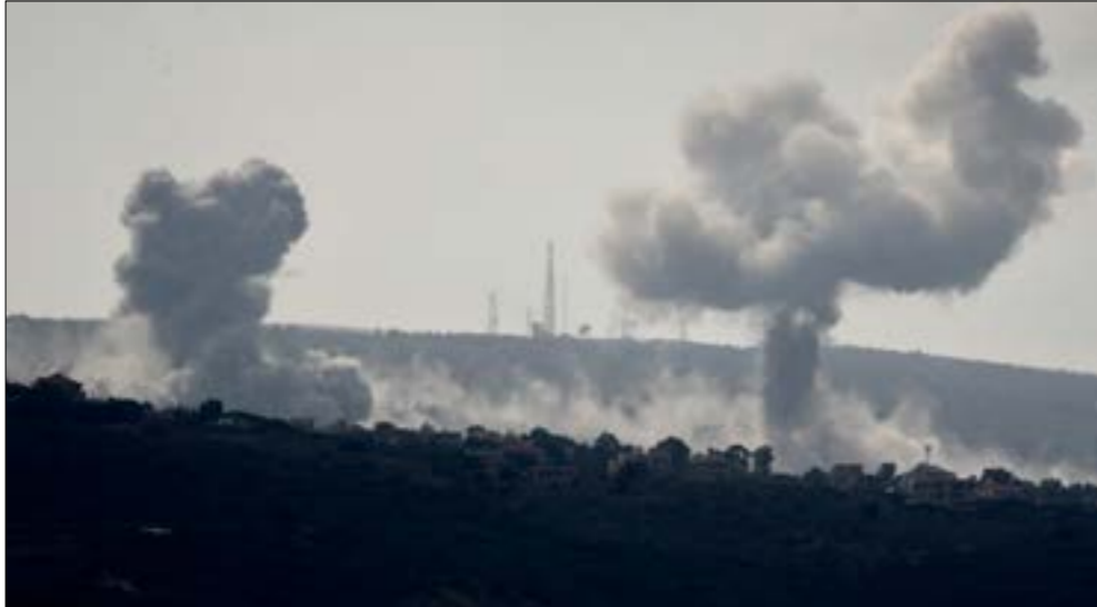
غارات جويّة بين اللبنة وعلما الشعب وبيديو في الخلفية مومم العدو في جة الملام (على حشيشوا)

بجروح طفيفة، قبل أن تطلق المُسيرة صاروخاً ثانياً، ما أجبر القافلة على التراجع. كذلك أطلقت مُسيرة إسرائيلية 4 وصواريخ على محيط بلدة كفر كلا، وقصفت مدفعية العدو أحراج شاذوح وحلتا في خراج كفرشوبا، ومنطقة البونة جنوب الناقورة، وسُجّل ليلاً تحليق لطيران مُسير على طول خط ساحل الزهراني وفوق قرى صور والنبطية على علوّ منخفض.