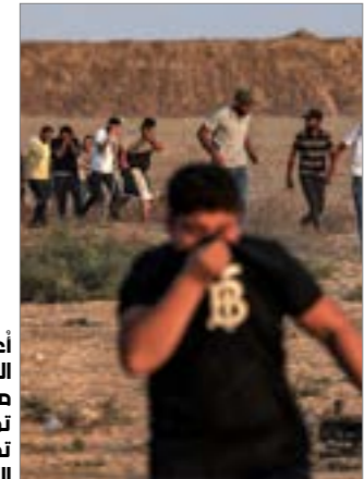
اعلن مجددا عن النجوم من تعبئة خطمات العودة تصهيدا للبدء في تحريك العمليات الجماهيرية (ف.أ.ب)

أن الآلية التي تمّ فيها تسريب الخبر، نشي بغياب الإجماع الفصائلي على جدوى استئنافها.