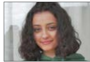
ليلية أنس وهرة خصر

توقيع كتاب «زريف الطول»: اليوم الإثنين - س: 18:00. مقرّ الأمانة العامة لـ «الاتحاد العام للكتاب والصحافيين الفلسطينيين» (دمشق - جادة الرئيس - مقابل مدخل وزارة التربية).