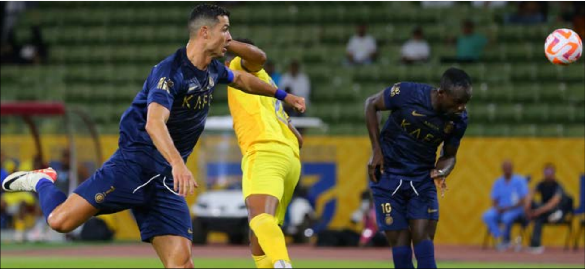
يان الدوروي السعودي وجهه اللاعب بيت الخيت بانلوا في آخر مسيرتهم