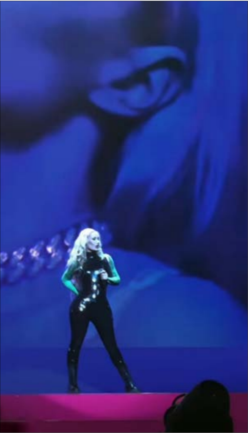
اغنية ازاليا تضمنت عبارات تدعو للعبادة (ملك الاله) (صم الوები)

تحت بنود الحماية وإنشاء مكاتب جديدة للمنظمات ومقابل أعمال لوجيستية واتصالات. ووفق المعلومات التي حصلت عليها «الأخبار» من «حملة آين الفلوس»؟ المعنية بتتبع فساد المنظمات الدولية، فقد بلغت فاتورة الانصالات والإنترنت أكثر من 1,3 مليون دولار لـ«برنامج الغذاء العالمي» وشركائه، فيما شكّل تبديد ملايين الدولارات في الظروف الحالي الذي تزداد فيه معاناة اليمنيين جراء استمرار الحصار وتلكؤّ دول العدوان في تنفيذ الاستحقاقات الإنسانية، يأتي ضمن ضغوط أميركية غير أخلاقية، الهدف منها تضيق خيارات العيش على الشعب اليمني»، مضيفاً أن «المجلس الأعلى للشؤون الإنسانية حدّر من خطورة استخدام المساعدات الإنسانية كورقة ضغط سياسية على صنعا، تزامناً مع الساعي الجارية لاستغلال معاناة