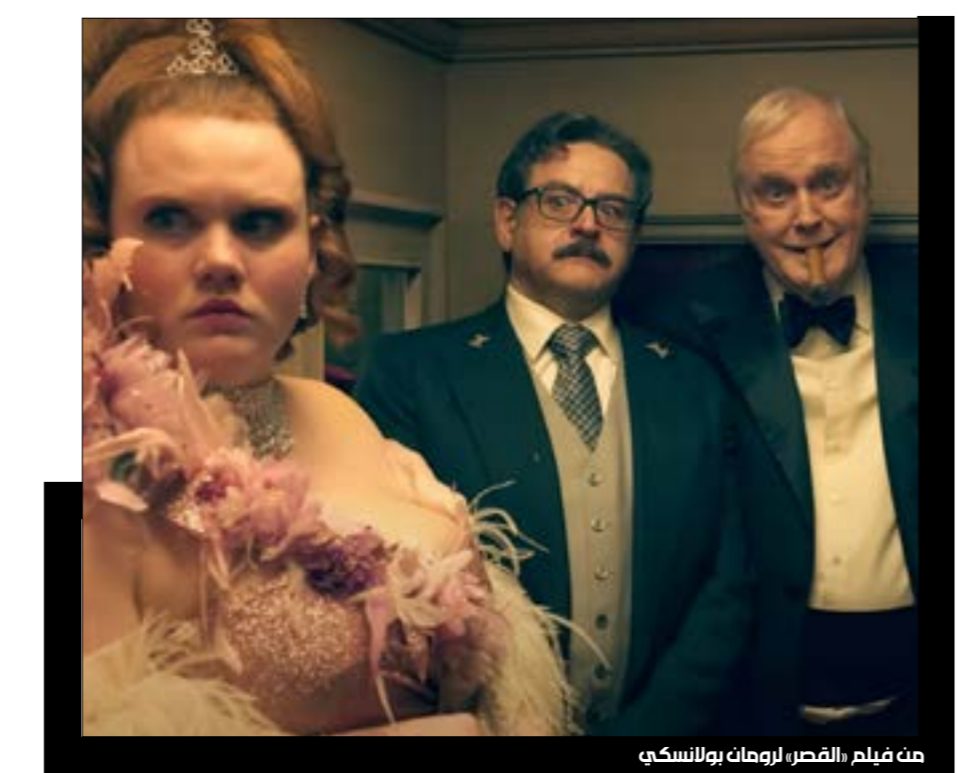
من فيلم «القصر،رومان بولانسكي

مع تقدم الفيلم، كنا ننظر من بولانسكي أن يفوح أكثر في سخريته، لكنّه ظلّ على السطح. ظلّت المواقف الفكاهية نفسها وتحوّلت إلى شيء لا يضحك في معظم الأوقات. بدأت الشخصيات في الاختفاء من أمامنا لأنه ليس لها دور، ويمكن نسيانها بسهولة، عدا أنها مكروهة بسهولة. تجنّب بولانسكي النقد الاجتماعي الذي اشتهر به وكنا نحنّ في انتظاره.