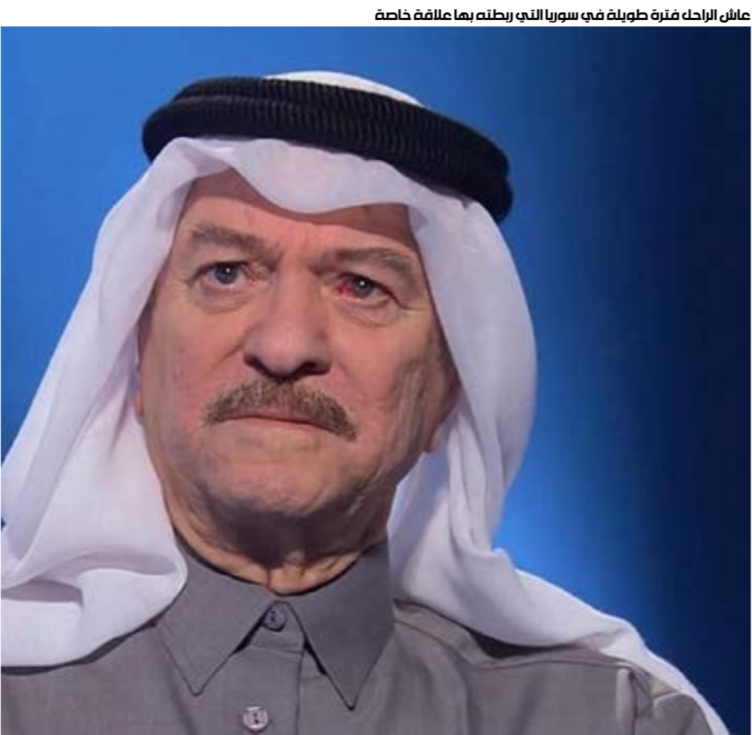
عاش الراحل فترة طويلة في سوريا التي ربطته بها علاقة خاصة

القزويني الحسيني. بدأ مشواره من النجف مسقط رأسه، عندما كان مقرّناً بتلو القرآن فياسر القلوب، ثم تحوّل إلى الفن وظل بارعاً في خطف الإعجاب والتأثر على مدار حياته. لفأوه الأول بالملحن محمد جواد أسوري كان في نهاية ستينيات القرن الماضي لينتجاً معاً أغنية «الهدل» التي بنتها «إذاعة القوات المسلحة» آنذاك، فحققت انتشاراً كبيراً إلى درجة صار اسم مغنّيها «مطرب الهدل»، بعدها، غنى «أبو زرّك» التي لم تشتهر كسابقتها. وفي نهاية الستينيات، التقى خضر بالملحن كمال السيد الذي قدم له أغنية «المكثّر»، من كلمات الشاعر زامل سعيد فتاح، وصارت بمثابة