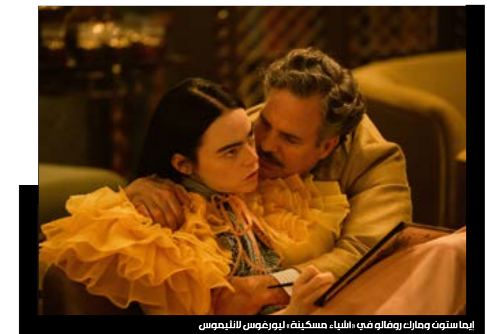
إيما ستون ومارك روفالو في «أشياء مسكينة» ليورغوس اللثيموس

المخرج اليوناني لا يضحى بشيء من أجل فنه، واليوم يقدم أحد أكثر افلامه إقناعاً ووضوحاً. لا تزال المصوّفة اللانثيموسية موجودة، بين زوايا الكاميرا الواسعة والتشوّهات الصورية والسخرية الحادة والذوق المروّع، والحوارات غير المحتملة، لكن اللبنة بالصدق، ووفق كل هذا، تعود الموسيقى في أفلامه وتوظف كمحلول للسرد وتطلب منا إعادة النظر في ما نشاهده. «أشياء مسكينة»، أو نحن المساكين، عمل يجعل غرائزنا الحيوانية شيئاً رائعاً، يعيد تثقيفنا، يعلمنا معنى الحياة من خلال جسد امرأة بالغة في عقل طفلة تكتشف الحياة من دون حواجز. لانثيوس قدم حكاية قوطية دقيقة ومفضّلة بقدر ما هي مبهرة. أسطورة يجب أن تبقى لتتوارثها الأجيال.