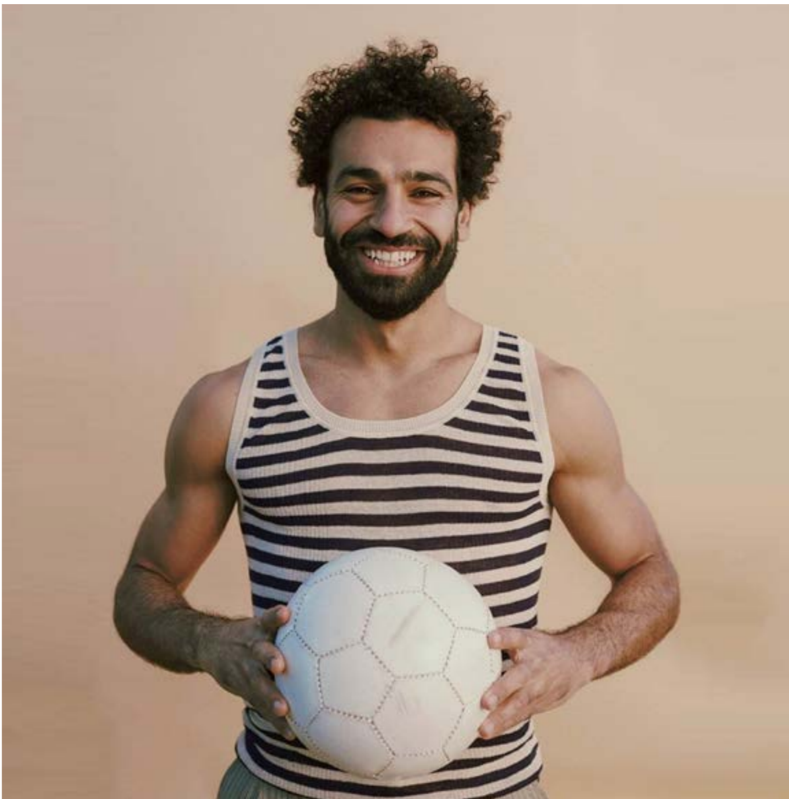
فرض «ابو مَكَّة» الصمت على افراد أسرته