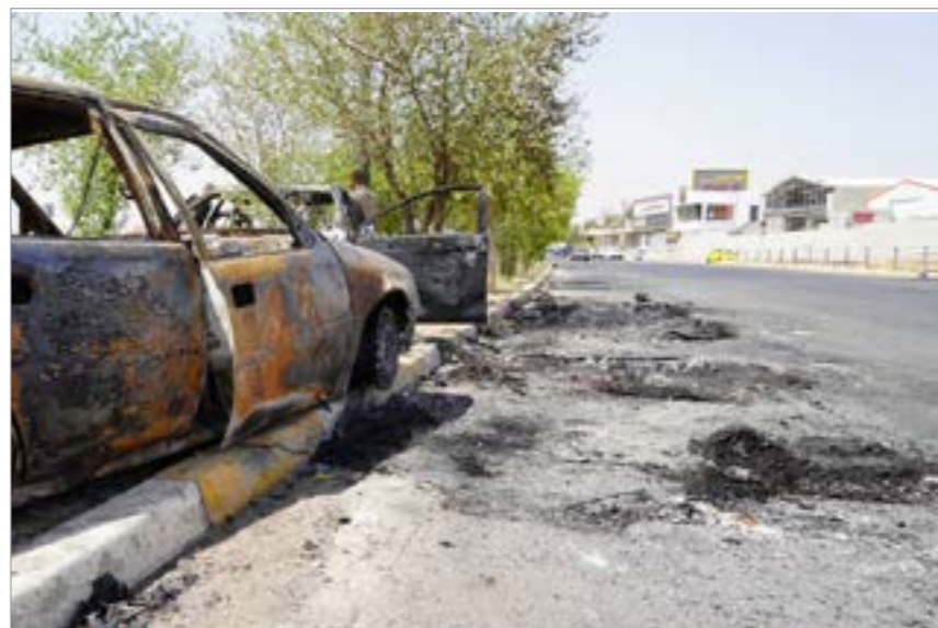
الاشتياقات كركوك اوقعت لالة قتله وعشرات الجرحى

تطورت الأحداث في مدينة كركوك شمالي العراق، على نحو دراماتيكي. بعد اشتباكات أدت إلى سقوط قتله وجرحى. بينت قوات الامن العراقية والمصبرات من المحتجين العرب والتريكمات الاراضية لخللاء مقر العمليات المشتركة وتسليمه الى «الحزب الديموقراطي الكردستاني». وكان قرار الاخلاء اثار مخاوف لحده العرب والتريكمات من عودة الفوضى والاغتيالات الى المدينة. عليه اشهر قليلة، عليه انتخابات مجالس المحافظات المقرر اجراؤها في نهاية العام الجاري