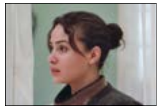
فيلمان قصيران عن الحب والذكريات

حفلة «ليلية أنس وهرة خصر»: الجمعة 8 أيلول 2023 - س: 21:00 - «مترو المدينة» (الحمرا - بيروت). للاستعلام: 76/309363