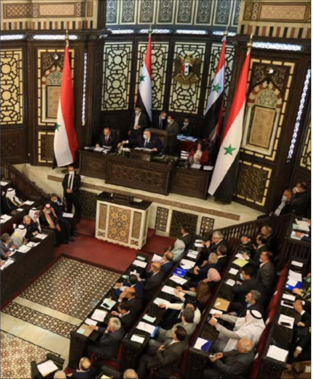
من إحدى جلسات مجلس الشعب السوري السابقة