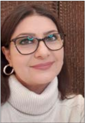
نكح عالمة الفلك يومياً ضمن فقرتين

اثارت الممثلة المصرية جدلاً واسعاً حيث كشفت انها عاجزة عن الحركة، قبل ان يخرج المنتج المغفور أحمد الزواوي ممثلاً مسؤوليته عن إصابة الفنانة الشهيرة، لأخذ حقّه منها بعدما تخافت عن تصوير فيلم كانوا قد اتفقا عليه على حدّ تصويره