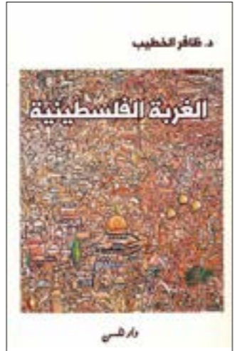
الخلف لوحة للفنان جميل ملاعب

لحظة الخطر، في مجال الخيال بلسان مُغاير، تمتدّ في أكثر من سياق بعد ذلك، ففي صورته لنسخة «دار المعارف»، من حكاية «كليّلة ودمنة» يُشير طه حسين إلى ظهور الحكاية في أيام صعبة - الحرب العالمية الثانية - بسبب الحرب وأفامها، حيث