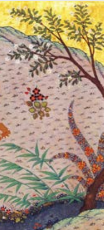
«كليّلة ودمنة»، منلمة فارسية

في قراءة سياسية، يتكوّن الصراع طرفين مركزيين، يشكّله طرف مُستضعف (الحيوان)، وصاحب السلطة «الأسد»، وما بينهما تتشكل التجربة. من هنا، تُشير هيثم، إلى أنّه عند نشوئه، مثل الخيال وجهاً آخر للحقيقة، لا ينفصل عنها، لكنه يراوغها للهروب من تبعات الدخول في ما يحظره الحراك السلطوي. يأتي الأمر مثل نداء تاريخي، واجب لا بدليل عنه، كي تُكمل اللحظة التاريخيّة تشكّلها بالراي الآخر، الذي يكون موعوماً في الغالب. حتى مع الحزن، والاختباء وراء الخيال، لم يسلم ابن المفقّع من سندان