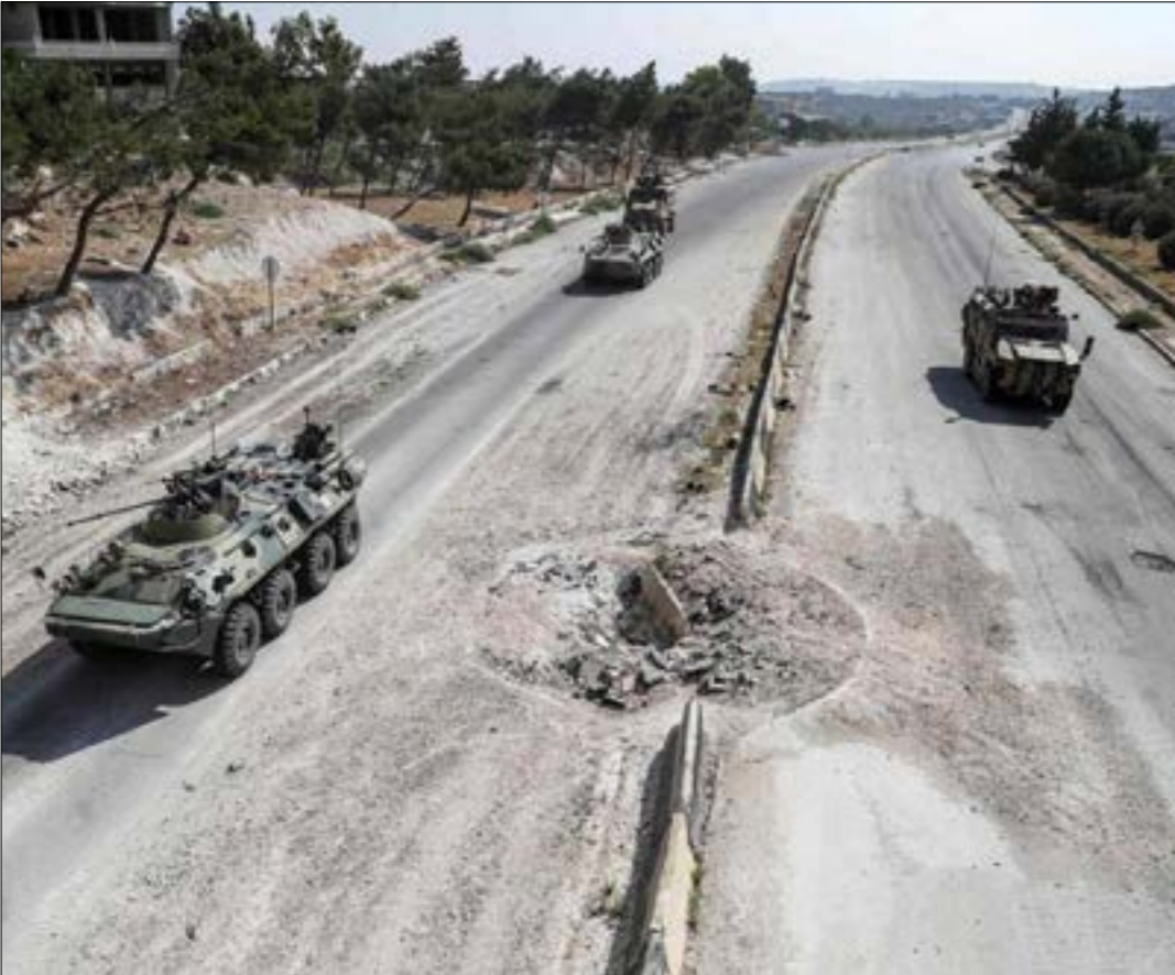
صورة لدرورية روسية - تركية مشتركة على طريق M4، تظهر الأضرار التي لحقت ببنيته

تساهم بنسبة 24% من الناتج المحلي الإجمالي للبلاد. وفقاً لتقديرات العام 2010، ويحدّد حزوري، في حديثه إلى «الأخبار»، فائدتين اقتصاديتين مباشرتين له «M4»: الأولى أنّ ميناء اللاذقية هو الميناء الأساسي الذي تُستورد منه الصناعات الحلبية معظم المواد الأولية ومستلزمات الإنتاج والمواد تصفّ المصنّعة اللازمة