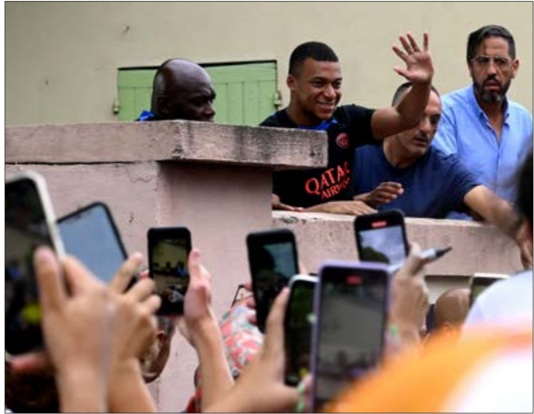
إذالم يخرج مبابي هذا الصيف من باريس، فإن مفارزته الموسم المقبل ستكون مجانية

«كباش» صعب بيت باريس سان جيرمان الفرنسي ونجمه الأول كيليان مبابي لا يبدو أنه سينتهي بسلام. الطرفان يريدان تحفيّة المكاسب والمال عنصر أساسي داخل حلبة الصراع التي أحدثت انقساماً وحيرة لدى محبي الطرفين. ضمنّ هو الظالم ومنّ هو المظلوم في هذه القضية؟