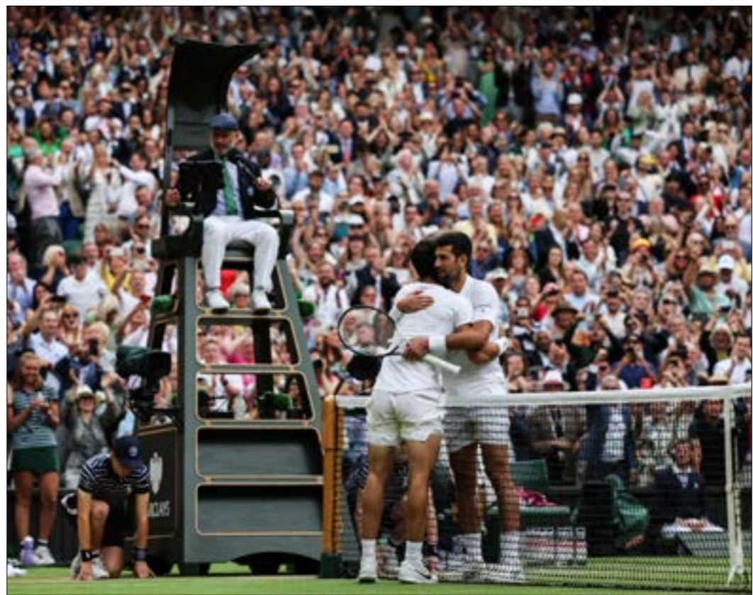
تتميز كرة المضرب، رياضة الأغنياء (ف ب)

في حال عدم اتخاذه القرار الصحيح، ونذاله بعدما قرّر ال PSG أن يبادره بنفس ما يعتبره ظلماً له على قاعدة «العين بالعين»، فبات الأفضل بالنسبة إلى الطرفين هو الاقتراق، إذ لا نتيجة أفضل في الموسم المقبل إذا ما كانت الأجواء سلمية كما هو الحال عليه حالياً، حيث اقتنع باريس سان جيرمان ومبابي بأن «الجزء انتحسرت» وهناك استحالة لإعادته إلى سابق عهدها.