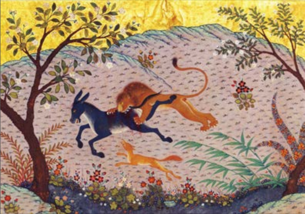
«كليّلة ودمنة»، منلمة فارسية

يشغل حيوان «ابن أوى» ذيل ترتيب مقام الحيوانات وحضورها خارج عن عباءة السلطان، غير أن ابن المفقّع من أصل فارسي، وقد أسلم بعد ذلك، وكان إسلام العجم لا يعفيهم من احتمالات القتل، حتى بعد إسلامهم. إذا، نشأ الخيال العربي خلال لحظة فارقة، هو مقاومة السلطة ومراوغتها، وتأتى ذلك من ضرورة استدعائها التاريخ. كي يكتمل فعل