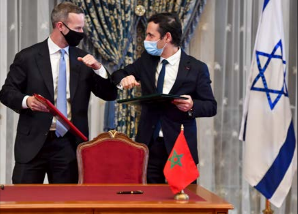
الاستخبارات الإسرائيلية زوّدت المغرب بوسائل تقنية وعسكرية لرصد الطائرات المسيّرة ومواجهتها (ا ف ب)

وتأتي الحماسة «الملوكية» المغربية لزيارة نتنياهو لتتفوّق على الحماسة الإماراتية والبحرينية التي