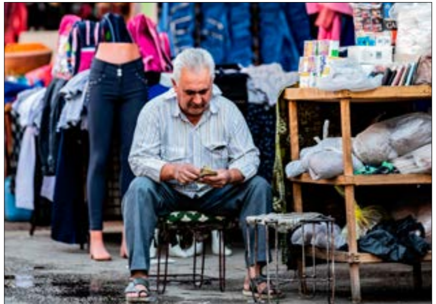
لم يكن لدى الحكومة ما تستطيع طامته السوريون به

بعد أن طال انتظار السوريين لتحرك حكومي على خطّ الأزمة الاقتصادية، تمخّضت الجلسة الاستثنائية التي عقدها مجلس الشعب لمناقشة الوضع الاقتصادي، عن تشكيل لجنة مشتركة تضمّ أعضاء من المجلس