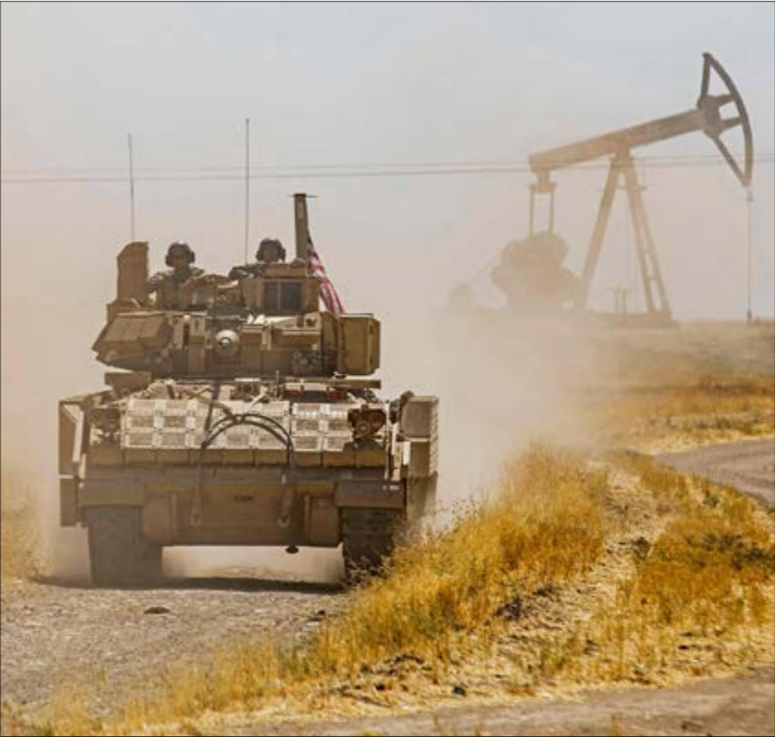
الظاهر أن واشنطن تخشى من تصعيد ميداني ضدّ قواعدها القريبة من خطوط التماس هم الجيش اسوري

تجربة التعاون بين القطاعين العام والخاص ليست جديدة في سوريا، وإن كانت قد اتخذت أشكالاً مختلفة في كل مرحلة من مسيرتها، إلا أن أقدمها شجّلت في القطاع النفطي، حيث تفرض الحاجة وجود شريك أجنبي يتولّى عمليات الاستكشاف استمرافاً بطرطوس، معمل الأسمدة، بعض مناجم الفوسفات، وغيرها. في عام 2016، وتحديداً في الشهر الأول منة، كرست الحكومة خيار الاستعانة بالقطاع الخاص في إدارة واستثمار المنشآت العامة، لكن هذه المرة قامت بإدخال البنى