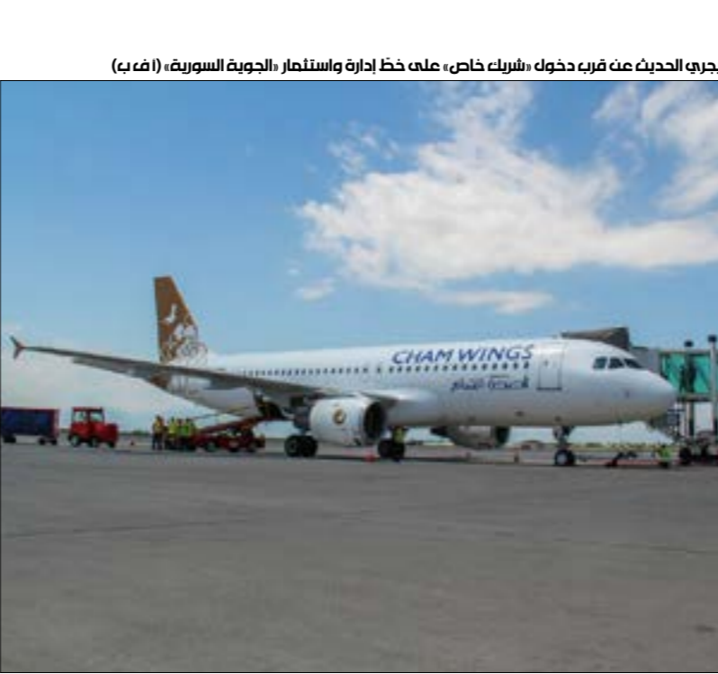
يجري الحديث عن قرب دخوله، «سريك خاص، على خط إدارة واستثمار» الجوية السورية،