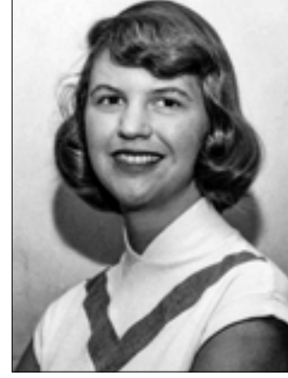
«جرس» سيلفيا بلات: يدقّ في الباشورة

حفلة Sunkissed Child: غداً الأربعاء - س: 20:30. «صالون بيروت» (الحمرا - بيروت). للاستعلام: 01/739317