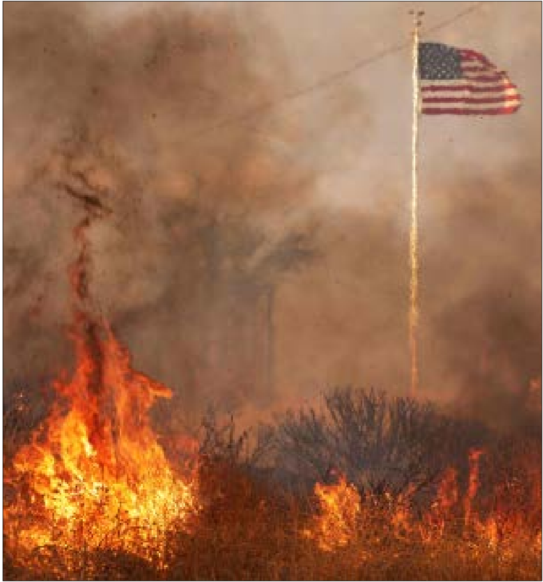
تشهد بعض المناطق الأميركية درجات حرارة لم تسجّلها في عقود

في جنوب الولايات المتحدة، بدأ عدد من العمال، ولا سيما في مجال البناء، وال«رغمعن» على مواصلة عملهم رغم موجات الحرّ، تنظيم احتجاجات في المنطقة الساحلية إلى 32، مع شعور بحرارة أعلى بسبب الرطوبة المرتفعة.