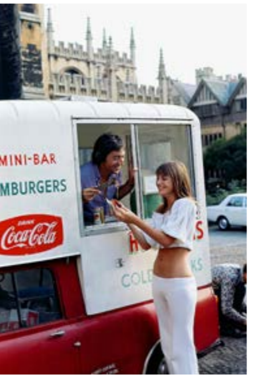
مع سيرج غينسبور في اكسفورد عام 1969 (اندرو بيركن)

Sixties التي حققت نجاحاً واسعاً وكثيراً ما يُستخدم عنوانها لقباً لبيركن. لا يمكن الحديث عن الفنانة البريطانية الأصل من دون الوقوف عند تأثير غينسبور الكبير عليها وتأثيرها في أيضاً على مسيرته. فهي الهيمته وهو جعلها تظهر جراتها الكاملة حتى باتت رمزاً للإثارة والأناؤنة. من هذه العلاقة رُزقت بيركن بابنتها شارلوت التي قدّمت خلال «مهرجان كان» عام 2021 فيلماً وثائقياً حول والدتها بعنوان «جاين بتوقيع شارلوت».