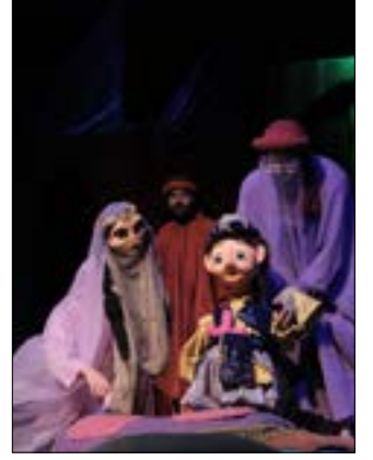
الف ليلة وليلة مع الأمير «مهرجان»

مناقشة كتاب «الجرس الزجاجي»: بعد غد الخميس - س: 17:00. المكتبة العامة لبلدية بيروت (بناية الدفاع المدني/الطبقة الثالثة - الباشورة). للاستعلام: 01/664647