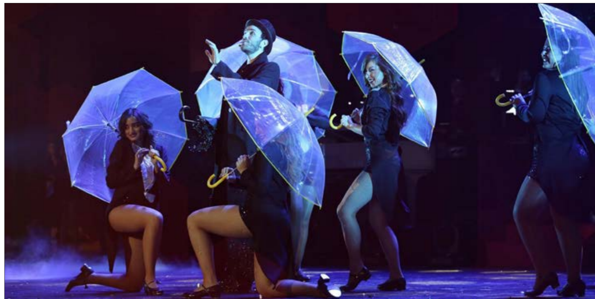
تختتم سهرات «بيت الدين» بمسرحية «شيكافو بالعربي»

زخم الحفلات وكثافة الأنشطة المنتشرة في مختلف المدن والبلدات اللبنانية، قد يوحيان بأنّ البلد بالف خير، إلا أنّ نظرة سريعة على برامج الاماسي، وخصوصاً المهرجانات الثلاثة الرئيسية، يكشف أثر الانهيار والازمة المالية التي تعذ الاسوا في تاريخنا. مع ذلك، إنّها فرصة لتجديد الأمل من بوابة الفنّ والثقافة. صيف لبنان الفنّي هذا العام مختلف بعض الشيء، محليّ بقسمة الأكبر، مع محطّات اجنبية جميلة بين بعليك وبيت الدين وبيبلوس