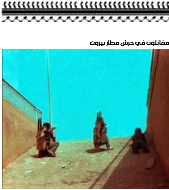
مقاتلون في حرش مطار بيروت