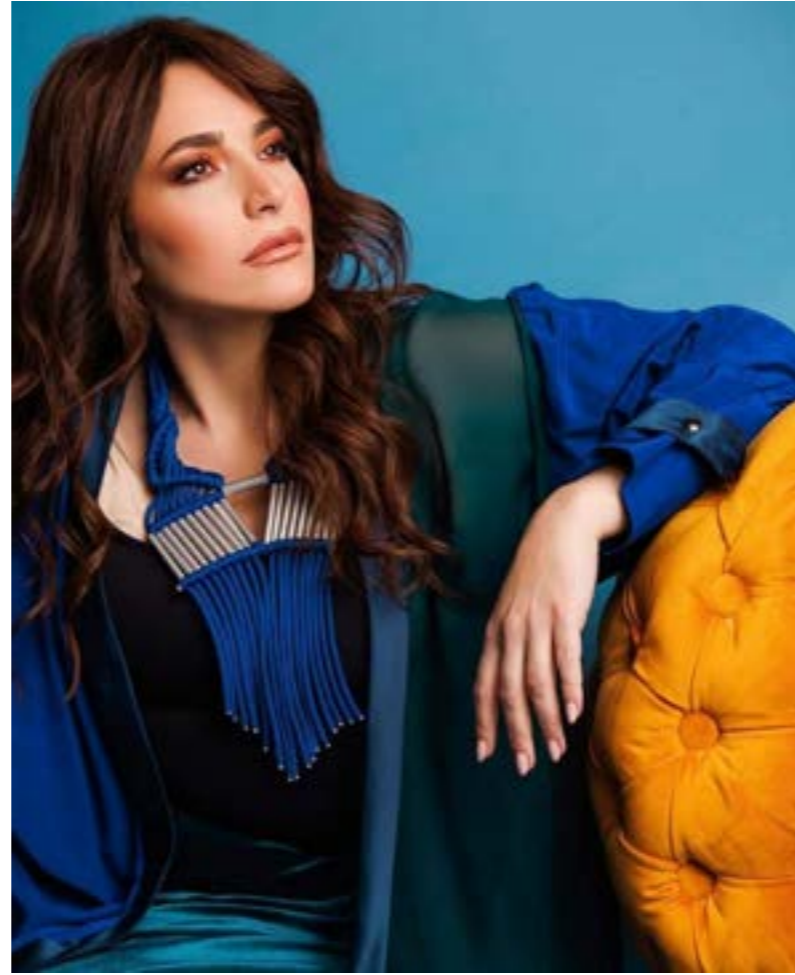
يعتبر صوت عبير نعمة من الاجمل في لبنان والشرق الأوسط

وقامت بأولى خطواتها في عالم الموسيقى، لدراسة الهندسة المعمارية والعلوم في برلين. وهناك، تابعت في الوقت عينه دراساتها الموسيقية في الغناء الأوبرالي التي ترغى في استخدامها للتواصل مع الناس وتجعلهم يحبّونه ويصفون إليه من جانب مختلف كما صرّحت في إحدى المقابلات ففي داخلها ليست المرة الأولى التي تقدّم هذه التحية، إذ اختيرت للمشاركة في إطار معرض «ديفا» الذي نظّمه «معهد العالم العربي» في باريس عام 2021 حيث أدت مجموعة من الأغنيات تعود إلى سيدات الغناء العربيات اللواتي اعتبرت أنهن ساهمن في مسيرتها الفنية وفي طريقة غنائها ووقوفها على المسرح، بعيداً من الغناء الأوبرالي ومتطاباته المختلفة. الفنانة المصرية الأصل غادرت الإسكندرية حيث ولدت وترعرعت