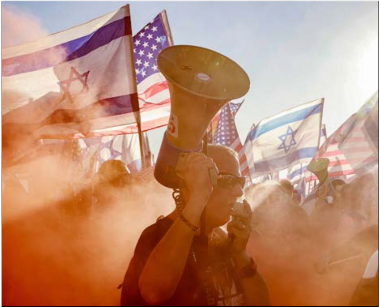
لا بدو ان هاجس «الحرب الأهلية، غادر المنطومة الأمنية الإسرائيلية (ف ف)

فعل على العوائق التي يضعها معارضو الحكومة في الشوارع الرئيسية. ومن هنا، يقدر ضابط كبير في الشرطة أن الأمور «ستزداد سوءاً وعنفًا»، مؤكداً «أننا لن نسح بإغلاق الكيبوتسات. لقد بدأنا عن كتب منشورات نشطاء اليمين على الشبكات الاجتماعية؛ حيث يتحضر هؤلاء للنزول إلى الميدان، وإغلاق مداخل «الكيبوتسات» كرد