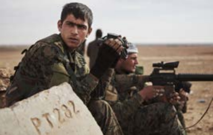
بحث قسد، أيضاً محاولة إعادة نشيط الحوار الكردي - الكردي (ف ف)

عسكري على الأرض، منطلقاً من قبل «قسد» على خلاف «الائتلاف» الذي يشكل وأجهة للصفائل المنتشرة في الشمال السوري. وبينما ترى «قسد» أن من شأن ذلك الاختيار، في حال تجاوز لأسباب تتعلق بقرار «قسد» المرتهن «هيئة» ذات حضور سياسي وميداني، تتصاعد الشكوك حول نجاح التجربة، لتتعلق بتعليق شهاب «قسد» المرتهن لوانسطن، واستحواض «حزب الاتحاد الديمقراطي» على السلطة في مناطق «الإدارة الذاتية». وإلى جانب محاولة تشكيل «جبهة معارضة» تنخرط فيها «قسد»، بدأت الأخيرة محاولة إعادة تنشيط الحوار الكردي - الكردي، بين حزب «الاتحاد الديمقراطي»، و«المجلس الوطني» المدعوم من إقليم كردستان في العراق. وفي هذا الإطار، أعلن قائد «قسد»، مخلوم عبيد، بشكل صريح، خلال حديث أدلى به أخيراً، استعداده لاستكمال الحوار مع «المجلس الوطني» و«تأجيل العقبات أمام الخروج بتوافق»، وفق تعبيره.