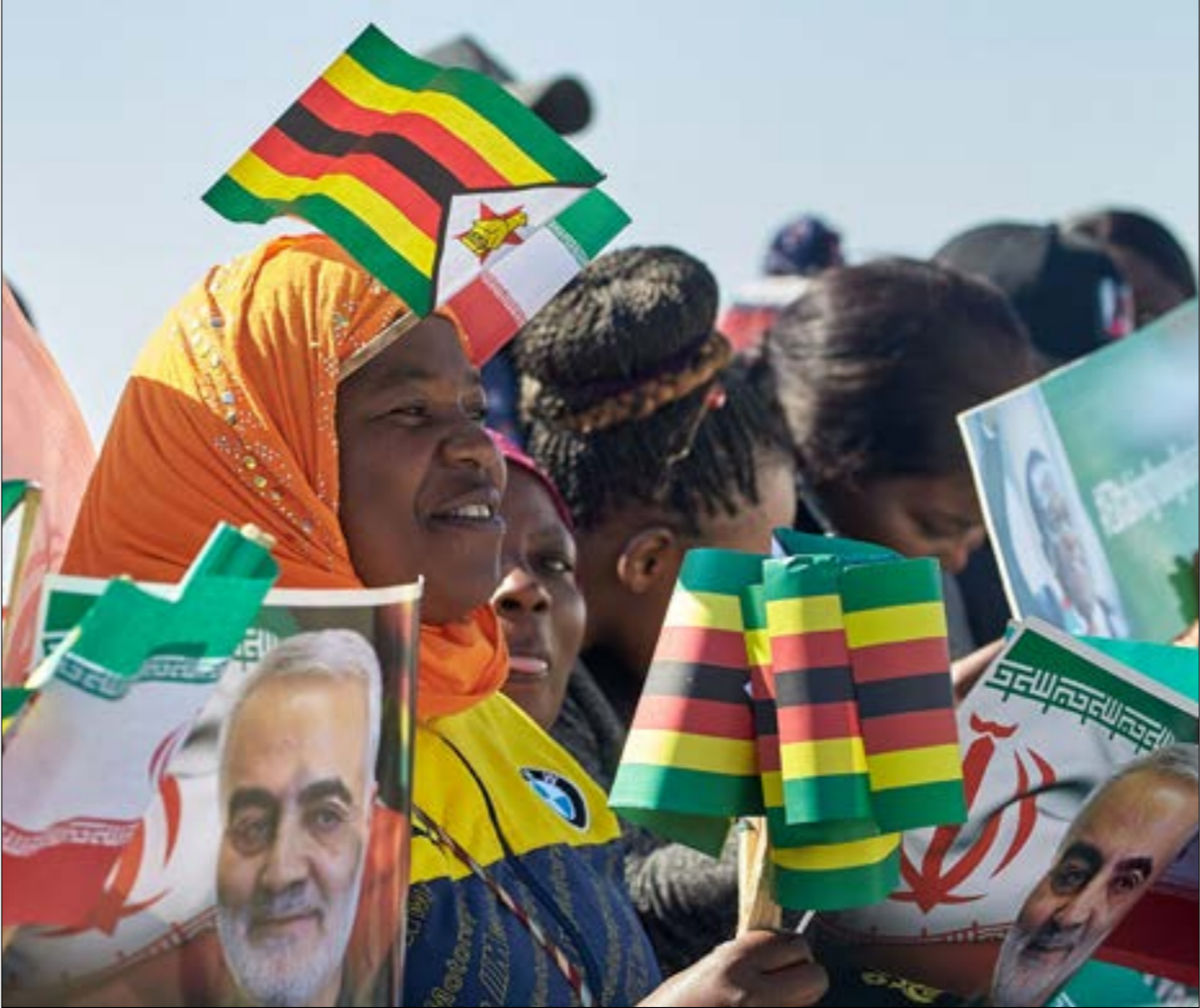
الرئيس يريسي في مطار «هورت غابريك موغابى الدولي» في هراري عاصمة زيمبابوي

مرتبات عناصر تلك القوات، وهو ما أدّى إلى انقطاع التيار الكهربائي في عدن بشكل كامل، في ظلّ ارتفاع الحرارة إلى ما يقارب الأربعين درجة مئوية. كما تسبّبت «معركة الخدمات» هذه بوصول سعر صرف الدولار، إلى 1500 ريال، علماً أنّه قبل أربعة أسابيع فقط كان شبه مستقر عند حدود 1200 ريال، الأمر الذي أدّى بدوره إلى ارتفاع الأسعار. دفع كلّ ذلك مجتمعاً المواطنين إلى الخروج إلى الشوارع، وقطع الطرقات عبر المطالبة برحيله، وخصوصاً أنّ غير أنّه خلافاً لمزّات سابقة، يبدو هذه المرة ووضّحاً حرص الأطراف المتصارعة على عدم استئثار التظاهرات بشكل معن، بعدما اعتاد «الانتقالي» سابقاً تسخير أيّ موجة غضب لصالح مخطّط إسقاط الحكومة، فيما دابت الأخيرة على استغلالها لتحصيل «الانتقالي» مسؤوليّة الترتي الحاصل، وتوجيه