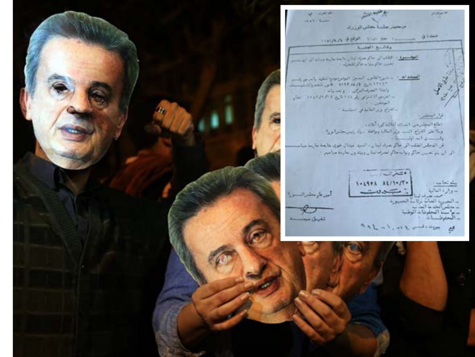
ميشال الخوري في حفل تنصيبه كحاكم لبنان.

الوصول إلى يوم تغسل فيه الطبقة السياسيّة ديها منه كما فعل بعضها من قبل عندما غسلوا أيديهم من دمشق وارتكاباتهم في الحقبية السورية بكل ما انطوت عليه من إثراء وإهدار مال عام ومناصب. يبدو ذلك كله أيضاً من الماضي. إلى أن يرجل الرجل أخيراً لا تزال المرحلة التالية غامضة. نوابه الأربعة الحاليون هدّوا بالاستقالة ما لم تُطلق أيديهم في إدارة السياسة التقديرة في المرحلة المقبلة بما في