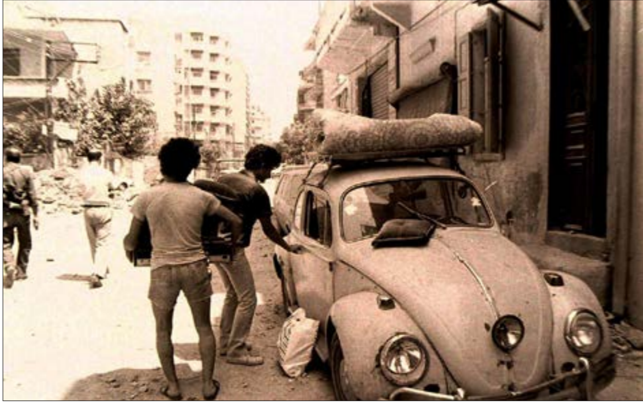
المرّوب إلى أين؟ كل المناطق تحت النّار