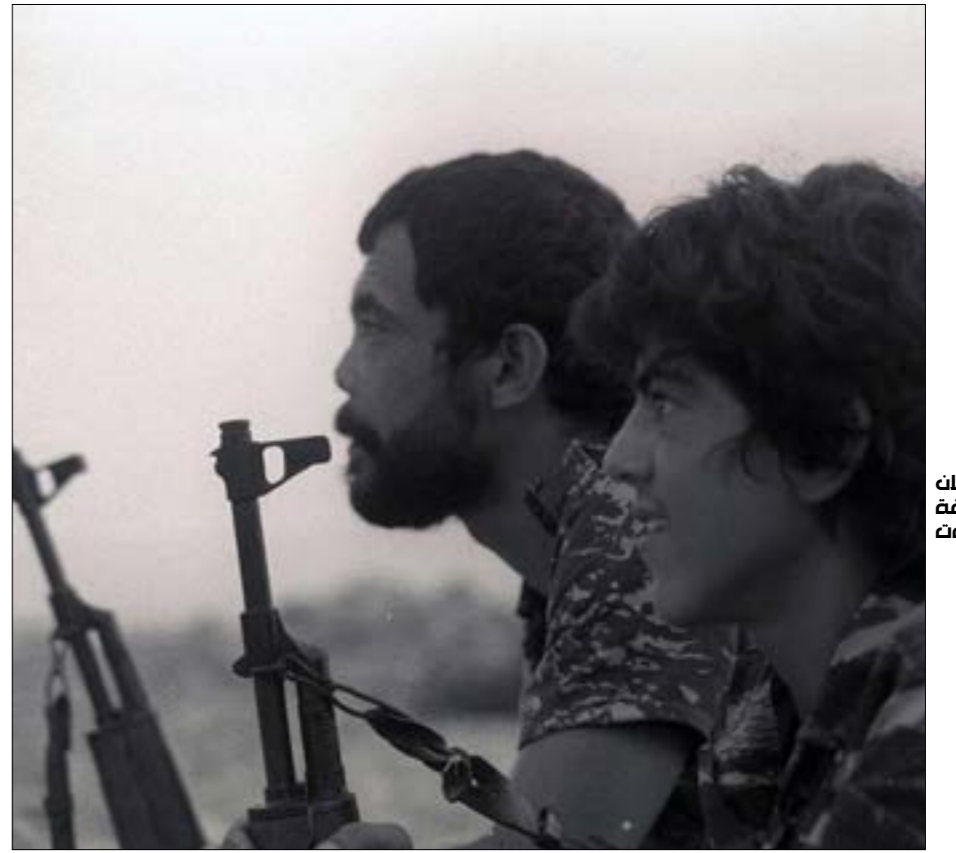
مقاتلون في منطقة مطار بيروت