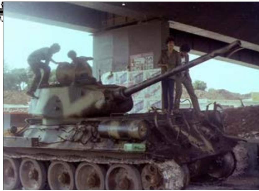
دبابة فلسطينية تحت جسر المطار