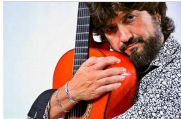
خوات غوميز المعروف بـ «تشيكوبلو»

كثيرة تنفد أيضاً تذاكرها بسرعة، وهذا دليل على شعبيته خارج بلاده كذلك. عن أسلوبه الموسيقي، قال مانوكيان سابقاً في إحدى مقابلاتنا معه: «أصولي أرمينية وتربيتي عربية وغربية، فابتكرت نوعاً من الموسيقى الجديدة الخاصة بي». بدأ الفنان مسيرته