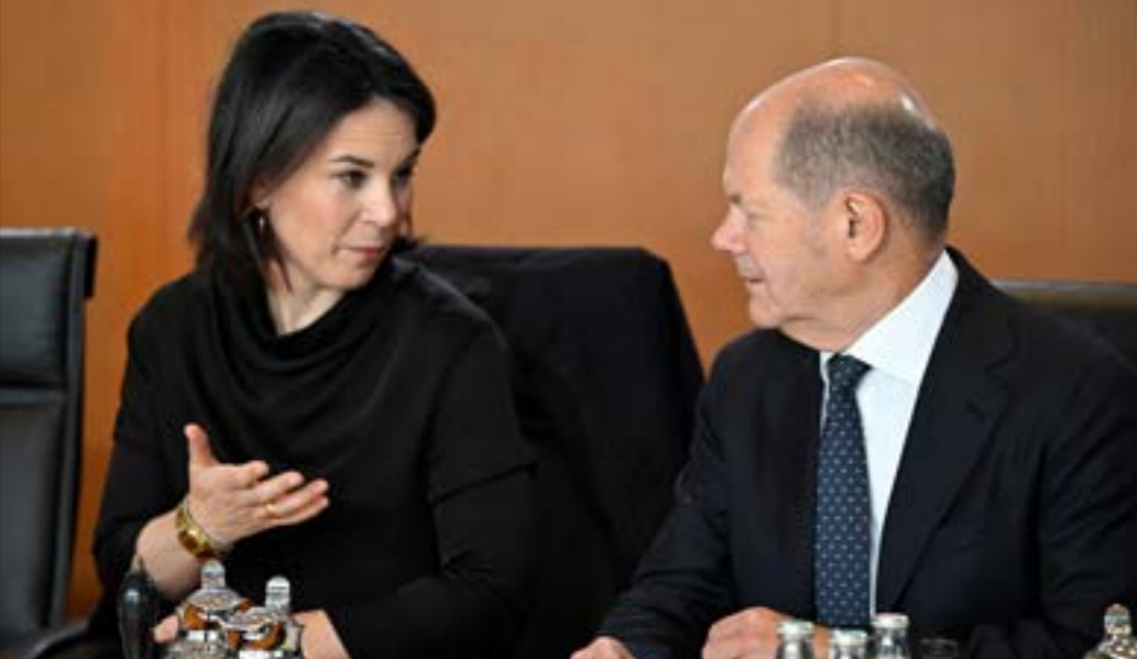
الوليقة جاءت لمرّة نقاشات مستفيضة استمرت لاسهر عدة داخل الحكومة التي يتنازعها تياران

في وقتٍ مضى، فإنّ الصين، التي تتنافس على حصة أكبر من السوق الأوروبية وحده. وفي ما بدا تردداً لـ«الساوالم» الأميركية، اتهمت الوثيقة الصين بـ«السعي إلى خلق تبعات اقتصادية وتكنولوجية بهدف استخدامها لتحقيق أهدافها ومصالحها السياسية»، وحثت الشركات ومصالح الأعمال الألمانية على أخذ المخاطر الجيوبسياسية في الحسبان في عمليات صنع القرار «حتى لا تُضطرّ إلى الاستعانة بالأموال العامة عند حدوث أزمة جيوسياسية». كما تناولت ما سنّتها «عدوانية الصين خارجياً، والاستجداء المتزايد فيها داخلياً،