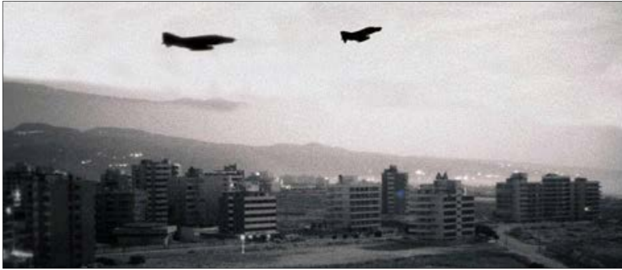
الطائرات الإسرائيلية في سماء بيروت