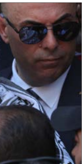
شكّلت زيارة عباس لمحديقة جنب خطونه الوله في مخظ السيطره على المحدينة

«يوم مقاومة الديكتاتورية» في نهاية آذار الماضي، وإعلان طناري الاحتياط توقفهم عن الخدمة آنذاك، ويعكس هذا الموقف رغبة نتنياهو في الاستمرار في حكته من دون إثـة نية لتحديـلها أو تجديدها، وخصوصاً أنه اعترض، في الجلسة المغلقة نفسها، أن «ثقة معنى واحداً لوقف التشريعات، وهو أنه لن تكون هناك جدوى من وجود سلطة تنفيذية، لأنها لن تتكهن من فعل شيء (من دون التشريعات)». ما نقله سيغال عن نتنياهو