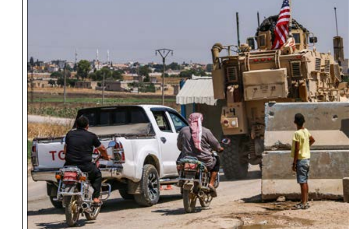
كانت دمشق قد قبلت على مضض، في عام 2019، الحوار مع واشنطن عبر وسيط