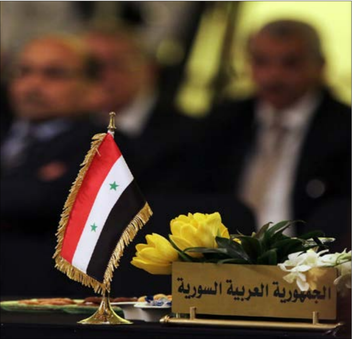
أبلغ دبلوماسيون اميركيون، دولاً عربية، اعتراض واشنطن على أي تقاربه مع سوريا

أذار من العام الجاري، مع عدد من الحكومات العربية في المنطقة، وسلّمتها دعوة إلى اجتماع بعيد عن الأضواء في عُمان في 21 آذار 2023، على أن يُعقد على مستوى المبعوثين الخاصين حول سوريا.