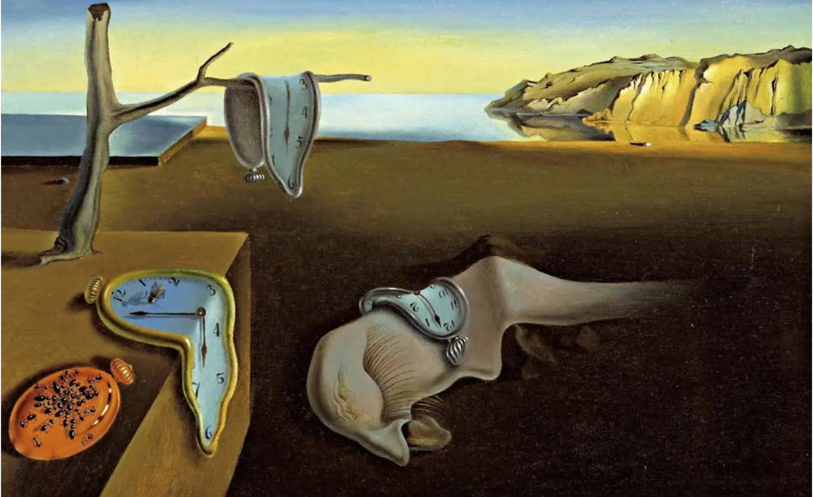
سلفادور دالي، «الذاكرة» (1931)

على رغم انضمام سياسيين ورجال دين إلى الحملة الطائفية، إلا أنّ التأثير الأكبر كان للإعلام وخصوصاً LBCI و mtv و OTV ويشكل أقل «الجديد». هؤلاء ضخموا أصراً لم يكترث له أحد بدايةً، إذ اقتصر الانتقادات الأولية على المصاعب التقنية في عدم تغيير التوقيت، وأعلاماً حدة لم يتعدّ الحد السياسي وشجب كيفية اتخاذ شخصين قراراً بحجم بلد بعشوائية ومن دون الرجوع إلى أحد. القنوات المذكورة أخذت على عاتقها إخراج «الدراما» وتحفيز المزاج الانتقاسي المغتب ولو أدعت أنّ هدفها عكس ذلك، إذ أعلنت عدم الالتزام بالقرار والتحوّل إلى التوقيت الصيفي، كل على طريقها. أول من تصدّر المشهد كان LBCI و mtv اللتان أعلنتا عدم الالتزام بقرار بري/ ميقاتي وربطتا الموضوع بمخالف «التوقيت العالمي» و«عزل لبنان» و«رجاعه سنوات إلى الوراء»، حجج طيّتها بلهجة فوقية تحمل في طياتها شعوراً بالدونية للغرب وتجييل «الرجل الأبيض». على سبيل المثال، حرصت mtv أن تشبه الأمر بـ«خروج لبنان من المجتمع الدولي»، أو LBCI التي سألت «هل تعرفون ما هي العوامة؟»، هكذا، على مدى يومين متتاليين، خصصت كل من القنواتين مقدّمة الإخبارية كاملة فقط للحديث عن الموضوع بطريقة اظهرتها كأنهما منفصلتان عن الواقع ولا تتحرثان