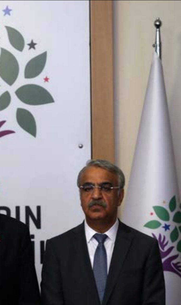
تعطيه استطلاعات الرّاي إينجه من 3 إلى 76 من الأصوات من حصّة المعارضة (أ ف ب)

استمرت الاحتجاجات في فرنسا خلال عطلة نهاية الأسبوع، وهي وإنّ بدت أصغر حجماً مقارنة بما شهده يوم الخميس الماضي، حين نفّذت النقابات العمالية برنامجاً وطنياً واسعاً من التظاهرات والإضرابات، إلّا أنها بدت أكثر ميلاً إله العنف، وولادة مزيد من فرص الصدام مع السلطات، التي تخشى الآن تحوّلها إله حملة «سترات صفراء» جديدة، مشابهة لتلك التي انطلقت عام 2018، وتمتّخت من إجبار الحكومة على