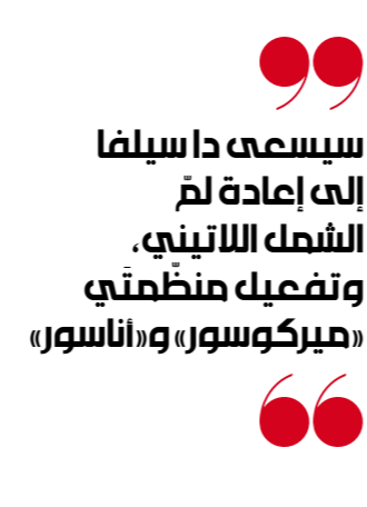
سيلف دا سيلفا

يُعتبر «عملاً مشبوها»، وعليه، دعا الحزب إلى «محاسبة كل المؤرّظين، وإزالة الاعتصامات الثابتة من أمام التكنات العسكرية في معظم الولايات البرازيلية». هكذا، تمكّن دا سيلفا من تحطّي الامتحان الثاني خلال بضعة أيام فقط من تقلّده المنصب الرئاسي. وكان الزعيم «العفّالي» اصّر على استسلامه الوشاح الرئاسي من عاملة نظافة وعدد من الممثلين عن القطاعات الشعبية، في ردّ قاس على تخيّب بولسنارو وتمنّعه عن