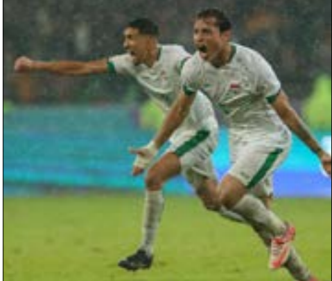
تصدر المرءف المجموعة برصد 4 نقاط

فريق فوّت في الامتار الأخيرة فرصة التواجد في دائرة الكبار!