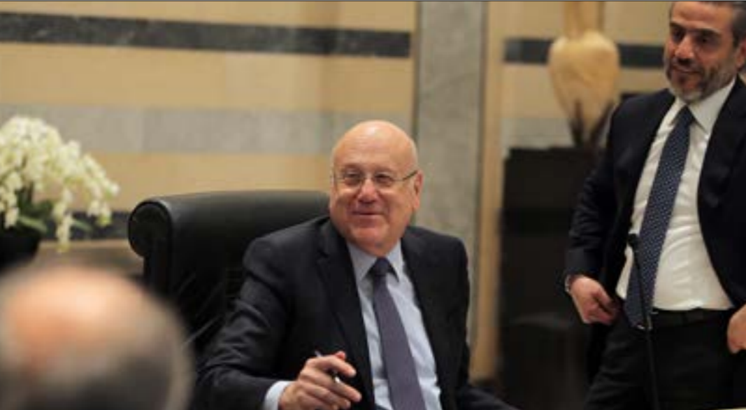
لا جلسة لمجلس الوزراء لا يوافق حزب الله سلفا على جدول اعمالها (هيلم الموسوي)

“ الخلاف على المفتشية قد يتكرر مع إحالة مدير عام الإدارة في الجيش إلى التقاعد الشهر المقبل