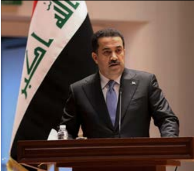
لقاءات السفارة الأميركية مع مسؤولين عراقيين تليز جدلاً واسعاً

■ المقاربة الجيوسياسية للوضع الدولي تُفرض نفسها مجدداً مع انفجار النزاع المسلّم في أوكرانيا، والذي سبقته إشارات متكررة في وثائق الأمن القومي والدفاع الوطني الصادرة عن إدارتين أميركيّتين متعاقبتين إلى صعود الدور الدولي للمنافسين الاستراتيجيين، تعبّرون من جهتك، أن مثل هذه المقاربة تتعاضد عن عوامل أخرى اجتماعية وسياسية وثقافية تُسهم بشكل حاسم في إعادة تشكيل المشهد السياسي العالمي، ما هي هذه العوامل، وإلى أيّ مدى تبطل صوابية المقاربة الجيوسياسية؟