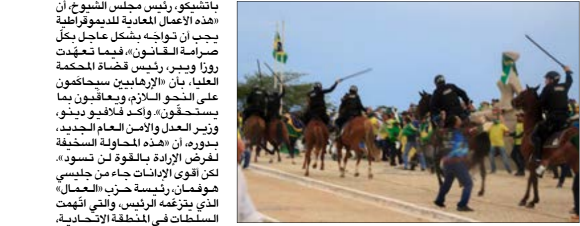
تكشف حادثة الاقتحام حجم التحديّات التي يواجهها الرئيس اليساري (أ ف ب)

باتشيكو، رئيس مجلس الشيوخ، أن «هذه الأعمال المعادية للديموقراطية يجب أن تواجه بشكل عاجل بكل صرامة القانون»، فيما تعدّدت روزا ويدر، رئيس قضاة المحكمة العليا، بأن «الإرهابيين سيحاكمون على النحو اللازم، ويعاقبون بما يستحقّون»، واكد فلافيو دينو، وزير العدل والأمن العام الجديد، بدوره، أن «هذه المحاولة السخيفة لفرّض الإرادة بالقوة لن تسود»، لكن أقوى الإذانات جاء من مجلسي هوفمان، رئيسة حزب والجيش الذي يتزعمه الرئيس، والتي أُتمّعت السلطات في المنطقة الانحاضية، وتحديددا المحافظ ونائبه لشؤون الأمن، بالقتل في اتّخاذ الإجراءات اللازمة لتأمين المقرّات الحكومية بينما كانت تعلم بحضور الألاف من «بولسونارويين» بالانصات إلى المنطقة كذلك، دا سيلفا الذي أظهر، أقلّه في تشكيل فرقة الحكومي، عزّمه على قبول التحدي. ويضم هذا الفريق خمسة من البرازيليين الوصف، ووزيرين من السكّان الأصليين، في تحديان تام مع الإدارة السابقة، التي كان يهيمن عليها رجال بيض وجنرالات الجيش. كما تجاهل الرئيس ضغوطات اليسار خلال الأيام الماضية وتكشفت حادثة الاقحام حجم التحديّات التي يواجهها الرئيس اليساري، بعد أن نجح سلفه الشّعبي في بناء حركة سياسية