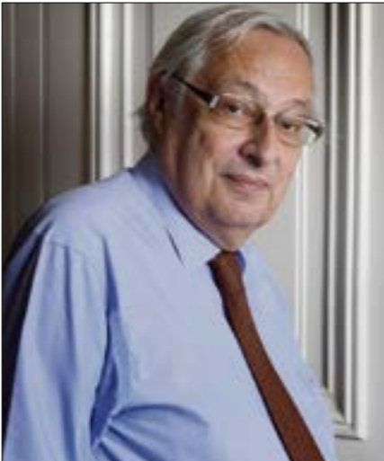
الحديث عن عودة الحرب الباردة ومعسكراتها هو خطأ جسيم (من الوبعد)

■ لا أعتقد ذلك، «الناتو» ليس قطعياً، وبين أطرافه تناقضات عديدة، منظور بولندا ودول البلطيق للوضع الدولي مخالف جداً لذلك المصراك بالمانيا وفرنسا والسبانيا مثلاً، وبوتين مدرك أن المكاسب التي سيحقيها من «التواطؤ المتقلّب» مع دول «البركس» أو مع السعودية وبلدان الخليج همّ بكثير من تلك التي سيحقّقها إذا شرع بإنشاء «حلف وارسو»، جديد، لن يرضّع عدداً كبيراً من الدول بكلّ تأكيد، إذا استثنينا بيلاروسيا وكوريا الشمالية وربما سوريا، بوتين لم ينتصر عسكرياً، لكنه حقّق نجاحات فعلية دبلوماسية، احتفاءت بعلاقات وثيقة مع دول مهمة، مثل الصين والهند وحتى باكستان، الهادية منذ نشأتها لسوفيّات وروسيا، والحليفة التاريخية للغرب، هو استطاع أيضاً توسيع دائرته نفوذه في أفريقيا، الطرف الذي تأخّر عن ركوب قطار هذا النمط الجديد من الدبلوماسية الشديدة السيولة، هو الغرب.