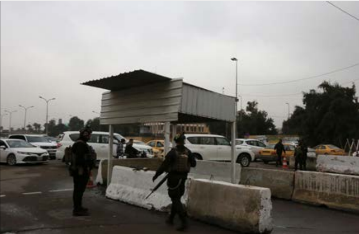
قوه «التنسيقي»، تلوح بسحب الثقة من حكومة السوداني إن استمرّ في التقرّب من الأميركيين

ضغط تجلّت حديثاً في تقنين الدوائر في السوق العراقية، من خلال معاقبة بشوك عديدة، ما أدى إلى انخفاض قيمة الدينار، وكذلك في تحريك مجموعات «داعش» التي شنت سلسلة هجمات أدت إلى سقوط قتلى بين أفراد القوى الأمنية، ولا سيما في كركوك، وصولاً إلى التلويح بتحريك الشارع من بوابة المطالب الحياتية، أو من بوابة الصراعات السياسية التي لا يزال العراق يشكّل أرضاً خصبة لها، وعليه، بدأت تلوح أسئلة حول ما إن كانت هذه الحكومة ستتمكن من إكمال ولايتها، أو حتى ما إن كانت ستمتدّع لمدة السنة التي وعدت بان تجري خلالها انتخابات برلمانية مبكرة، ولا سيما أنها على وشك الإخلال بأول وعودها، وهو إعداد قانون انتخابي جديد في الأشهر الثلاثة الأولى من عمرها، ويقف «التيار الصدري»، الذي كان قد رحمن سكوته عن تشكيل الحكومة بإجراء تلك الانتخابات، بالمرصاد، لاستنفاد تحركاته في الشارع في حال فشل السوداني في الوفاء بهذا التعهد، وعلى الرغم من أن الخلافات تدور منذ أسابيع، حيث يأخذ «التنسيقي» على السوداني تغزّده بالقرارات، خلافاً لوعده بالفتشور مع قواه في التعيينات الأساسية، إلا أن ظهورها إلى العلن تزامن مع إحياء الذكرى الثالثة لإغتيال الشهيدين قاسم سلیماني وأبي مهدي المهندس، والتي اتّخذها أطراف «التنسيقي»، ولا سيما منها المرتبطون بـ«الحشد الشعبي» وفصائل المقاومة، مناسبة لتجديد الدعوة إلى طرده ما تبقى من القوّات الأميركية في العراق، في ما بدأ رسالة تحذيرية ضمنية إلى السوداني من الذهاب بعيداً في الاستجابة للمطالب الأميركية، أيضاً، صنّعت الفصائل هجومها على السوداني انتقادات لتقاربه مع