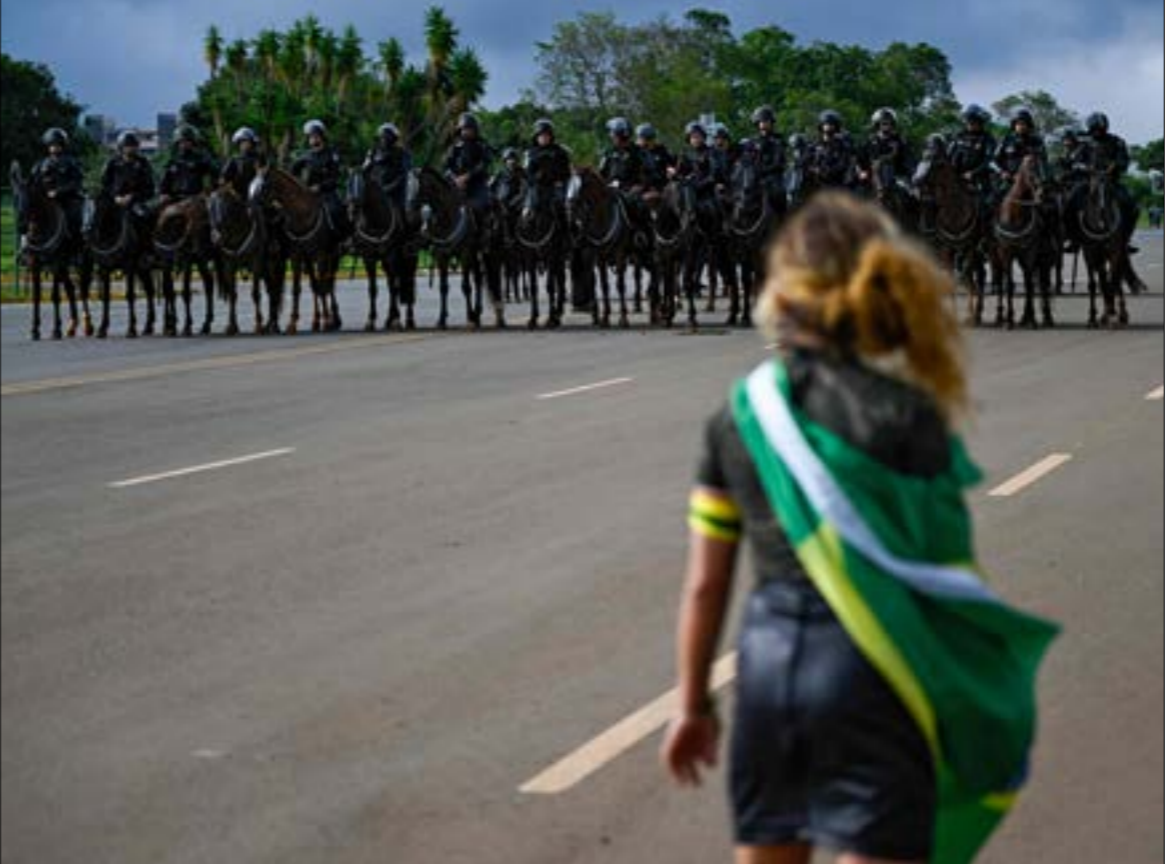
جاءت «غزوة برازيليا، لتعزّز موقف دا سيلفا الذي ظهر كزعيم وطني تلقّف حوله معظم الفصائل السياسية والشمعية

الأيام الأخيرة، بل هو مسار بدأه الرئيس السابق ونجابه منذ أشهر، بعد التهديد بدخول المحكمة العليا وتعطيل البرلمان والكونغرس. كما جاء الصمت «بولسناري» على كل الاحتجاجات وقطع الطرقات العامة، كإشارات تأييد، أخرها التزام السكون مدة سبع ساعات إثر «غزوة برازيليا»، أي بعد انتهاء مفعول الاقتحام، وأففضاح فشل المشروع الانقلابي، تحريبا لبولسنارو بعملية الاقتحام التي انتهت باعتقال مئات المؤرّظين، بالغالطات، بدأ عديم القيمة» في المحضلة، جاءت «غزوة برازيليا»