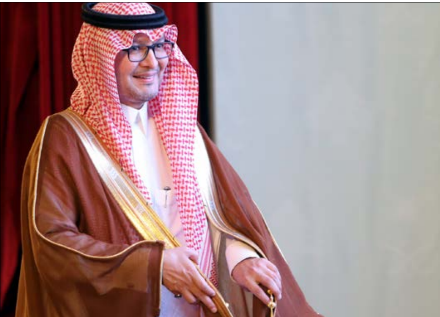
متر السعوديون عن استيائهم لاستقبال الدوحة لمسؤولين لبنانيين ومحاوله تسوية بعض الاسماء الرئاسية (هيلم الموسوي)

عدا عن ذلك فإنّ «المملكة لا تزال عند موقفها في ما يتعلق بالية التعامل مع الأزمة والمحصورة بالصندوق الفرنسي - السعودي لدعم الأمن الغذائي والقطاع الصحي والمساعدات وكيفية توزيعها». ولا تقتصر السياسة التي تسلكها الرياض على رفض «التعاون» بل تذهب أكثر من ذلك في الاعتراض على أي دور تقوم به دول عربية وخليجية إذ كشفت مصادر سياسية بارزة أنّ «المسؤولين الفرنسيين سمعوا من المسؤولين السعوديين موقفاً سلبياً من الدور القطري في