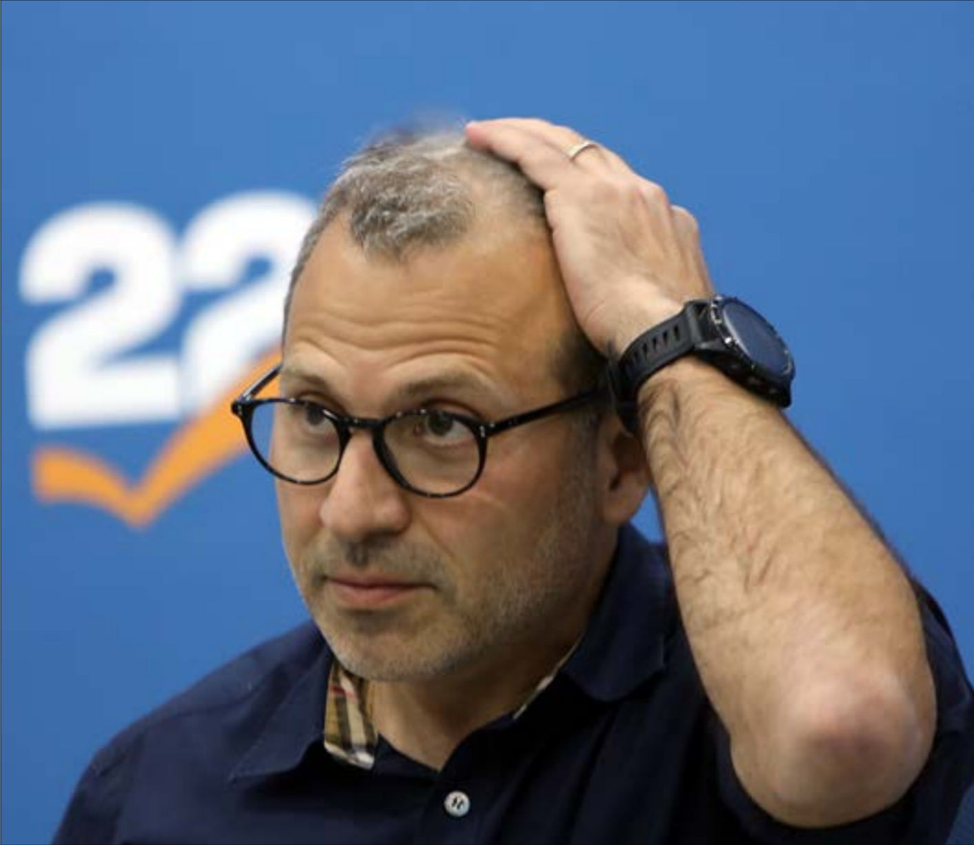
حزنه الله الحك بما تفعلنا عليه قبل الشفور، الوزراء، 24 يومعون المراسيم والقرارات (مهلب الموسوي)

أما المعطيات المنبئة بالشرح فتمتن في الآتي: تلقف باسيل رسالة الجلسة الأخيرة لمجلس الوزراء وفهمه المقصود منها، وهو أن رئيس حكومة تصريف الأعمال يريد أن يحكم بالاستغناء عن وزراء التيار، وفسر الختام حكومته بأن المتفق عليه سابقاً