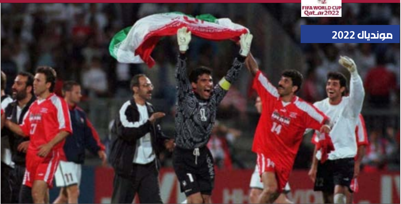
FIFA WORLD CUP Qatar 2022 موندiale 2022