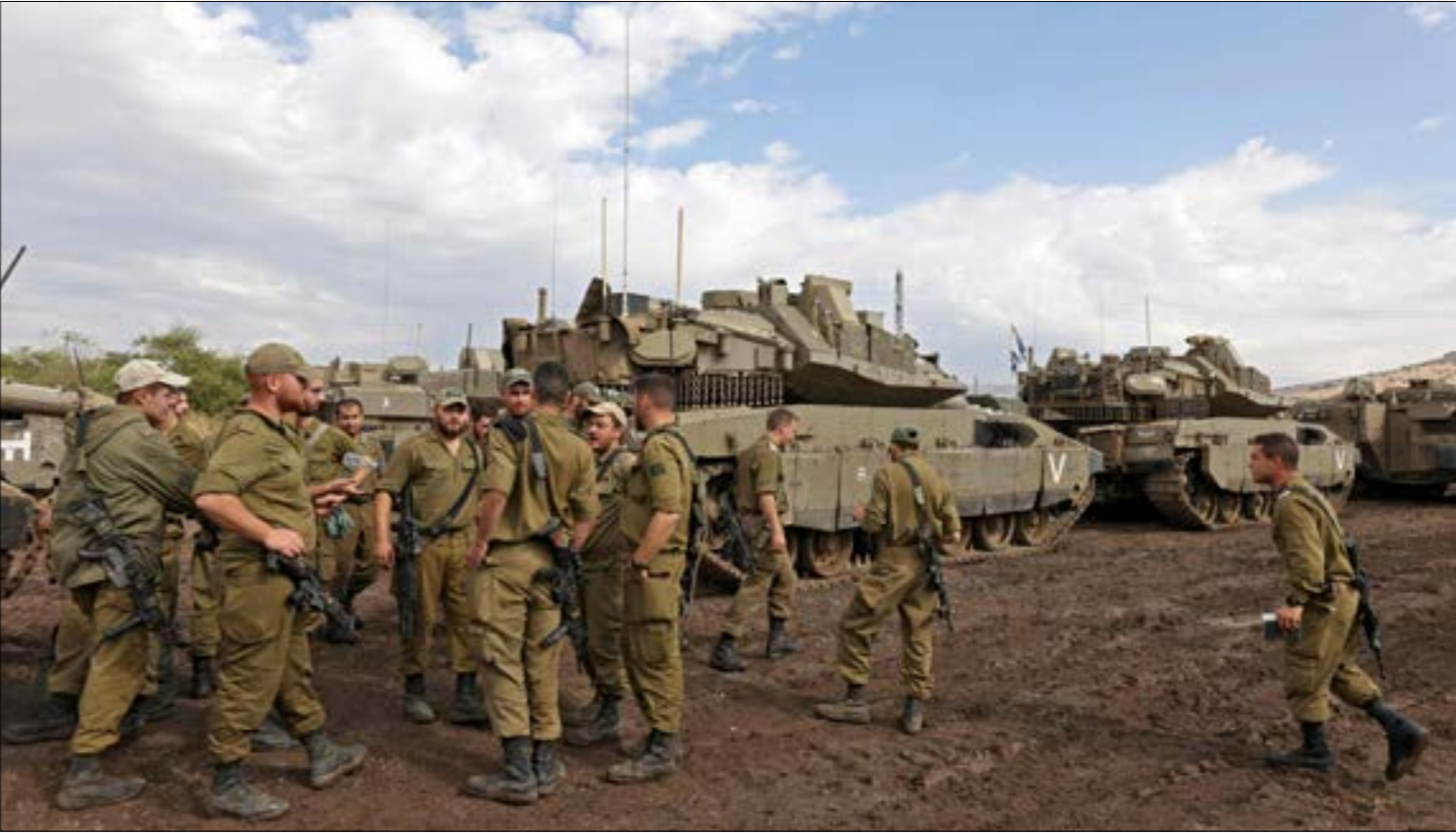
تركت عملية «الناقلة العميقة»، مفاعيلها في وعي الجيش الإسرائيلي

الإسرائيلية بقافلة مكوّنة من دبّابتيّتين وناقلتيّ جند، بدأت كتابته عندما أصيبت الناقلة الإمامية التي تحمل تسعة جنود بخلل فني، استغلّه المقاومون لاستهدافها بعدد كبير من الصواريخ المضادة للدروع، ما تسبّب