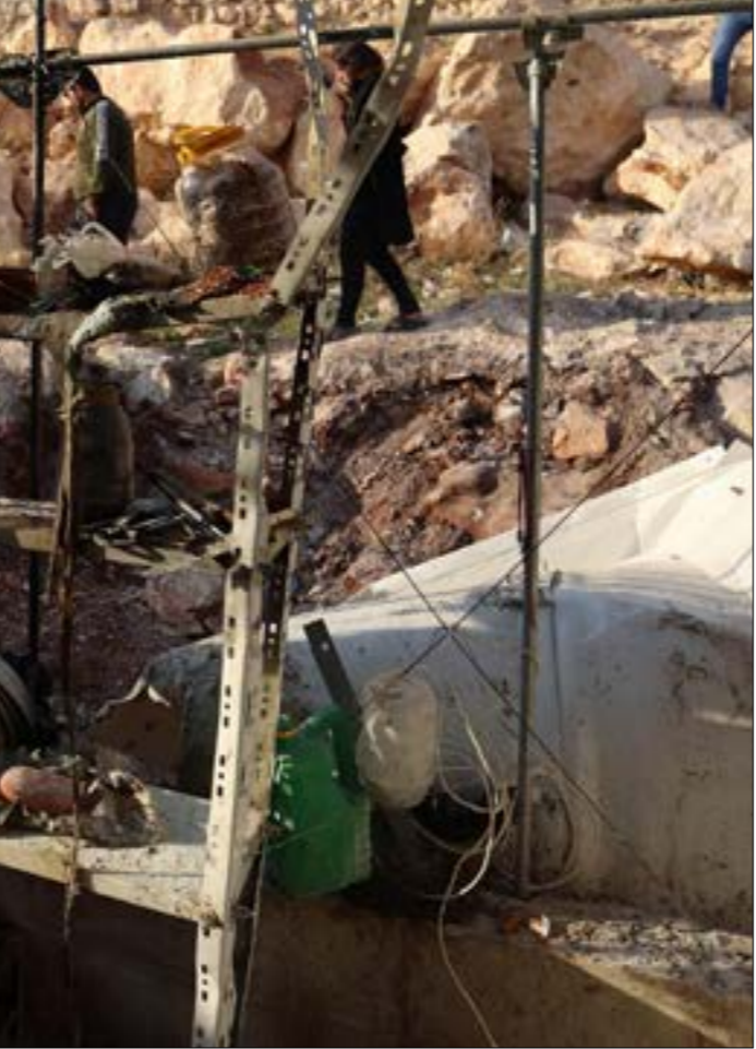
تصير قضية اللاجئين مركزية بالنسبة لروسيا التي ترعى مسار أستانا (أ ف ب)

والذي يشارك فيه الأردن بصفة مراقب إلى جانب لبنان والعراق، لتفوّج المساعي الروسية التي حاولت وجود عرقلتها بثنّى الطرق خلال الشهر السنّة الماضية. وفي حال جرى التوصل إلى اتفاقات واضحة في هذا المقرّر يومي الـ22 و الـ23 من الشهر