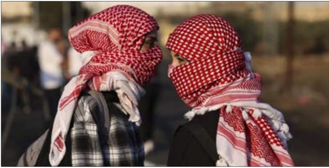
تحذّر «الشاباك» من إحباط عملية مدالية كبيرة خطّطت لتنفيذها 3 قتيل في نابلس (ف ب)

على رغم العمليات التي نفّذها العدو اخيراً ضدّ المجموعات المقاومة الناشئة في الضفة، ألا ان هذه المجموعات لا تقا تلمعت بموشرات في شأن استمرارها وحيويتها وفاعليتها. موشرات تجلّبه آخرها، خلال الساعات الماضية، حيث خاضت «كتيبة بلاطة»، اشتباكاً مسلّحاً مع جنود الاحتلال والمستوطنين على خلفية اشتحامهم قبر يوسف، وإذ تُبّر الكتيبة المشار إليها، إلى جانب تشكيلات أخرى من بينها «عشّ الدبابير» في جنيت، قلقاً متزايداً لدى سلطات العدو، فإن عوامك اشتداد فعلك تلك التشكيلات يبدو انها ستكاثر. في ظلّ انتزاح شهية اليمين المتطرف لتصعيد إجراءات التنكيد ضدّ الفلسطينيين، سواء في الضفة أو المسجد الأقصى أو السجون