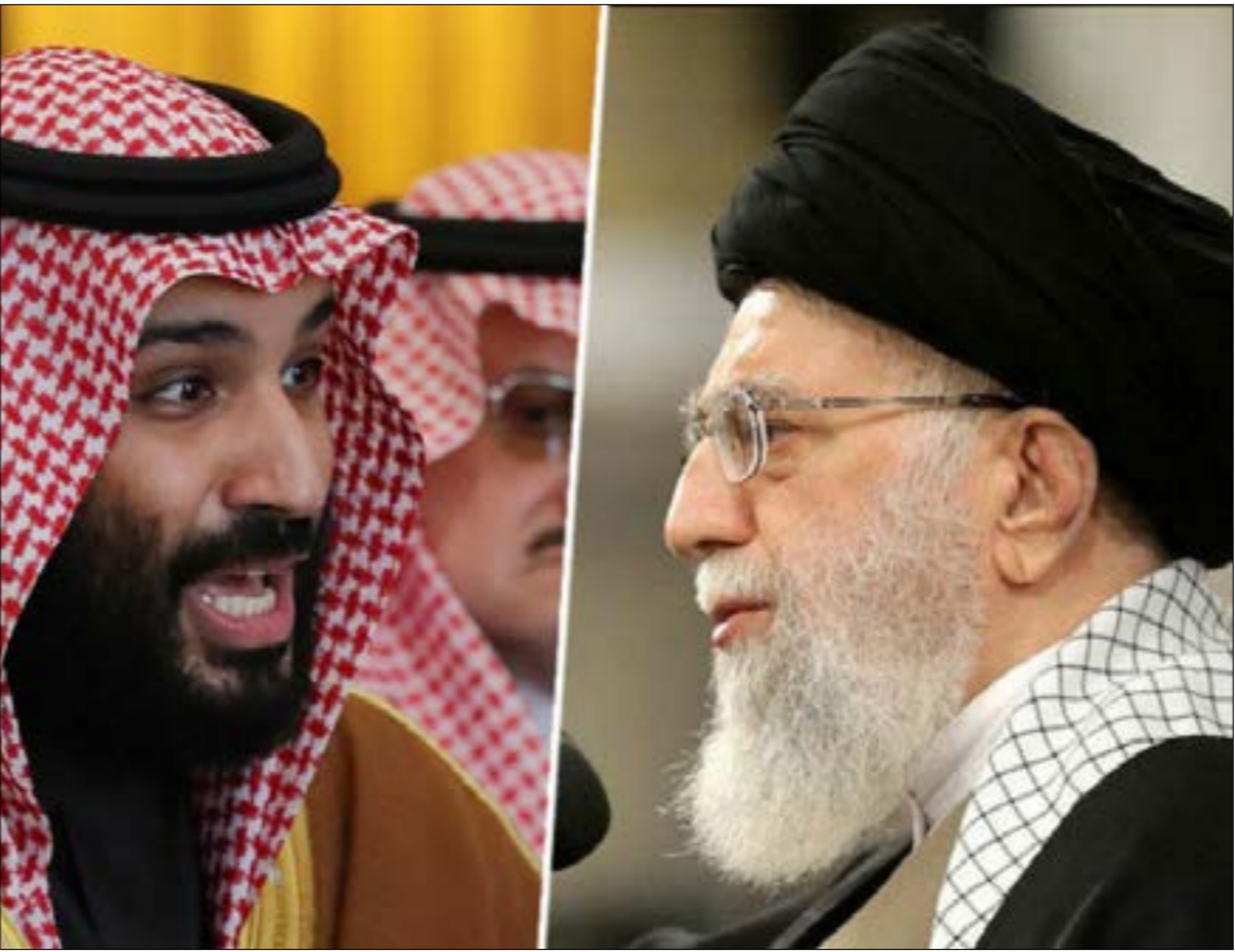
يسود اعتقاد الأوساط الإيرانية بأن واشنطن ستسمح إلى خلف أزمة بين السعودية وإيران