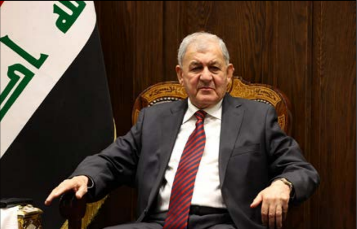
انتخاب عبداللطيف رشيد نهاية انسداد السياسي

فهو يوالى الفاسدين، ويريد هيمنتهم على الوطن والشعب. فالعراق أكبر من السلاح المنفلت». والحلّ العراقي، كان حلاً كردياً أيضاً، حيث جاء انتخاب رشيد باتفاق ضمنى غير معلّن بين «الحزب الديموقراطي الكردستاني» والاتحاد الوطني الكردستاني» بعد إصرار الحزب على استبعاد الرئيس المنتهية ولايته، برهم صالح، وقبول الانحسار، ضمناً أيضاً، وساطة الإطّار التنسيقي» التي قضت بأن