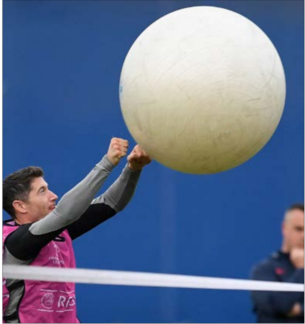
ليفاندوفسكي، محور الكون، في برشلونة حالياً

عندما يكون ريال مدريد وبرشلونة بافضل حالتهما هجومياً، يعني ان العالم سيشهد على مواجهة قوية الى ابعاد الحدود. هذا ما ينتظره الجميع في «كلاسيكو الارض» بعد ظهر الاحد والذي يعيد الى المشاهد تلك الايام التي تناهس فيها الفريق الملكي ونظيره الكاتالوني على الصدارة بشارسة، وهي مسألة نشهدها بقوة في الموسم الجديد