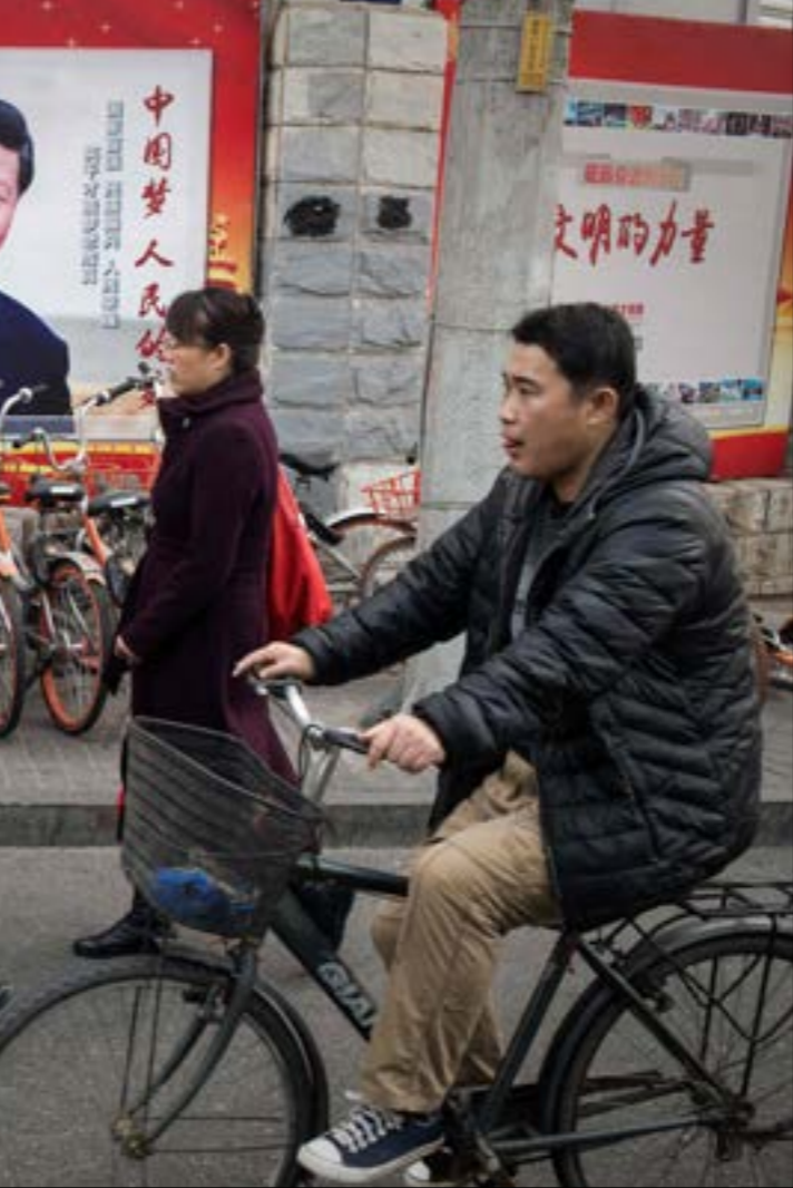
تواجّه الطوموم الصيني تحديات كبيرة، أهمّها ان النموذج الذي تطرحه هو نقيض النموذج الماركسي القائم على الحرب والعنفوالا الاحتكار

منذ المؤتمر الثامن عشر لـ«الحزب الشيوعي» الصيني عام 2012، يزور شي جين بينغ الأرياف الصينية سنوياً، للتحدّث مع الناس والإطلاع على ظروف عيشتهم، مؤكداً، سنة بعد سنة، أنه «خلال مسعى الجمهورية الشعبية الصينية لبناء حياة أفضل، ما من شخص أو عائلة أو إثنية، يجب أن تُترك في الخلف». هي الأرياف نفسها التي خُرّجت شي ونحو 17 مليون شاب صيني، ممّن غادروا منازلهم وأسفّخوا عن حياة تسودها الرفاهية للذهاب إلى الأرياف النائية، حيث بصورة السكان في الكهوف،