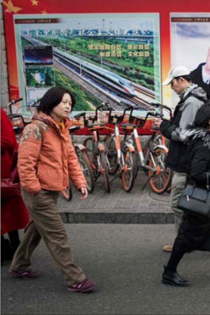
تواجّه الطوموم الصيني تحديات كبيرة، أهمّها ان النموذج الذي تطرحه هو نقيض النموذج الماركسي القائم على الحرب والعنفوالا الاحتكار

يقول لي ان الصين يمكنها نظرياً أن تحدّد من هي الأطراف التي تريد الإنفتاح عليها، ولكن السؤال الأساسي اليوم هو سؤال الحرب والسلم. بمعنى آخر، يحتاج النهج الصيني إلى ان يسود السلامّ العالم، الذي يصفّ اليوم على حافة حرب شاملة. بفعل استماتة الولايات المتحدة في حفظ هيمنتها على النظام العالمي من خلال الآلة الحربية الأميركية وأذرعها المختلفة، وعلى رأس حلف «الناتو»، وعلى الرغم من ذلك، لا يمكن للصين أن تقف منفوّجة إزاء ذلك المخرق التاريخي، بل يتخلّل منها ان تمخّل طرفاً أساسياً في عملية تشكيل النظام العالمي البديل. وفي هذا الإطار، تُظهِر العودة إلى خطابات عدد الدول المنضمّة إليها إلى الثلاث الماضية، أن كلاً منها يكاد لا