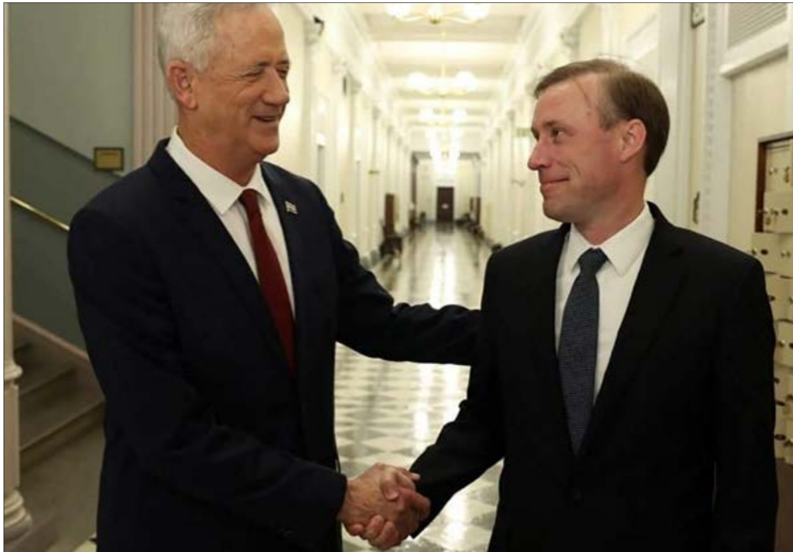
كان وزير الأمن الإسرائيلي بيني غانتس قد التقى اليوم الماضي، مستشار الأمن القومي المصري جايك سوليماني في واشنطن

الذي هاجمها بقوة في الأيام الفائتة (أعلن مساء أمس حدوث الاتصال بالفعل، فيما قال لابيد إنه جرت خلاله مناقشة الجهود المختلفة لمنع إيران من الوصول إلى السلاح النووي)؛ قد تكون الإجابات سهلة وواضحة، لكنّ الأهمّ هو ما لا يجري تداوله، وعنوانه: هل قرار توقيع الاتفاق موجود في واشنطن أم في طهران؟