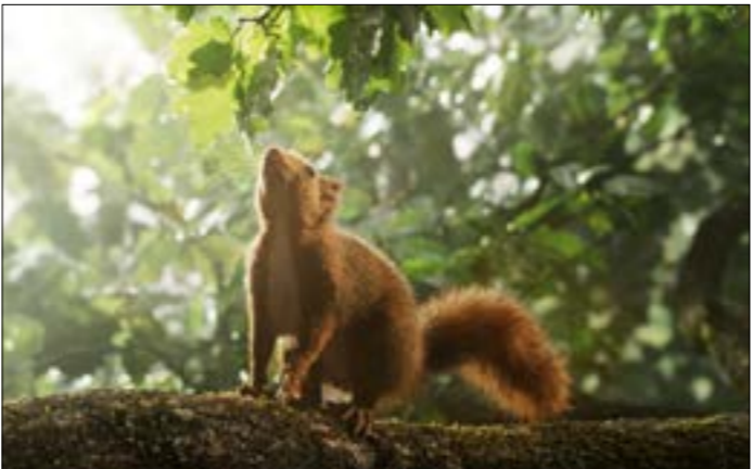
من «الشرة السنديان» لعيشاك سرجو ولوران شاربونيه

كما في يسري في الدورة الماضية، يخصص «ريف 2022» نهاية أسبوع كاملة في 1 و2 تشرين الأول (أكتوبر) لاكتشاف منطقة راشيا هذه المرة. بالشراكة مع جمعية السياحة البيئية «راشيا آند بيوند» مع مناقشات حول قضايا بيئية مشتركة وعرض أفلام في الهواء الطلق واحتفال بيوم الدبس، وهو يوم مخصص للمشي في الطبيعة وتدقّق الدبس تنظمه الجمعية منذ عام 2016.