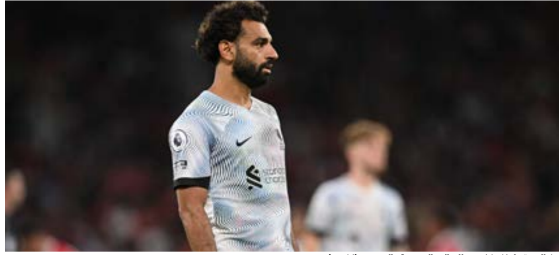
من المحتمل أن ينضم صلاح إلى المعسكر المصري