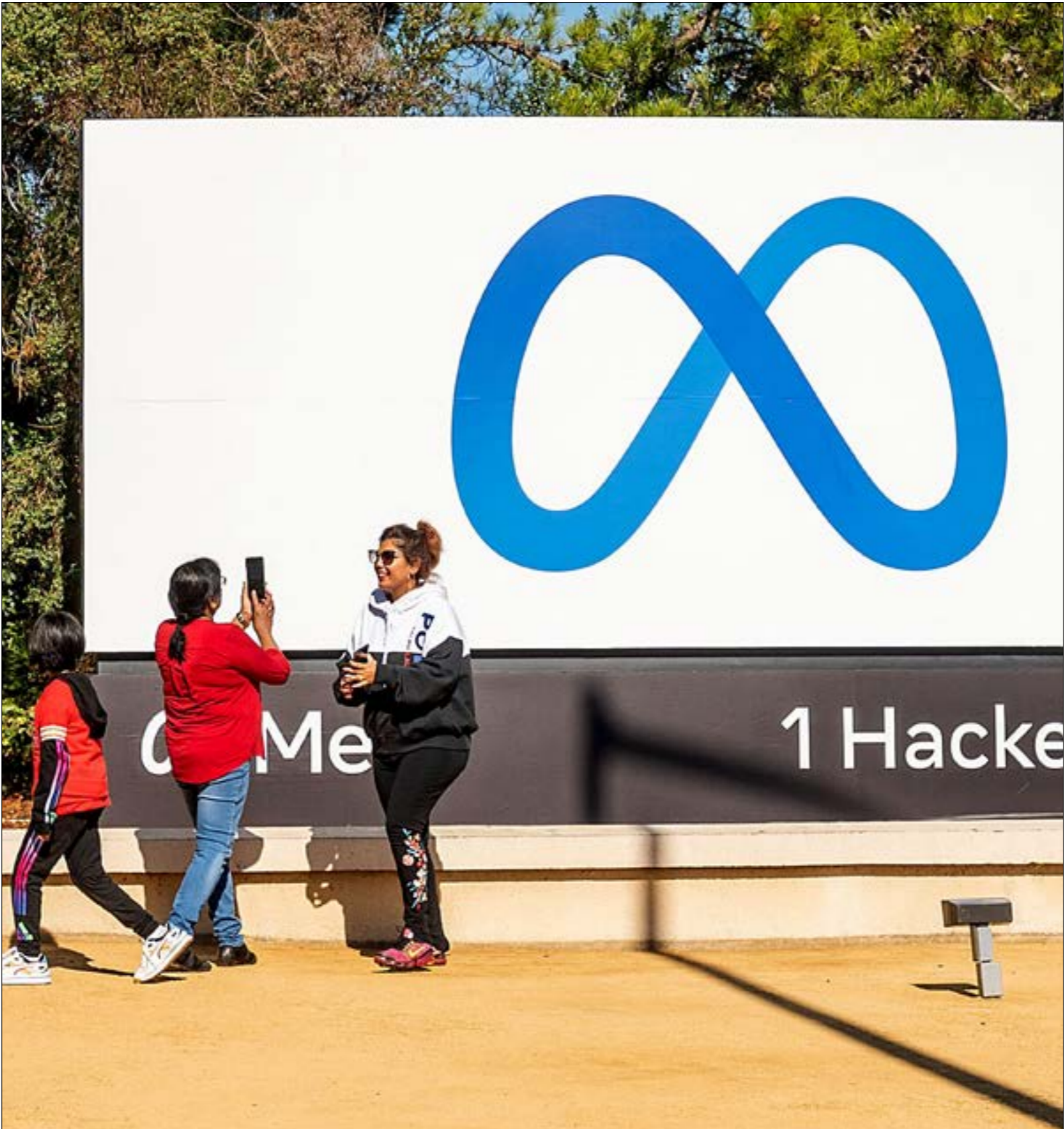
لا يزال من غير المعلوم السبب وراء قرار شركتي «تويتر» وميتا، بإغلاق هذه الصفحات

هؤلاء الجنسية الروسية، في مقابل انخراطهم في جيشها، وهو ما تزامن مع بدء الحرب في أوكرانيا. وكان لافتاً أيضاً استخدام تلك الصفحات مصطلح «إمبريالية» لوصف سياسة روسيا، و«الحروب الإمبريالية» لوصف انخراطها العسكري في عدد من مناطق الصراع، كسوريا وأفريقيا. وفي مقابل ما تقدّم، دابت الجهات نفسها على تلميع صورة الولايات المتحدة؛ فنشرت أخباراً عن الدعم الأميركي لدول أسيا الوسطى وشعوبها، كما حاولت إظهار أميركا على أنها الشريك الاقتصادي الأمثل لهذه الشلدان، وذلك لتخويرها من التبعية الاقتصادية لروسيا.