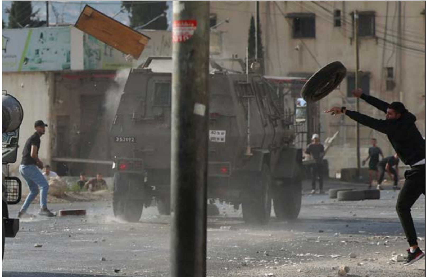
داهمت عشرات الاليات العسكرية أحياء مدينتَي رام الله والبيرة، وسط مواجهات عنيفة مع الشبَّان (أ ف ب)

فتحت معركة «وحدة الساحات» شهمةً الاحتلال على المزيد من الاستخثار في سياسة التسهيلات الاقتصادية الهادفة إلى تحقيق الاستقرار الأمني، وفي آخر فصول