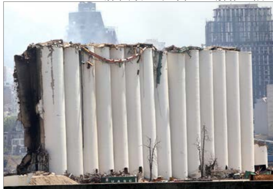
الدمار الذي لحق بالمبنى بعد قرار كهذا؛ هل التدعيم ممكن؟