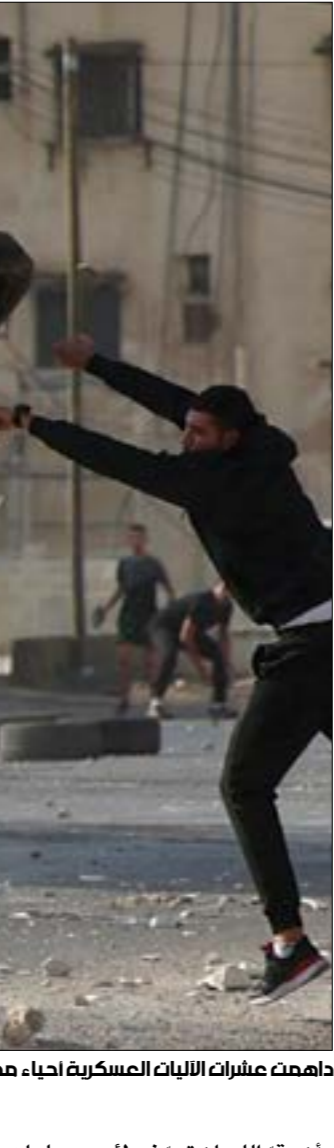
داهمت عشرات الاليات العسكرية أحياء مدينتَي رام الله والبيرة، وسط مواجهات عنيفة مع الشبَّان

اغلقت قوات الاحتلال الإسرائيلي، أمس، مقرّات تسع مؤسسات فلسطينية حقوقية وأهلية في مدينة رام الله والبيرة وسط الضفة الغربية، بعد اقتحامها إيَّاهما ونهبها محتوياتها. وداهدت عشرات الأليات العسكرية أحياء المدينتَين، وسط مواجهات عنيفة مع الشبَّان الذين تصدوا لها في الحجارة والزجاجات الحارقة، وفي أعقاب ذلك، اغلق جنود العدو مقرّ تلك المؤسسات، ونثتوا الواحاً حديدية على بواباتها، كما علقوا اواصر إغلاق عليها، بعد أن عبثوا بمحتوياتها واستولوا على ملفات ومعدّات عدد منها. وجاءت هذه الاعتداءات بعد ساعات من قرار وزير الحرب، بيني غانتس، تصنيف ثلاث مؤسسات فلسطينية بصورة نهائية كـ«مؤسسات إرهابية» بحجّة تمويلها «الجبهة