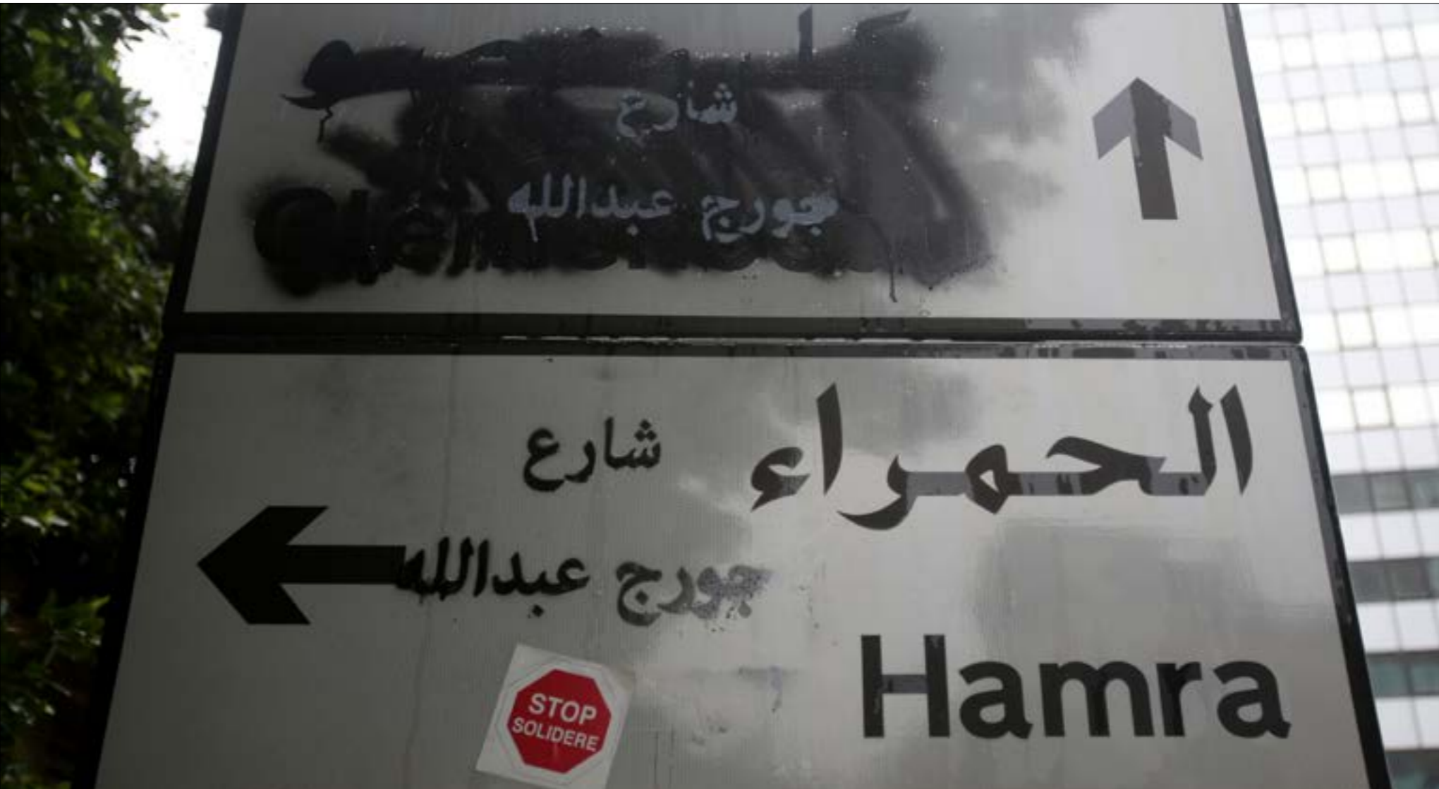
(الأسيف، مبرات طحطح)