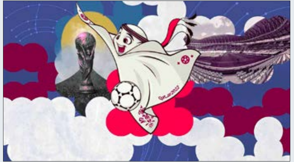
(انفينا غوبتا - الهند)

أما حالياً، فتوضح مصادر لنا أن لا مؤشرات إيجابية تدلّ على إمكانية نقل المباريات عبر «تلفزيون لبنان» في الخريف المقبل. في ظل غياب سوق الإعلانات في «بلاد الأرز»، بفعل الأزمة المالية الخائفة واحتجاز الودائع، يجد المعلن صعوبة في الحصول على «فريش دولار». ليبقي السؤال: من أين يأتي اللبنانيون بملايين الدولارات التي تفرزها شركة «سما» خصوصاً أنّ الأمر يحتاج إلى تسوية قانونية ومالية لتحطّ كأس العالم على «تلفزيون لبنان».