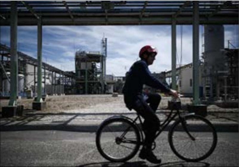
تستملك أوروبا ما يقارب 503 مليارات متر مكعب من الغاز سنويا (ف ب ر)

وصقلية، ولديه القدرة على ضخّ 33,5 مليار متر مكعب سنويا؛ وال«الغربي الأوروبي» إلى إسبانيا والبرتغال مروراً بالغرب، بقدرة 10,3 مليارات متر مكعب سنويا. لكن هذا الأخير توقف عملة في 31 تشرين الأول 2021 بعدما ساءت العلاقات بين الجزائر والمغرب، والتي يمثل توتّرهما تحدياً كبيراً من المرجح أن تتدخل واشنطن نفسها لدى الرباط على خطّ معالجته.