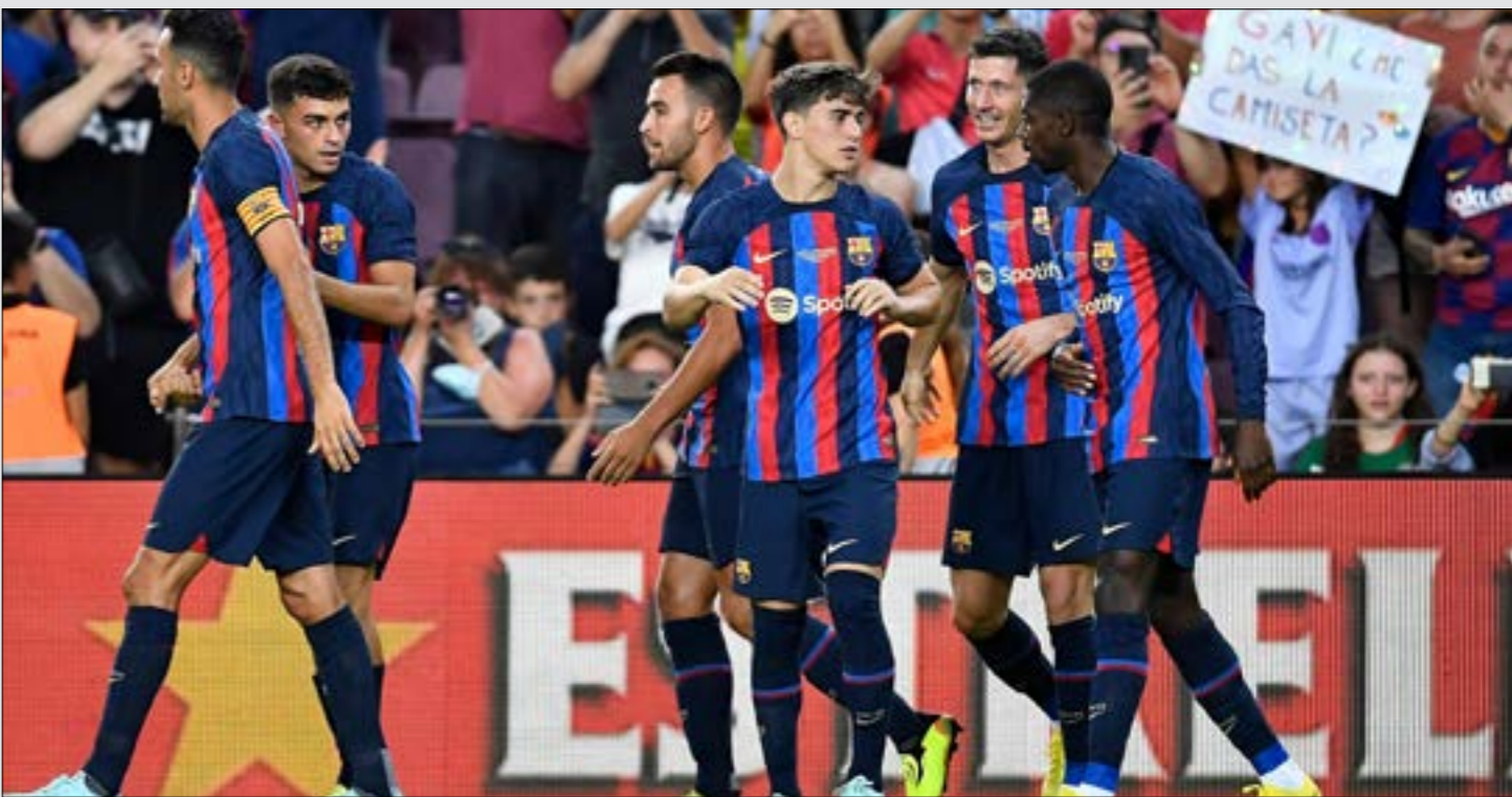
بحاول برشلونة تسجيل لاعبه الجدد قبل يوم السبت