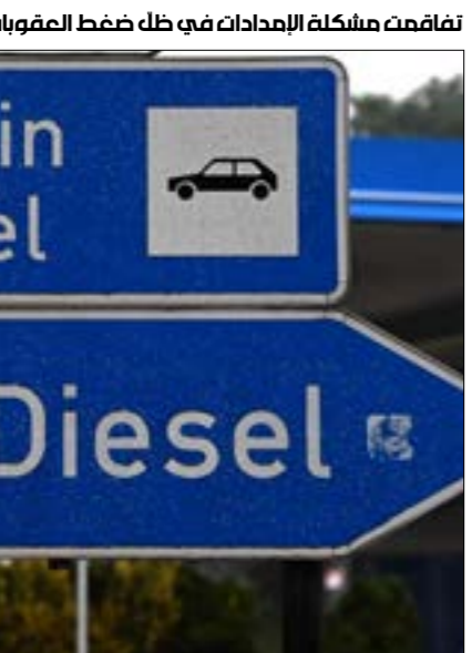
تفاقمت مشكلة الإمدادات في ظل ضغط العقوبات الغربية على روسيا

الطاقة جديدة لتوليد الطاقة المتجدّدة، وأتباع تدابير للمحافظة على الطاقة. في هذا الصدد، يقول الخبير الاقتصادي في مؤسسة «بروجيبل»، سيمون تاجليبايتر، وفق ما ينقل عنه جف توليفسون في تقرير نُشر أخيراً في مجلة «نايتشر» العلمية: «نحن بحاجة إلى مجموعة خيارات لاستبدال الغاز الروسي، وضمان تأمين الطاقة على المدى القصير»، من مثل تكثيف واردات الغاز الطبيعي إلى أوروبا، وزيادة استخدام محطات توليد الطاقة التي تعمل بالفحم، لضمان استمرار توافر الطاقة لإضاءة المنازل وتدفئتها خلال الشتاء. بعد ذلك، «علينا حقاً مضاعفة جهود التحوّل إلى الطاقة النظيفة». وبلغت أزمة الطاقة أحدّ صورها في ألمانيا التي تعتمد على روسيا في الحصول على ما يقرب من