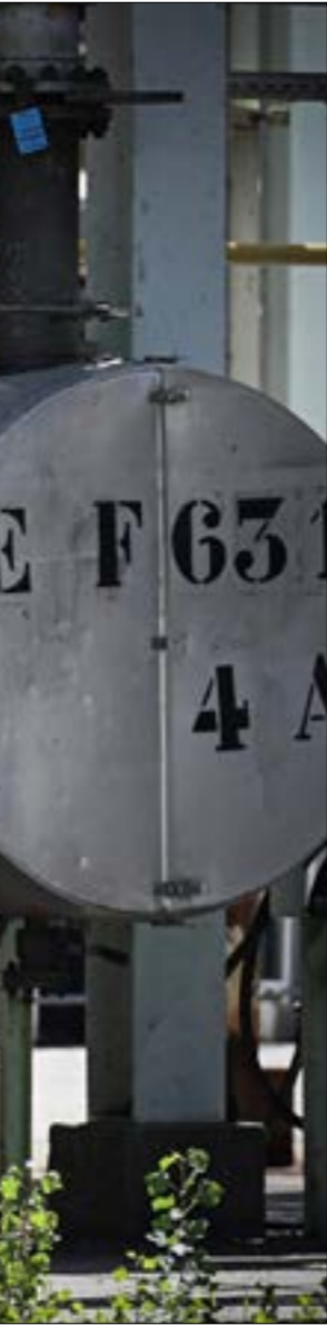
اصبحت «الصدافة» القاعدة التي تستند اليها عملية إعادة بناء الشراكات في ميدان الطاقة

قرار الأوروبيين التخلي عن مصدر وفير ورخيص من الطاقة، إذا وضعنا جانباً حججهم المضحكة عن التزامهم المبادئ السامية في العلاقات الدولية، هو الذي يوضح الأبعاد الفعلية للمعركة الدائرة حالياً في أوكرانيا، وما سيرتقب عليها من تداعيات جيو-اقتصادية وجيوبوليسية. تخطت أورسولا فون دير لاين، رئيسة المفوضية الأوروبية، بسلام أكثر جذية، فإن المجابهة الكبرى الجارية بين هذه الأخيرة وبين