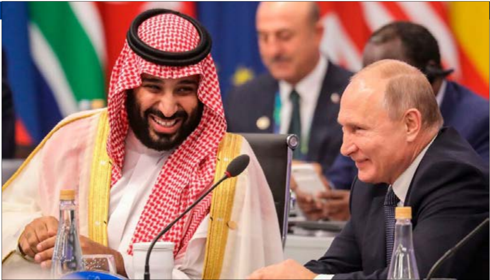
أدى التحالف النفطي مع السعودية عرضة بالنسبة الى الروس (مت الوبى)

يتحدّر على السعودية تحقيق زيادة ذات مغزى للإنتاج. ذلك أن القدرات الإنتاجية الفائضة تقع في الدول التي لا تخضع للسيطرة الأميركية، ونمّا تتأثر بالسياسات الأميركية، بمعنى أن الاضطرابات السياسية التي تغريها واشنطن، أو العقوبات التي تفرضها، تقلص القدرة الإنتاجية القائمة، وتحوّل دون نمو الاستثمار في كل مراحل الإنتاج. وهذا هو السبب الرئيس في الفجوة القائمة بين الطلب العالمي الذي يبلغ 100,3 مليون برميل يوميا، وبين المعروض الذي يبلغ 94,5 مليون برميل، أي بنسبة 6 في المئة، وهي فجوة لا يمكن ردها إلا بتوفير الظروف المناسبة لتنمية القطاعات النفطية في دول غير صديقة للولايات المتحدة. ويمكن وفق إحصاءات «أوبك»، زيادة الإنتاج 4,8 مليون