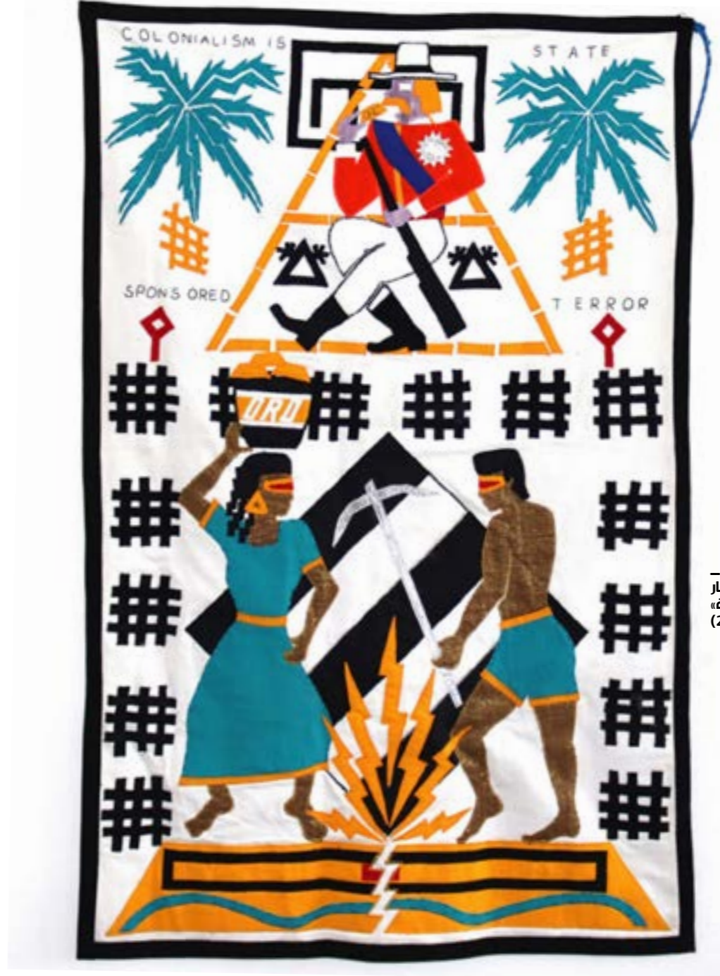
عمر رشيد - الاستعمار اهاب دولة» (2019)

ومن دروس رسخت في ذاكرته، ومن تجارب نخالية تمتدّ على أكثر من خمسين سنة في العمل السياسي والديموقراطي والمدني، ومن تجربة «مؤسسة عامل» من خلال مسيرتها مع المتطوعين من جهة، ومع الناس من جهة أخرى، وقد عكست المؤسسة المنحى التبعي الذي غالباً ما يكون في اتجاه واحد من الغرب إلى الشرق، وداوماً بالعمل التذي واعتماد شعار