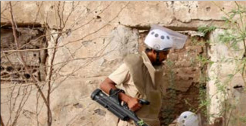
لم تجد والشطب بدأ من التخلّط عند زرع أيّ عقبة بوجه صمود الهدنة