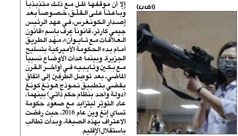
لا تزال الصين تنظر إلى «التوحيد السلمي، باعتباره خياراً قابلاً للتخلّف»

الخطة الصينية «عاجلاً أم آجلاً، سوف تعود تايوان» على هذا الأساس، بنت بكين سياستها حيال الجزيرة، وهي إذ فضّلت، ابتداءً، انتهاز الوسائل السلمية، فقد عملت على خلق علاقات اقتصادية قوية مع تايبيه على مدار أكثر من عشرين عاماً. ووفق الأرقام الرسمية التايوانية، فإنه حتى عام 2018، فاقت استثمارات أميركية بين الصين من وضع ديماء كان هدف الصين من هذه العملية، خلق وضع يؤدي في النهاية إلى عودة البوحة بين الجزيرة والبرّ الرئيسي. لكن اليوم، وفي ظلّ تصاعد الاستفزازات