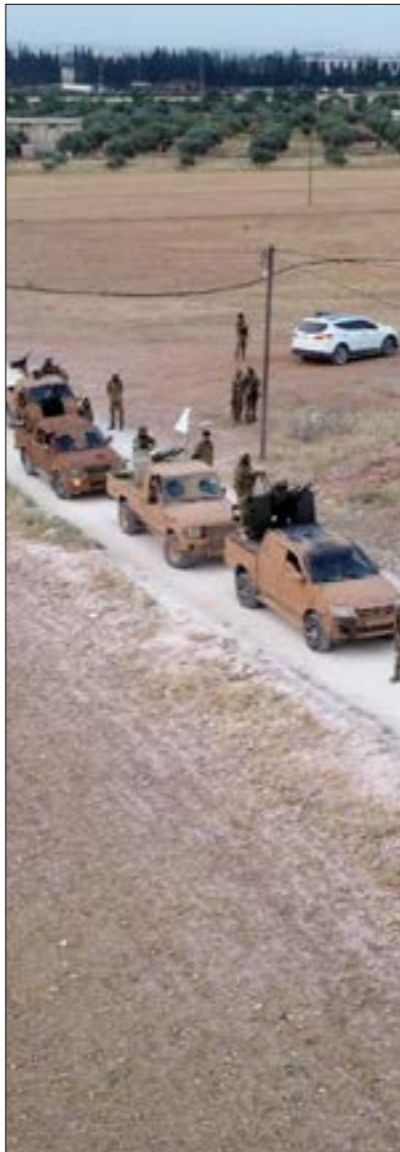
انفض سقف التوقعات في أنقرة بعد جولة مفاوضات دبلوماسية مع الولايات المتحدة ودول في الاتحاد الأوروبي

من وإلى الشمال والشمال الغربي من سوريا، بالإضافة إلى تهريب البضائع التركية. من جهتها، كثّفت روسيا نشاطها العسكري في مناطق التماس مع القوات التركية، في حين استقدم الجيش السوري تعزيزات إلى أماكن عدّة، من بينها نقاط تمركزه على تخوم منج، وفي محيط تل رفعت، كما عمدت موسكو إلى تسخير دوريات جوية بشكل يومي تنفّذها حوامات عسكرية على ارتفاع منخفض، الأمر الذي يُعتبر رسالة مباشرة إلى أنقرة من جهة، وإلى الفصائل التابعة لها، والتي قد تقدم على محاولة إحداث تغييرات في الخريطة الميدانية. وعلى الرغم من التشنّد الذي يشهده الميدان، بدا موقف موسكو السياسي أكثر لياناً من نظيره الأميركي إزاء تعزيزات تركيا في قضم مناطق في سوريا، الأمر الذي يبدو أنه يرتبط بالاتفاقات الموقّعة بين الطرفين، والتي عبّرت روسيا أكثر من مرّة عن قلقها من تأخّر تركيا في تنفيذ تعهّداتها بموجبها في ادلب. ويعد ذلك انعدام الوجود الأميركي