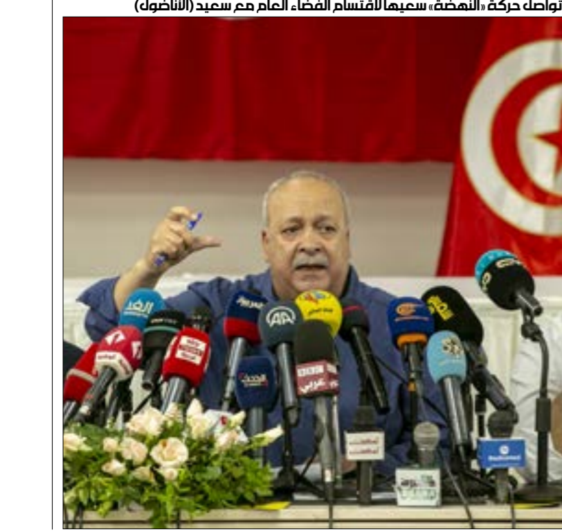
تواصل حركة النهضة، سعيها لتقسام الفضاء العام مع سعيد

إعادة إنتاج لمبادرة «مواطنون ضدّ الانقلاب» التي أخفقت في تحشيد الشارع لصالحها. تبرّع أحمد نجيب الشابي، الباحث عن الرّعاية، للترنّع على عرش الجبهة، معتبراً، خلال مؤتمر إعلان التأسيس، أن «سعيد أخطر ما مرّ على البلاد من دون وجه وزير المالية خلال مفاوضاته مع الجهات المانحة. يُضّاف إلى ما تقدّم أن سعيد لا يُعدّ بالقطع مع منظومة الاقتراض الدولية، التي شكّلت منذ إنشائها الذراع المالية للتدخل في البلدان النامية وفرض الوصاية عليها، كما لا يُظهر آتياً