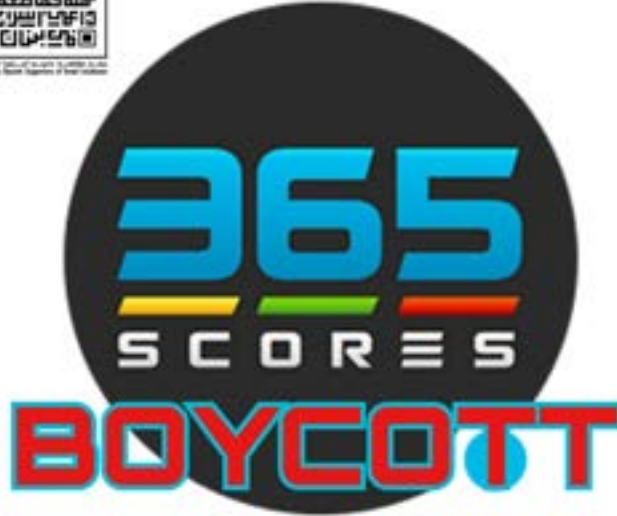
سبغ وان أطلقت حملة لحذف التطبيق الإسرائيلي العام الماضي