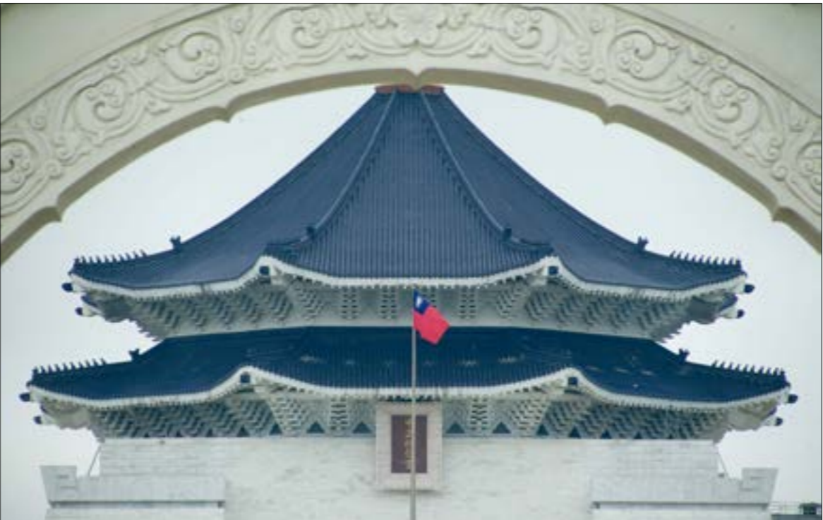
لا تزال الصين تنظر إلى «التوحيد السلمي، باعتباره خياراً قابلاً للتخلّف»

يكتثّف الحراك الصيني في محيط جزيرة تايوان، في موازاة استفزازات أميركية لا تفتأ تزداد حدة، خشية ما يمكن أن ينجم عن تصعيد بكين من غزو تراه واشنطن قريباً. وإذ تبنيّ هذه الأخيرة استراتيجية حيال الصين، ومن ضمنها تايوان، استناداً إلى هذا التقدير، فهي أعلنت، أخيراً، بدء محادثات تجارية مع الإقليم الصيني هدفها، كما تقول، «تعزيز التعاون الثنائي»، في مبادرة أطلقها بعيد