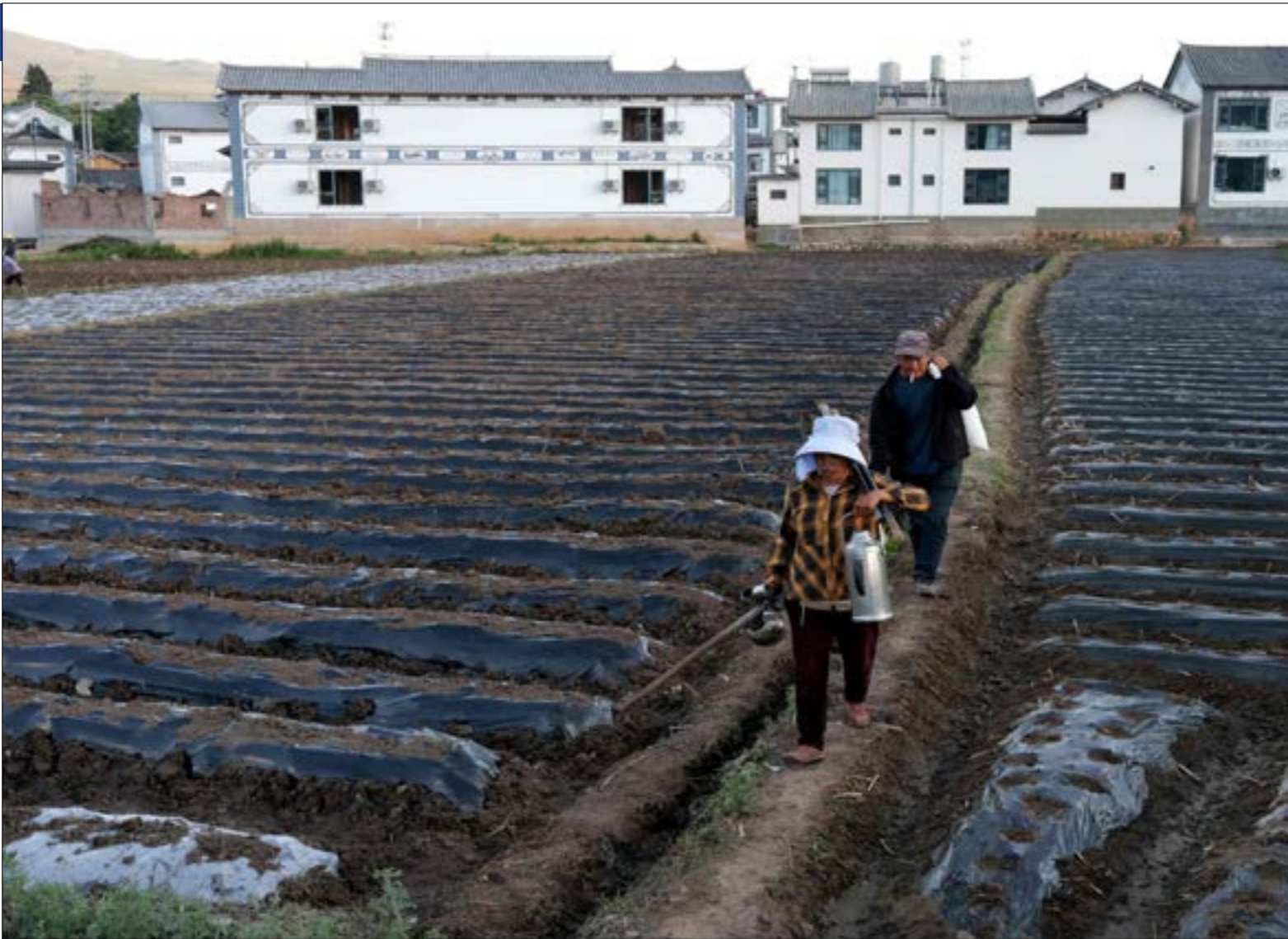
بليكن: الصين أصبحت مختلفة عما كانت عليه قبل 50 عاماً، حينما كانت معزولة وتكافح الفقر والجوع

لم تُعدّ وزارة الدفاع الأميركية تلعب دور القاطرة في عملية تمويل التكنولوجيا وتطويرها في الولايات المتحدة، وأصبح لقطاع الخاص