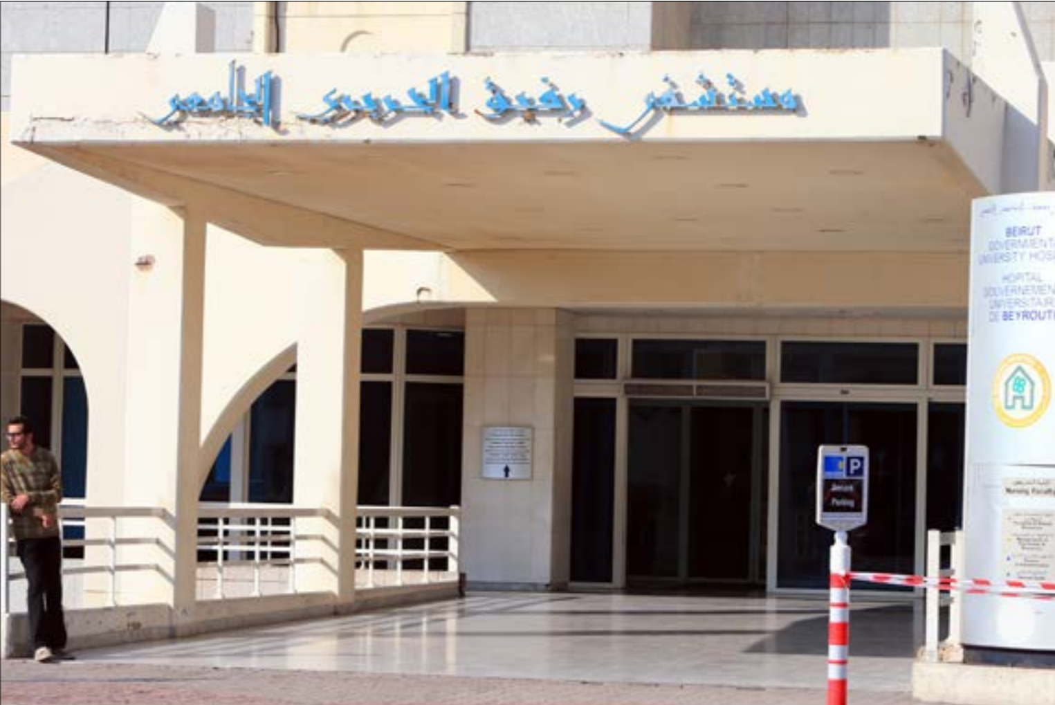
العمل في المستشفى شبه معطل مع إقفال معظم الأقسام ومكتب الدخول

يخاف العاملون اليوم من إنهاء الإضراب من دون تحصيل أية نتيجة خصوصاً في ظل «السوايق» مع الإدارة. يشيرون إلى محاولات سابقة مع الإدارة للتوصل إلى حل وثمان سبيل العمل بالمؤسسة من خلال «تأمين مساعدة شهرية ثابتة تساعد الموظف على الحضور اليومي لتأدية