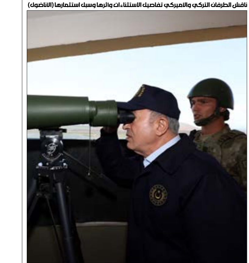
تفاوض الطرفان التركي والاميركي تفاصيل الاستثناءات وأقرها وسبل استثمارها

في إطار ما اعتبرته «ضرورة منع عودة داعش إلى الحياة»، وعدم السماح له بالتجنيد واستغلال مظالم السكان، مشيرة في الوقت ذاته إلى أن هذا الاستثناء سيساهم في «تسهيل نشاط الاستثمار الاقتصادي الخاص في المناطق غير الخاضعة لسيطرة الحكومة والمحرّرة من التنظيم الإرهابي في سوريا».