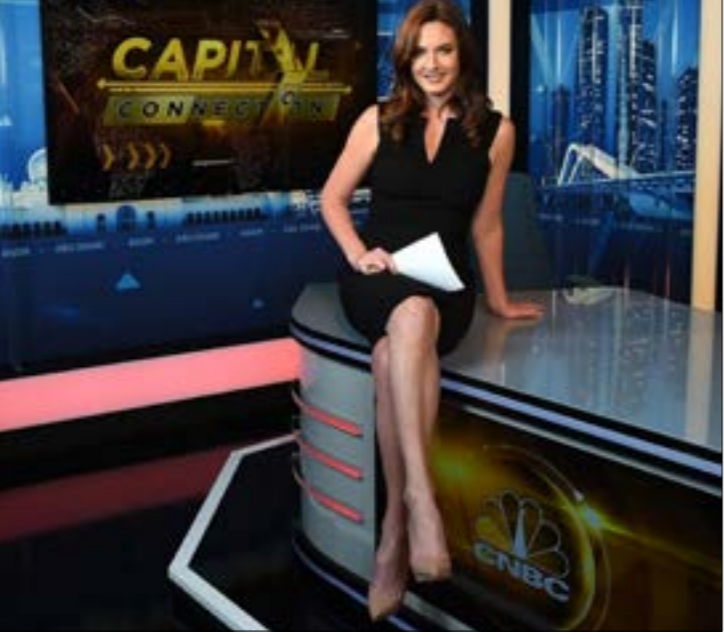
ارسلت CNBC مقدمتها هادلي غامبل إلى العاصمة لمواكبة الانتخابات

الجنسيات، تسعى لتغطية الحدث اللبناني. في هذا الإطار، تلقت مصادر لـ «الأخبار» إلى أنّ «الجزيرة» تسعى لتغطية متممايزة للانتخابات عن باقي القنوات، إذ تجهّز لليلة انتخابية طويلة عبارة عن حلقة حوارية مباشرة على الهواء من ساحة الشهداء، حيث سيطل إعلاميون وناخبون من مختلف الأطياف. أما «سكاي نيوز»، فتخصّص تغطية لثلاثة أيام قبل الانتخابات وبعدها لمواكبة تداعيات الحدث. من جانبها، تعتمد «العربية الحدث» على مراسليها في بيروت لتسليط الضوء على العاصمة و«الشارع السنّي». تتشارك هذه القنوات الغربية بمحاوئها مع القنوات اللبنانية،