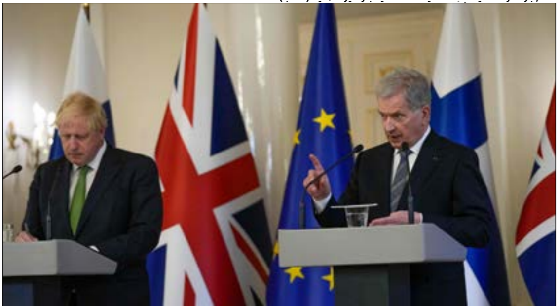
تقدّم جوسون تكديبات إلى القيادة الفنلندية بتوفير الحماية

مسالة العضوية في «الناتو»، في نهاية هذا الأسبوع. وعلى الرغم من أن الدعم الشعبي لمبدأ الانضمام إلى الحلف، يبدو أقلّ منه في فنلندا، إلا أن المعلومات المتداولة تفيد بأن الأميركيين يتوقعون أن يقدم البلدان الإسكندنافيان - السويد وفنلندا - طلبات عضوية «الناتو»، في وقت واحد. ومن المقرّر أن يصل الرئيس الفنلندي، نيكينستو، إلى ستوكهولم، في زيارة رسمية، يوم الثلاثاء، لشدّ أزر السياسة السويديين.