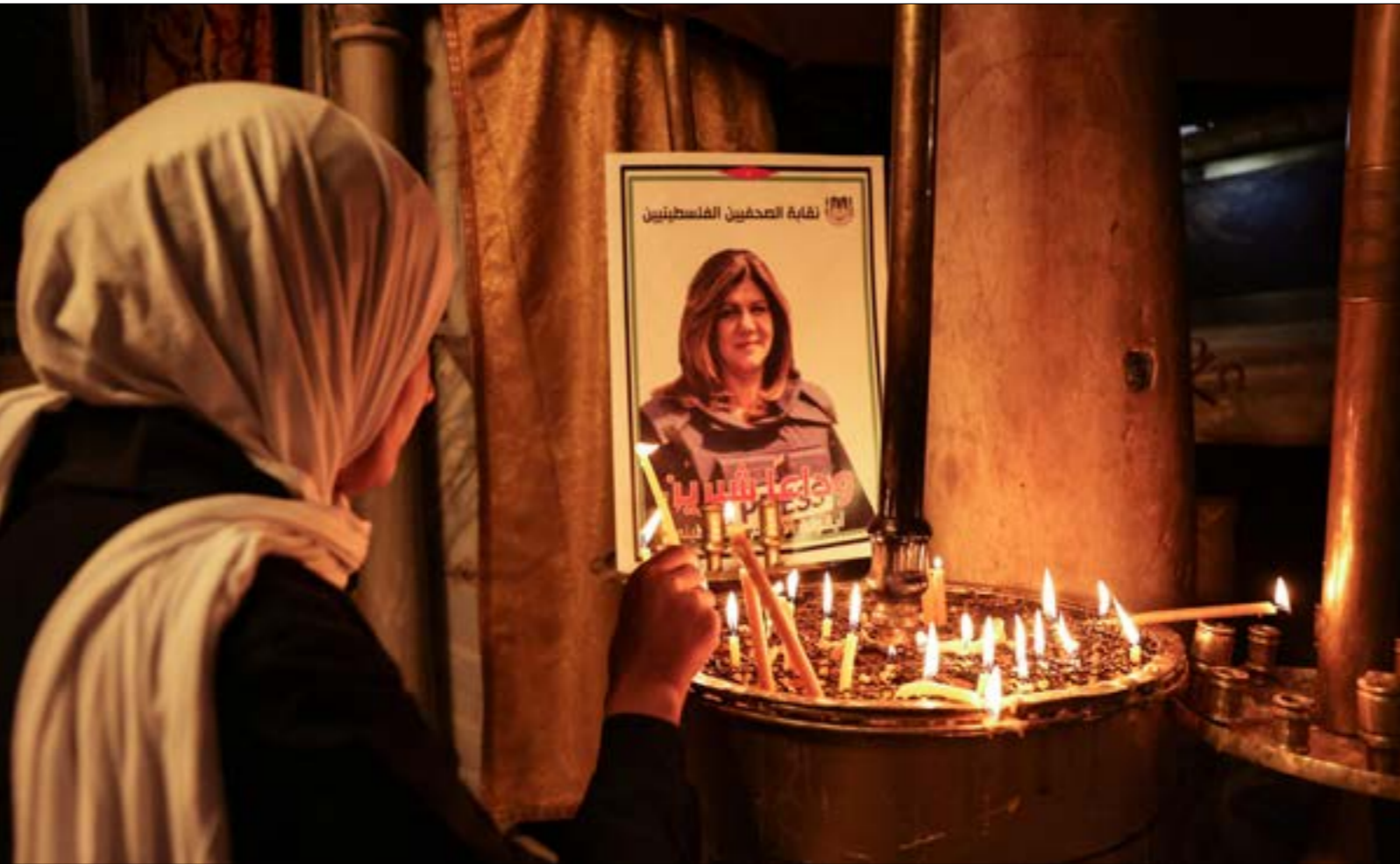
انغمست ماكينية الكذب في الترويج لشريط فيديو يظهر مقاومين فلسطينيين يطلقون النار، ويقولون «اصبنا إسرائيليا»

وفي السباق نفسه، اعتبر محلل الشؤون الفلسطينية، الجيرل بيفي،