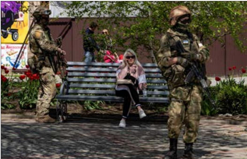
تخصي روسيا قدام التحصيف السيطرة الكاملة على دونباس وجنوب اوكرانيا