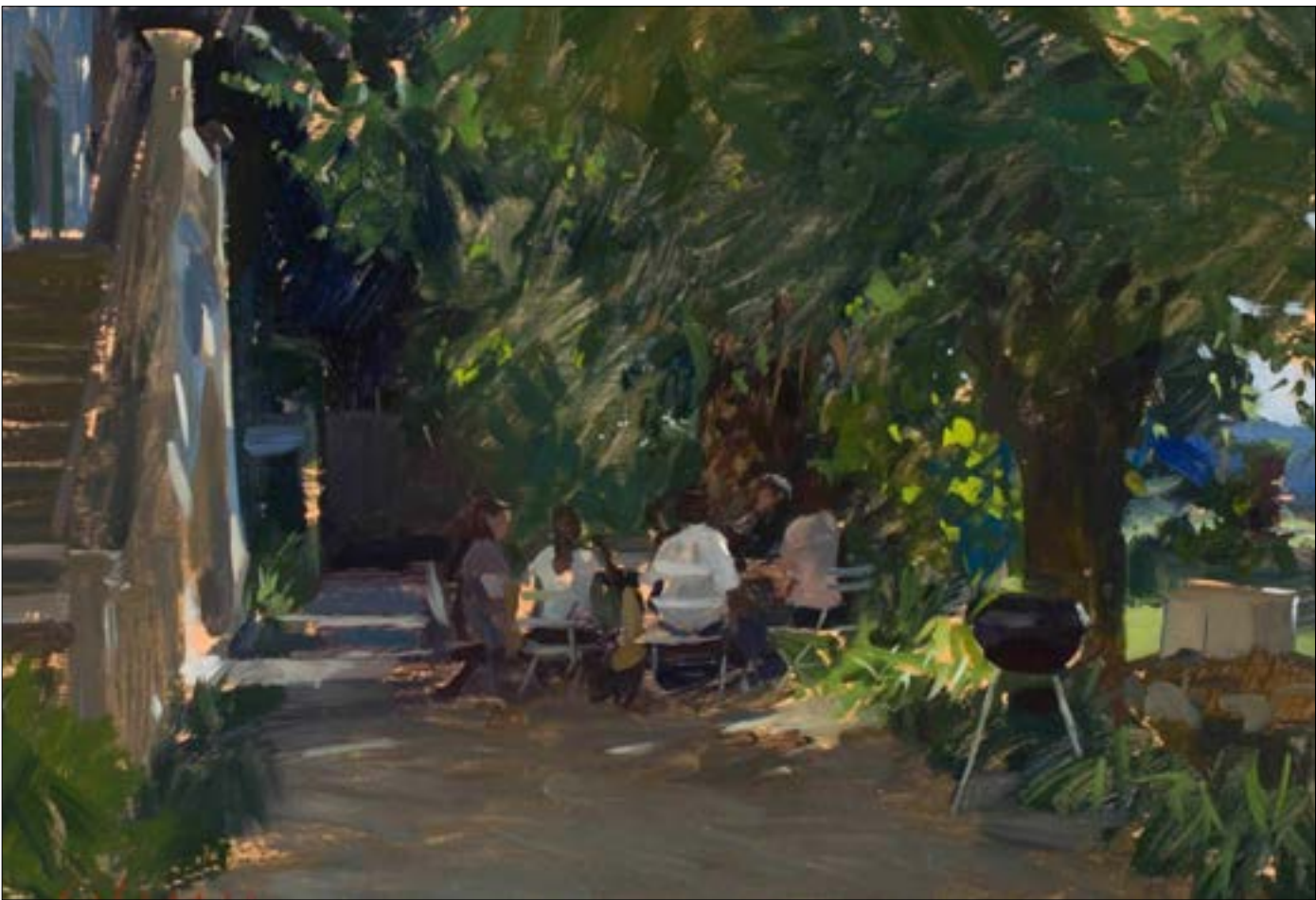
مارك ديلاسيو... بعداء في الحديقة، (زيت على خشب — 2017)

مختلفة قدحاً تلو الآخر. وكان فلاس يتحين الفرصة ليدفن نفسه في هاتفه، وكانت الحياة تدبّ في فيكا عند الحديث عن العمل أو الكلاب. ورامميلا تؤخذ بأحاديت قصيرة عن قصص الحياة، فيما كانت ناستيا تركز سرعة إلى الأريكة أو إلى غرفتها لتعمل. كانت أيام الأربعاء، هي الأكثر متعة. حين كانت متأبّة بوريا ورامميلا. لم يهوّ «بويس» الطهو ولم تكن لديه أي دراية به. لذلك حوّل مناوية إلى حفلة شواء أندية. كان إعدادها مصحوباً بتذوق الفوركا. كان الشواء يبدأ متأخراً ويُقدّم العشاء قبيل منتصف الليل. بحلول ذلك الوقت كنت عادة في حالة سكر.