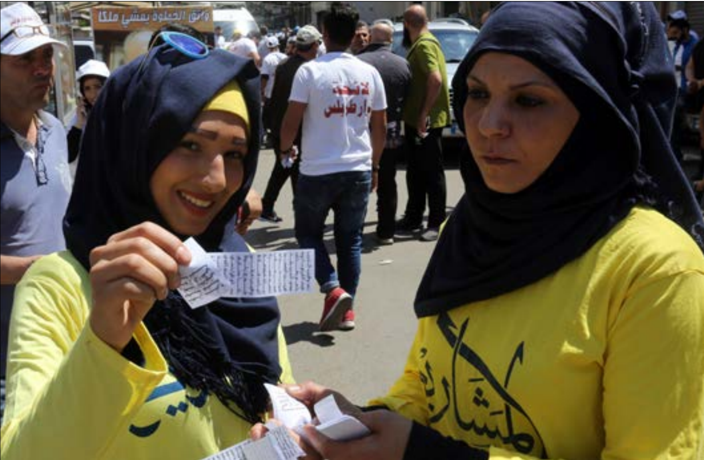
(أرشيف، مروان طحطح)

بالإرقام فحسب، وإنما لم يعد خافياً وجود أكثر من رأي داخل «الجمعية». الفرق اليوم أنّ حالة الاعتراض على حزب الله تتنامي وإن البعض يُطالب الجمعية بأن تبرز تمايزها عن حلفائها لإثبات أنها حركة سنية أقل من الدورة الماضية وإذ بعض العارفين أنّ قيادة «أحباش»