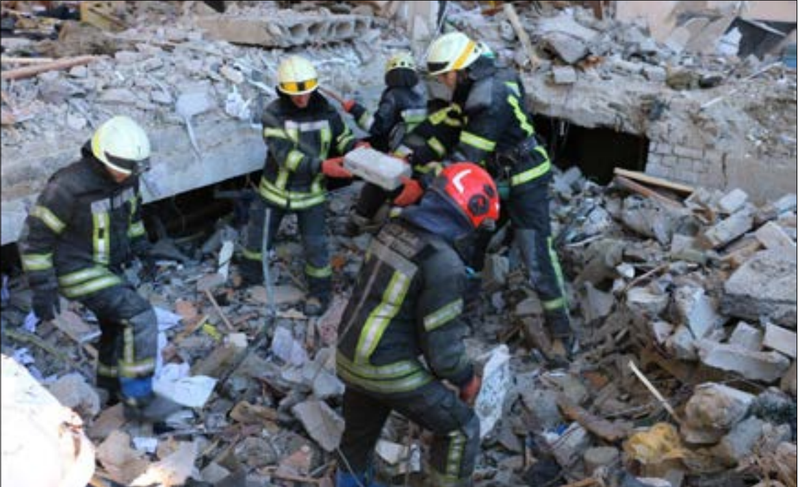
تدور الأحداث المركزية، حالياً، في منطقة غورلوفكا حتى كوراخوفا، جنوب غرب «جمهورية دونيتسك، (ف ب)

يعد الاتحاد الوروبي نفسه، اليوم، اهم اختبار جديد فرضته عليه عودة الحرب إلی حدوده، حيث يطغ الحليف الأميركي براسه ليحزم في اتجاه حظر شامل للطاقة الروسية، من دون الاخذ بامتنار الاعتبار تحاليف ذلك على اقتصادات حلفائه، واذا يبدو ان أوروبا ليست في وارد المغامرة بحجب الغاز الحظر خطوة من تأثرات بالغة السلبية علىها، إلا ان رضوخها المحتمل اليوم لضغط الأميركي في شأن التحلي، عن النفط القادم من روسيا، سيكون كافياً لوحده لخض الاقتصاد العالمي، وهو ما سيعتمد مدها على شك الحظر النطبي الذي قد يُقدم عليه الوروبيون، وفق ما يبيّن الخبراء الروس، في هذه المدينة، تمّ القضاء عليها، ويُقدّر الخبير العسكري عديد القوات الأوكرانية المنتشرة في ماريوبول بنحو 14 ألفاً، متحدثاً عن خسائر كبيرة في صفوفها، «فيما يجري العمل للقضاء على من تبقى منهم»، ويلفت يفسييف إلى أن «صواتنا بدأت تتصاعد في الولايات المتحدة تَدخُّراً من الرئيس الأوكراني (فلودومير زيلينسكي)، الذي لم يتمكن من التحكم بالمداريين الجُدد. وهذه الأصوات لا تصمر عن ممثلي الحزب الجمهوري فحسب، وإنما هناك آراء مشابهة في صفوف الديموقراطيين أيضاً»، ولا يستبعد أن تُقدّم واشنطن على «التضحية» بزبلينسكي، ويقول إن «النازيين متمتضون بشدة بسبب التفريط بهم، وتكديهم خسائر فادحة في الدونباس. لذلك، يخططون للسيطرة على السلطة المهم بالنسبة لبندا، هو أن الشكوك بجدوى المواجهة بدأت تزاد في الولايات المتحدة، وما