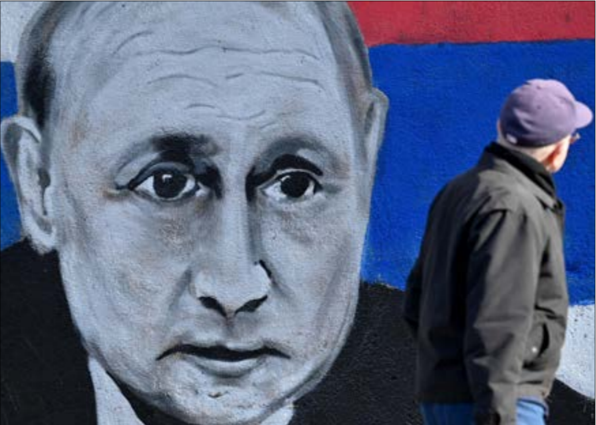
ما من شك في أن الثقة التي يتحلّى بها بوتين تستند إلى الإنجاز الكبير الذي حقّقه مع الحلفاء في سوريا (أ ف ب)

بعدها باعته إسرائيل إلى تشيكيا، وهذا الصاروخ يلاحق أثر الحرارة، ويطلق عليه «أضرب وأنسى». ثمة عوامل متعدّدة تؤثر في العلاقة بين روسيا وإسرائيل، تجعل بوتين حذراً في ما يمكن أن يُقدّم عليه، أبرزها اليهود المهاجرون من روسيا، والذين يشكلون نسبة معتدرة من سكّان إسرائيل؛ واليهود الذين ما زالوا في روسيا، وهم من أصحاب النفوذ، على رغم أن بوتين كان أبعدهم من الحلقة المحيطة به؛ والتأثير الذي تمارسه إسرائيل على