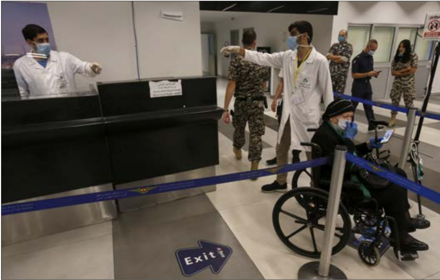
الاتفاق مع جمعية «عقال» لم يراع جانب الاختصاص واولك للجمعية تقديم خدمات لا تتطابق مع ما تقوم به (رشيف، هروان حططم)

هل كانت وزارة الصحة العامة - والاطراف المعنية - على علم بالمخالفات المرتكبة في ابرامها لمذكرات التفاهم الخاصة بإجراء فحوص الPCR للقادمين إلى لبنان؟ قد تكون الإجابة الأقرب إلى هذا السؤال هو ما خرج به ديوان المحاسبة في تقريره الخاص الذي حصلت عليه «الخبار» حول التحقيق في مصير أموال فحوص الPCR للقادمين، والذي أظهر أن الوزارة والاطراف اللاحقة في مذكرات التفاهم الاربعة التي ابرمتها ضالعة - عن قصد او غير قصد - في جملة مخالفات ليس اقلها مخالفة النصوص القانونية والتهرب من الرقابة والنسب في تفويت أموال طائلة على خزينة الدولة