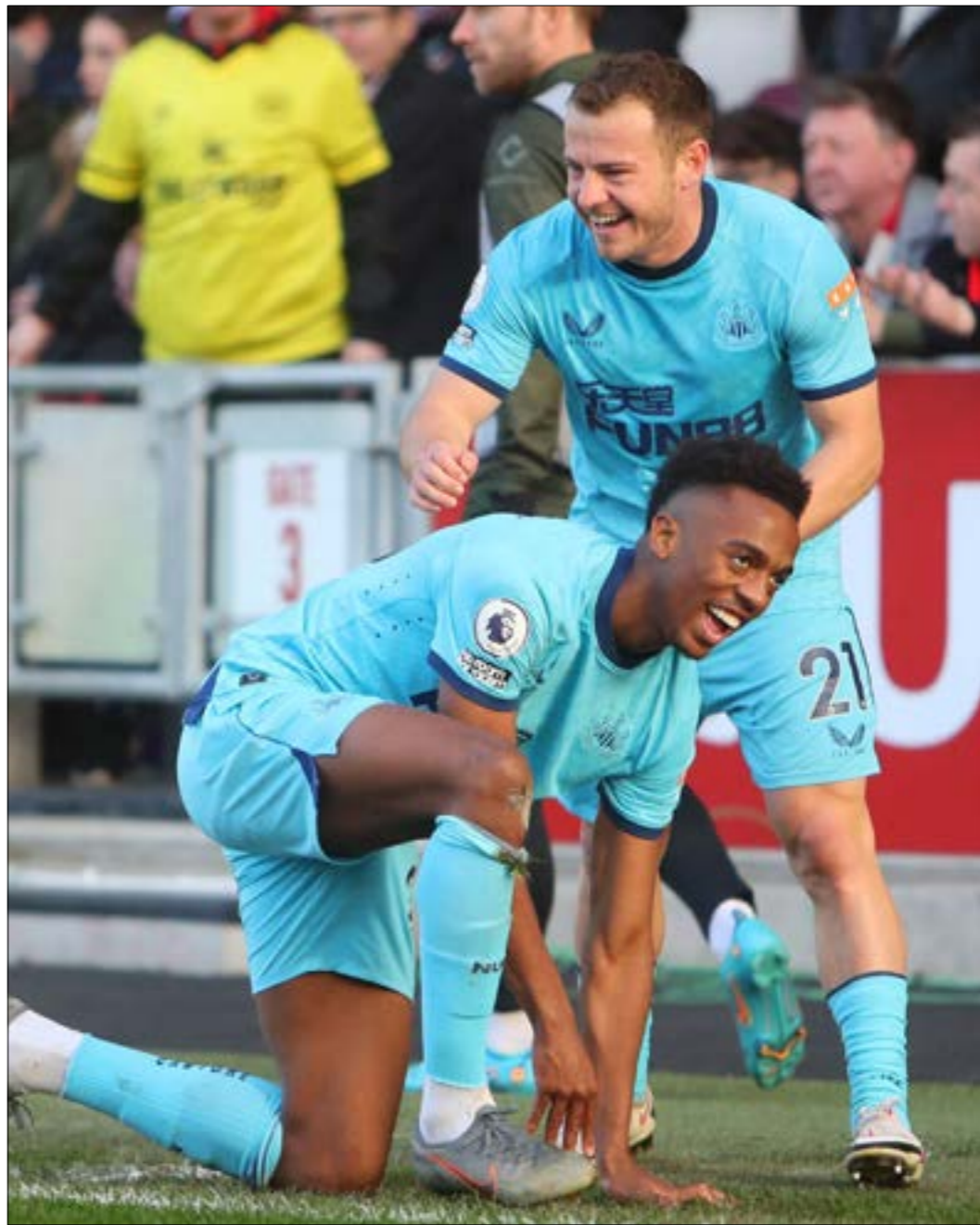
فاز نيوكاسل 5 في 5 من آخر 8 مباريات

تحسنت نتائج نيوكاسل منذ انتقال ملكيته إلى صندوق الاستثمارات العامة السعودي، حيث يحرز «الماكبايز» بسلسلة خالية من الهزائم تمتد إلى 8 مباريات متتالية، الفريق بعيد حالياً عن دائرة الهبوط وهناك ترقب كبير لنشاطه في سوق الانتقالات الصيفي