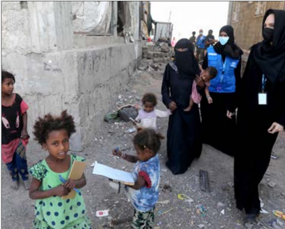
نُحلت صلما، بضرات موملة سننّفهما ردا على تلحدرد الحصار على اليمينية