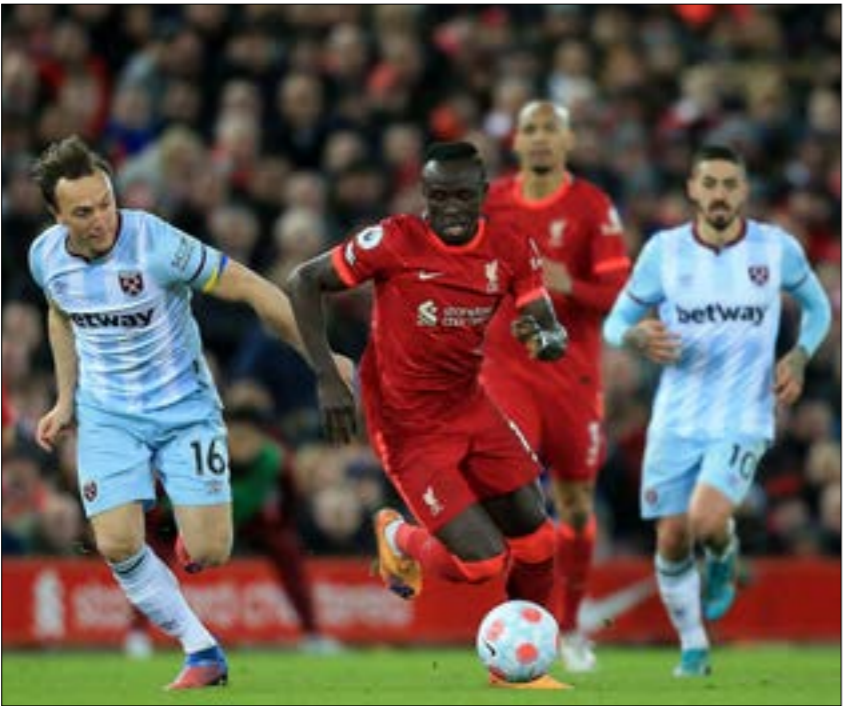
ليفربول على رأس القائمة

بعد تسجيله رقماً قياسياً في دور المجموعات بستة انتصارات من ست مباريات، نجح ليفربول بتحقيق الانتصار السابع في ملعب سان سيرو في ميلانو بفعل هدفي روبيرتو فيرمينو ومحمد صلاح في الدقائق الأخيرة من مباراة الذهاب هكذا، ظلّ حلم الرابعة قائماً بالنسبة لكتيبة المدرب الألماني يورغن كلوب، بعد تحقيق كأس «كاريابو» وبلوغ دور ربع النهائي من كأس الاتحاد الإنكليزي دون إغفال مطاردة مانشستر سيتي في الدوري الفريق بأفضل حال فنياً خاصة بعد تدعيمه خلال «الميركاتو» الشتوي