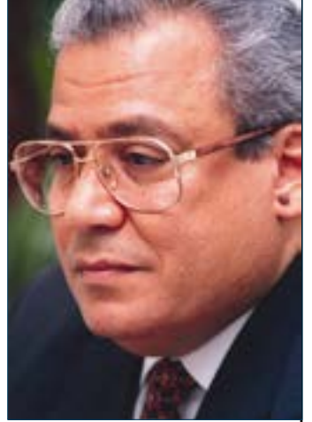
رفع شعار تجديد الخطاب الديني، وإرساء قواعد مدنيّة في إدارة الدولة