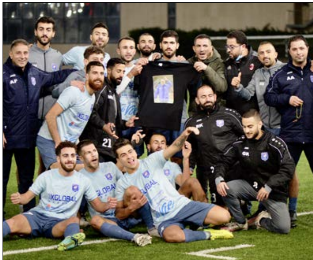
لحفا الساحليون بالانصار خسارته الراجعة هذا الموسم (طلال سلمان)

اختلطت الاوراق مجدداً في الدوري اللبناني لكرة القدم على صعيد المراكز كافة حيث ستحتدم المعركة انطلاقاً من الصدارة وهو روز بالاسم الاول من لائحة الترتيب العام ووصولاً إلى المراكز المتاخرة حيث التقارب أو التساوي في عدد النقاط. عناوين كثيرة سجلتها المرحلة الثامنة من عمر الدوري لعل أبرزها كانت اهنس عودة شباب الساحل إلى منافسة العهد على اللقب وتجاوزة لحظوظ الأنصار أكثر للحظاظ عليه