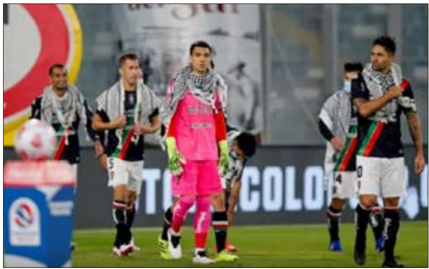
أنسس اللادج صنه صبه مهاجرين فلسطينيين تشيلي (فان)

أنشأ نادي ديپورتيفو بالستينو التشيلي أكاديمية لتدريب وتنمية أطفال فلسطين في رام الله بالضفة الغربية المحتلة، ليؤكد من خلال ذلك بأن المقاومة قد تأتي أحياناً عبر كرة القدم. يشتهر بالستينو بدعمه الدائم للقضية الفلسطينية، وهو يبتدئ مراراً وتكراراً أنه منتخب فلسطين الثاني. تأسس نادي ديپورتيفو بالستينو عبر مهاجرين فلسطينيين في مدينة أوسورنو الجنوبية في تشيلي منذ أكثر من 100 سنة (عام 1920)، وهو معروف في الوسط الرياضي بتمثيله القضية الفلسطينية في تشيلي، أميركا الجنوبية والعالم أجمع. كان الهدف من تأسيسه لئّ تشمل الجاليات العربية والفلسطينية المقيمة في دولة تشيلي، وهو يُعتبر أكثر من مُجرد ناد لكرة قدم وذلك بسبب موافقة الثابتة منذ تأسيسه تجاه القضية. من النادي بطروف ماديرة صعبة عام 1988، لتلتها أزمة مالية خائفة في عام 2004 تحول إثرها إلى شركة تجارية وكان حملة الأسمه فيها هم مجموعة من العائلات الفلسطينية في تشيلي.