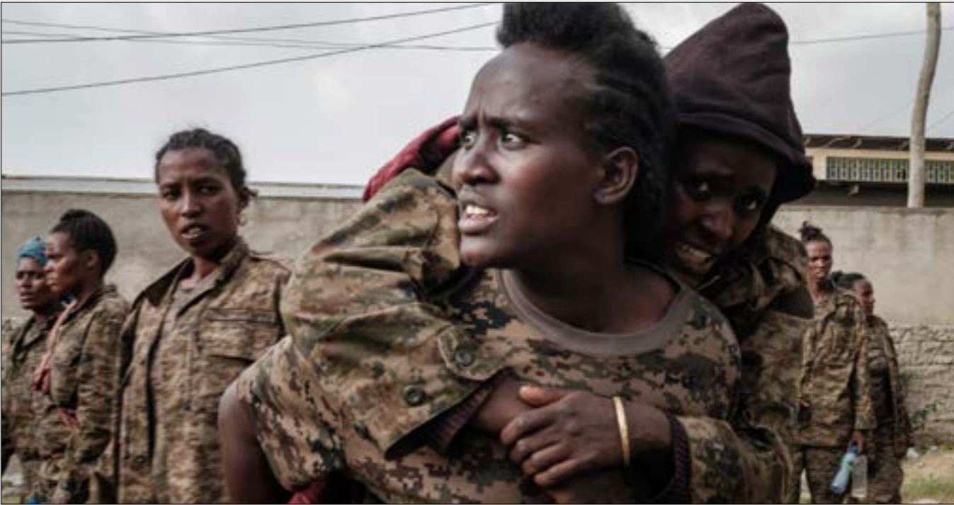
لم تستجب اديس ابايما نحو عام ونصف عام لايّ عروض وساطة على حظ ازمة «التجاري» (إف ب)