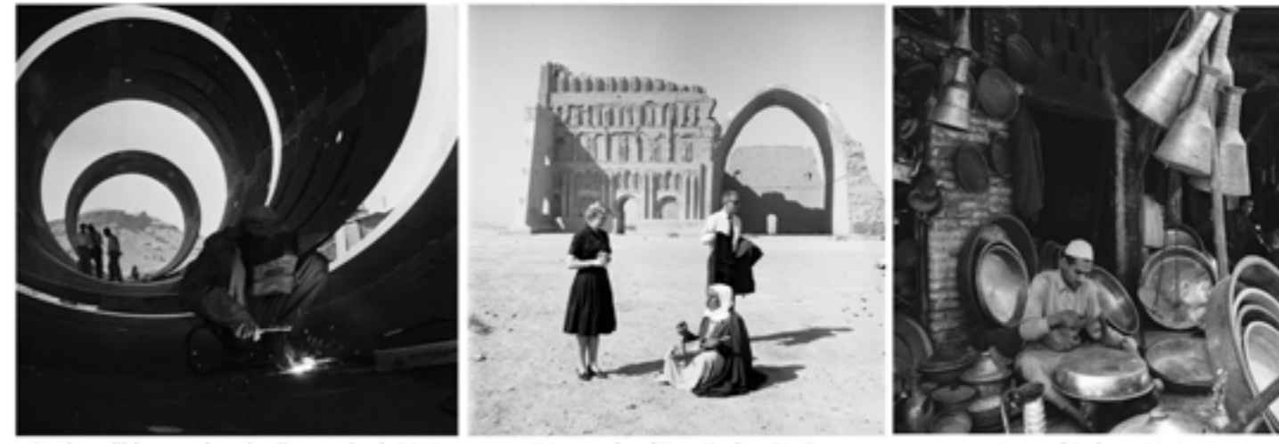
Darbandikhwan water pipeline project, 1961 U.S couple at Taq Kadra, 1965 Souq el Safeer, 1962