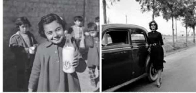
School lunch, Baghdad, 1961 Parade of an Iraqi lady, 1961