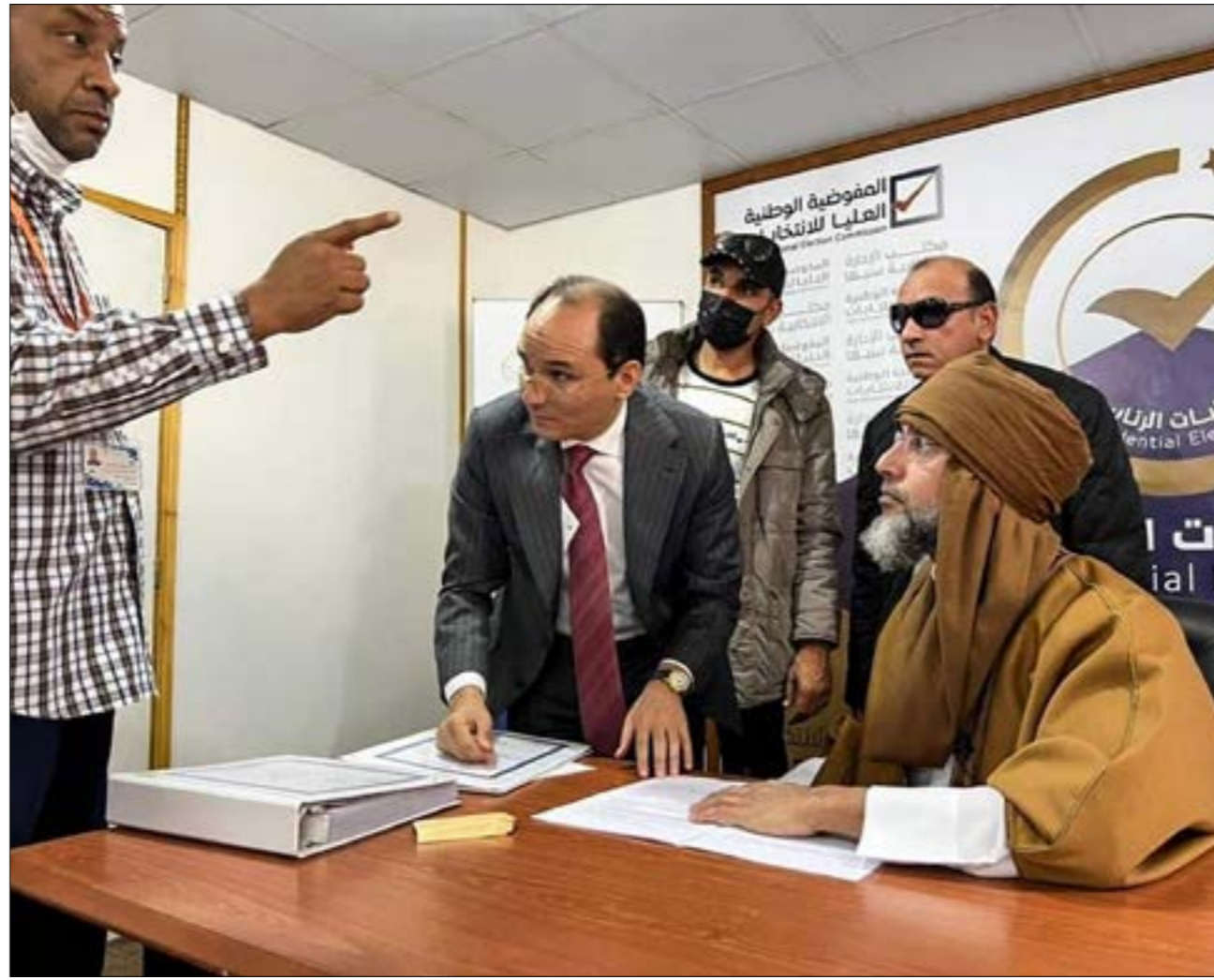
رُحبت مصادر موحدة القذافي لدخول نادي المفوضيات في القائمة النهائية

1- يوسف شعبان - 2 يا - يتكرر - 3 سان خوسه - سم - 4 فنار - 5- 111 - 5 سوه - ات - ليل - 6 تا - فل - 7 كشمش - ات - 8- هزاز - 9- يم - هند - دنو - 10- نعامه - صوان