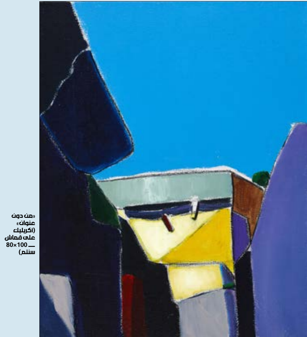
«صنّ حوت عنواً» (كربلاء) عام 2010، 80x100 سنتم

لكلية الفنون في الجامعة اللبنانية ودرس فيها. لكنه من الواضح أنه بعيد هندسة ألوانه واندماجها مع بعضها وأحياناً يخزّب هندستها الحقيقية ليحصل على عمران آخر يطلّ على فضاء واسع. هنا نتذكّر ما قاله الفنان الأميركي التجريدي جاكسون بولوك بأن الفن التجريدي مثل الموسيقى يمكن فقط الاستمتاع به. هكذا تصبح هذه التشكيلات اللونية كقطع موسيقية متناغمة. كل قطعة نغمة متفردة. يجعلنا الفنان نتدوّق درجة الاختلاف بين كل لوحة وأخرى، وكيف تؤثت مع بعضها البعض مكاناً واحداً، وكيف تشكل كل لوحة مكاناً ما متفرداً داخل المكان. كأننا نلتقي في رحلة داخلية ببيوت قريبة من القلب، نعرفها جيداً وتشترك في داخلنا ببيوتنا وحرارة الطفولة التي عشنا فيها، من أي مكان كنا. تحضر النوافذ الأبواب، وأحياناً تعثر على قمة السطح تتلاصق مع الرفاعي في السماء. تأتي الألوان هنا أن تعطي خريطة جامدة، ولهذا يتبعد عن كونها تصميماً داخلياً للمدينة، فنرى في بعض اللوحات أننا لا نستطيع أن نفكّر شكلها، وما إذا كانت جزءاً من بيت أو رواق في الحارة أو مشهد علوي لسقف البيوت. هنا يحاول الفنان أن تقترب البيوت من فضاءها وهي في عريتها الكامل، لتبدو كأنها فسيفساء، لخريطة داخلية تتواصل معها بالحدس. تسمح لنا هذه المساحات الملونة أن نخرج منها لنطل على معرض الرفاعي السابق «هيك السهول» (2019)، حيث يرسم سهول البقاع بمساحاته الخضراء الواسعة. يبدو أن مشروع الفنان هو استحضار الأمكنة الأخرى في مخيلته. لكنه هذه المرة لا ينسى من الجامعة اللبنانية، ودرجة في الفنون في إيطاليا. كما عمل رئيساً