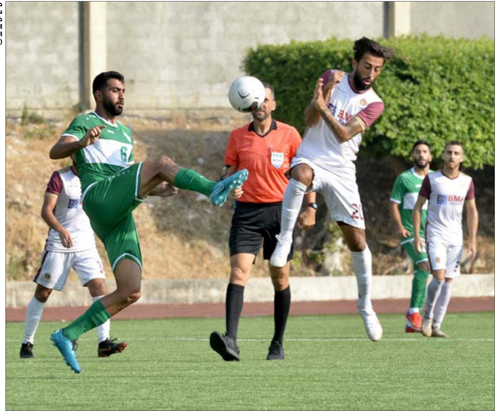
ما بعد الانتصار هو سبب يخلف عن ذلك الذي وضع النجمة خارج القارة الآسيوية (طالك سلمان)

المستندات للحصول على ترخيص، والثاني بتصنيف «ب» وبحسب المعلومات، لم يكن ملف الانتصار مكتتملاً حتى يوم المهلة النهائية لتأكيد التسجيل بحيث احتاج الى إضافة عقد مع طبيب واخر مع مسؤول امني، وهو ما حصل قبل ان يُفاجأ النادي بإغلاق باب إضافة أي تحديث على ملفه الإلكتروني، ما دفعه بحسب المصدر الى إخطار الجهات المعنية المولجة بإغلاق الملف وتأكيد التسجيل قارباً عند نهاية عمل النادي به. وتضيف المصادر الانتصارية إنها اعتقدت أن الأمور تسير طبيعياً ولو أن أي رد أو تأكيد من الاتحاد الآسيوي لم يصلها، مشيرة الى امرين: أولهما أنه كان يفترض أن تكون هناك متابعة داخلية من النادي لمعرفة مصير ما أرسلته الى الشخص المعني، وثانيهما أن هناك مؤشرات إيجابية لإعادة تسجيل الانتصار بحكم أن الأمور واضحة عبر النظام الإلكتروني، والتي تشير الى أن النادي التقى مع القسم الأكبر من المطلوب للحصول على الترخيص.