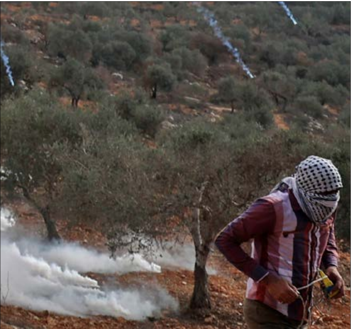
تسلّح بقنّصه محافظات الضفة عمليات إطلاق نار بين فترة وأخرى (ف ب)

منذ بداية 2021 وحتى الآن، قدّمت محافظة جنين أكثر من 14 شهيدا، فيما شهدت المدينة ومخيّمها وحتى