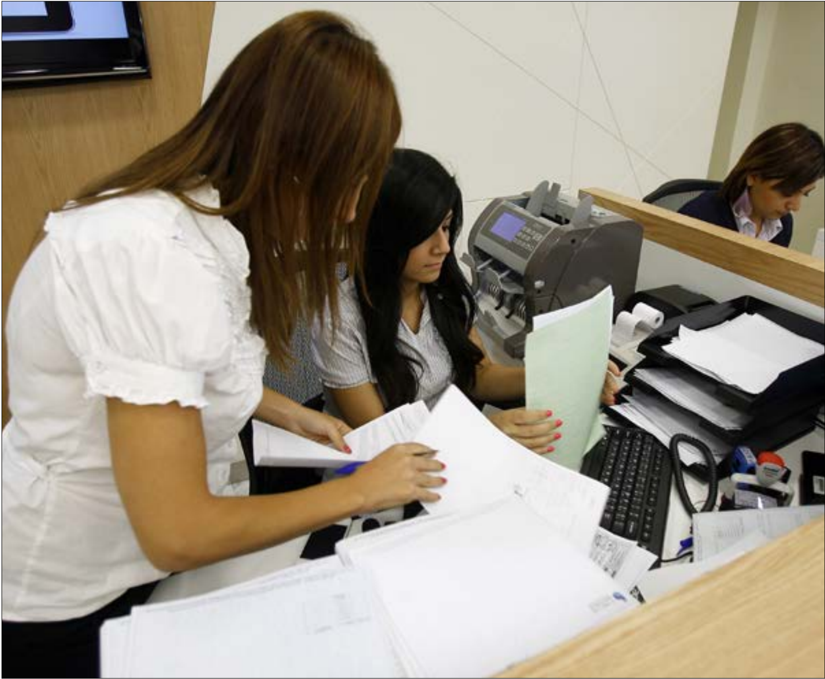
انخفض اعداد الفرع من 1080 إلى 945 بين 2019 و2021 (إرثيف، مروات طحطح)

الوضع «المتناسي» للمصارف أن يستقيل الموظفون بقرار ذاتي منهم، «حتى لا يُعسّر صرناً متسفيماً، فيزيدون الضغوط الوظيفية عليهم، على رغم وجود العديد من الموظفين الراقبين بترك القطاع، إما لسفر أو