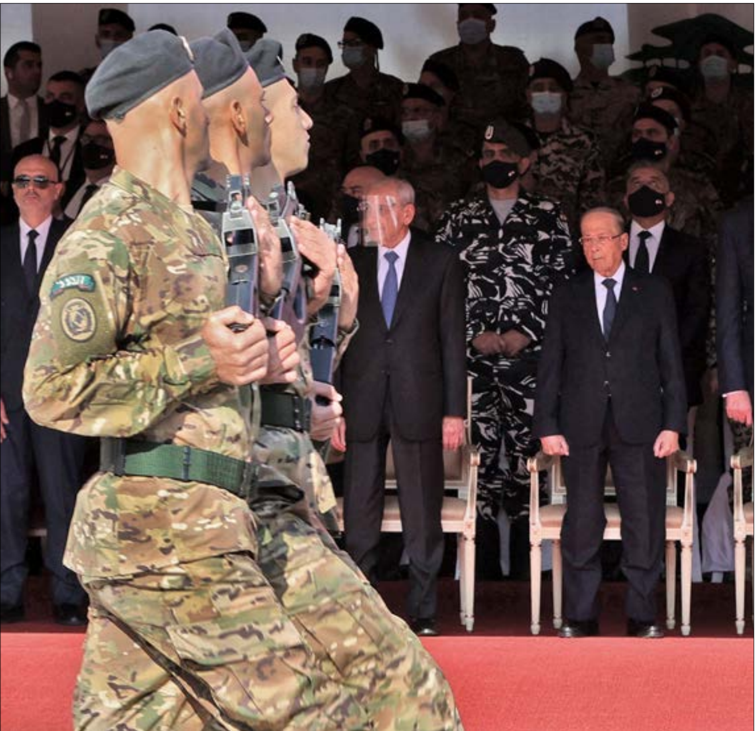
(إف ب ب)

صندوق لـ«تدوير» المساعدات التي كانت مخصصة أساساً كمساعدات لوجيستية وعسكرية. عون حصل على وعد أميركي بإنشاء الصندوق، وأن تساهم واشنطن فيه بنحو 67 مليون دولار يجري العمل حالياً على تدويرها لتحويلها نقدية، إلا أن الجيش لا يزال ينتظر استكمال الإجراءات اللازمة