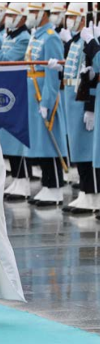
إذ كان ابن زايد سيبارد ضدّ استثمارات كبيرة في تركيا، فلا شك أنه سيطلب بثمن لقاء خطوته

التحضيرية التي قام بها مستشار الأمن الوطني الإماراتي، طحتون بن زايد، إلى تركيا قبل 3 أشهر، والتي رافقها حديث عن استثمارات إماراتية كبيرة في هذا البلد، يدخل ولي عهد أبو ظبي، محمد بن زايد، قصر أردوغان، في لحظة إعادة هندسة للدور الإقليمية، أخذاً بتطورات دراماتيكية، ليس أقلها أهمية الفشل المحتمل للمشروع (حيث كان المليون يساوي دولاراً واحداً)، وبدات تقف قيمتها تدريجياً منذ سنوات، قبل أن تتقهقر بسرعة في الأيام الماضية لتلامس الـ13 ليرة للدولار الواحد، بما يضع الاستقرار الاقتصادي «الإردوغاني» في مهت الريح. ومنذ بداية عهده في عام 2002، حين كان رئيساً للوزراء قبل تحويل النظام إلى رئاسي، أقام أردوغان فلسفته الاقتصادية على مستويات فؤاد متدنية تشجّع المشاريع كبديل للاستثمار في المخترات لدى البنوك، وقاوم ضغوطاً شديدة، وخاصة في السنوات الأخيرة، من المؤسسات المالية الدولية التي يسيطر عليها الغرب، لرفع الفائدة بهدف تامين استقرار العملة، متمسكاً بمقولة إن رفع الفائدة هو إيغال في الربا، ويتعدّد بتركيا عن الاقتصاد الحقيقي المستقر، الذي يساوي استقرار الحكم، اليوم، وتبعاً لنتائج الزيارة