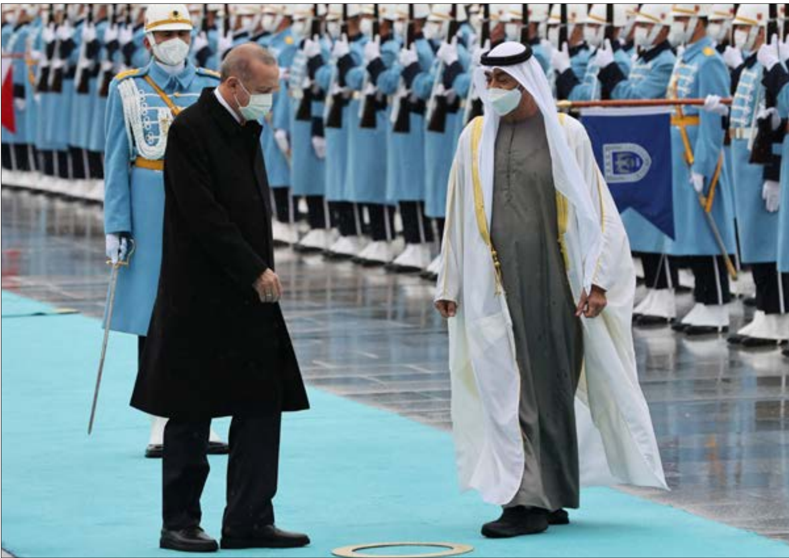
إذ كان ابن زايد سيبارد ضدّ استثمارات كبيرة في تركيا، فلا شك أنه سيطلب بثمن لقاء خطوته

على أساسها التقرير الذي يورّط ابن سلمان مباشرة في الجريمة. في المقابل، لا يعدو «فخّح» ابن زايد التركي كونه بحثاً عن دور جديد «معزّز» بالتطبيع مع إسرائيل، في ظلّ الانتكاسات التي مُنيت بها مفاوضات الإمارات في المنطقة، من البنين حيث اضطرت إلى انسحابات متتالية آخرها إخراج مرزققتها من الخديفة والساحل الغربي تحت تهديد بقصف دبي وأبو ظبي، إلى سوريا حيث كانت الإمارات من أولى الدول التي تُراجع حساباتها وتعيد العلاقات مع حكومة دمشق، إلى قطر التي خسرت فيها مع الخاسرين معركة المقاطعة، إلى تدهور العلاقات بالرياض، وكل ذلك في ظلّ تراجع الضمانات الأميركية لأنظمة