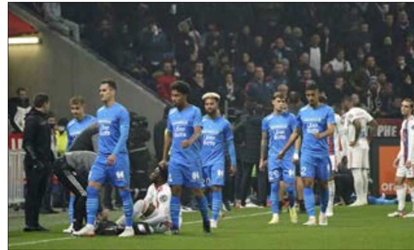
بحث مارسيليا عن الفوز اليوم (فاز)

في المجموعة الثانية، ستحجز وست هام يونايتد الإنكليزي، رابع الدوري الإنكليزي الممتاز، مقعد في الأدوار الإقصائية في حال فوزه على مضيفه رابيد فيينا خلف أبواب مغلقة تماماً بعد أن فرضت النمسا إغلاقاً شاملاً في البلاد مع ارتفاع عدد الإصابات بفيروس كورونا.