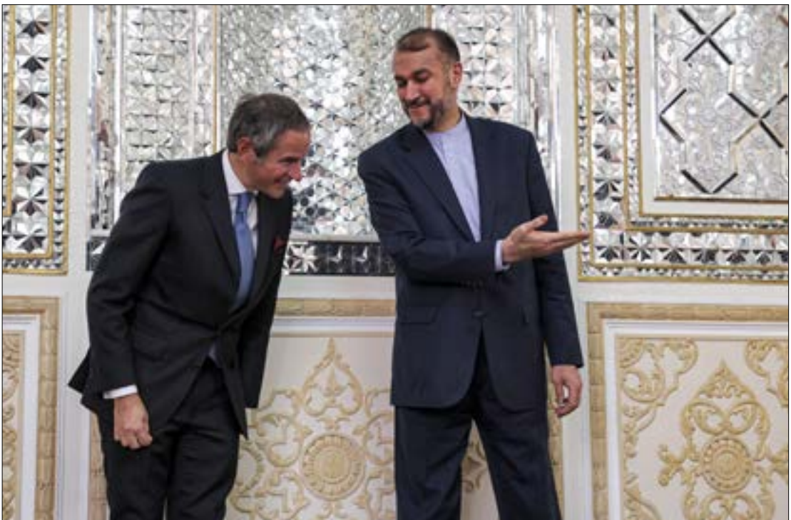
قام مدير الوكالة الدولية رافايل غروسي بزيارة طهران، لبحث القضايا موضع الخلاف

وفي المقابل، يبلغ الطرف الإيراني الأوروبيين أن «طهران تريد التوصل إلى اتفاق، لكن من وجهة نظرها، فإنّ التزامات الطرف الآخر لا يجب أن تبقى حبراً على ورق، بل يجب أن تكون هناك نتائج فعلية على أرض الواقع، وآلا تستمر منظومة العقوبات قائمة تحت ذرائع وحجج أخرى»، بحسب المصدر نفسه.