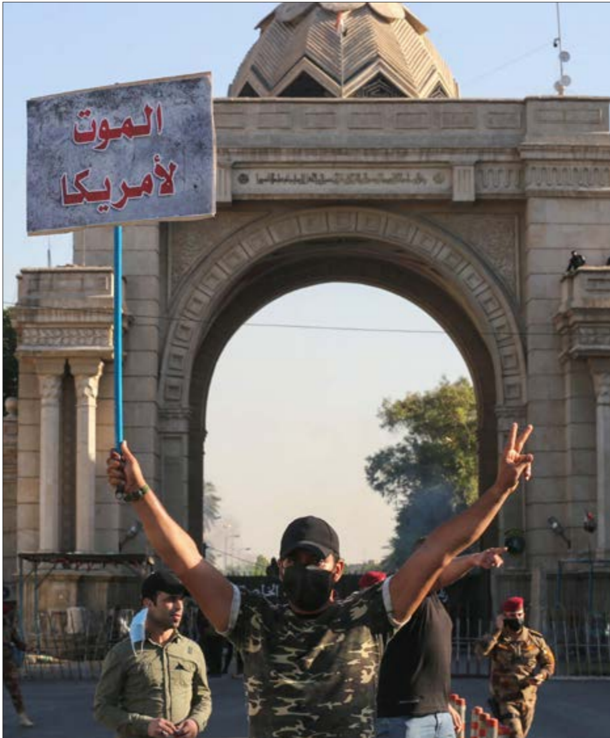
الوضع في العراق بعد هزيمة «داعش»، لم يحدّ يتطلب حضوراً مباشراً ومستمرّاً من قبل قائد «قوة القدس»

بينها. وحتى إذا لم يكن الكاظمي طرفاً بملك صفة الديمومة، لكونه لا يملك حزياً خاصاً، إلا أنه يبقى جزءاً من هذا البيت، حيث نجح في حفر موقع نفسه بالاستناد إلى الموازنة بين القوى السياسية، ولذلك فإنه في موقع يتيح له المساهمة، إذا أراد،