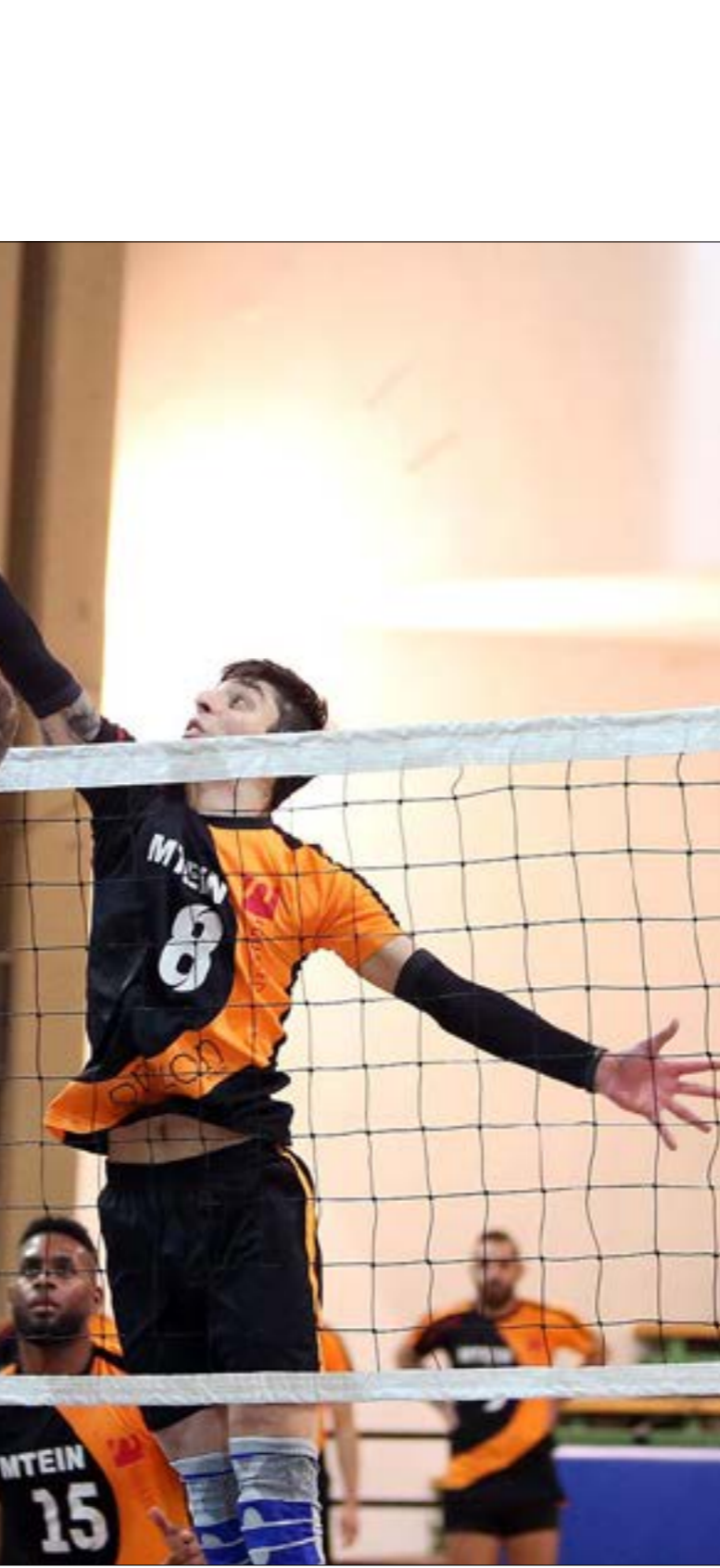
لاعبون من المنتخب اللبناني يلعبون في بطولة العالم لكرة الطائرة