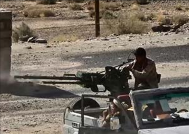
تحدّثت قوات صنعاء، عن السيطرة على عدد من التبايع القريبة من نقطة الالتقاء التابعة لقوات هادي