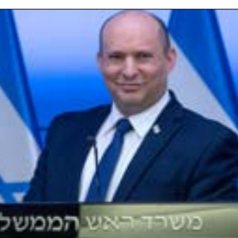
نحنت الحكومة في توجيه رسالة سياسية هامة إلى الداخل والخارج، عنوانها التماسك

ياضار الموازنة العامة في «الكنيست»، الإسرائيلي، تكوت حكومة نفتالي بينت - يائير لابيد قد حصّنت نفسها مرحلياً، بوجه محاولات معارضيها، وعلى رأسهم بنيامين نتنياهو، إسقاطها، كما يكون الكيان العربي، عموماً قد فتح على نفسه باب استقرار، تشدّد حاجته إليه في وقت تعاضم فيه التحدّيات العائلة امامه، لكت ذلك لت يعني، بحال من الأحوال، انتهاء عواطف التازيم المحيطة بالدولة العبرية، سواء من داخل سيجها الاجتماعي، أو من بينها استراتيجيته