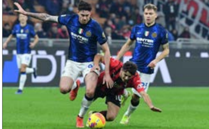
تصاعد إنتر أخيرا مع ميلان في الدربيو (ف ب)

انتهى دريبو «ديلا مادونينا» بالاتحاد الإيجابي (1-1). ليبيض إنتر ميلانو مبيعدا عن الصدارة بـ7 نقاط كاملة. مباراة جديدة اظهرت افتقار منظومة المدرب سيموني إنزاغي عنصر الاستمرارية مقارنة بنصف الموسم الماضي حيث حقق النادي اللأعب وهو ما يدل ربما على فشل مشروع الملك الصيني