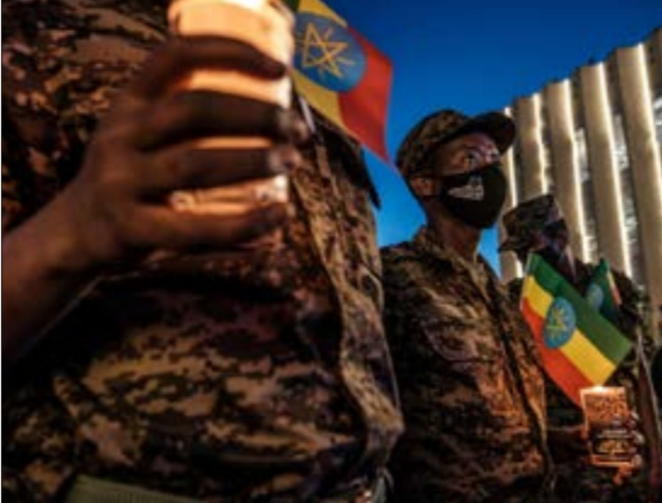
دخلت اليوبيا مرحلة اللاعودة في الصراع مع بيت الحكومة وجبهة «تحريز الشعب تغراي» (أ ف ب)

الأول رئيساً حتى 23 آب 2023، وبعدها يتولّى لابيد الرئاسة ويتحوّل بيئت إلى وزير للخارجية لكن إلى ذلك التاريخ، يمكن أن تشهد إسرائيل والمنطقة الكثير من المتغيرات التي قد تؤثر على تركيبة الحكومة واستقرارها. على أن القدر المتحقّن في هذه المحطّة هو أنها بدّدت رهانات المترصّين بالحكومة من الداخل، وأحببت مساعي نتنياهو لإسقاطها، كما كان همدّ الأخير، وأعدأ بالعودة في أسرع وقت إلى منصبه، وانطلاقاً ممّا تقدّم، فإن سؤالاً أساسياً يُطرح حول ما إذا كان إقرار الموازنة سينترك تداعيات داخل حزب «الليكود»، أو سيؤثّر على مستقبل نتنياهو في رئاسة الحزب، على اعتبار أن خطوة «الكنيست» الأخيرة وما سبّقتها وما سيليها، يؤكّد لهـ«الليكود» أنه ما دام نتنياهو رئيساً له، فلا عودة قريبة إلى رئاسة الحكومة، وأن الطريق إليها مشروط بإزاحته من القيادة، لكن في المقابل، لا تزال استطلاعات الرأي تمنح هذا الحزب الصدارة، على رغم انتقاله إلى صفوف المعارضة.