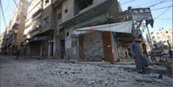
ير يد الجولاني تأميت معابر جبلية من معبر «باب الفحل»

إمرته في مناطق عدّة، وذلك سعيًا منه للانفراد بالسلطة في مناطق سيطرته، وتنفيداً للأوامر التركية التي تخشى تسرّب تلك الفصائل الظهور أمام موسكو بأنها تقوم بـ«عزل الإرهابيين» من جهة ثانية، وعلى الرغم من كون الحملة الأخيرة التي ينقّذها الجولاني ستمهد الأرض أمام تركيا لفتح طريق حلب - اللاذقية، إلا أن ثمة شكوكًا حول مدى قبول دمشق وموسكو بهذه المعادلة التي تقضي فتح الطريق واستمرار إشراف تركيا عليه، بعدما رفضتاه العام الماضي عندما خاض الجيش السوري معارك عنيفة مع الجيش التركي الذي كانت تؤازره «هيئة تحرير الشام»، التي تعتبرها سوريا وروسيا جماعة «إرهابية» للسيطرة على طريق حلب - دمشق (M5)، وانتهت بانسحاب تركيا من الطريق بعد تعرّضها لخسائر بشرية كبيرة، لتسيطر دمشق عليه وتقوم بفتحها.