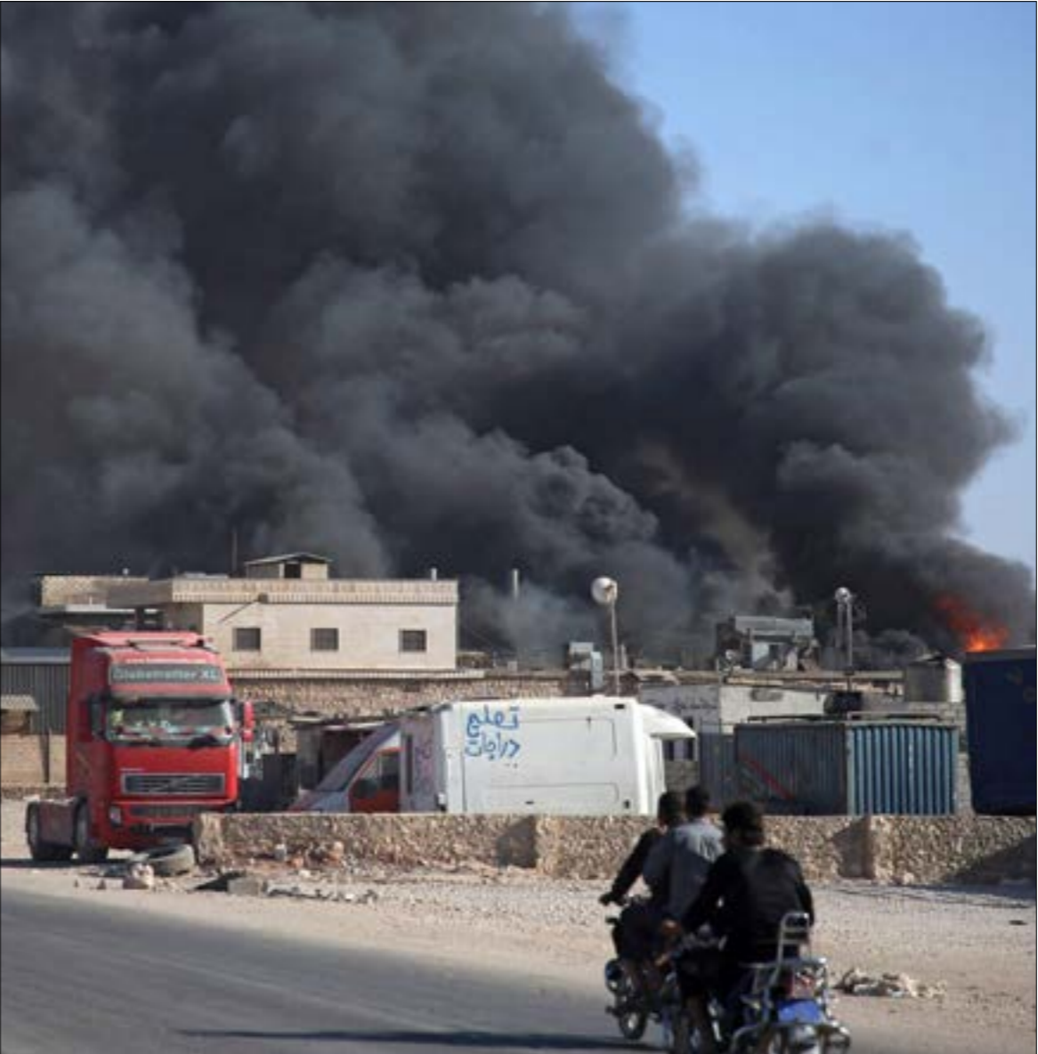
ياتل الهجوم الجديد في سيات، تفاعلت المملّفات المتنبئة بين تركيا والجولاني

يرالون يقاومون في عدّة مناطق، بالإضافة إلى أن عدداً من مقاتلي «تحرير الشام» وقعوا في أسرهم، ما يعني استمرار المواجهات في حال لم تتوصل الوساطات إلى إقناع بقية الفصائل بالخروج من مناطقها وتسليمها لـ«الهيئة».