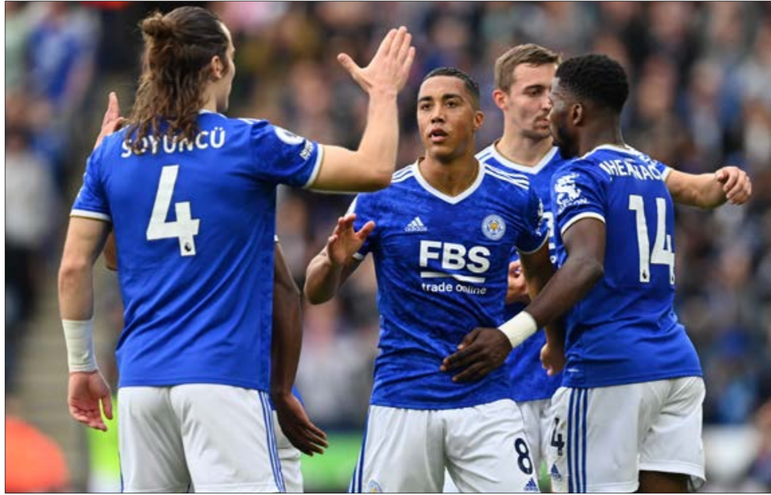
تبلغ قيمة ليستر سيتي حالياً حواليه 548.10 مليون جنيه إسترليني

تخلّى ليستر سيتي ضيق موسمين عن قائد دفاعه هاري ماغواير مقابل 87 مليون جنيه إسترليني لمصلحة مانشستر يونايتد. كادته صفقة قلب دفاع ضي تاريخ كرة القدم. ومع ذلك يتساوم الضربات بالفاط (14) في جدول ترتيب الدوري الإنكليزي الممتاز بدمرور 9 جولاء الثبات والاستمرارية لتعالي ليستر رغم الاستثناء عن أبرز نجوم الفريق في السنوات القليلة الماضية يثبتان مدى حنكة الإدارة وتفوّقهافي عالم كرة القدم