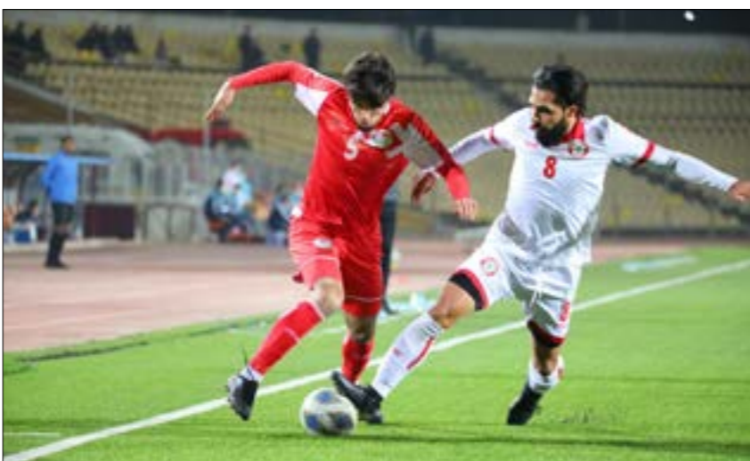
من مباراة لبنان وطاجيكستان

يلتقي منتخب لبنان الأولمبي لكرة القدم نظيره الإيراني، اليوم الساعة 14:00 بتوقيت بيروت) ضمن الجولة الثانية من منافسات المجموعة الثانية في تصفيات كأس آسيا تحت 23 عاماً 2022، والمقررة في أوزبكستان. وكان المنتخب اللبناني قد خسر مباراته الأولى أمام طاجيكستان على أرض الأخيرة بهدف دون رد، في المباراة التي أقيمت بينهما يوم الإثنين على ستاد الجمهورية المركزي في دوشانبي. وتعليقاً على الخسارة قال مدرب منتخب لبنان الأولمبي جمال طه في مؤتمر صحفي إن نتيجة المباراة الأولى تعتبر إيجابية، وأضاف: «عملنا جاهداً للحصول على نقطة»، وأضاف مدرب المنتخب: