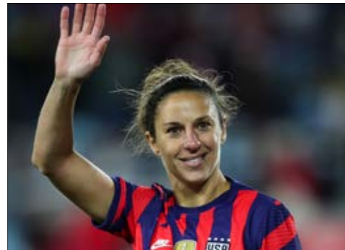
خاضت لويد 316 مباراة في مسيرتها

أعلنت المهاجمة الأميركية المخضرة في كرة القدم كارلي لويد (39 عاماً) اعتزال اللعب على الصعيد الدولي بعد خوضها مبارياتها الوبية الأخيرة ضمن منتخب الولايات المتحدة ضد كوريا الجنوبية (6-صفر). وكانت لويد تحوّل مبارياتها الدولية في مسيرتها وسجّلت خلالها 164 هدفاً، وقد خرجت من المستطيل الأخضر في الدقيقة الـ65 عندما حلت بدلاً منها نجمة أخرى هي الكس مورغان على ملعب «النانز فيلد» في ولاية مينيسوتا. وقامت لويد المتوّجة بليلة للعالم مرتين، والمديالية الأولمبية الذهبية مرتين أيضاً، بتسجيل جميع