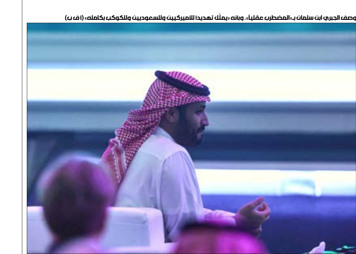
وصف الجبري ابن سلمان بـ«المضطرب عقلياً»، وبأنه يملّ تهديداً للأميركيين وللمسعوديين ولاكوكب بكامله

كفتها بشكل واضح لصالح الجولاني، الذي أراد من حملته الأخيرة إيصال رسالة واضحة إلى «حراس الدين» مفادها: «الطاعة أو القتال». ويختم الجولاني بالصلوع في عمليات الاعتقال التي تطال المرتبطين بـ«القاعدة»، من خلال التعاون الاستخباري مع الجانب الأميركي، والذي يحقّق لرّعيم «تحرير الشام» هدفين: الأول تصفية كبار شخصيات التنظيمات المنافسة له، والثاني تحويل هذه الشخصيات إلى قرابين للعلاقة المفتوحة التي يريدها مع الأميركيين، بما ينهي وجوده وتنظيمه على لأئحة المنظمات «الإرهابية»، ويجعله جزءاً من مشروع «القدرة»، وفي هذا السياق تشديد، يمكن فهم الحملة الأخيرة للجولاني ضدّ خصومه، والتي يامل أن ترفع رصيده لدى واشنطن على طريق تسميته «جنرالاً» من قبل الأخيرة، ليقود «إدارة ذاتية» لشؤونها في الجولة الحالية، موازية في شمال غربي سوريا، أسوة بمظلم عبيد الذي كان عضواً في تنظيم «حزب العمال الكردستاني» الموضوع على لأئحة التنظيمات «الإرهابية»، ويعدّ التعامل معه من الناحية القانونية مطابقاً للتعامل مع الجولاني.