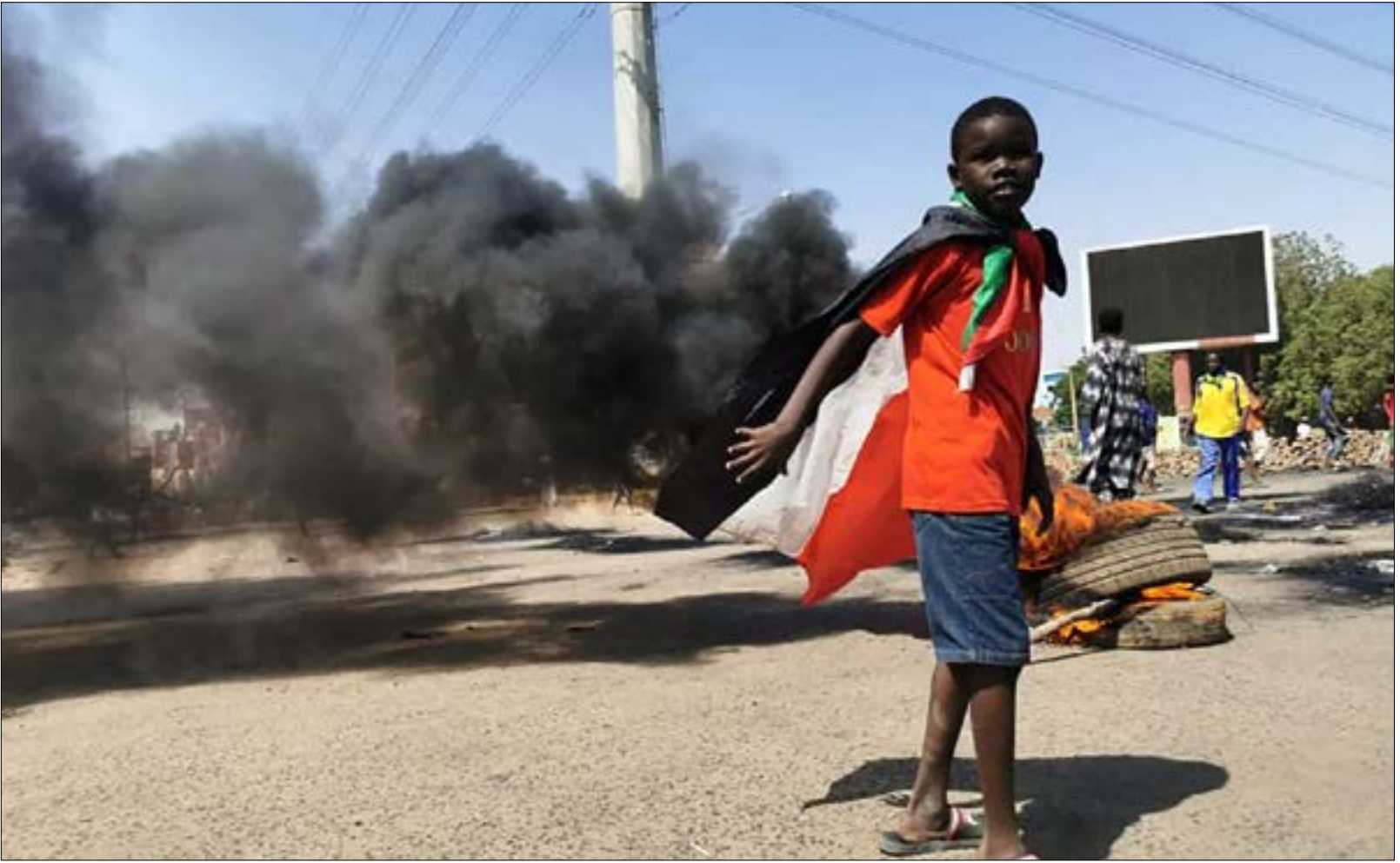
يشكك الجانب الإسرائيلي في قدرة المستوي المدني على توفير «بضاعة التطبيع، المطبوخة من السودان

وللدلالة، كشف الإعلام العبري، في حزيران الماضي (موقع «الآلا»، عن «فتعاض» شركاء الحكم الانقلابي السابق، من المدنيين، جزاءً حصّر إسرائيل علاقاتها بالسودان، بالجيش والاستخبارات في