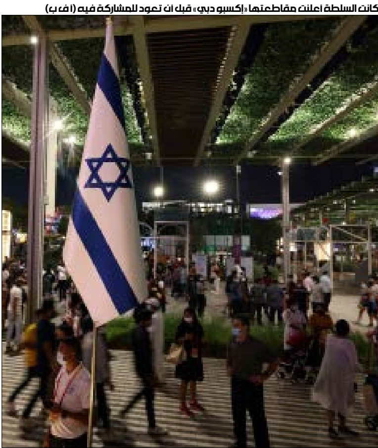
كانت السلطة أعلنت مقاطعتهما «إكسبو دبي»، قبل أن تعود للمشاركة فيه

دبي»، فيما أفادت مصادر من السلطة، «الأخبار»، بأن المسؤول الفلسطيني بحث مع ابن راشد عودة العلاقات مع توقيع اتفاقية التطبيع الإسرائيلي - الإماراتي، بسحب السلطة السفير الفلسطيني من الإمارات، ورفضها استقبال مساعدات أرسلتها أبو ظبي خلال جائحة «كورونا»، كذلك، قرّرت السلطة مقاطعة معرض «إكسبو دبي»، قبل أن يتمّ أخيراً الكشف عن الجناح الفلسطيني في المعرض، بينما التزمّت رام الله الصمت، باستثناء نشر «وفا» إعلان مشاركة الجانب الفلسطيني الرسمي، وكانت «حركة مقاطعة إسرائيل» (BDS) طالبت السلطة بمقاطعة المعرض، معتبرة «أي مشاركة فلسطينية أو عربية، رسمياً أو شعبية، في المعرض - الذي يحتفي بحرارة جناح إسرائيلي تشرف عليه وزارة خارجية الاحتلال لأول مرّة في أرض عربية - تواطؤاً وتشجيعاً على التطبيع الرسمي بين بعض الأنظمة العربية بطرق الاستبدادية والعدو الإسرائيلي».