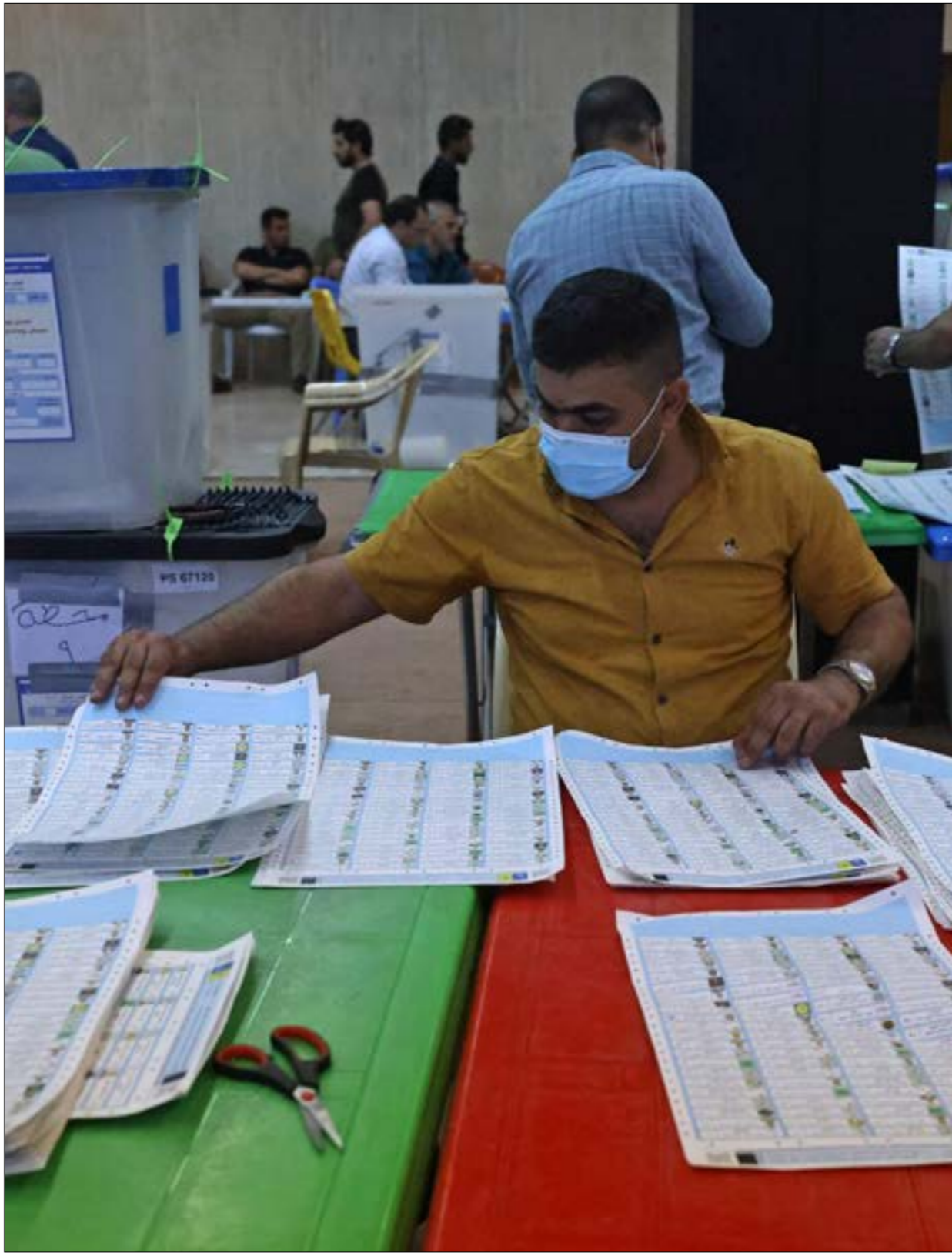
سبّحه المراف (إلى دومة جديدة من الصرامات باعتبار النافس متقاربا

نتيجة مختلفة. وعلى أي حال، فإن نتيجة الانتخابات لا يمكن أن تسوّغ نقل العراق من موقع إلى موقع آخر، كما لا يمكنها، في المقابل، أن تعود به إلى الوراء، بما يؤدي، مثلاً، إلى اختيار مرشح لرئاسة الحكومة كرئيس ائتلاف دولة القانون، رئيس الوزراء الأسبق نوري المالكي، الذي يواجه بمعارضة قوية من داخل البيت الشيعي، وخصوصاً من الصدر، ومن المرجعية الدينية ليس تبدلاً في المزاج السياسي، بقدر ما هو عوامل موضوعية، من مثل قانون الانتخاب، وأخرى ذاتية على رأسها التنشيط الكبير الذي أصاب الأذرع السياسية له الحشد الشيعي،» وأدى إلى تشتت أصواتها، في مقابل التنظيم ووحدة القيادة لدى التيار الصدري، والذين أديا إلى رفع حصته من مقاعد البرلمان. عدا ذلك، فإن الأصوات التي حصلت عليها الأحزاب تبدو عملياً متقاربة مع ما حصلت عليه في الانتخابات السابقة،» غير أن القانون المختلف (الدوائر الصغرى والصوت الواحد) أدى إلى