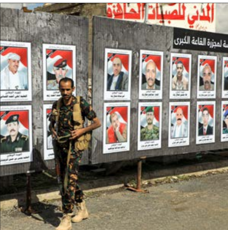
تطمئن صنعاء، زعماء القبائل الى نيتها اشرافهم في ادارة مناطقهم

وتجلب هذه التطورات نجاعة النشاط الاستخباري لقوات صنعاء، التي استطاعت كسب وذ