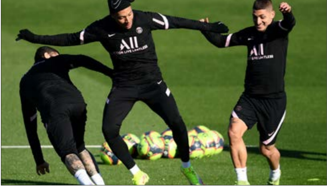
يلعب مبابيه فرقهه عن رغبته بالرجيك (ف ب)

بنقطتين وضيغه سبورتنج العاشر بنقطة واحدة في التوقيت عينه على ملعب صور. وتقام غدا السبت مباراة واحدة على ملعب جونيه عند الساعة الرابعة عصرأ وتجمع الحكمة الثالث برصيد ست نقاط مع العهد الوصيف بفارق نقطة واحدة عن الحكمة. ويحتتم الأسبوع الرابع بعد غن الأحد حيث يلعب شباب الساحل المتصدر بسبع نقاط مع شباب البرج الأخير بنقطة واحدة على ملعب العهد عند الساعة 15:30، كما يلعب في التوقيت ذاته الأنصار السادس أربع نقاط مع الإخاء، الأهلي عليه الحكمة. ويحتتم الأهداف عن الأنصار على ملعب بحمدون. أما آخر المباريات فستقام على ملعب جونيه عند الساعة الرابعة بين النجمة الرابع بخمس نقاط والبرج الخامس بفارق الأهداف عن خصمه.