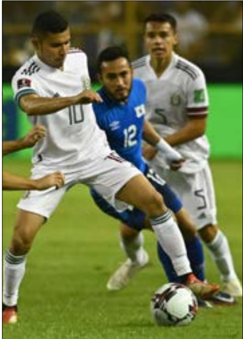
حافظت المكسيك على الحدارة بعد الفوز على السلفادور

على رأسهم المهاجم نيمو فرينير الذي وجد طريقه إلى الشباك أخيرا.