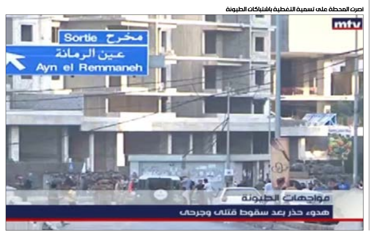
أفردت المحطة على تسمية التغطية بالشتباكات الطيونة

مرفأ بيروت، سنّت mtv، هجوماً لا مفضل له كان الأعتف على «حزب الله». اتهمته بـ «مصادرة» الاقتصاد والأمن والعسكر، والقضاء، وإحكام سيطرته على البلاد. عادت وكررت سرديّة عدم توجيه الحزب أي رصاصه ضد العدو الإسرائيلي،