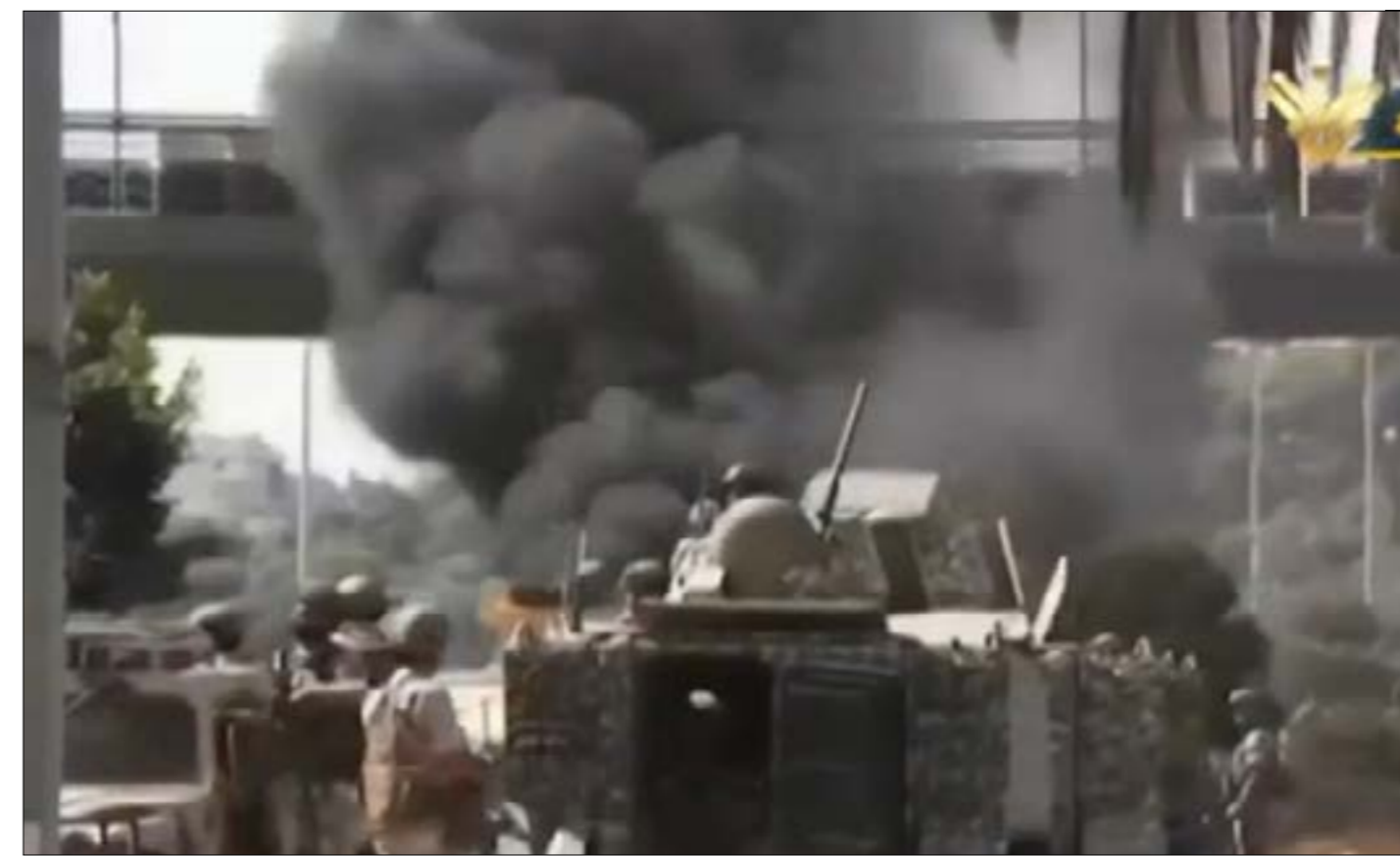
أفردت «النصار» مقدمة نشرة أخبار نارية واتهمت «القوات» بالضلوع خلف جريمة الطيونة