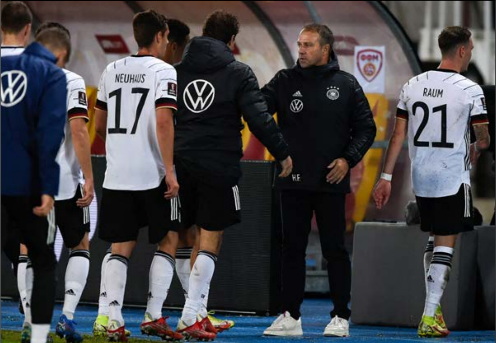
كان المنتخب الألماني أول المتاهلت إلى مونديال قطر عبر التصفيات

غوارديولا، ماوريسيو بوكيتينو مدرب بايريس سان جيرمان، مدرب تشيلسي توماس توخيل... نظراً لإشراف هؤلاء المدربين على اللاعبين الألمان الموجودين خارج