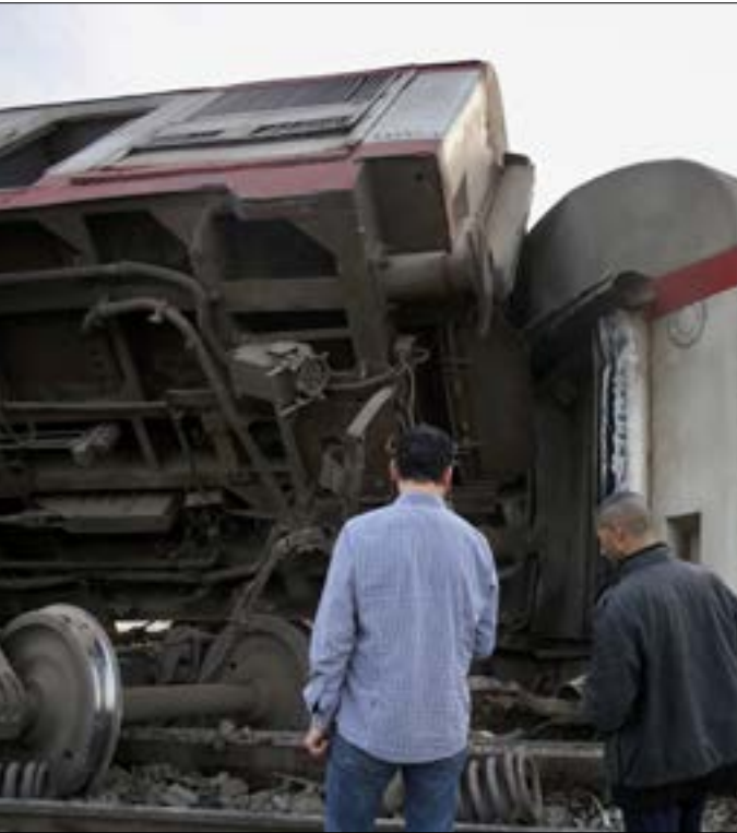
الاهمال هو السبب في حادثه امس وحادثه قطار الزقازيق قبله

فهو يدفع بمساعدته إلى الاستقالة ككيش فداء مع تقاعدهم بكامل مستحقاتهم. وهكذا، يبقى كامل الوزير يتقد سياساته التي يراها صائبة، مُخفلاً دائماً نظام محمد حسني مبارك تركة الإهمال والبدل من وجهة نظره هو الإيقاف الكامل للسكك التي تنقل 420 مليون مواطن سنوياً حتى انتهاء التطوير من أجل وقف الحوادث!