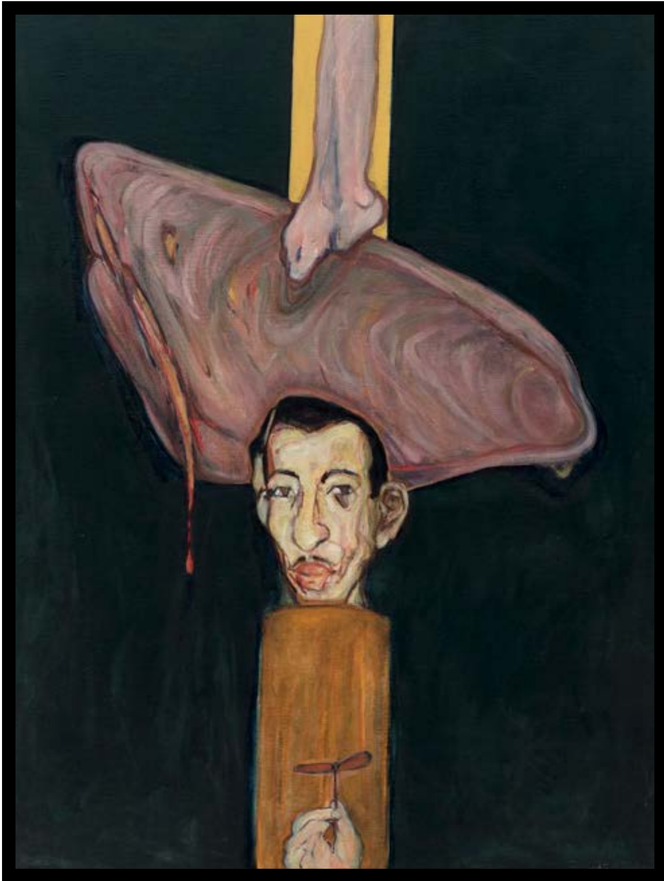
بورتريه (1966) لبدر شاكر السياب بريشة المعلم الراحل مروان قصاب باشي