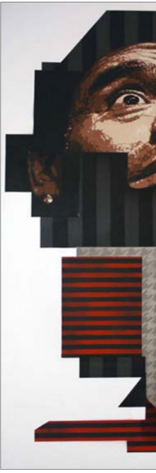
اورتينكاهولمز—مارادونا،(إدراك الطاء، وقلع رضاح على ورق 100 × 70 سنتم - 20١2)

وانتقا من وجود الأفلام في العالم الآخر، أو ربما تقتصر على قاطني الجنان العليا، إلا أنني أتق في وجود الروايات وتوفرها للجميع، ولذا لا أحمل همها، ساصطحبها معي إلى العالم الجديد وسيدع الروائيون مؤلفات جديدة، سواء سكنوا الجنة أو النار وستناولها الجميع في ما بينهم. سالتها «تظنين أنها القيامة الأخيرة؟»، فهزّت كنفِها وأشارت لي أنها لا تفهم، حكيت لها أنني في طفولتي المبكرة لم أكن مدركاً لما يحدث حول الفراغنة إلى عرب ثم إلى ممالك ثم إلى ما أصبحنا عليه وقتها، أضاف إلى ارتباكِي التحايين الشديد بين الصور التي شاهدتها لكل منهم، سواء على صفحات الكتب المدرسية أو في بعض الأفلام، إلى حد معنعي من تصور أن تطوراً طبعياً دفع بأولئك ليصبحوا هؤلاء، وببؤلاء ليصبحوا نحن. ولكن في حصة الدين، أخبرتنا المدرسة العجوز ذات القامة القصيرة والحجاب الأصفر اللون والتجاعيد المنتشرة عن يوم القيامة، وددت لو أستفسر منها أكثر واستزيد من علمها بخصوص ذلك اليوم، لكنني كنت أخافها وأجنب الحوار معها، وجهها المخطط بالتجاعيد كان مربعاً لي، وخصوصاً ما كنت أجلس في الصف الأمامي حيث دونما تفاصيل خلقها أكثر وضوحاً مما ينبغِي. في ذلك اليوم، تصورت أنني وصلت إلى إجابة سؤالي الأول، فلا