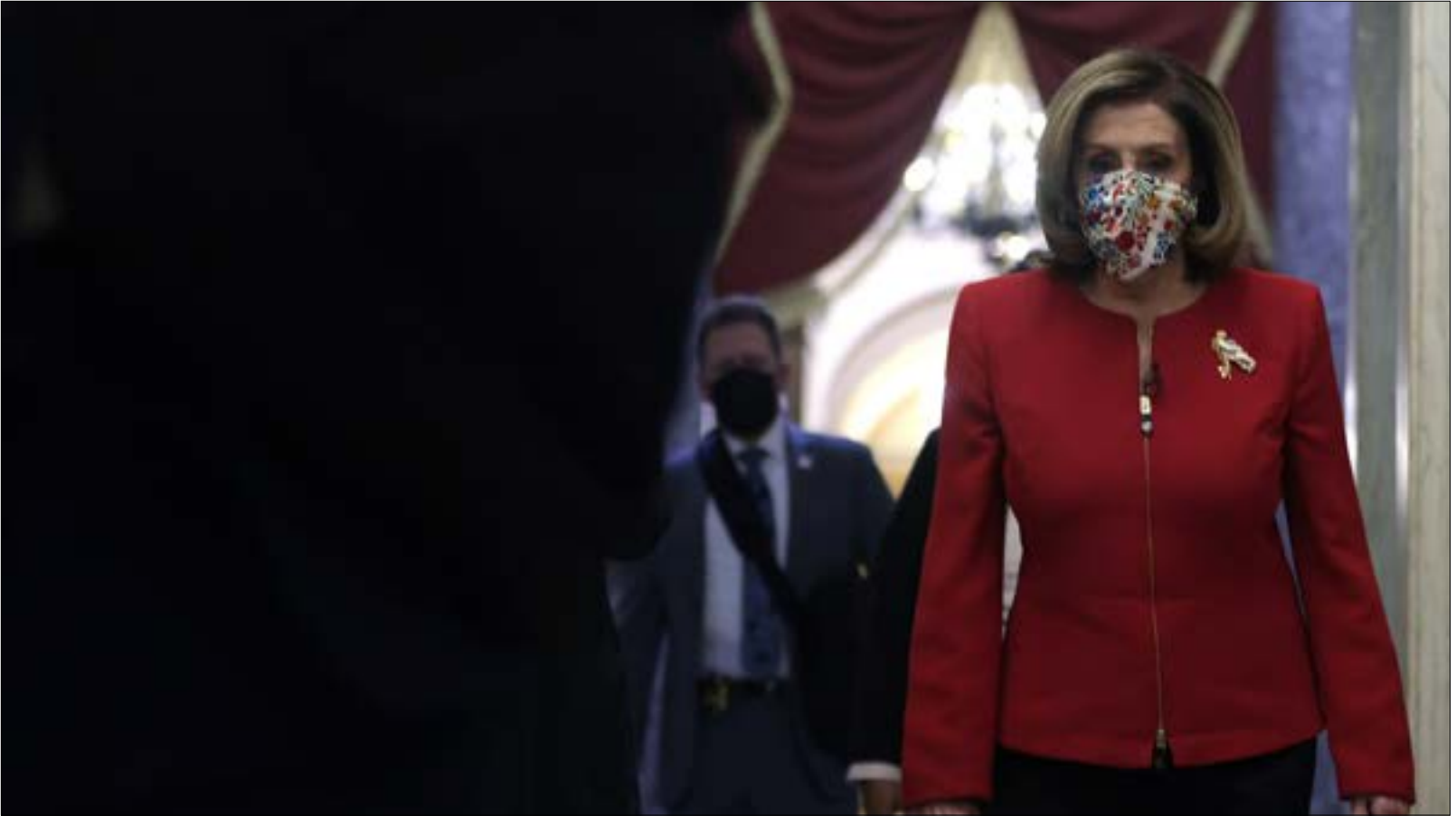
أعلنت بيلوسي، أنها تواصلت مع الجيش للتأكد من أنّ ترامب لن يكون قادراً على استخدام الرصاص النووية ( ا ف ب)

ثانياً، يمكن مجلس الشيوخ، بكل بساطة، أن لا يُجري محاكمة، وذلك وفقاً لما نقلته «واشنطن بوست» عن الخبير القانوني جوش شافيتز. أمّا في حال قرّر المجلس إجراء محاكمة والتصويت على إدانة الرئيس، فإنّ ذلك سيطلب موافقة ثلثي الأعضاء من أجل الموافقة على الإدانة، ما