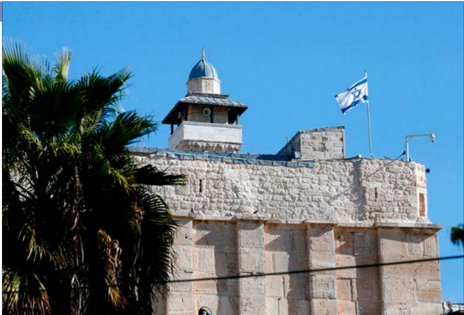
يحلل اليهود منطقة حساسة ببيت لحم والقدس، ما يغيّر طبيعة المكان وديموغرافيته

تصنّف في هذا الاتجاه تصريحات رئيس المكتب السياسي لـ«حماس»، إسما عيل هنية، في ترشيحها بالمصالحة الخليجية حين قال إن «أي مصالحتات في المنطقة تصب في المحصلة الأخيرة في مصلحة القضية الفلسطينية، وتنعكس إيجاباً علينا». لكن يرى مراقبون أن تراجع الحركة ومواقفتها على إجراء الانتخابات بالتالي بعدما كانت تصر على إجرائها بالفرمان هو جزء من قراءة الحركة لتبعات المصالحة الخليجية، وذلك خشية منها أن تكون هي المستهدفة قريباً، وأن يكون هذا الاتفاق على