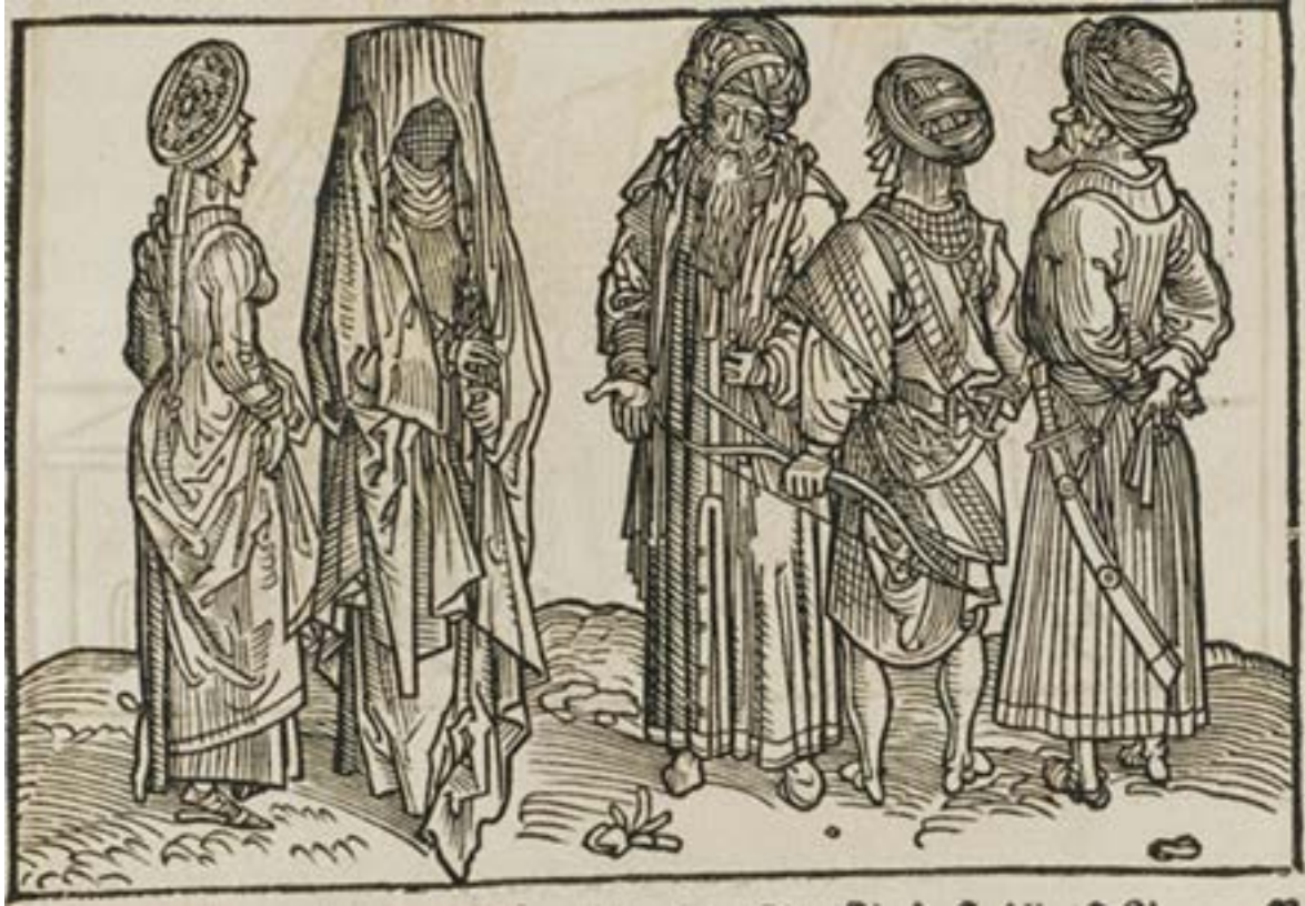
حضر الماني على الخشب من القرن الخامس عشر في المانيا