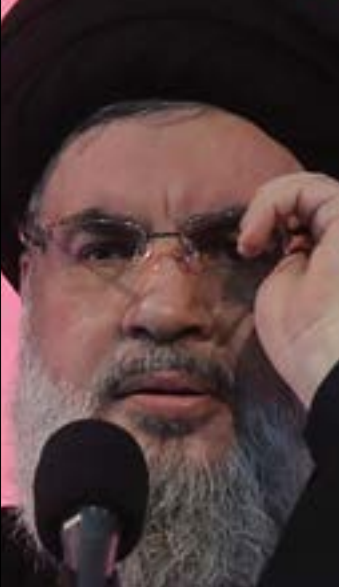
ادعو الى ايقاف الهولك لدع القرض اللبناني، أكثر (هيلم الموسوي)

وفي إطار توضيح «تشويه المواقف» التي يُدلي بها، عاد نصر الله إلى خطابه الأخير حين قال إنّ الاهتمام الدولي والإقليمي بلبنان مرده وجود المقاومة وصواريخها. «نحترم كل الرود، ولكن أتمنى حين اتكلم بالشرق أن أجاب بالشرق وليس بالغرب»، مُعيداً التوضيح أنّ كل ما يحصل داخلياً، «أقلّه منذ انسحاب القوات السورية من لبنان»، من اهتمام أوروبي وأميركي وغربي، وحاضر الجلسات، والبيانات في الإعلام، والقرارات، «كلّها محوراً الأساسي مُقدرات المقاومة وكيفية معالجة الملف لمصلحة «إسرائيل». ولو كان لبنان يعني للاستمركيين والأوروبيين بعض الأفضلة العربية شيئاً، لما كانوا منعوا عنه المساعدات وفرضوا الحصار».