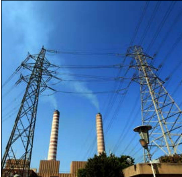
سوناطراك تطلب 18,6 مليون دولار تعويضاً (ميسم الموسوي)

السابقة والمقدّرة بـ 3,2 ملايين دولار. وفي حال عدم تحقّق هذين الشرطين ستلجأ إلى التحكيم في دعوى الإساءة إلى سمعتها. لكن فيما يتم تناقل هذه المعلومات بين العاملين في القطاع، فإن الوزارة تتحفّظ على الإدلاء بأي معلومة تتعلق بالموضوع «نظراً إلى حساسيته». أما بشأن الدعوى القضائية التي رفعتها «كهرباء لبنان»، فإن مصادر قضائية تشير إلى أن هذه الدعوى صارتت بعد القضاء وسيكون هناك صعوبة، حتى لو أرادت المؤسسة، في سحبها، لكونها تطال الحق العام. أما بالنسبة إلى شركة «سوناطراك»، فهي تعوّل على سحب الدعوى نظراً إلى ما تشكّله من ضرر للشركة الأمّ، التي ترى أن المشكلة تتعلق بالشركة التي تعاقدت معها أي ZR energie، علماً بأن الدولة اللبنانية غير مرتبطة بأي عقد مع الأخيرة، وبالتالي فإن المسؤولية تقع بالنسبة إليها على شركة سوناطراك BVI الذراع التجاري لسوناطراك.