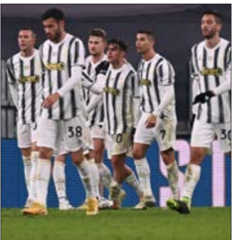
لاعبين يوفنتوس افضل اياهم حالياً

ولم ينق ميلان طعم الهزيمة في آخر 12 مرحلة من الموسم الماضي، وتحديداً منذ السقوط أمام جنوى رونالدو ورفاقه في فريق المدرب أندريا بيرلو نفس المستوى الذي ظهروا به الأحد أمام أودينيزي (1-4). وسيكون رونالدو الخطر الأكبر على ميلان بعدما سجل 14 من الأهداف الـ29 لفريق «السيدة