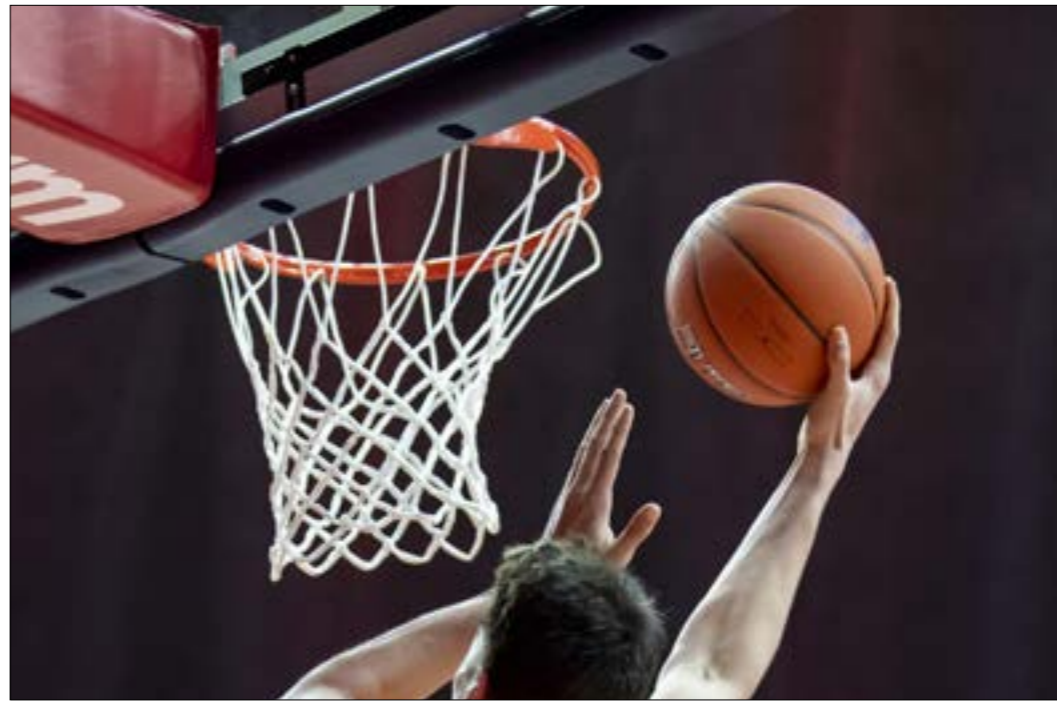
شهدت رياضة كرة السلة ثورة في عالم الأرقام والإحصاءات عام 2010