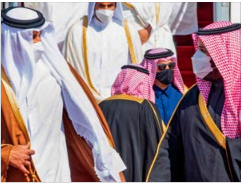
مصرياً، هناك من يرى أن قطر لم تفز حتى الآن على السعودية فقط بل على «الرباعي»، (أ ف ب)

قطر وتديرها، وذلك بعد تأخر دام سنوات وعراقيل حكومية وضعت أمام المشروع، في وقت يجرد فيه إعلان عودة العلاقات الدبلوماسية كليا مع «الرباعي» جاء في المؤتمر الصحافي لوزير الخارجية السعودي، فيصل بن فرحان، من دون توضيح أي تفاصيل، علماً بأن القاهرة استجبت بأقوى دول الخليج بإجراءات تخص الدوحة قبل المقاطعة. ورغم تأخر مصر في إعلان فتح الأجواء أمام الخطوط القطرية، إلا أنها استقبلت أسس أول رحلة مباشرة من الدوحة بطائرة خاصة حملت وزير المالية القطري، على بن أسد العمادي، من أجل المشاركة مع نظيره الأميركي، ستيفن منوتشين، والمصري، محمد معيط، في افتتاح أحد الفنادق الكبرى في القاهرة التي تمتلكها