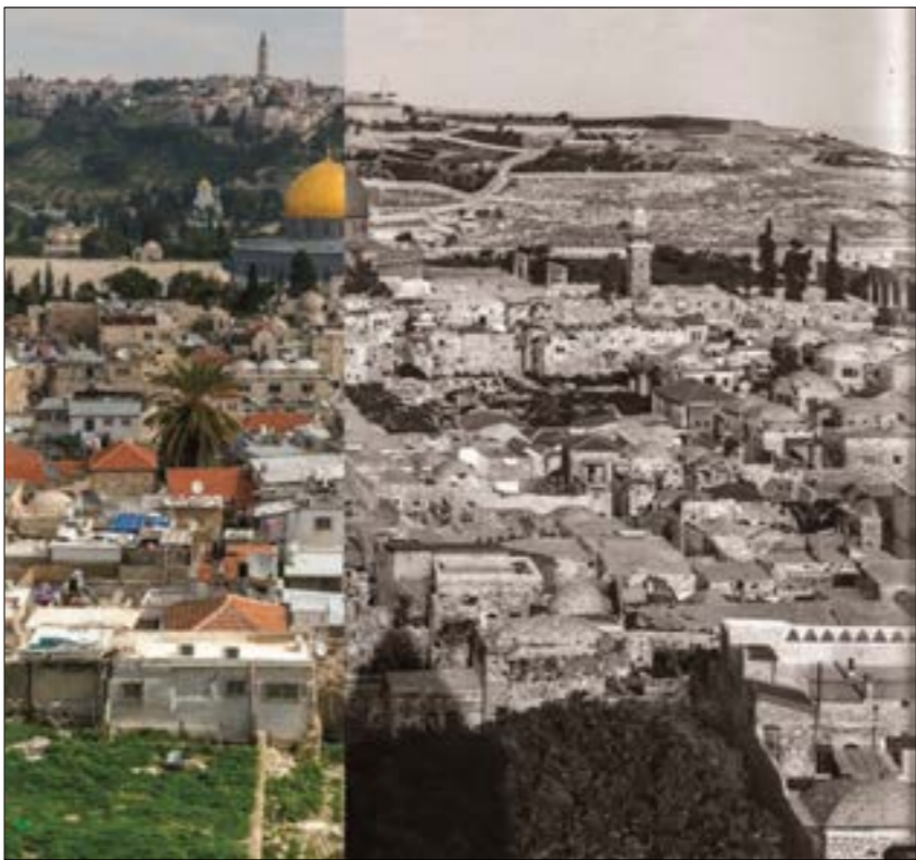
جاءت برسكيات (رواق القدس) - 50 x 38 سنتيم - 2018

فيها أيضاً. الدراسة الثانية، خصصناها لقراءة نقدية في كتابات الباحث العراقي فاضل الربيعي، وهو من القائلين بيمينية الجغرافيا التوراتية. لقد خصصنا لبعض مؤلفاته دراسة خاصة، نظرا إلى عززارة نشاطه التأليفي وانتشاره، ما يجعل نقدها