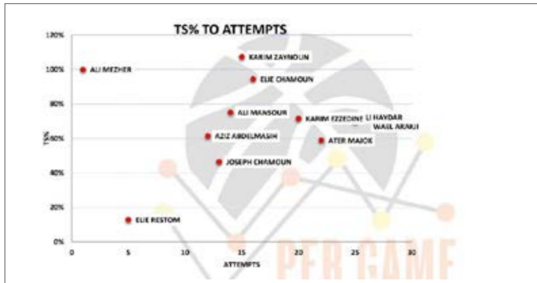
مبينة من الإحصاءات التي يتم تسجيلها وتحليلها (per game analytics)

ويبدو كرة...» الهدف من هذا العمل ليس المراقبة النظرية وحسب، بل هو استخراج الداتا لكل لاعب، وتسجيل ماذا حصل في كل مركز بالمقاييل، وبلغته الأرقام هذا يسمى player impact estimate أي تقدير تأثير كل لاعب في مركزه، كما دراسة نقاط القوة والضعف. استفاد سعادة من التجارب التي