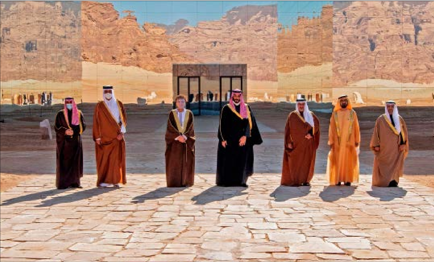
طوت بقمة الفلا، مرحلة عمرها ثلاث سنوات ونصف سنة من الخصومة بين قطر وجيرانها

عادت المياه الخليجية إلى مجاريها، لتفتتح مرحلة جديدة ستعزدي ملامحها مع انتقال العلاقات بين دول مجلس التعاون من الخصومة الشائمة إلى تعاون لا يزال من المبكر معرفة أفقه. تعاونٌ سبغ كل مرحلة تحولات متسارعة ما فتئت تشهدا المنطقة منذ أن قادت الإمارات، الصيف الماضي، قافلة التطبيع مع العدو الإسرائيلي للوصول بها إلى محطتها الأخيرة: السعودية. الخطوة «الحتمية» هذه، كما صيغها عزاب صفقات «السلام»، جاريد كوشنر، تحتاج إلى بعض الوقت