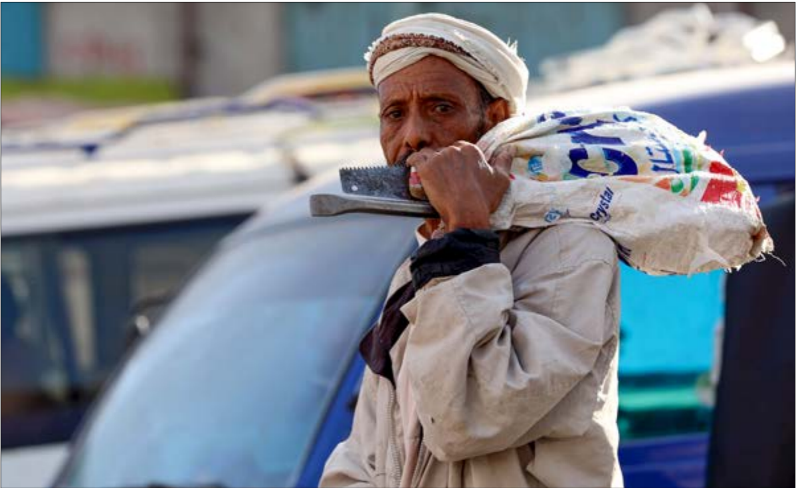
تسببت الفرصة البحرية التي يمارسها «التحالف»، بإزمة إنسانية في مناطق سيطرة «الانقاذ»

العدوان، في بيان صادر عنه السبت الماضي، أن قواته البحرية عثرت على لغم بحري نشره الحوثيون جنوب البحر الأحمر للتهديد الملاحة الدولية، والديزل، والالتزام بعدم إعاقة مرور السفنات التجارية التي تخضع لألية التفتيش الامنية في جيبوتي وفق القرار الدولي 2216 وحصولها على