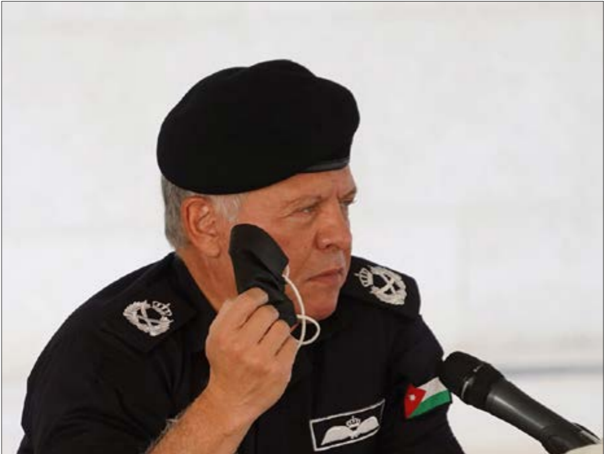
مقر عبد الله ملك فئة المروحة والنقّم باتجاه الخطوات الإماراتية والبحرانية (أ ف ب)

إقليمياً، فيما تنضمّ البحرين إلى الجوقة التي لطالما أدّت عمّان دوراً أمنياً فيها منذ اندلاع الحراك البحراني، إذ لا ينسى أحد مساهمة الدرك الأردني في إخماده، وأبو ظبي، التي «ضمنت» بهذه الخطوة مملكتين في المنطقة، تلعب على المكشوف خياراتها الخاصة بعيدا عن الرياض (ما نفتحت التسريبات الأخيرة عن انتقاد الإمارات لولي العهد السعودي محمد بن سلمان)، كأنها تحاول الخروج من الشراكة معها على أكثر من جبهة، سواء الحرب على اليمن أو العلاقة مع إسرائيل أو دول الطوق الفلسطيني وحتى في الموضوع السوري، وصولاً إلى القضية القطرية المكلفة لها. وفي القضية الأخيرة، يبدو موقف عمّان دافعاً إلى التقارب مع الدوحة