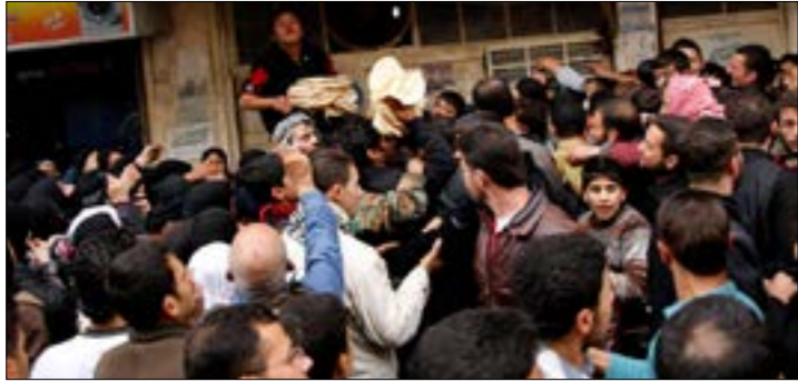
تصفّع الطوابير امام الافران للحصول على الخبز

الخبز يستهلك جزءاً مهمّاً من دخل السوريين، ولم يعد الحصول عليه بالنسبة إليهم أمراً سهلاً أبداً، وعليه هم يترقّبون خطوات الحكومة في المرحلة المقبلة لتأخية رفع أسعار الغاز والكهرباء. وفي هذا الإطار، يفيد مصدر مطلع «الأخبار» بأن «استهلاك سوريا اليوم من الكهرباء يبلغ ربع استهلاكها في عام 2011، ما يعني أن كلغفة الدعم على الطاقة الكهربائية منخفضة، ومع ذلك، لا تزال سوريا تواجه مشكلة مالية خطيرة بهذا الخصوص»، معتبراً أنه «ليس أمام الدولة من خيارات إلا الذهاب إلى السوق السوداء، وفي هذا الإطار، تشير بيانات «مركز التجارة الدولي» (ICT) إلى تصدّر الهوانف الذكية قائمة المستوردات السورية لعام 2019، وتوضح البيانات أن «الكتلة الأكبر من المستوردات السورية كانت من المعدات الإلكترونية، وبلغت 259 مليون دولار، منها 241 مليون دولار من دولة الإمارات العربية المتحدة، معظمها أجهزة هاتف للشبكات الخلوية، وهي تتعامل المستوردات الحبوب والسكر مجتمعاً في عام 2019، حدث وصلت إلى 138 مليون دولار للارز والقمح والطحين والذرة، و120 مليون دولار للسكر».