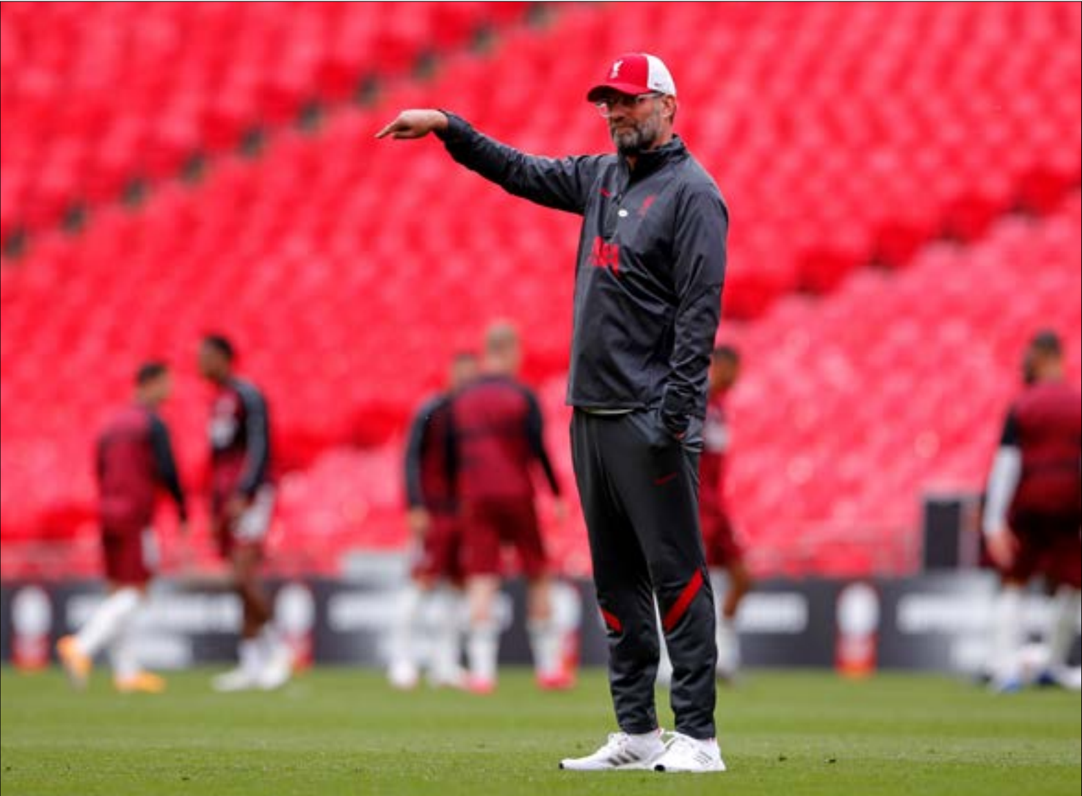
لم يدعم يورغن كلوب صفوف فريقه بالشك المطلوب

- مونako X نانت 18:00 - باريس سان جيرمان X مارسيليا 22:00