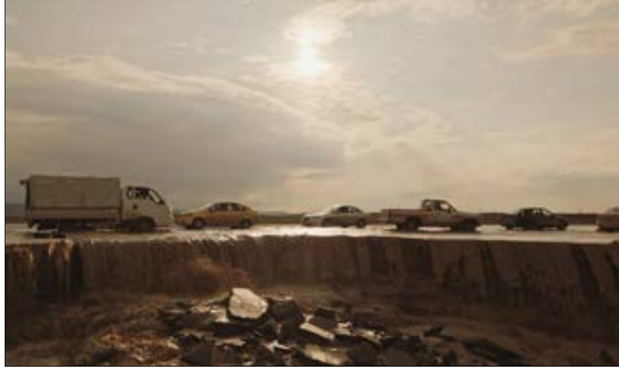
مشهد من «ليك»

لمسة روسي ظاهرة طوال الفيلم. في الطبيعة، هناك مشاهد فظيعة، ولكن المشاهد الأخيرة، ربما تكون أقوى لحظات الفيلم. عندما نفهم أنّ الأطفال في المدرسة شاهدون على أشياء فظيعة حصلت أمام أعينهم، الأطفال المصابون بصدمات نفسية هم قنابل موقوتة. نحن لا نسمع القصص ولا روسي يدع الأطفال يخبروننا عن تلك الفظائع. بدلاً من ذلك، يصفغنا بالرسومات التي خطها هؤلاء الأطفال والمعلقة على جدار المدرسة، كجزء من الديكور. جزء من واقع يروونه كل يوم، يكشف ما رأوه من دون أن نراه ونسمعه. رسومات منمنمة ملونة بالدم والأسلحة والموت.