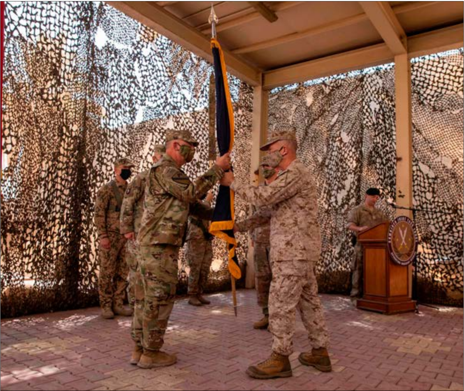
تسلّم القائد الجديد لـ«التحالف الدولي»، الجنرال بول كافير، مهمّاته أول من امس

عناصر ناشطة لتنظيم «داعش» إلى جانب أنها ستُبقى على وجود عسكري محدود في سوريا. ويسعيه إلى ترسيخ معادلة تفهده في الإقليم، يكون الرئيس الأميركي قد حقّق اثنين من أهداف برنامجه الانتخابي: أولهما، دفع حلفائه الأوروبيين إلى المساهمة بشكل أكبر ضمن «حلف شمال الأطلسي» الذي سيتوسّع دوره في العراق بعد للمة