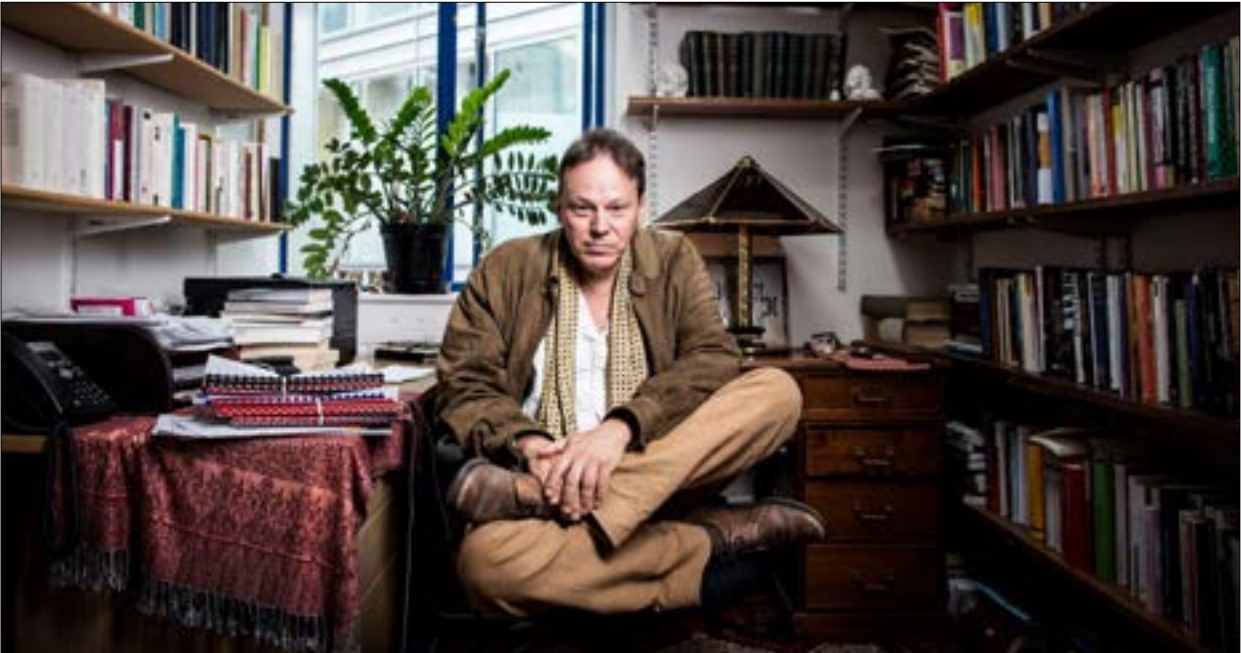
تصورات غرايبر في الخلاصة الكئيبة ليست نقياً تاماً للنظام الراسمالي

«لم أن متخيلاً بل منذ زمن»، هفت مستشار التحرير. ارتفع منسوب الأمل لديه. «لا بد أن يكون مانشيت اليوم التالي»، أكد نائبه. غمره الأمل.