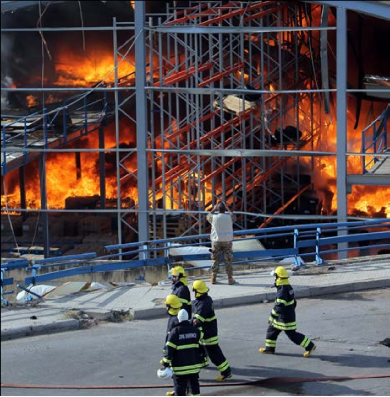
للمرة الثانية في غضون أقل من 40 يوماً، تنجو محطة التواليت، بالصدفة (هيلم الموسوي)

حصل عليه. هكذا ببساطة، انطلقت الأعمال من دون الانتعاز من كارثة المرفأ. فلا أزيحت المواد الخطرة ولا اتخذت إجراءات وقائية، كالاستعانة بمهندس للإشراف على الورشة أو الاستعانة بفوج الإطفاء لمواجهة أي حالة طارئة. من شرارة اندلع حريق استمر لساعات طويلة، وادى إلى تكون سحب سوداء في سماء في بيروت، كما أدى إلى هرب عدد كبير من القاطنين من المناطق المحيطة خوفاً من انفجار جديد. ومع إطفاء