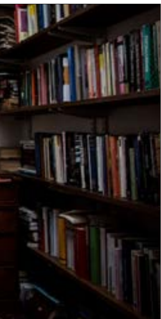
تصورات غرايبر في الخلاصة الكئيبة ليست نقياً تاماً للنظام الراسمالي

التقليدي المرتبط في الأذهان بالعمل الحكومي العام، بل أيضاً كما هي في تطبيقاتها الأخرى الواسعة الانتشار عبر منظمات إدارة الأعمال بشركات القطاع الخاص وتعاملاتها اليومية. أمّا أكثر كتبه شهرة، فقد كان «وظائف الهراء: نظرية» (2018) وفيه يرى أن الراسمالية المعاصرة احتفظت بمطوق الوظائف التي تمتد لأكثر من 35 ساعة أسبوعياً في وقت يمكن فيه بالاستفادة من التكنولوجيا الحصول على ذات المعاداة السامية، معتبراً ذلك توظيفاً ذافاً اغراض مشبوهة موجهة ضدّ خصم في السياسة يريد توزيعاً أكثر