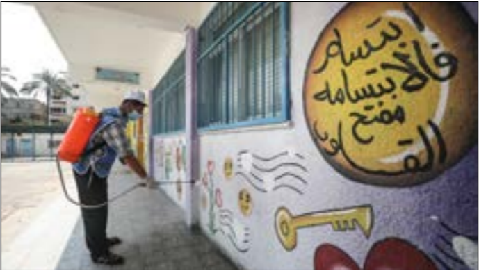
تضام «الأونروا»، بالمثل تتخذ أي قرار في هذا الإطار من دون التشاور مع الفلسطينيين

«مدير عمليات الأونروا سيلتقي مع العديد من الأطراف المعنيين بعد انتهاء فترة الحجر الصحي له الأسبوع المقبل، لمناقشة أولويات عمل الأونروا في خدمة 1,4 مليون لاجئ في قطاع غزة، وأيضاً لمناقشة موضوع أسماء المنشآت». وتنتظر الأوساط الفلسطينية إلى مخطط تغيير الأسماء على أنه يتساوق مع الرؤية الأميركية - الإسرائيلية الهادفة إلى طمس