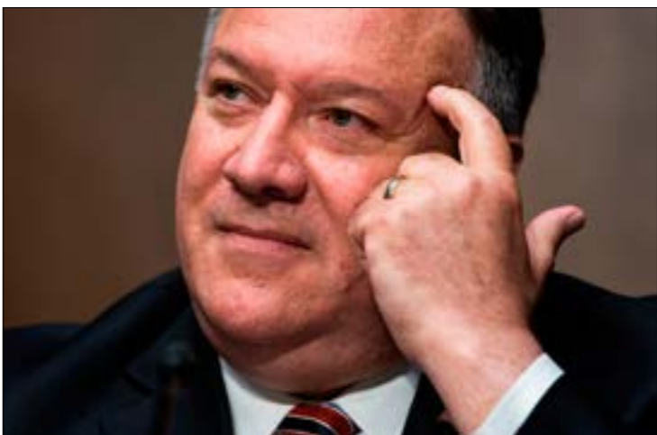
بترقب بوهيو صدور تقرير حول إطلاقه إجراء طارئا لبيع أسلحة للسعودية (اف ب)

مفاجئة بدت استقالة المفتش العام لوزارة الخارجية الأميركية، المكلف بالتحقيق في ملفات يُحتمل أن تكون محرجة بالنسبة إلى وزير الخارجية، مايك بوميو. بعد أقل من ثلاثة أشهر من إقالة سلفه ستيف لينيك، المفتش المستقيل، ستيفن أكارد، عمل فترة طويلة ميساعداً لنائب الرئيس، مايك بنس، وفُسر تعيينه في منصب مراقب عام لعمل الخارجية الأميركية، في أيار/ مايو الماضي بأنه وسيلة لحماية بوميو، «الطفل الذهبي» للإدارة الحالية، وعزب سياساتها الخارجية. أكارد أبلغ زملاءه في الوزارة أنه «سيعود إلى القطاع الخاص، بعد سنوات من الخدمة العامة»، فيما سارع المفتش المعين حديثاً، منصبه الذي ستشغله، مؤقتاً، نائبه، ديانا شو، وهي محامية تعمل منذ فترة طويلة في مكتب المفتش العام. وأكدت شو لزملائها أنها ستفعل كل ما في وسعها «كي لا أزع هذا التغيير الأخير يؤثر سلبا على عمليتنا». علاقات أكارد مع بنس، وحقيقة أنه