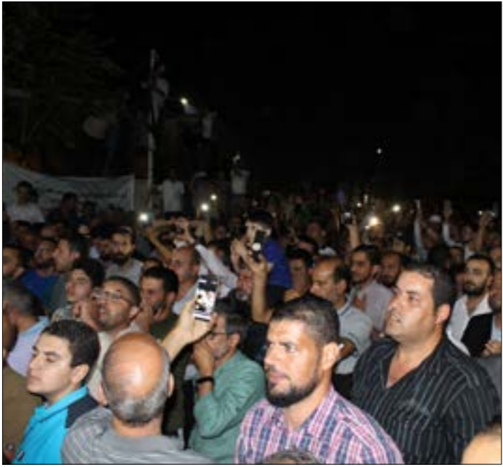
استمرت احتجاجات المعلمين في العديد من المحافظات

هجومه على مجلس النقابة، كما لو كان النشر مسموحاً في سياق مهاجمة المجلس فقط. وتأتي هذه الخطّورات في ظلّ شلل شبه تامّ في الحياة الحزبية والسياسية الأردنية، بموجب أوامر الدفاع التي تعطي اليد المطلقة للسلطة التنفيذية، وما يرافق ذلك من عمليات استدعاء واعتقال متعدّدة تطال العديد من الشخصيات السياسية المحسوبة على أكثر من تيار، وأبرزها الأمين العام لـ«حزب الوحدة الشعبية اليساري»، سعيد ذياب، الذي اعتقل على إثر مقال له في عيد الاستقلال، وحتى اللحظة، لم يتّخذ الإفراج عن أعضاء مجلس نقابة المعلمين، الذي يحلّ ما يزيد على 100 ألف معلم ومعلمة يمثلون جميع ألوان الطيف السياسي والاجتماعي في المملكة.