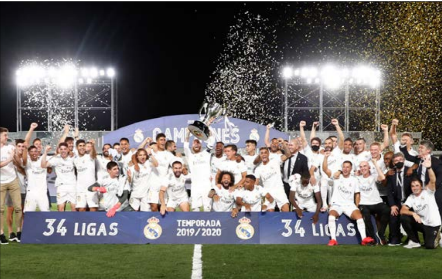
يدخل ريال مدريد اللقاء منتعشا بلبق الحورم الإسباني الذي حفّضه على حساب نظيره برشلونة (أ ف ب)

بيب غوارديولا الذي يعيش أحد أسوأ مواسمه في إنكلترا، على الجانب الآخر، يدخل ريال مدريد اللقاء منتعشا بلقب الدوري الإسباني الذي حققه على حساب نظيره برشلوننة، حيث ينتظر جماهير النادي الملكي تأحلاً إلى دور ربع النهائي من الأبطال يليق ببطل اللغا.