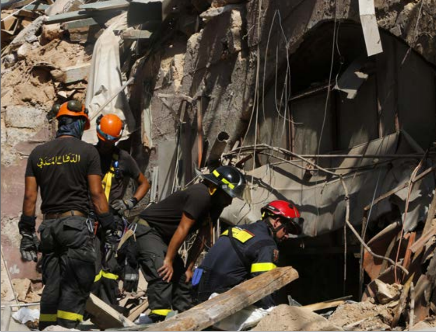
بعض المصمير إلى حل مسألة الاستيراد وينسفه منذ اعتمادات خارجية (مروان طحمة)

الممنوح للتعديل بالليرة اللبنانية وفقاً لسعر الصرف المعتمد في تعاملات مصرف لبنان مع المصارف، ويمكن للتعديل الاتفاق مع المصرف أو المؤسسة المالية على: ١- تسديد القروض الاستثنائية خلال فترة تقل عن الخمس سنوات المحددة اعلاه ٢- إجراء تسديد مُبكر بالدولار الأميركي»