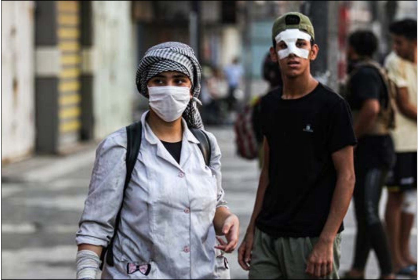
يعتقد المتظاهرون ان القانون بنسخته الحالية لا يلبي طموحهم (فاه ب)

التي رغم من حصول «وكالة غوث وتشغيل اللاجئين الفلسطينيين» (أونروا) على تفويض دولي باستمرار تقديم خدماتها للاجئين الفلسطينيين، إلا أن الإدارة الحالية للوكالة، وخاصة في قطاع غزة، تواصل الاستجابة للضغوط الأميركية والإسرائيلية بإجراءات «ناعمة»، خصوصاً في قطاع التعليم. إذ شرعت، أخيراً، في وضع