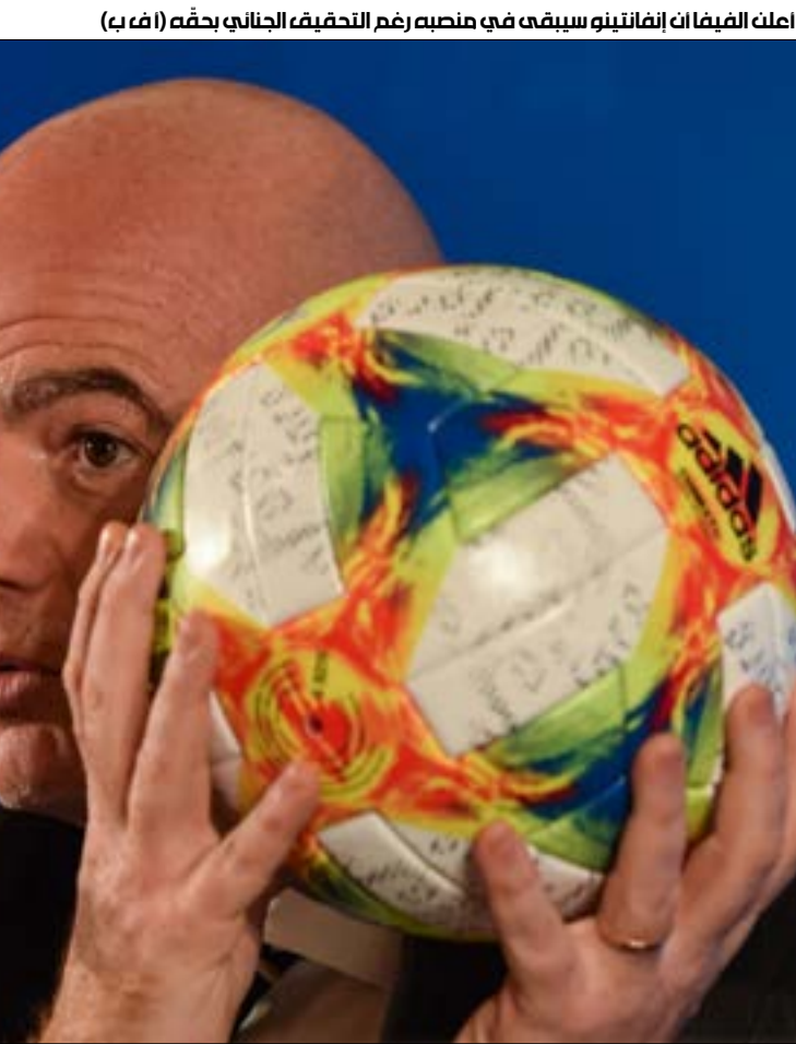
أعلن الفيفا أن إنفانتينو سيبقى في منصبه رغم التحقيق الجنائي بحقه

كما تم إيقاف الأمين العام السابق للفيفا الفرنسي جيروم فاله، المشتبه في تورطه في قضية إعادة بيع التذاكر