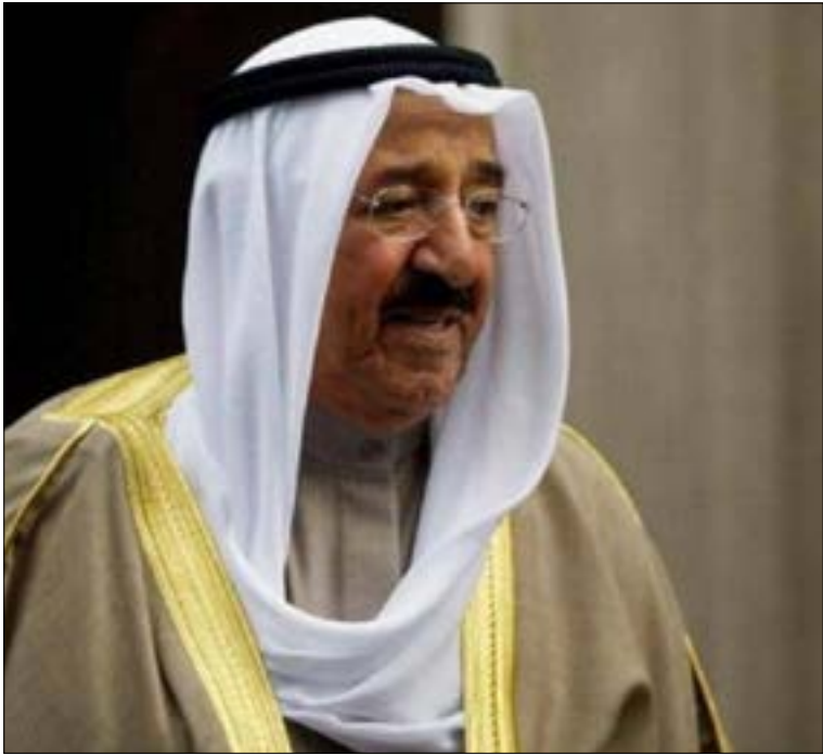
تنضم مصادر مصرية النواب الإسلاميين في مجلس الأمة الكويتي باستغلال الطرف الحالي (من اليمين)

لا يكونوا مخالفين وفق الإجراءات المطبقة من السلطات الكويتية، وأكد شكري أن مصر تفهّم العديد من الظروف والمتغيرات، لكن في الوقت نفسه «لا يمكنها أن تقبل بتجاوز حقوقها وحقوق مواطنيها»، مطالباً بموقف كويتي رسمي أوضح في هذا الإطار. من جهته، تعهد الوزير الكويتي بمراجعة إدراج مصر في قائمة الدول المنووعة، مشدّداً في الوقت عينه على أخقية الكويت في وضع الضوابط التي تراها مناسبة لدخول المصريين من دون تعسف وتمييز.