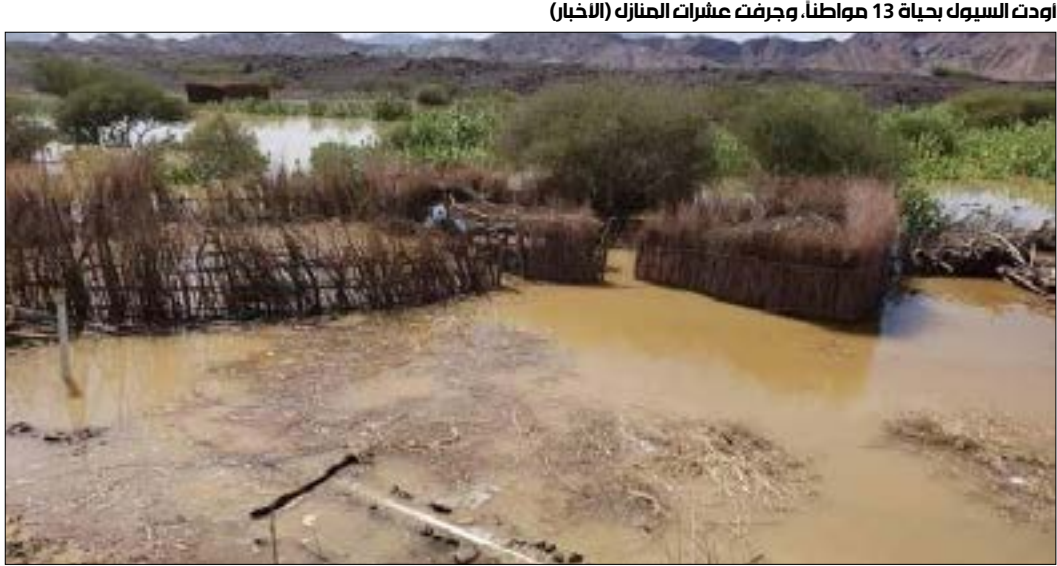
أهدت السيول بحياة 13 مواطناً، وجرفت عشرات المنازل (الأخبار)

المياه من الجهة الجنوبية عبر القناة المخضّصة للتصريف. لتضرر عشرات القرى في منطقتي جديرجان والفحج، وهو ما دفع الآلاف من الأسر إلى إخلاء منازلها، في وقت لا يزال فيه خطر انفجار السدّ ماثلاً. الوحدة التنفيذية لإدارة مخيمات النازحين، والممّولة من قبل الأمم المتحدة، أفادت، في تقرير صدر الأحد الماضي حصلت لـ«الأخبار» على نسخة منه، بأنّ الأمطار الغزيرة التي هطلت على محافظات مارب وأبين والضالع تسببت باضرار جسيمة في مخيمات النازحين، وأدت إلى جرف كلّى أو جزئي لمساحات 2242 شخصاً ولفّت التقرير إلى ارتفاع منسوب المياه في حوض السدّ في مديرية صرواح غربي محافظة مارب، ما تسبّب باضرار في مخيمات الصوابين والروضة وذنّة العيال وارانك. وأضاف أنّ 1340 أسرة تضرّرت من بين 4871 أسرة نازحة في المديرية التي يقيم فيها النازحون في تجمعات في منطقة حوض السدّ. وتابع أنّ الأضرار شملت غرق مبان وجرف خيام وإتلافها وتهدّم «عشش» (بيوت الصفيح) 430 أسرة بشكل كليّ و1000 أسرة جزئياً، بالإضافة إلى تلف المواد الإيوائية وغير الغذائية 9000 أسرة بشكل كليّ و123 أسرة بشكل جزئي، في حين بلغ عدد الأسر المتضرّرة بالمواد الغذائية