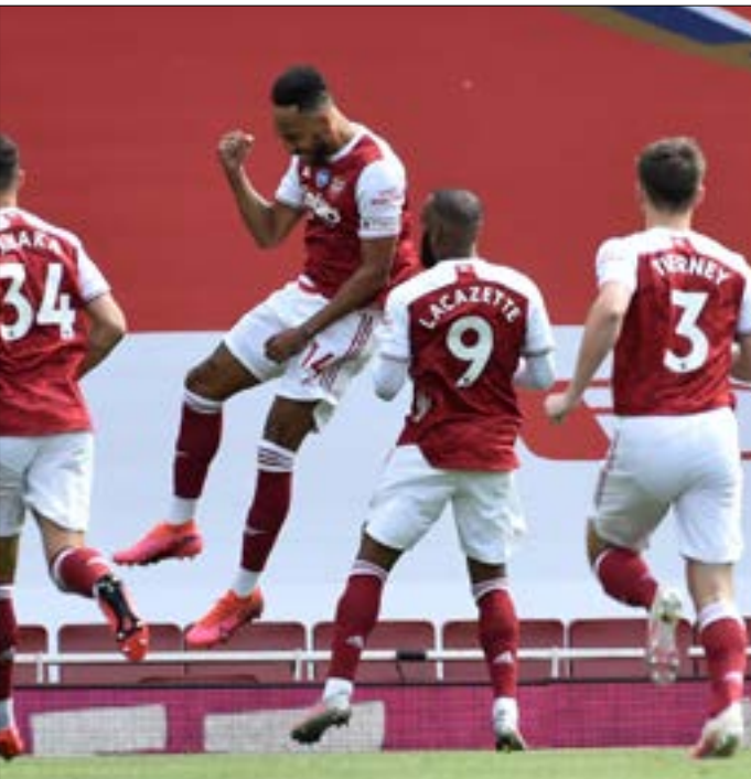
قدم أرسنال أداء جيداً في المباريات الأخيرة من الدوري

هذا الموسم ما حال دون مشاركته الأوروبية. في حال فوزه بكأس الاتحاد، سيشارك النادي تلقائياً في الدوري الأوروبي ما قد يزيد من نسبة الميزانية المتوقعة. رغم ذلك، تشير المؤشرات إلى صعوبة موسم ارتيتا المقبل، نظراً إلى عدم تلقيه الدعم الكامل من الإدارة، ما قد يدفعه للاعتماد على أبناء الأكاديمية سيرا على خطى لامبارد في تشيلسي.