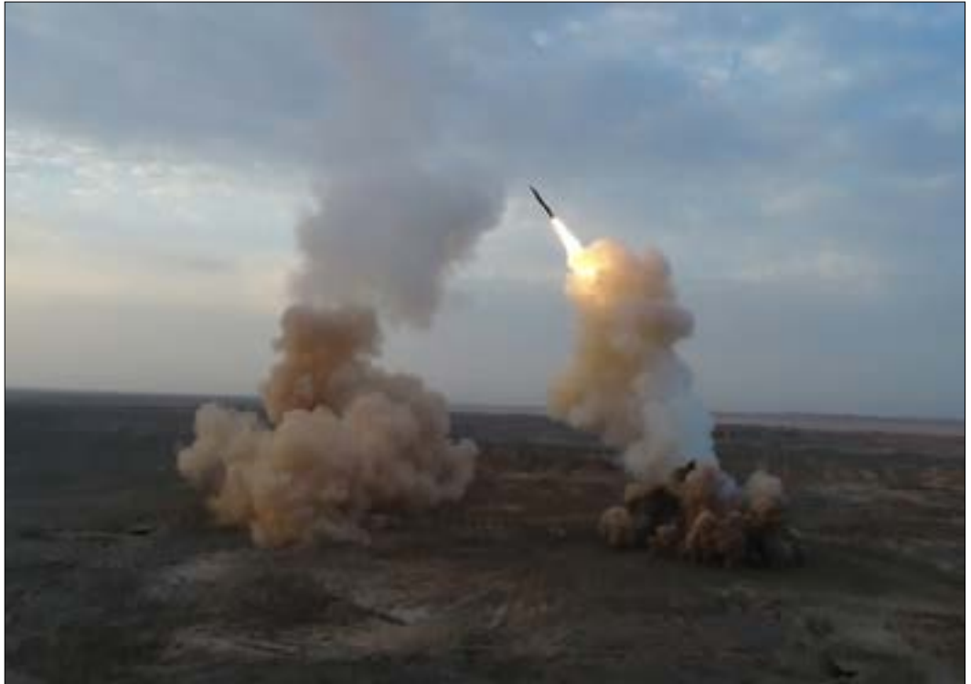
كشفت المناورات عن تطور نوعي لصواريخ انطلقت من باطن الأرض

وهذا يعني إلغاء نظرية ضرب المخزون الصاروخي الإيراني، حيث لا يمكن لأي «عملية وزن نوعي» ضرب القدرة الصاروخية الإيرانية المنتشرة بعشرات الآلاف في أماكن مجهولة تماماً أمام العدو. والأهم أن هذه الصواريخ قادرة على التوجيه الذاتي باتجاه الهدف، ما يقلّل نسبة الخطأ إلى أقل من 7