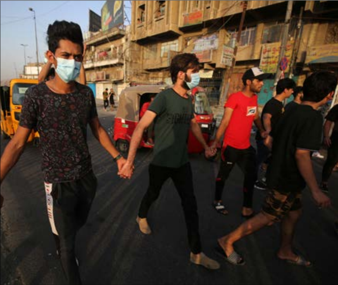
يبدو الصيف، بزامته الكثرة، توقيتاً مالياً بالنسبة إلى الفهم السياسية المتصارعة

انهيار الدولة، إلا أن بعض حلفاء طهران، وجلّهم من فصائل المقاومة، لا يزالون على موقفهم الرافض للرجل. وهو موقف يتقاطع معه،