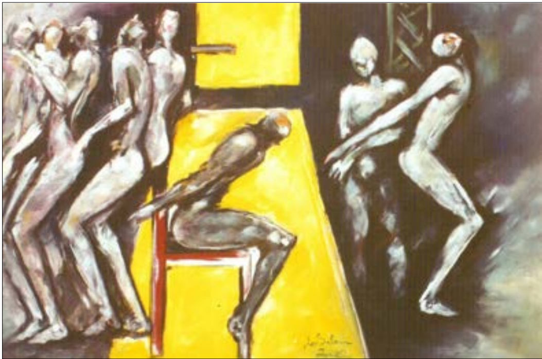
عبد الرحمان سالم - كرسي التعذيب، (أكريليك على كاتافاس - 300 × 200 سنتم - 2002. ملتحق الخيام التشكيل)

لم تبدأ حتى الآن، ولا يزال على وضعيته بعد التدمير. 2. هل يعلم القيمين على «بيت الفن» أن المعتقل كان مفتوحاً منذ التحرير حتى الآن لكل وسائل الإعلام المحلية والعالمية،