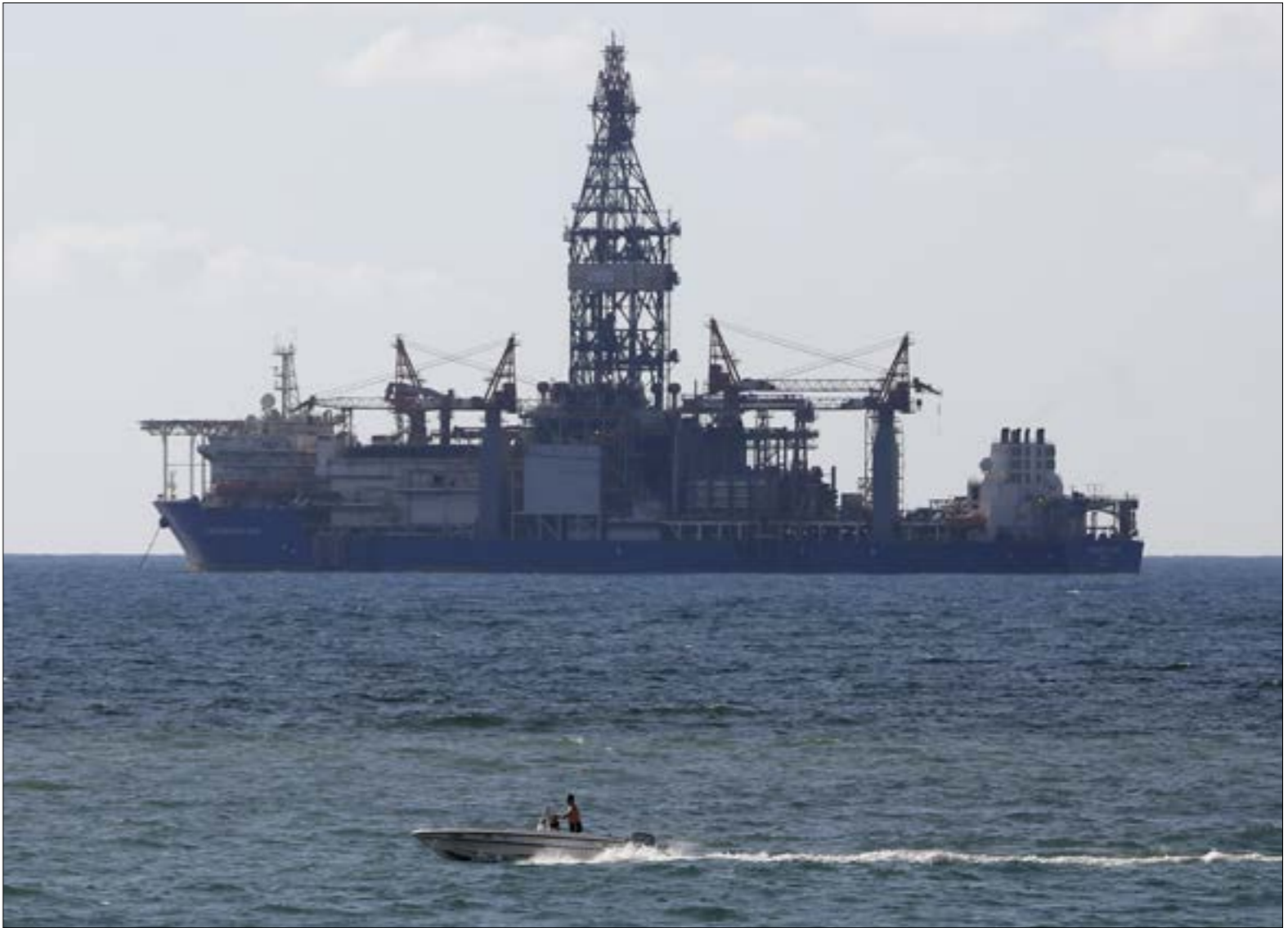
شركة واحدة لتقدير الثروة النفطية في البر والبحر؟ (مروان طحطح)