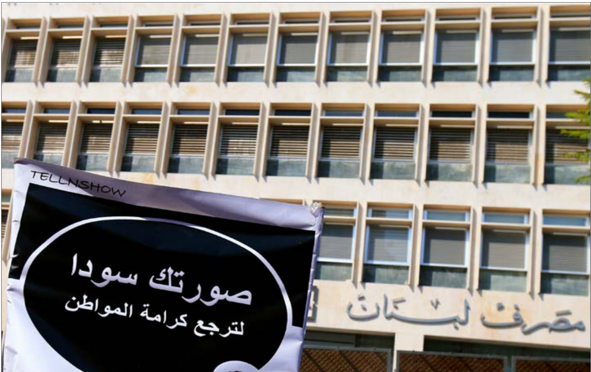
تقوم مصارف بمضاعفة الدولارات الجديدة (Fresh money) بـ 2,9 مرة (هيلم الموسوي)

بثمة من ذلك، مُعتبرين أنّه أمر الغطاء للمصارف، فعلمياً، هو من يُخطي خسائر المصارف الناتجة عن هذه العملية. كيف؟ يحصل كل مصرف من «المركزي» على حصة نسبية من العملة الصعبة أسبوعياً، تختلف قيمتها بتفاوت حجم رأسمال المصرف. يأتي