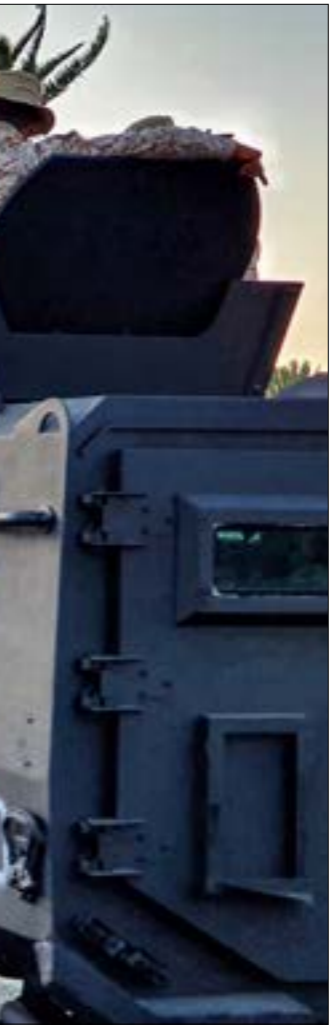
لم تتوقف الصدامات للمركة منذ بداية الشهر الماضي

بدأت إثيوبيا رسمياً ملء خزان «سد النهضة» في خطوة من جانب واحد، بعد فشل مفاوضات «الفرصة الأخيرة» التي استمرت 10 أيام برعاية أفريقية وحضور مندوبين عن الولايات المتحدة و«البنك الدولي»، وانتهت برفع تقرير إلى قادة الدول الثلاث، مصر وإثيوبيا والسودان، إضافة إلى جنوب أفريقيا، الرئيس الحالي للاتحاد الأفريقي، التي يسعى رئيسها للوصول إلى تهيئة واتفاق يضمن حقوقاً عادلة للجميع. جاء الإعلان الإثيوبي أمس رسمياً عبر وزير الري، سيليشي بيكلي، بعد أيام