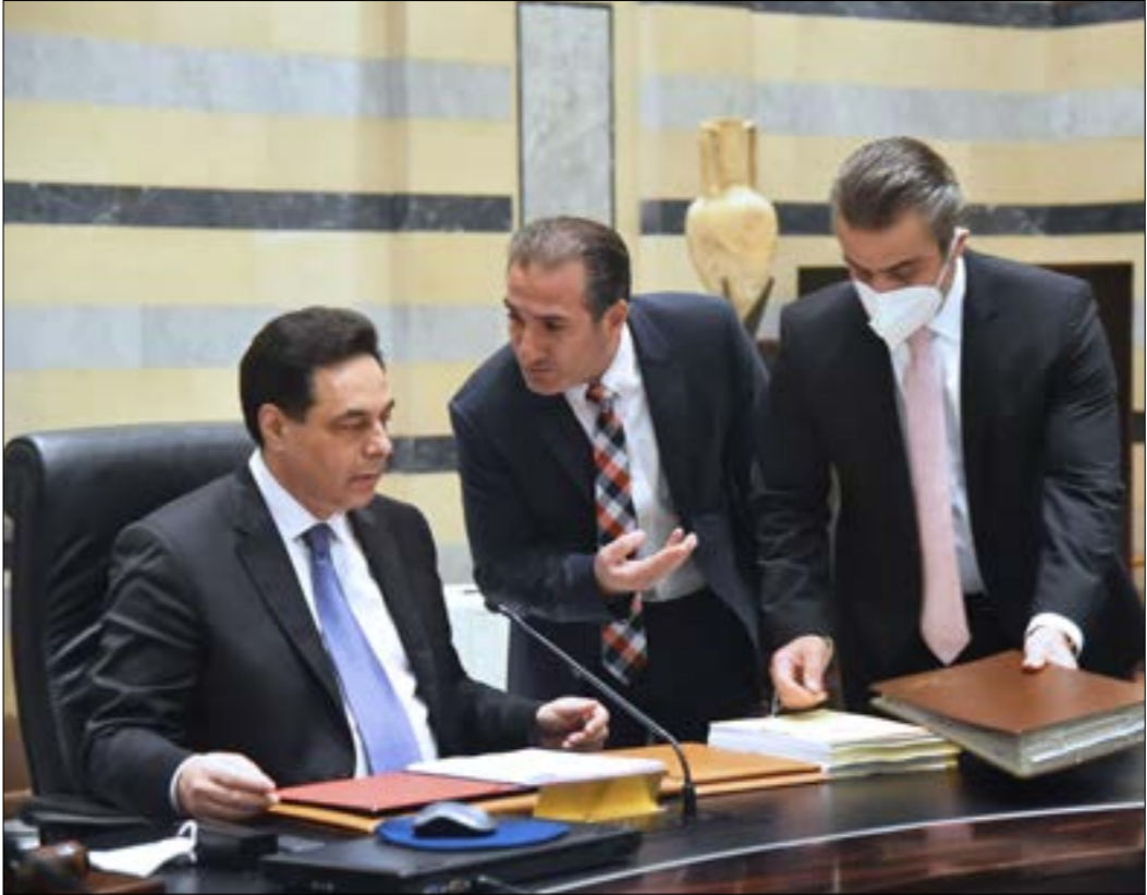
مصادر حكومية: العمل مع الجانب العراقي مستمر والناتج خلال عشرة أيام (دالني بنهر)

ويتنبّه البعض عدم اندفاع الحكومة للعمل بسرعة وتراجعها عن القرارات والخيارات تحت ضغوط