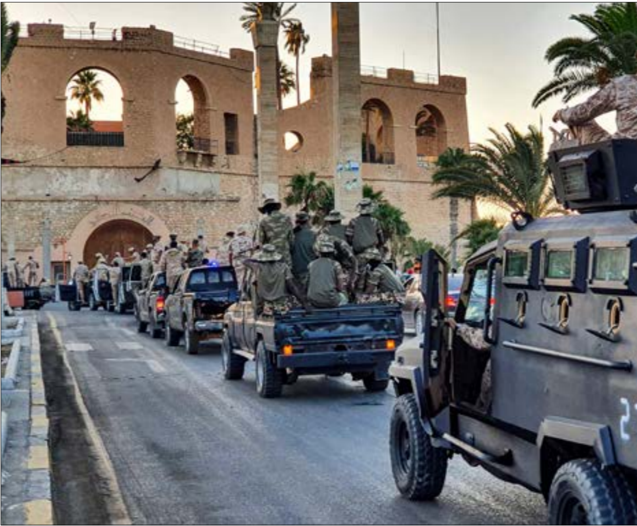
لم تتوقف الصدامات للمركة منذ بداية الشهر الماضي (ا ف ب)

مكثفة في قاعدتي محمد نجيب وعثمان المصريّين قرب الحدود الليبية، شملت أساساً طائرات شحن قادمة من الإمارات، وأخرى إماراتية من دون طيار من طراز «وينغ لونغ». أيضاً، جرت عمليات توسعة وتجديد في مطاري بنينا والخادم شرقيّ ليبيا، علماً أن المطار الأخير تستغله الإمارات منذ أعوام، فيما يُسجل في كليهما نشاط كثيف لطائرات شحن.