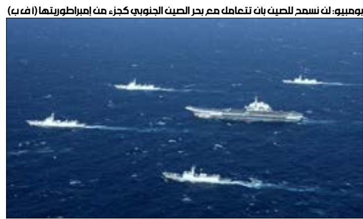
بومبيو، لكن تسمح للحبب بان تعامل مع بحر الصن الجنوبي كجزء من امبراطوريتها

شدّت الولايات المتحدة على موقفها الرافض لمطالبات الصين بالاستحواذ على الموارد في المياه المتنازع عليها في بحر الصين الجنوبي، واصفة إياها بأنها «غير قانونية»، في خطوة من شأنها أن تضيق عامل توتر إلى العلاقات المشحونة أصلاً بين الاقتصادين العملاقين. وأعلن وزير الخارجية الأميركي، مايك بومبيو، أنّ بلاده ستتعامل مع المساعي الصينية للاستحواذ على الموارد في المياه المتنازع عليها بوصفها «غير قانونية»، ممارساً بذلك مزيداً من الضغوط على العملاق الآسيوي الذي سارع إلى التشنيد بموقف «بحر السلام والاستقرار الإقليميّين». تنبّر التصريحات الأميركية نبرة أكثر حدة إزاء تعامل واشنطن مع هذه القضية، رغم معارضتها منذ وقت طويل مطالبات بكين بالسيادة في تلك المنطقة. وتذافع الولايات المتحدة، كما لفت بومبيو، عن فكرة إنشاء «منطقة حرة ومفتوحة في المحيط الهادئ - الهندي». وبينما ذكر بأن محكمة التحكيم الدائمة في لاهاي قضت عام 2016 بأنّ لا أساس قانونياً لمطالبة الصين بـ«حقوق تاريخية» في