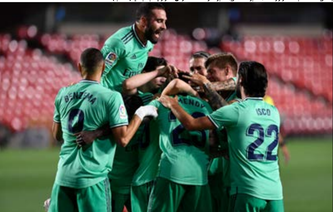
بات ريال على بعد فوز واحد من إزاحة غريمه برشلونه عن عرش الدوري الإسباني