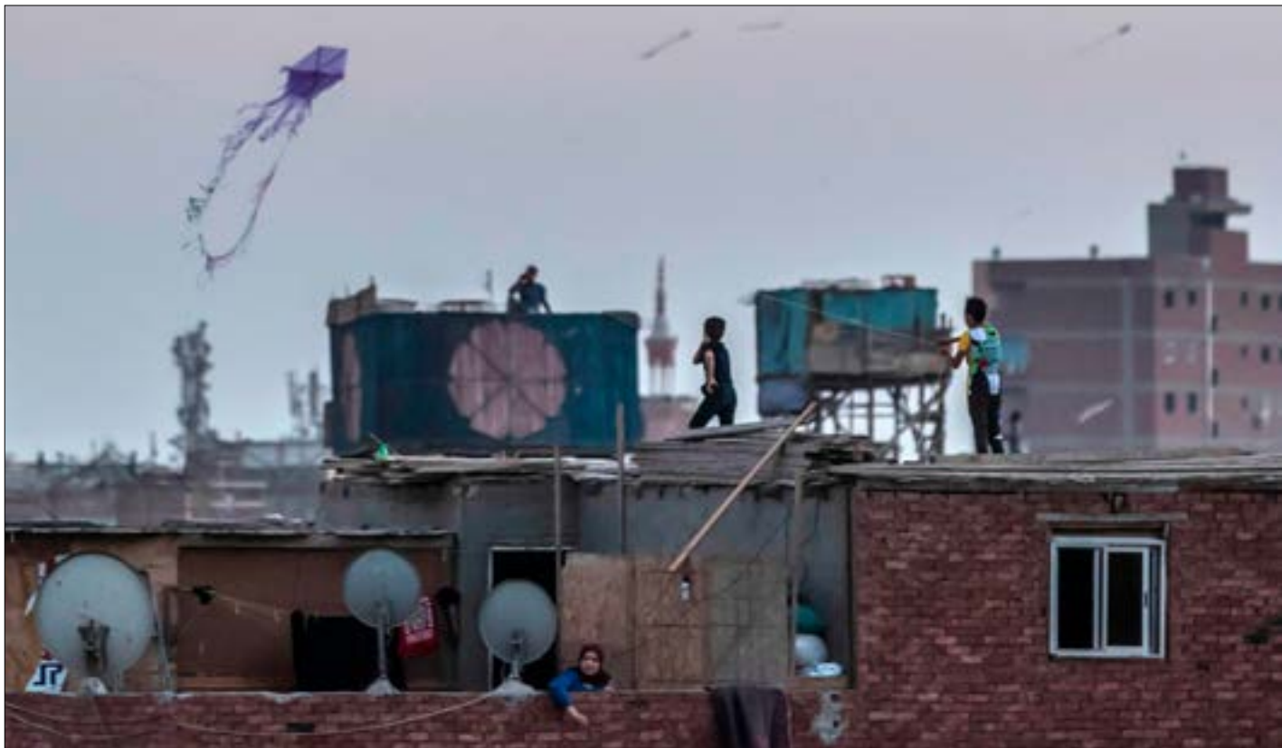
الرؤية المصرية ان المواجهة المقبلة لکن عم اضلحة اختيار «الرفق المناسب والالبية المناسبة»، (اف ب)

بدعوة البرلمان الليبي مصر إلى التدخل العسكري في حال وجدت خطراً على الأمن القومي للبلدين، حصل عبد الفتاح السيسي على تفويض ثاب للتدخل دعماً لقوات حليفه خليفة حفتر في مواجهة حكومة «الوفاق الوطني» المدعومة من تركيا، في خطوة تتزامن مع اقتراب العتاد التركي الوارد من تجاوز الحد الأقصى الذي وضعتة القاهرة قبل تنفيذ أي تدخل عسكري معلن