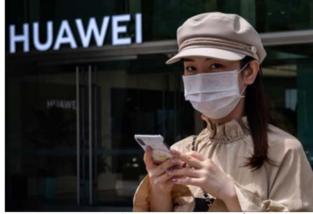
«هواوي»: القرار البريطاني يتعارض بالسياسة التجارية الأمريكية وليس بالمثل (اف ب)

بقرارها فرض حظر تدريجي على شراء معدات شبكة الجيل الخامس من عملاق الاتصالات الصيني، «هواوي»، تكون بريطانيا قد رضخت بالكامل للضغوط الأميركية، غير ابية لتحذيرات الصين. قرار، إن كان يمنح إدارة الرئيس دونالد ترامب انتصاراً في معركةها الجيوسياسية والتجارية ضد بكين، فإنه بهذا يزيد من الاضرار بعلاقات لندن مع القوة الاسيوية العملاقة، فضلاً عن كونه يحلّ مقدّمی خدمات الهاتف المحمول في المملكة المتحدة كلفة كبيرة، وهم الذين يعتمدون على معدات «هواوي» منذ ما يقارب 20 عاما. امس، أعلن وزير الرقمنة البريطاني، أوليفر دودن، القرار خلال جلسة للبرلمان، مشيراً إلى أنه بدأ من نهاية العام الجاري، «على مرّودي الاتصالات عدم شراء أي من معدات الجيل الخامس من هواوي».