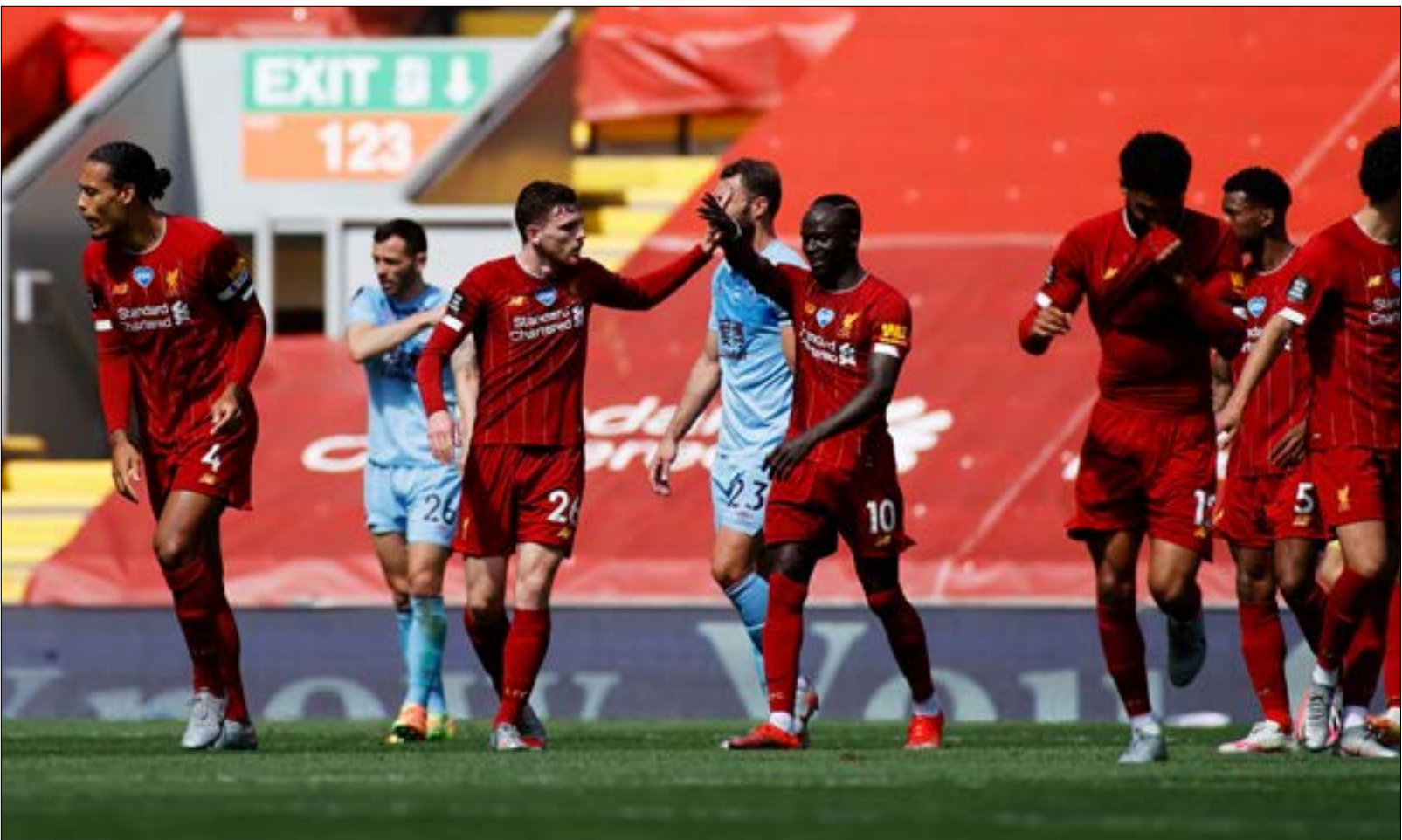
لم يكن نجاح ليفربول على الصفة

عرف النادي نجاحاً ملحوظاً مع المدرب الأسبق آرسين فينغر. استوطن الفرنسي نادي أرسنال 22 عاماً، وبالزعم من نجاحه في النصف الأول من ولايته، إلا أن الطفرة الماليّة التي شهدتها الـ«بريميرليغ» أبعدته عن