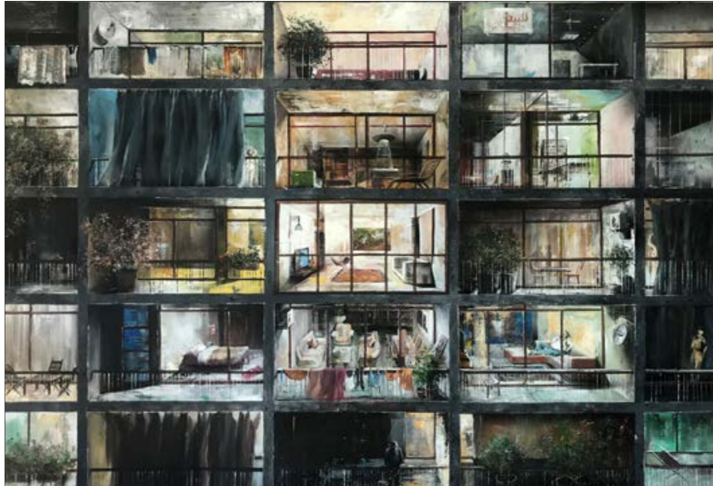
«الحياة، ذلك الاستعمال» (زيت على كanvas - 100x150 - 2020)

يصنع المعماري والفنان السوري من الابنية خلفية أساسية لبيروت. العمارة هي وسيط سردي لتبدل حالات العاصمة خلال أشهر. منذ انطلاقة انتفاضة 17 تشرين الأول وصولاً إلى الحجر المنزلي جزء وباء كورونا. لكنها قبل تبدو توثيقاً سياسياً واجتماعياً وثقافياً للمدينة في لوحات معرضه «ومن ثم السكون» في «غاليري 392رميل393» (الجميزة - بيروت)