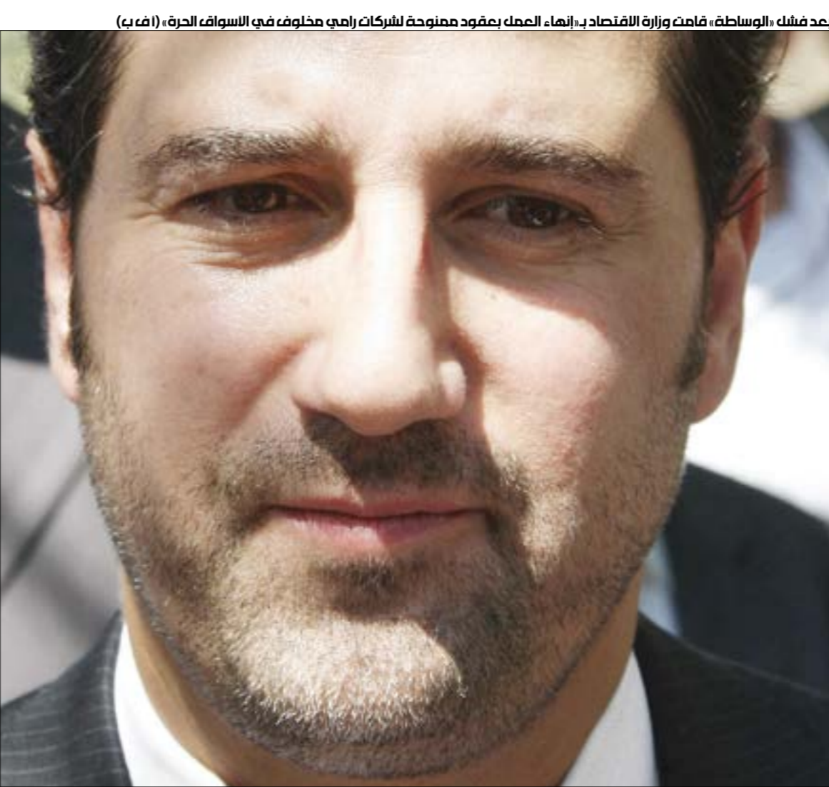
بعد فشل الوساطة، قامت وزارة الاقتصاد بالقاء العمك بعقود مملوكة لشركات رامي مخلوف في الاسواق الحرة، (ف ب)

أن مخلوف يسيطر - وحده - على أكثر من خمسة في المئة من الناتج المحلي الإجمالي. ويملك مخلوف في استرداد أموال الدولة حتى من أقرب المقرّبين، ومحاسبة المهزّزين عبر شركته «سيريتل»، التي قدّرت أرباحها السنوية في العام 2019 بنحو 59 مليار ليرة. كذلك، فهو يسيطر على غالبية قطاع الطيران، من خلال تملكه شركة «أجنحة الشام»، التي تم ترخيصها في العام