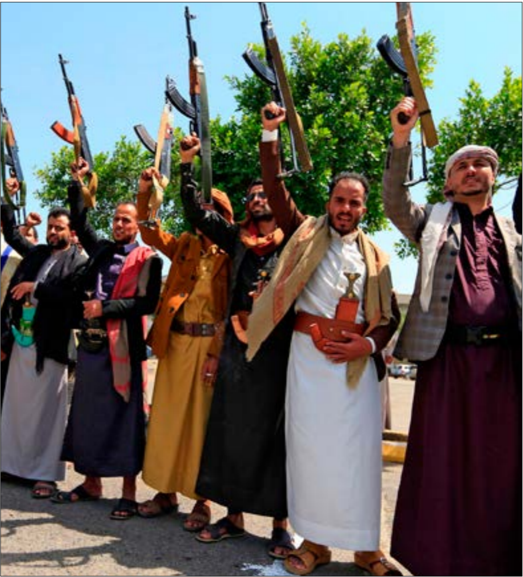
طالبت قبائل من خارج مارب بالسماح لهما بالمشاركة في عمليات استعادة المدينة

وتوازيا مع تصاعد الحديث عن قرب حسم معركة مارب، كثّفت