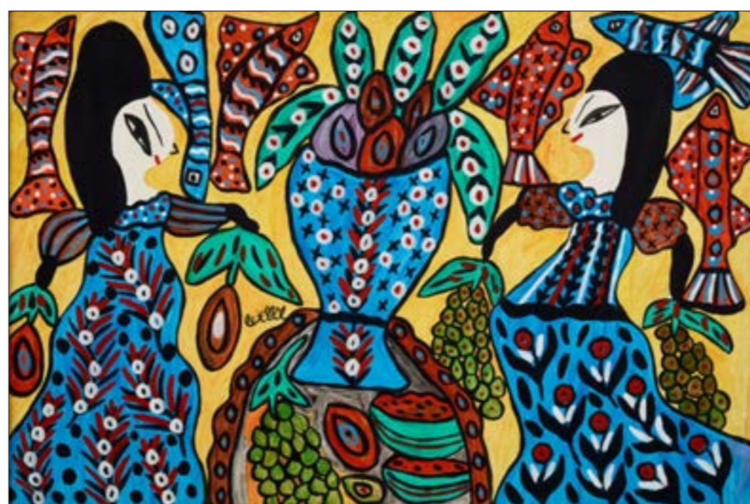
المراتك هم مزرعية تخلفية صفراء، الجزائر باية حدي الحيد (الوان مائية مله ورف - 147.5x98 - سنتم - 1997)