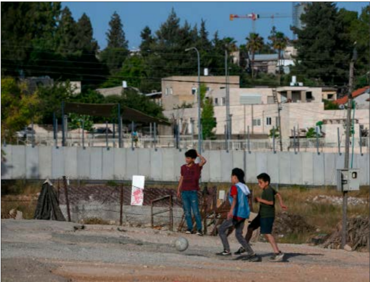
تتخلف التصاريح الممنوحة للفلسطينيين ببت 74 نوعاً وفق النشاط والتوقيت

الثلاثاء الماضي، أعلن مكتب «منسق الحكومة الإسرائيلية في المناطق الفلسطينية» (المنسق) إصدار معظم التصاريح من دون طباعة، بتسجيله على النظام الإلكتروني فقط، بزعم أن ذلك يأتي في إطار «مشروع واسع النطاق تقوده وحدة تنسيق أعمال الحكومة في المناطق والإدارة المدنية لتحسين الخدمة للمواطنين الفلسطينيين». وفق الإعلان، يمكن لأي شخص من المعينين تجديد التصريح أو تقديم طلب جديد عبر «شبابيك استقبال الجمهور» المنتشرة في الضفة. وتختلف التصاريح التي