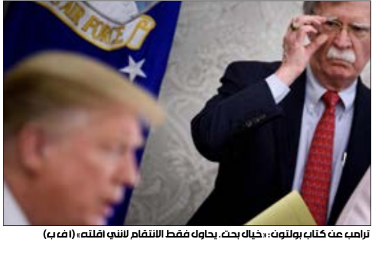
ترامب عن كتاب بولتون، خيال بحث، يحاول فقط الانتقام للثبث اقلته، (أ ف ب)

إلى الرئيس، لكهّ ذكر أنّه ابلع وزير العدل، بيل بار، بها وأنّه كان ينبغي على مجلس النواب إجراء تحقيق. وقال أيضاً إن الديموقراطيين ارتكبوا «سوء تصرف» بحصر الاتهام بشكل ضيق باوكرانيا، في وقت كانت فيه تجاوزات ترامب الشبيهة بما فعله مع كيف موجودة على نطاق سياسته، أكبر إلقاءً الآخرين بأنّ جرائم كبرى وجنحاً قد تمّ ارتكابها». وأشار بولتون إلى تواصل ترامب مع زعيم كوريا الشمالية كيم جونج أون، قائلاً إن ترامب كان يركّز على «فرصة النقاط صورة وردّ فعل الصحافة عليها». عوضاً عن التركيز على المصالح الأميركية الطويلة الأجل. (الأخبار، أ ف ب)