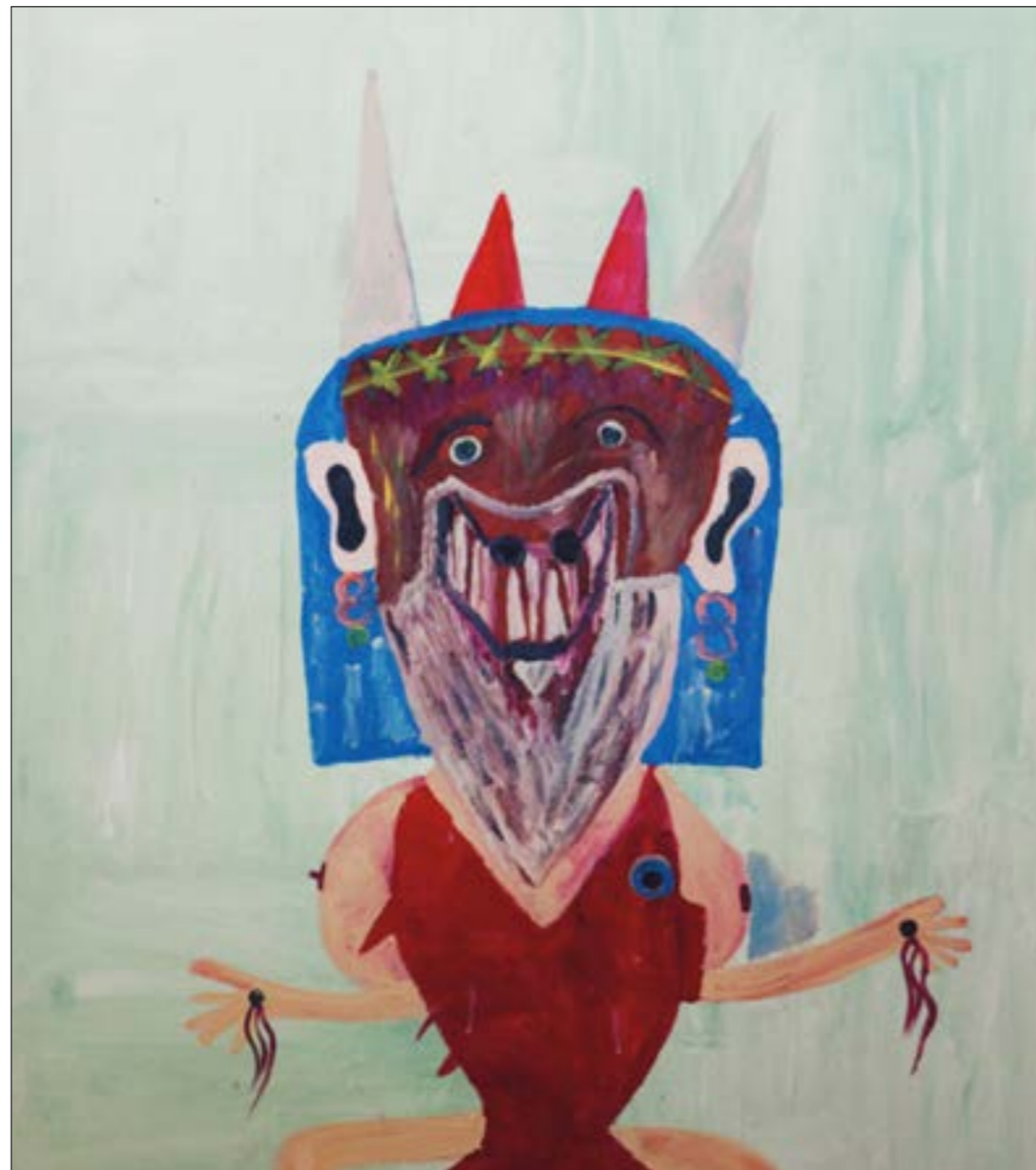
لوحة الفنان اللبناني مصطفى خالدى (من مجموعة الفنان)

ابتكر الفنان الفرنسي جان دوبوفيه (1901 - 1985) مصطلح «الفن الخام» لوصف أعمال الغرافيتي، وأعمال الفن الساذج والطفوليّة، ورسومات السجناء والمجانين. وقد طرحه تحديداً في نصّ كتبه لأحد المعارض الفنية في باريس لمجموعة من 60 فناناً من خارج التجربة والتدريب الأكاديمي: «نقصد بالفن الخام الأعمال الفنية التي أنجزها أشخاص لم تمشهم الثقافة الفنية. ويعكس ما يحدث لدى المتفكّين، فإن هؤلاء الفنانيين يرسمون ويختارون الموضوعات والمواد المستخدمة والوسائل والإيقاعات... من أعماقهم الخاصة لا بالاستناد إلى كليشيهات الفن الكلاسيكي أو الفن الدارج». ظهرت هذه الأعمال خارج السياق الفني الأكاديمي أو المؤسساتي، ولو أنها لاقت لاحقاً احتفاءً من قبل المتاحف والمعارض الفنية. أراد دوبوفيه ممارسة فنية أكثر أصالة وإنسانية من تلك التي تفرضها الأكاديميات على الفنون. دفعه هذا الرفض إلى الامتناع عن الرسم لمدة ثماني سنوات قبل أن يعود بأسلوبه المتفكّلت من سطوة التعليم. في لوحاته ومنحوتاته، أتبع هذا الفنانيّة الوصول إلى تعبيره الأوّل، حيث تجاوز المقاييس المعتادة كما يمكن رؤية ذلك في لوحاته، خصوصاً لكاناته المتفكّخة بتعبيرات مباشرة وخطوط واضحة على كثافة لونيّة. أهتم الفنان بهذه التجارب الفنيّة الهامشية في العالم. جمع حوالي 5000 عمل فني ساذج أو خام، ومنحها لمتحف «الفن الخام» في لوزان.