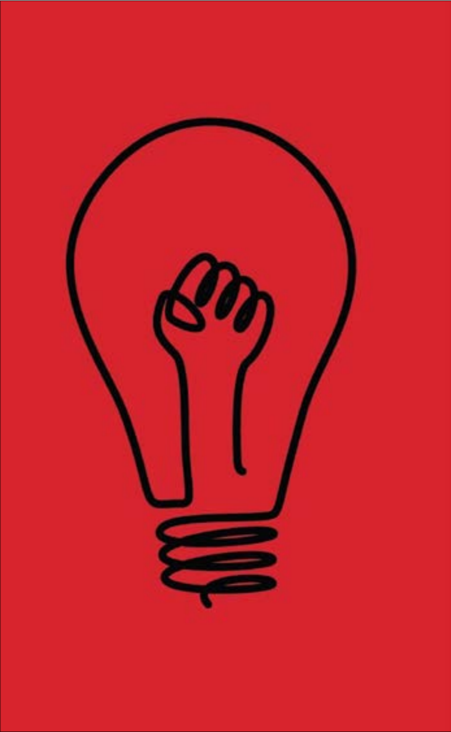
«مقاومة، ملصق من نصير الفنان البريطاني Simon C. Page

الانهيار من ارتدادات وتبعات قد تطال الكيان الإسرائيلي وأمنه.