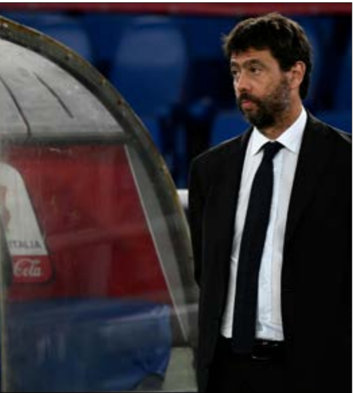
التتويج في بطولة الدوري المحلي قد تصطبج ساري فرصة أخرى حثه العام المقبل

ويتمّ تحديد المشاركين في البطولتين، عبر مرحلة تمهيدية، تُقسّم فيها الأندية الـ12 إلى 3 مجموعات، ويختلف بحيث يتخرّس كل مجموعة، أول وثاني وثالث الدوري في موسم 2018-2019، أي العهد والأصناف النهائية للمباراة النهائية بالتعادل، يتم اللجوء إلى ركلات الترجيح لحسم هويّة الفائز.