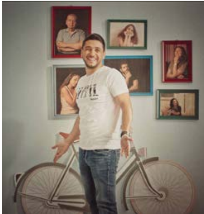
عزف فرج حنًا «شكراً حبيبي» ضمن مهرجان Suoni dal Golfo

ضمن مبادرة «طلّات سينمائية» التي أطلقتها «الهيئة الملكية الأردنية للأفلام» لربط صنّاع الأفلام والمهتمّين بالسينما مع محترفين في الفن السابع، بطلّ السينمائي الفلسطيني هاني أبو أسعد (1961 - الصورة)، اليوم الثلاثاء، عند الساعة الخامسة بعد الظهر بتوقيت بيروت، عبر منصة «زوم» في بثّ مباشر على صفحة الهيئة الرسمية على فيسبوك. انطلاقاً من تجربته المهنية الغنيّة، سيتحدث صاحب فيلم «الجنة الآن» (2006 - 90 د)، على مدى ساعة كاملة، حول عنوان أساسي هو: ماذا يعني أن تكون مخرجاً؟