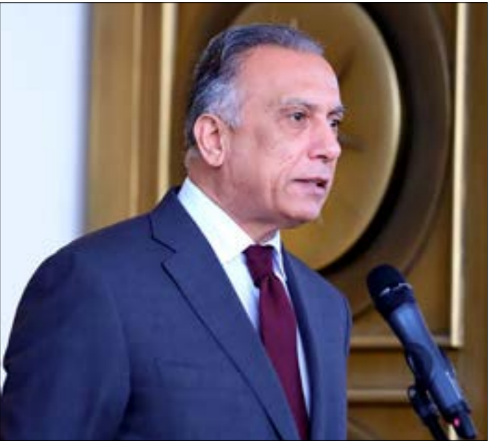
يستمع الكاظمي لاستعادة هبة الدولة، بوصف ذلك أبرز مؤشرات نجاح تجربته

100 يوم، هي المهلة التي حددها زعيم «التيار الصدري» مقتدى الصدر لرئيس الوزراء مصطفى الكاظمي، مهلة قصيرة جداً (حتى انتهاء هذا العام تقريباً)، مقارنة بتلك التي منحها بالتوافق مع زعيم «تحالف الفتح» (تقلّ برلماني يضم القوى المؤيدة له«الحشد الشعبي») هادي العامري، للرئيس السابق عادل عبد المهدي، وحكومته. هذا الإعلان، بتعبير أكثر من مصدر، يحمل تحديراً «ناعماً» للكاظمي، ودعوة صريحة إلى ترجمة «جديته» في تنفيذ برنامجه الوزاري. فخلال المدة المخطورة، سيمنح رئيس الوزراء دعماً صريحاً ومفتوحاً من قبل الأحزاب والقوى المحلية، إلى جانب المؤثرين الإقليميين والوليين، وعلى رأسهم طهران وواشنطن.