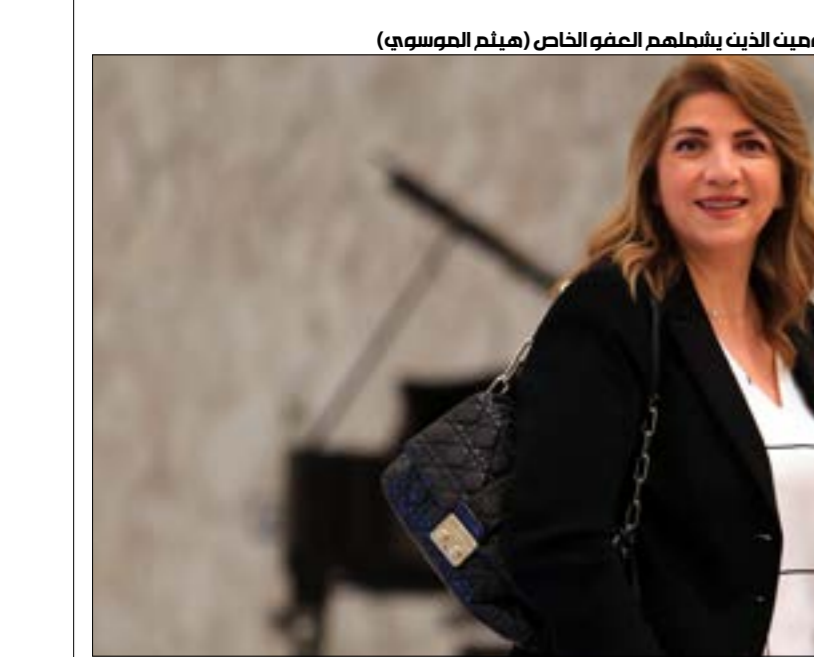
وزيرة العدل معايير موضوعية حددت الحكومةيبن الذين يشملهم العفو الخاص (هيلم الموسوي)

جوهري ان الرئيس يمنح الجنسية للنواب يؤدي إلى زوال الصفة الجرمية عن المحكومين. وهو بذلك أقرب إلى محدة لما ارتكبوا، في حين ان العفو الخاص لا يزيل هذه الصفة بل يقلصها بأسباب إنسانية مع مرسوم العفو الخاص المقاربة مع مرسوم العفو الخاص سوى من سباب حصر الصلاحية برئيس الدولة. لكن منحها أوسع هامش هو لضم أكبر عدد من المستفيدين من المرسوم الخاص. وفق حجيات أبرزتها وزيرة العدل