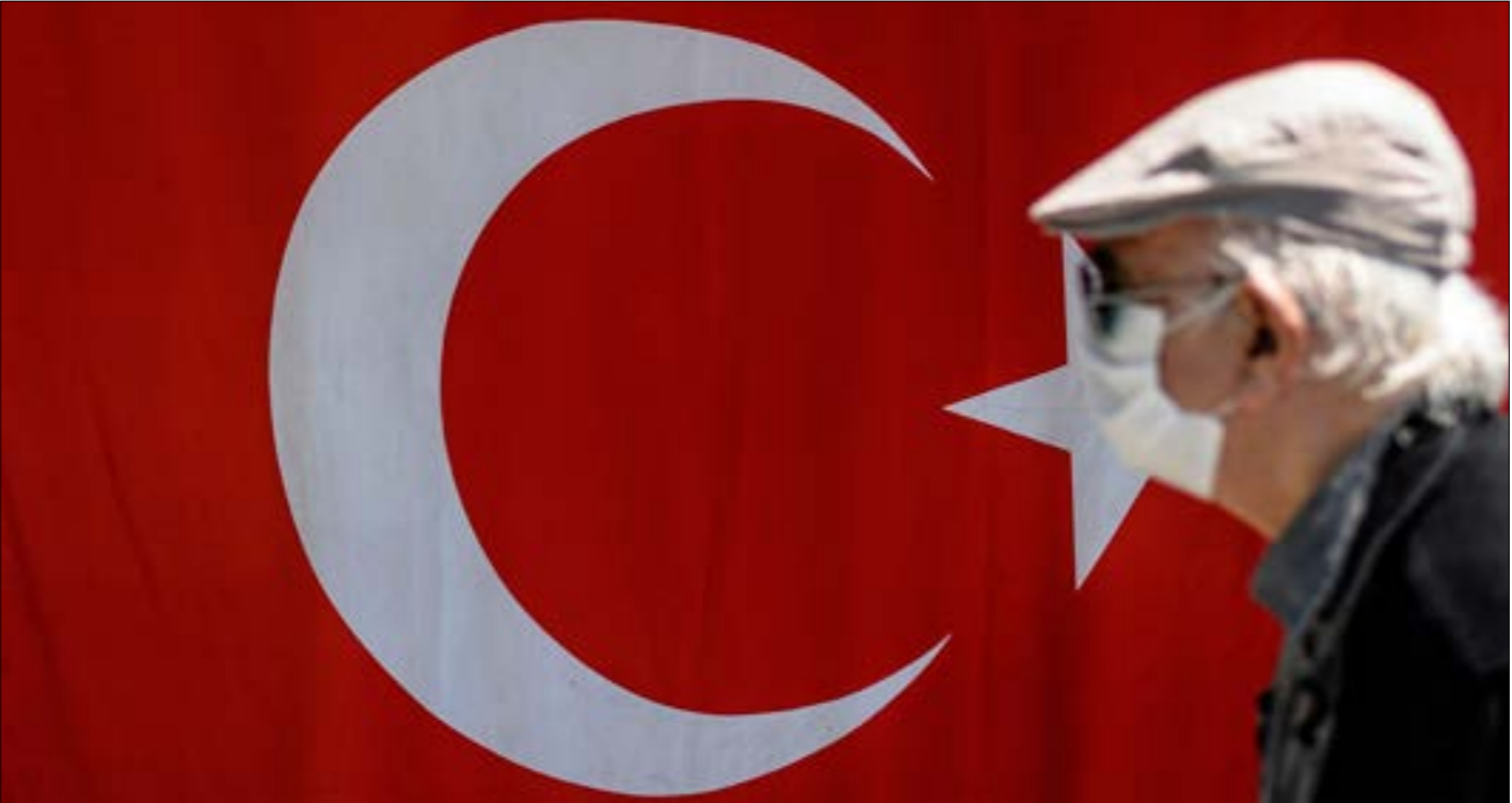
يحدّر كيليتشدار اوغلو من أن الومض في حال استمراره في التراجع بهذه الوتيرة فإن تركيا ستكون امام أزمة اقتصادية أسوأ بكثير من أزمة 2008 (ف، ب)

في ذلك، فإن صحيفة «يني شفق» الموالية لحزب «العدالة والتنمية» ترى فيها ضغوطاً تستهدف السياسات التي تسعى إلى إقامة اقتصاد مستقل متحرر من الهيمنة الخارجية ومحاولة العودة لرهن تركيا بصندوق النقد الدولي. التراجع في سعر الليرة ووصوله من 5,50 إلى 7,30 اضطر المصرف المركزي إلى التدخل. وما بين نهاية شباط وحتى اليوم، تراجع احتياط تركيا من العملة الصعبة والذهب من 108 إلى 86 مليار دولار، من بينها 25 مليار دولار فقط كتلة نقدية صافية. ويرى خبراء اقتصاديون أنه إذا استمر زوبان مخزون العملة الصعبة في البنك المركزي فإن تركيا ستحتاج، براء للخبير الاقتصادي إيرول طايماز، إلى ما لا يقل عن 54 مليار دولار، ليس من جهة يمكن أن تعطيها سوى صندوق النقد الدولي. ذلك ولا سيما أن تركيا عليها أن تستد ديوناً خارجية على المدى القصير، ما يقارب 122 مليار دولار، فيما لا يوجد لذلك أكثر من 16 مليار دولار