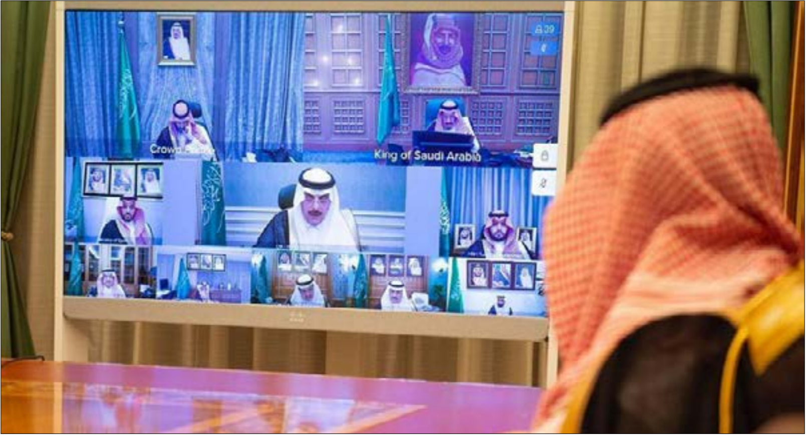
زامنت الرياض الإعلان غير المسبوق عن حزمة إجراءات تقشّف واسعة وقاسية، أمس، مع إجراء تخفيض إضافي لإنتاج النفط

- إلغاء بعض بنود النفقات التشغيلية والراسمالية لعدد من الجهات الحكومية أو إرجاؤها. عقب الوزير الجدةان قائلًا: «الإجراءات التي تم اتخاذها اليوم وإن كان فيها ألم إلا أنها ضرورية للمحافظة على الاستقرار المالي والاقتصادي من منظور شامل، وعلى المدى المتوسط والطويل... وتجاوز أزمة جائحة كورونا العالمية غير المسبوقة وتدابيراتها المالية والاقتصادية بأقل الأضرار الممكنة». عبر هذه الإجراءات تسعى المملكة لمنع التدهور الحاد لوضعها المالي والاقتصادي الذي وضعها أمام أخطر انكماش منذ عقدين، وفق وزير المالية محمد الجدةان، قبل أيام، فقط، من العام الجاري، سجلت الميزانية عجزاً بقيمة 9 مليارات