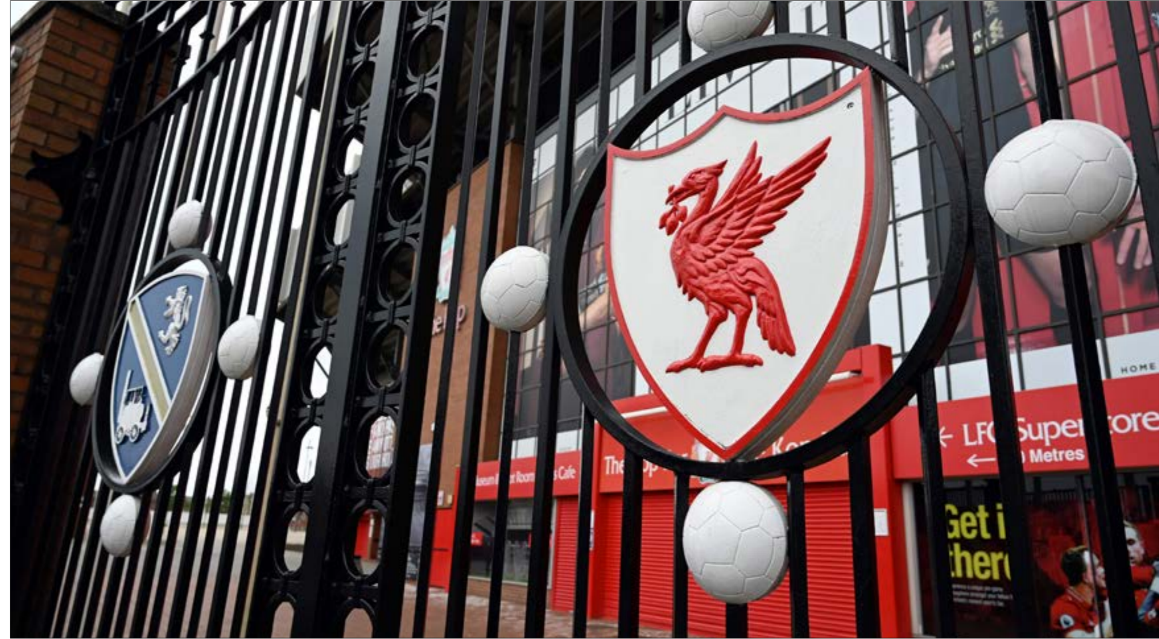
انتظر ليفربول اللقب الأكثر من 30 عاماً (الضرب)

وأقامت الأندية هذا الأسبوع معسكرات طويلة الأمد في مكان واحد تضمنت تدريبات لجميع أفراد الفريق، بعد أن كانت تقتصر على تدريبات فردية في الأسابيع الأخيرة. وتامل رابطة الدوري الألماني عدم ظهور حالات إيجابية جديدة بعد وضع نادي دينامو دريسدن من الدرجة الثانية في الحجر الصحي لأسبوعين، بعد إصابة لاعبين في صفوفه بفيروس كورونا ما سيحدّث عليه عدم خوض مباراتين، بعد أن ظهرت حالات عدة قبلها في صفوف فيردر بريمن وبوروسيا