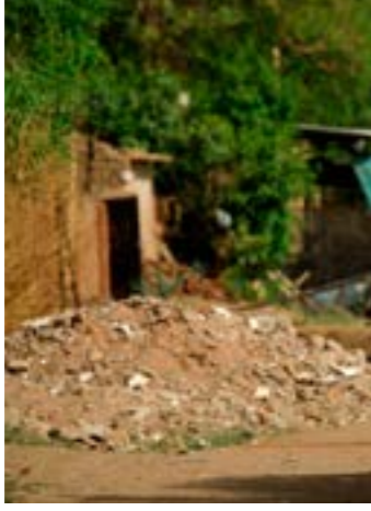
تسببت اشتباكات كسلا في مقتل 30 واشتباكات دارفور في مقتل 30