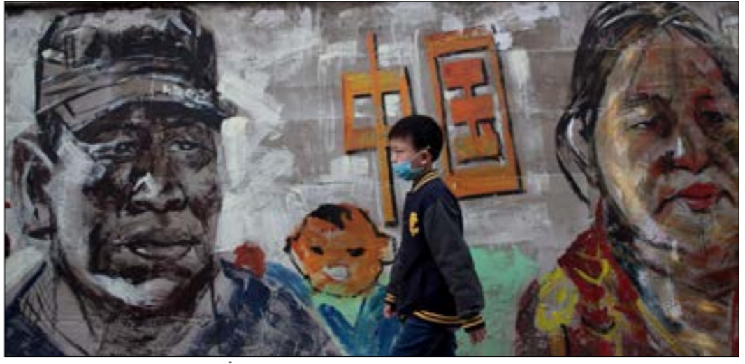
يكنب تعتمد بقوة على الدول المتقدمة، وإذا تراجع ملك هذا الاعتماد سيكون من الصعب توقع تكرار سيناريو الانطلاق مجدداً

عمودي 1- مونتيفيديو - 2- وزير - كنز - 3- ابن سينا - 4- تلا - انف - 5- لونا - ريا - 6- تم - رت - مخمل - 7- أسد - وج - 8- نبراس - رينو - 9- يافا - بيروت - 10- كرة القدم