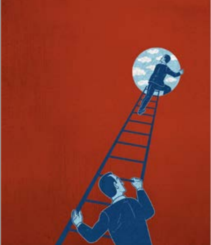
خلال اسابيع الحجر المنزلي