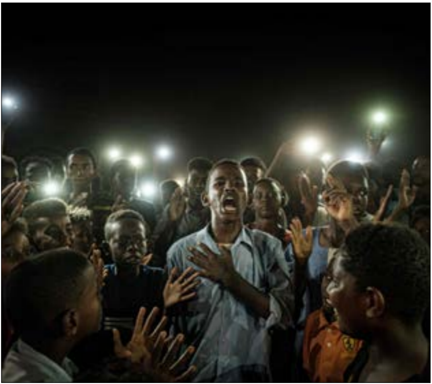
لتا ووجد البرهان ان «الدعم السريع» تتقدم في إرضاء الشارع. عمل لإعادة الجيش إلى الواجهة»

برغم حالة الانسجام التي ميّزت بداية عهد الشراكة بين العسكر والمدنيين، طفت مجدداً الإشكالات القديمة مع مستجد هو نشوء تقاطعات في الرؤى بين بعض مكونات الشق العسكري والمدنيين من جهة، وبين عناصر المكون العسكري أنفسهم من جهة أخرى. لكن يبدو أن البرهان تدارك الموقف سريعاً بعد خروج السريبات التي تؤكّد عرقلة عمل «لجنة إزالة التمتكين» المنوط بها تفكيك منظومة الفساد التي بناها رموز النظام السابق، ويظهر ذلك في العبارات المباشرة التي وردت في خطابه قبل أكثر من أسبوع، عندما قال: «من يروجون للشائعات هدفهم تفكيك وحدة السودان وتشجيت جهود المنظومة الأمنية وصرّفها مع أن لديه ميولاً إلى الانقلاب على الحكومة المدنية، لكنه حالياً لا يفتأ