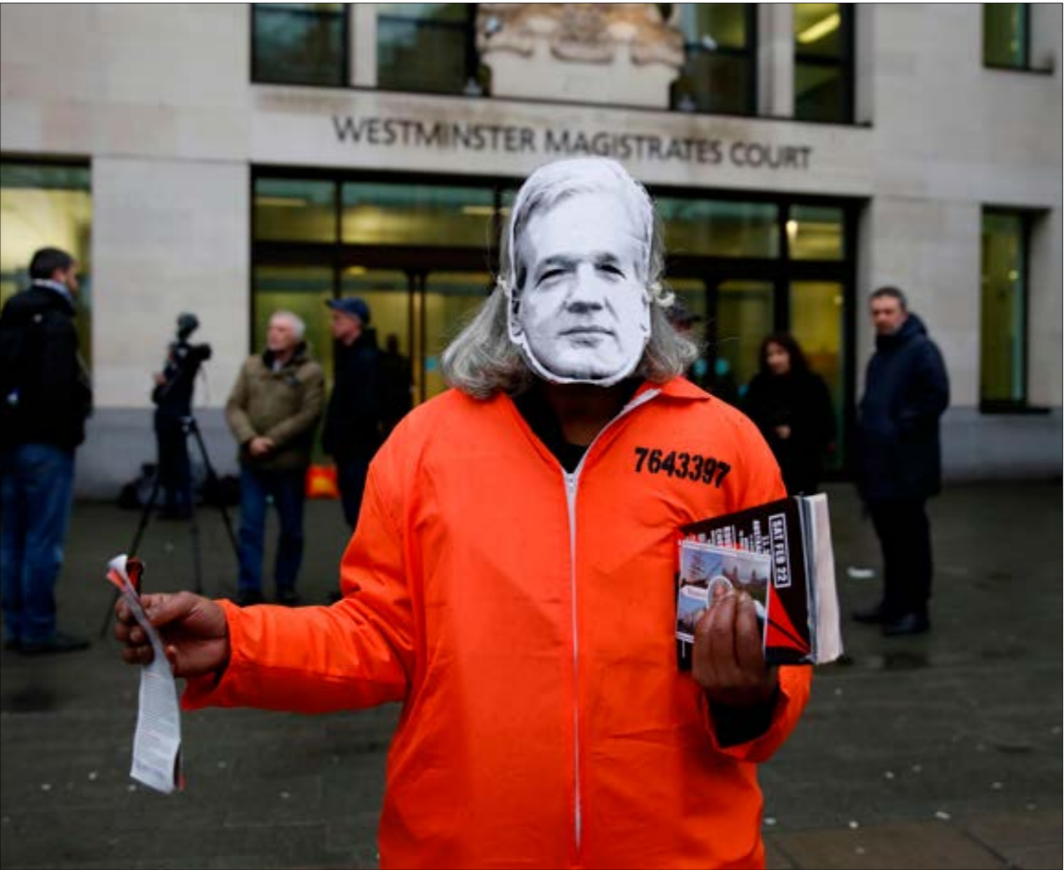
تسألف محكمة وستمنستر، الألبت، جلسات مراجعة طلب تسليم أسانج إلى واشنطن (أ ف ب)

علاقة لروسيا في تسريبات الحزب الديمقراطي»، وما «إذا كان قادراً على إعطاء أدلة تشير إلى الجهة التي زوّده بالبريد الإلكتروني». التعذيب حتى الموت إزاء الوضع الصحي المقلق لأسانج، والخشية من أن تُؤدّي المعاملة السيئة والتعسفية إلى أن يدفع حياته ثمناً لذلك، نُشرت مجموعة أصام القضاء البريطاني خلال جلسة عُقدت الأربعاء، مشيراً إلى وثيقة ذكرت فيها محامية أسانج، جينيفر روينسون، أن اقتراح ترامب قدّم عبر النائب الجمهوري السابق دانا روهرباخ، الذي التقى أسانج وتحدّث عن اقتراح الرئيس «عفواً» أو إجراء آخر إذا أكد أسانج أن لا