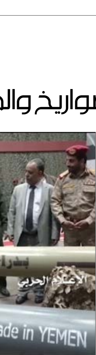
تطلّع عملية ينبع قفزة نوعية اضافية في مسار، عام الحسم» (أ ف ب)

مثّل قصف ميناء طرابلس أبرز الخروقات العسكرية التي شهدتها ليبيا في الأيام الأخيرة. برّزت قوات المشير خليفة حفتر الأمر بالزعم أنها استهدفت سفينة استخدمها تركيا لجلب الأسلحة والمقاتلين، لكن ليس ثمة دليل فعلي على تصرّ أي سفينة في الميناء، من جهةها، قات حكمة في ليبيا «احتلال»، تعبّر المسيطرة على طرابلس، إن القصف كان يطاول سفينة محمّلة بالغاز، ويؤدى إلى خسائر بيئية وبشرية.