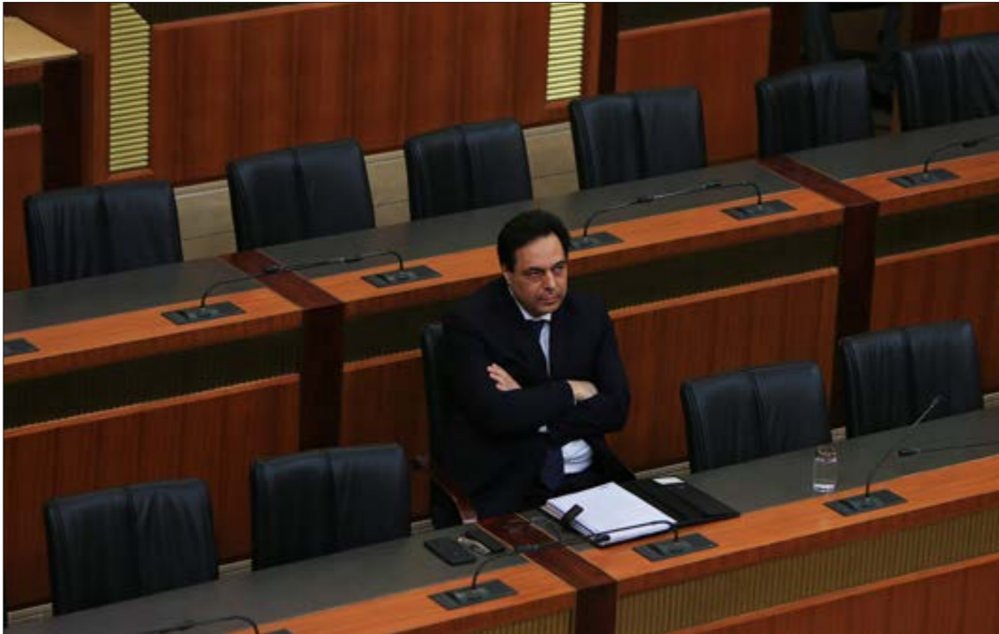
من السداحة المتفاد بوصوله نائب رئيس الجامعة الأميركية الى رئاسة الحكومة بلا دعم مخفي

في الغالب، قبل التاليف، اعتادت هاتان العاصمتان بالذات - بيازاء حكومة تمثل لونا واحداً كحكومة الرئيس نجيب ميقاتي عام 2011 - توجيه التحذير علماً تارة - لدعم لبنان ومساعدته على أكثر من صعيد. كلتا العاصمتين الكبيرين لم تُدل بعد بدلوها، ما يضمن عموضاً في الموقف يتجاوز التريث. الذريعة المعلنة في حسابان حكومة دياب أنهمما تنتظران ما ستفعله لمعالجة ضائقة الداخل، وهو أقل الأهمية بالنسبة اليهما . وما ستقدم عليه في خيارات للرياض دعوة رئيس الحكومة الى زيارتها. ما يحصل