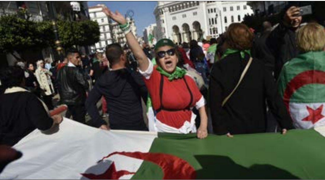
من التظاهرة التي شهدتها العاصمة الجزائر امس

يمكنه إخراج البلاد من عنق الزجاجة، أجريت الانتخابات بعد سلسلة خطوات استهدفت تفكيك الإحتقان واكتساب المصداقية أمام الجمهور (من قبيل إطلاق سراح المعتقلين، وإصدار أحكام مشدّدة بحق رموز النظام السابق). وأفرزت العملية، التي شكّك «حراكيون» في نزاهتها وتحدّثوا عن نسبة مقاطعة واسعة لها، وصول عبد المجيد تبوّون، وهو أحد وزراء عهد بوتفليقة، إلى رئاسة البلاد. وإطار، تقول مديرية البحوث في المركز الوطني للبحث العلمي» في فرنسا، كريمة ديريش، إن البعض يريدون رؤية الأمور تسير بشكل أسرع وأسرع بكثير، لكنني أعتقد أن هذه الوتيرة مناسبة جداً لهذه الحركة الاحتجاجية غير المسبوقة.»