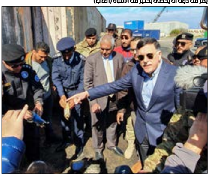
حشد العتاد العسكري من طرفه النزاع في ليبيا يبرح من دون أن يحظى بكلير من النتائج

صعده، أجبرت السلطات السعودية عشرات الناشطين على حذف مشاهد الانفجارات في ينبع (والتي استمرت لأكثر من نصف ساعة) من على حساباتهم، مُتوعدة من يبقياها للدعو بأن يستبيح دمه من دون تدقيقه الثمن.»