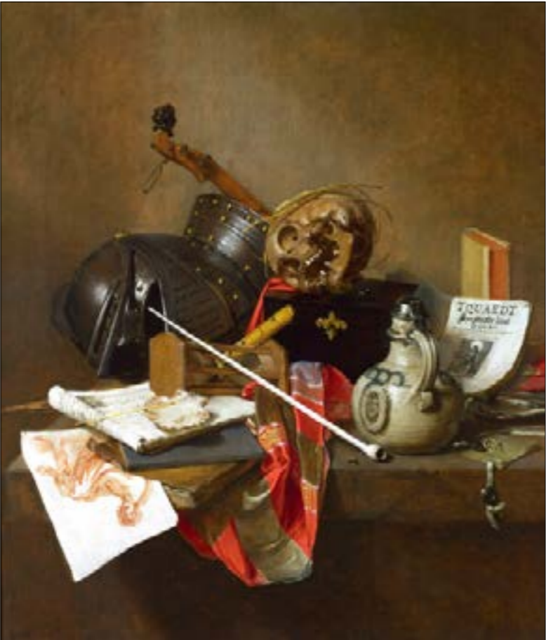
ياث تريك ... طبعة مينة، (رنت على لوح سندان، 1648)

في دم الليل وتسيل شرفات المدينة تنهيداً وأمواجاً، لتضم النافذة الغاية، وتضم الصدفة البحر، وأصير طرياً كجدران السجون كمنخال الذئب ومعلو الحائوتي في الحرب.