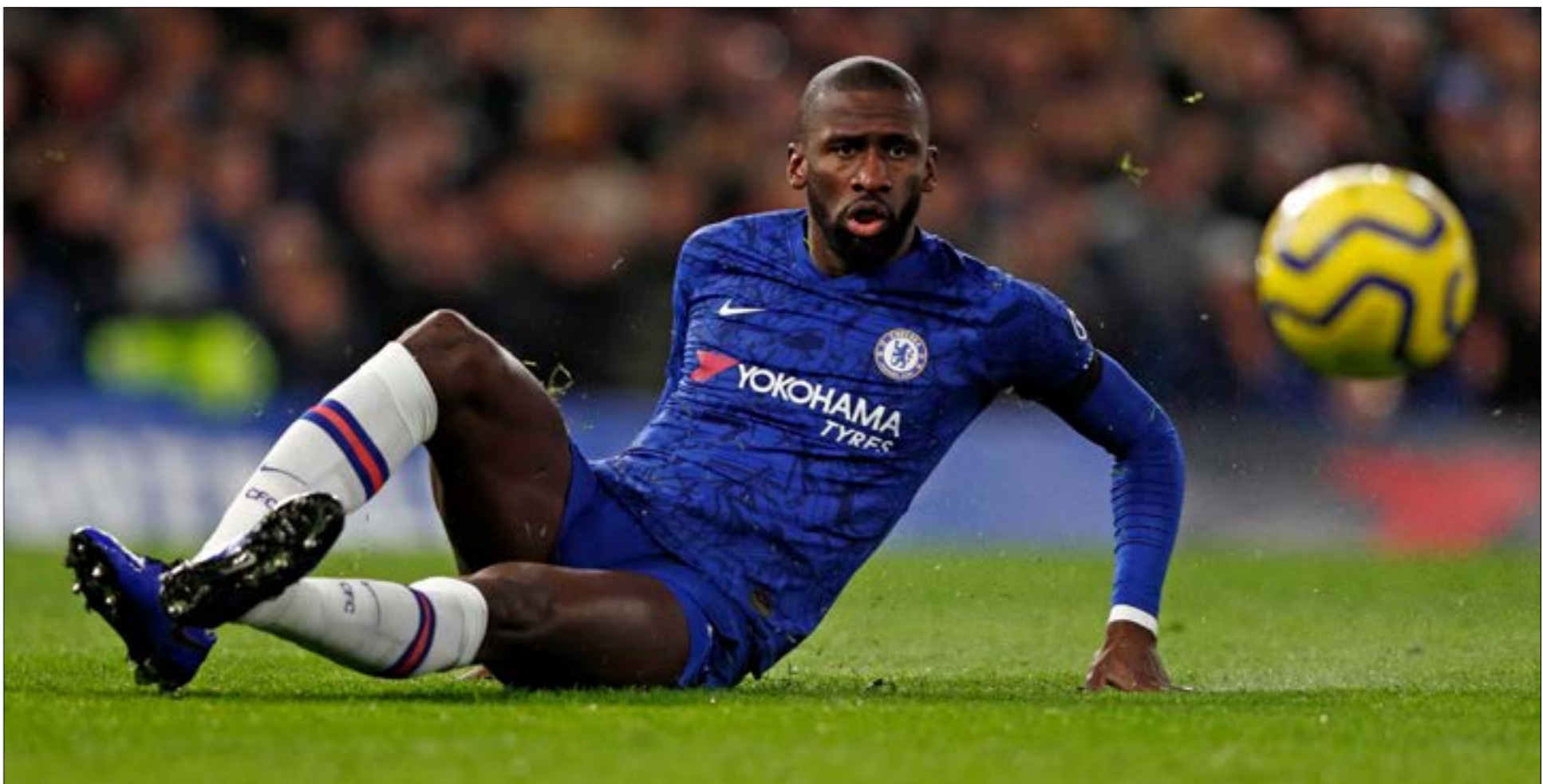
فاز تشلسي مرة واحدة في اخر 5 مواجهات