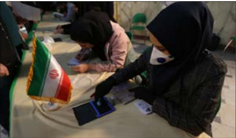
شهدت الانتخابات البرلمانية امس تعديدا لفترة التصويت حيث منصف البنك في بعض المناطق (أ ف ب)

المصنّعة معلومات عسكرية سرّية». على هامش استئناف جلسات مراجعة طلب تسليم أسانج إلى واشنطن (أ ف ب) محكمة وستمنستر لمراجعة طلب تسليم أسانج إلى واشنطن (أ ف ب) المحلّة السابقة لدى الاستخبارات الأميركية تشيلسي مانيغ، في دون مضيّ لندن في الخُصوع للأوامر الأميركية. حراكٌ تساقق مع مؤشرات إلى عزم الرئيس الأميركي، دونالد ترامب، العفو عن أسانج، باشرط أن يقدّم هذا الأخير دليلاً يؤكد عدم توطؤ روسيا في تسريب رسائل البريد الإلكتروني الخاصة بهيلاري كلينتون، والتي ساهمت في ضرب مصداقية المرشحة الديمقراطية خلال مرحلة حاسمة من الحملة الانتخابية في عام