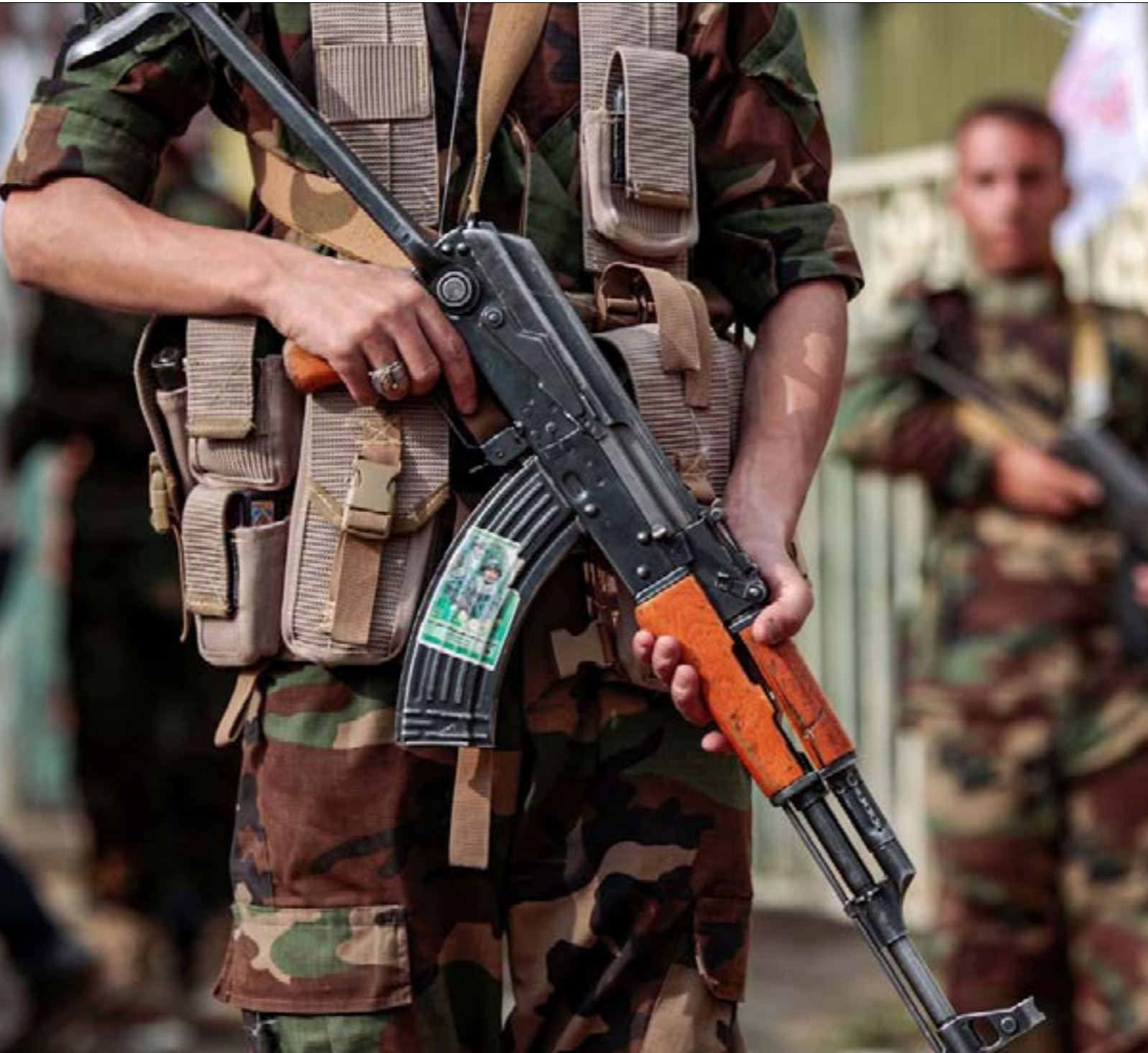
ووصفت مصادر في حكومة هادي ما حدث بـ«نكسة نهم»

جبال نهم الاستراتيجية، ومحاصرة القوات الموالية لحكومة عبد ربه منصور هادي ومعها ميليشيات «الإصلاح» في غير موقع من المنطقة، وإيقاع اعداد كبيرة من الأسرى في صفوفها، كلها محفوظة في كاميرا قوات صنعاء التي تنتظر اللحظة المناسبة للكشف عنها، والتي يمكن توقع قيام «التحالف» بالتوسط لدى «أنصار الله» لتأخيرها أو إلغائها من أصلها مثلما فعل