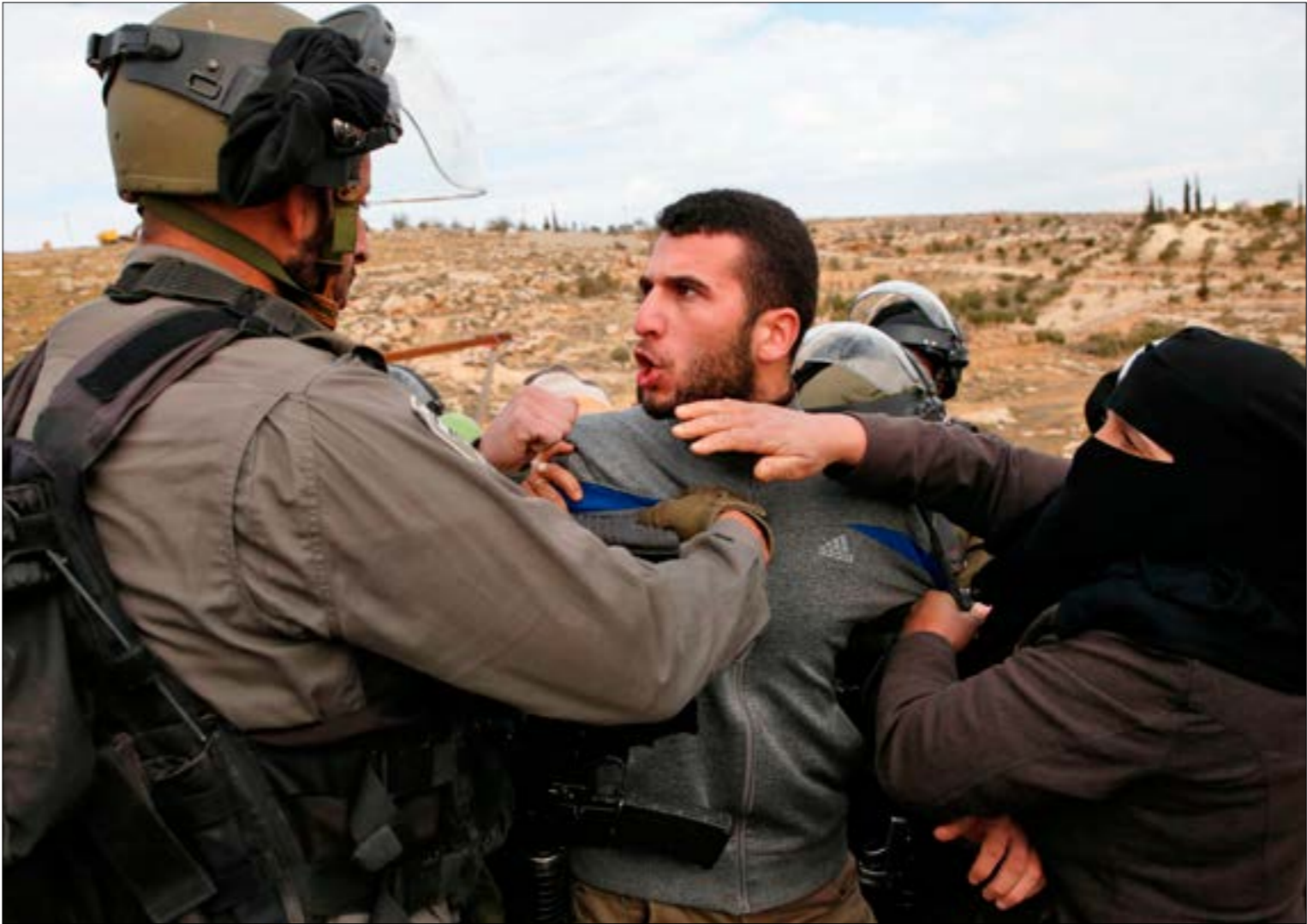
تتوقّع اسرائيل تصعيداً اقليمياً ومكرباً، لكنه «ان يكون منظرها»

إجراء الضمّ هو إهمّ نتيجة فورية لها، وهو يفسّر الإسراع في إعلانها قبل الانتخابات الإسرائيلية، وفي توقيت مفيد جداً لنتنياهو، يحقق له مصلحة شخصية يتخزّر عليه تفويت فرصتها، في سياق الصراع الدائر على حصانته من معدما، وإمكان