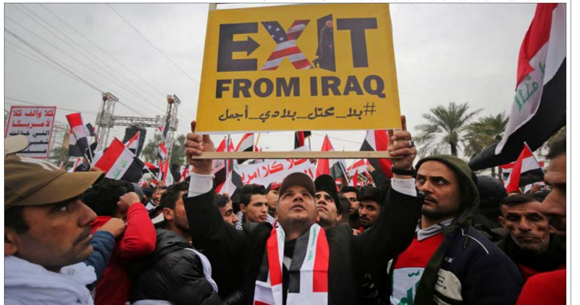
خطاب «المليونية» حاز رضى «المرجعية الدينية العليا» (آية الله علي السيستاني). والتي نبّته على طريقتهما في موقعها أمس (اف ب)

أطلقت على تظاهرة أمس تسمية «ثورة العشرين الثانية»، في استعادة تاريخية لثورة 1920 ضد الاحتلال البريطاني والأميركي التي عكفت طوال الفترة الماضية على ترسيخ كذبة أن «العراقيين يريدون وجودنا»، كما ظهر وزير الخارجية الأميركي، مايك بومبيو، قبل أيام.