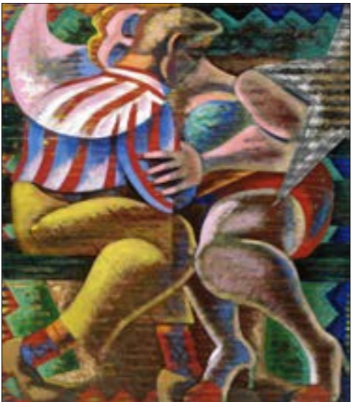
جاء غريز _ القبلة، (الكريليك على لوح _ 94 x 116,8 ستم، 2019)

لترجمة أسامة أسعد المش شفقتك، المش بإصبع طرف شفقتك، أرسدُ فمك كما لو أنه يولد من يدي، كما لو أنه كان يفتّر للمرة الأولى، ويكفيني أن أغمض عينيّ لأموح كل شيء وأبدأ من جديد. في كل مرة ألدّ الفم الذي أشتهي، الفم الذي تختاره يدي من بين كل الأقوام، وترسمه على وجهك، الفم الذي اختاره بحرية كاملة لأرسمه بيدي على وجهك، والذي يحض صدفة لا أريد أن أفهمها، يتسم تحت الفم الذي ترسمه تظنّرين إليّ، تظنّرين عن كذب، تقترين أكثر فأكثر وتظنّرين إليّ، تلعب لعبة السيكلوب، تكبّر