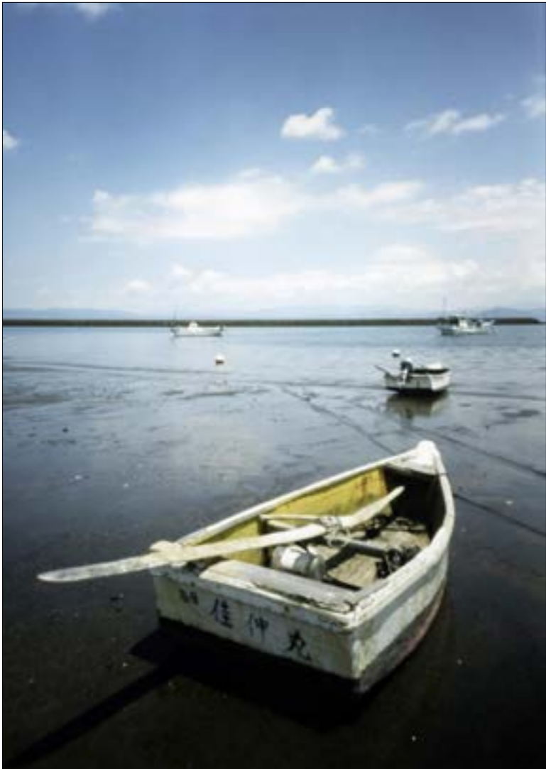
يوكي سيلج _ البحر الذي لا نراه، (2016)

* ولد الشاعر الفرنسي أوجين غيلفيك في مدينة كرنك من مقاطعة بروتاني الفرنسية سنة 1907. درس الرياضيات والاقتصاد وعمل في وزارتي المالية والاقتصاد منذ 1926. تقاعد سنة 1967 من عمله وكان في منصب مفتش في الاقتصاد القومي. ناصر الشيوعيين منذ الحرب الأهلية الإسبانية وانتسب إلى الحزب الشيوعي الفرنسي أثناء الحرب العالمية الثانية. بدأ بالنشر متأخراً فأصدر أول مجموعة شعرية سنة 1942. من أعماله: «كرنك»، «الريح»، «الدينة»، «الداثرة»، «إحدى وثلاثون سونيتاً»، إلخ... توفي أوجين غيلفيك سنة 1997.