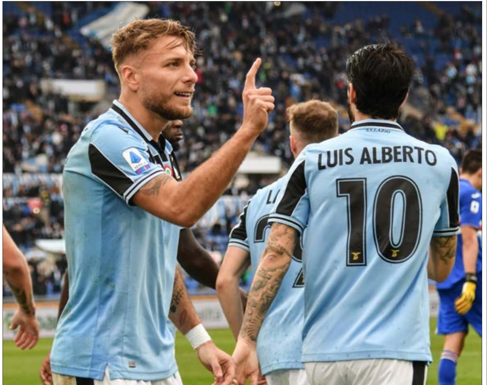
تبدو حظوظ لانسوي أكبر للفوز بالدوري