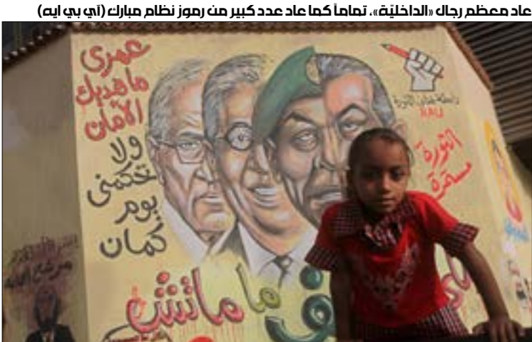
عاد معظم رجال «الداخلية»، لكاما عاد عدد كبير من رموز نظام مبارك

في المقابل، بدأت «الداخلية» استراتيجية جديدة على غرار ما تقوم به الشؤون المعنوية للجيش» من أجل تحسين صورتها، ليس إعلاميا فقط بل دراميا أيضاً، إذ صدرت تكليفات بتكثيف التعاون مع الفنانين لتقديم من الديكتاتورية الجديدة «الناعمة ظاهراً»، وخاصة أن المخاوف من التحرك في الشارع قائمة على رغم القمع غير المسبوق والمستمر، وبإشر الصربا ضباط تواصلاً محتثفا مع الخطات يتجاوز فكرة الاحتفال بـ«عيد الشرطة» إلى توجية الضيوف للحديث عن إنجازات ويطولات ربما غالبيتها لن تكن بالصورة التي يُحكي عنها.