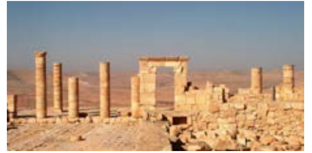
معبد مدينة عبادة النبطية في النقب في فلسطين

في عام 1979 اكتُشف نقش عربي - نبطي يحوي في ما يُعتقد بيتين من الشعر العربي. وقد وقته ناشروه بنهاية القرن الأول الميلادي وبداية الثاني (بين 80-125 م). هذا فهو يقدم لنا أقدم نص شعري عربي قبل الإسلام بـ 500 سنة تقريباً نملكه حتى الآن. عُثر على النقش في «عين المريفتة» أو «عين عبدات» كما دعاه الإسرائيليون. وتقع العين على مبعدة أربعة أو خمسة كيلومترات من مدينة «عبدات» النبطية في النقب في فلسطين. والحق أن الاسم هو «عبادة» وليس «عبدات»، نسبة للإله العربي القديم «عبادة» الذي تسمى باسمه عدد من الملوك الأنباط.