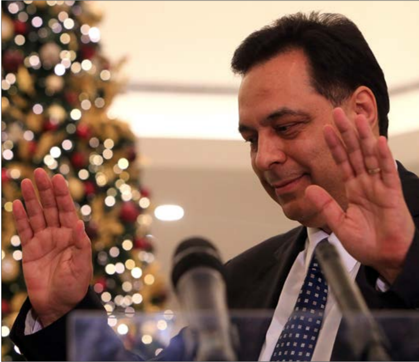
موازنة 2020 تحت ولاية المجلس منذ تشرّيت الأول، ولا امر آخر بلتقمها (ميام الموسوي)

مثول حكومة الرئيس حسام دياب أمام مجلس النواب، قبل نيلها الثقة، لمناقشة مشروع قانون موازنة 2020، سابقة في الحياة الدستورية اللبنانية. لم يهدف هذا اتفاق الطائف تقاطع بين موازنة في عهدة البرلمان وحكومة جديدة لم تلك ثقته بعد