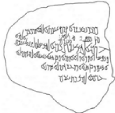
رسم النقش من كتاب يردني

أما الجزء العربي من النقش في السطرين الرابع والخامس فيقول بالحروف العربية: