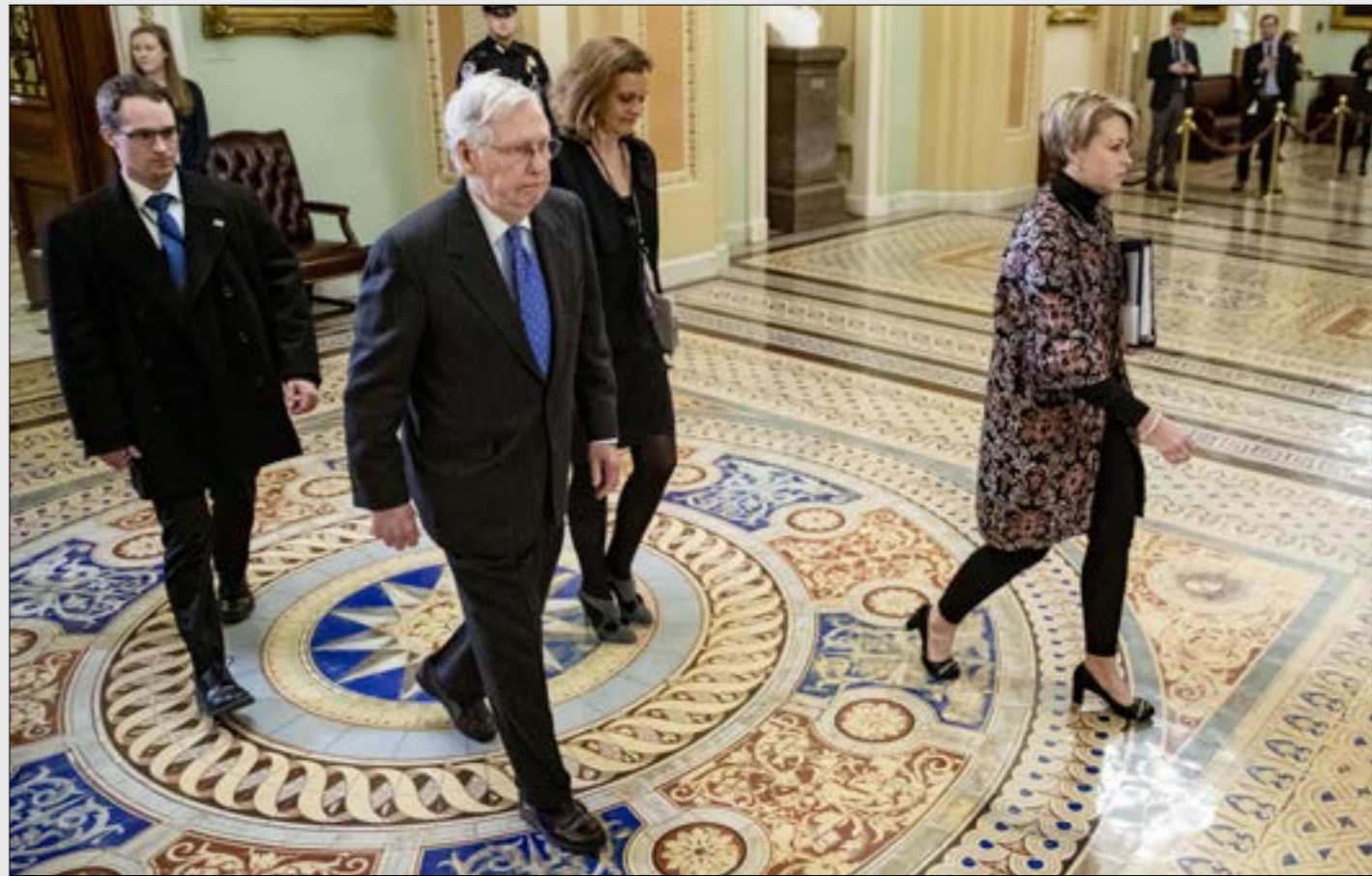
تد نيهي ماكوكيل المحكمة جلسة تصويت على تيرة ترامب بحلوك نهاية الاسبوع المقبل