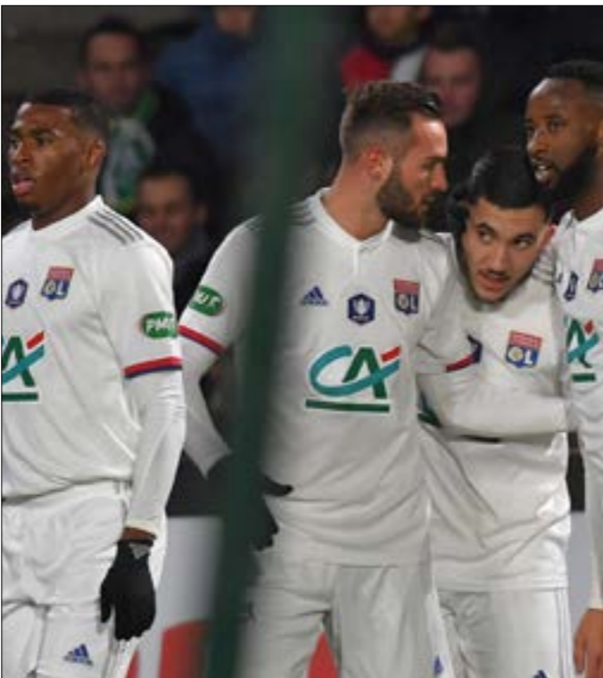
لم يبق ليون على ليه فيه اخر 5 مباريات على ارضه

كان داخل القواعد أو خارجه. وفشل ليون في الفوز على ليل في المباريات الخمس الأخيرة التي استضافه فيها (جميعها في الدوري) وتحديدًا منذ تغلبه عليه 3-صفر في الخامس من تشرين الأول/أكتوبر 2014. وخسر ليون أمام ضيفه ليل ثلاث مرات أخرها في الثالث من كانون الأول/ديسمبر الماضي عندما سقط بهدف وحيد سجله جوناثان إيكوني، مقابل تعادلين. كما أن الأمر «ليس إلغاء ولكن تعليق».