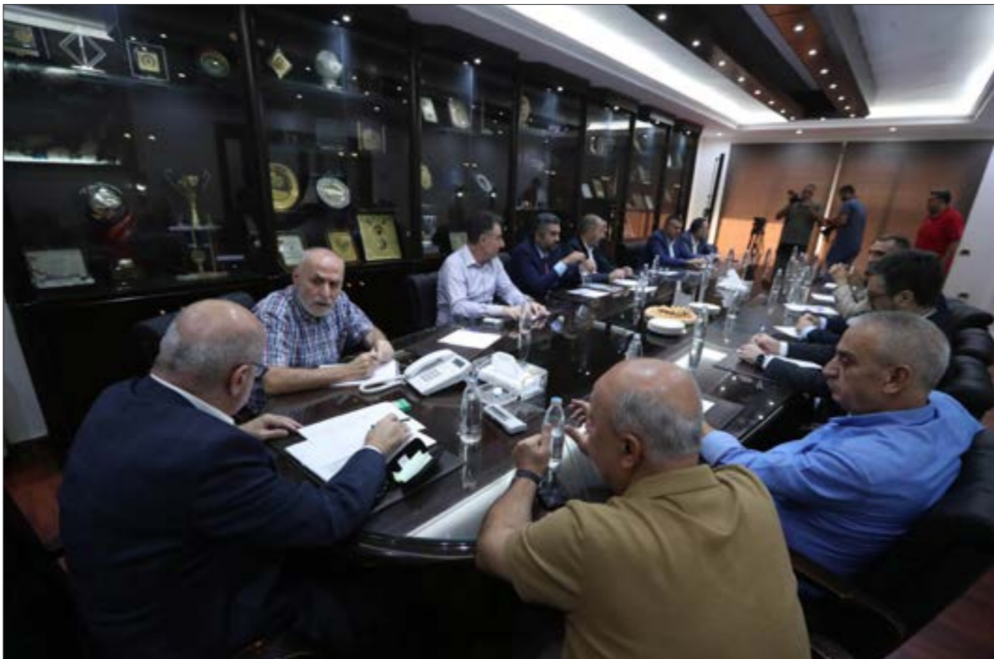
اتخذت اللجنة التنفيذية قرارها خلال اجتماع عقده امس

اتخذ الاتحاد اللبناني لكرة القدم القرار المر وعُلق الموسم الكروي حتى إشعار آخر. أسوة بالتحدي كرة السلة والكرة الطائرة. فرض الواقع نفسه بعد ان «لعبت» ظروف عدة ضد كرة القدم اللبنانية. بدءاً من الاوضاع السياسية والاقتصادية والامنية وانتهاءً بموقف اندية الدرجة الاولى وتحديد انادبي النجمة وشباب الساحل