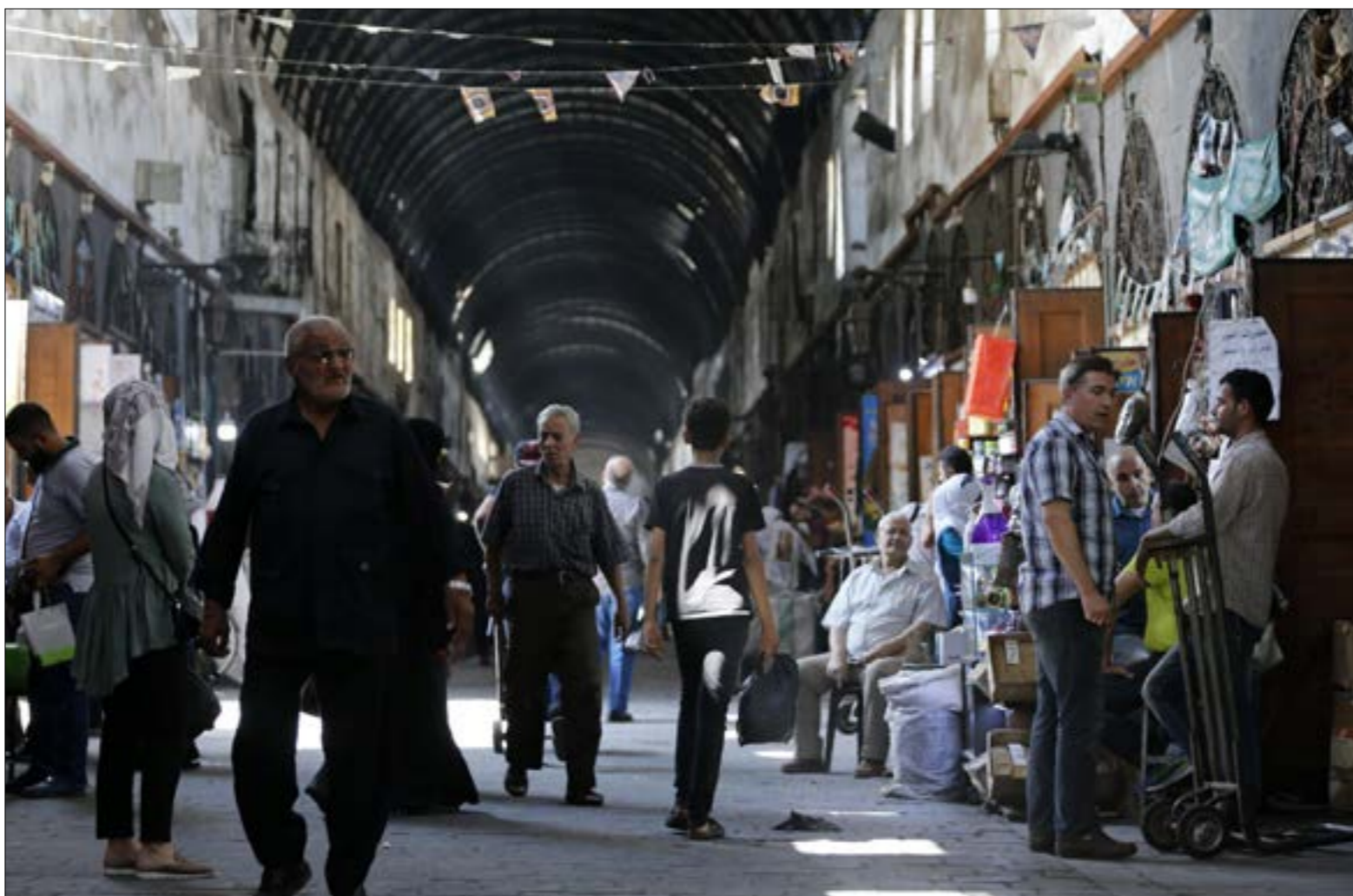
لم يتمّ توقيف أيّ رجل أعمال بك شح لهم بإجراء تسويات مالية

انتحائية لهم أو تحريك حساباتهم، ثم الحجز الاحتياطي على أموال أحد أشهر هؤلاء الثمانيّة، والذي طلب منه تسديد مبلغ كبير جداً، وفعل