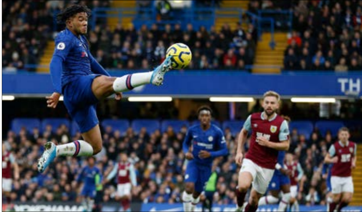
خسر تشلسي المباراة الأخيرة أمام نيوكاسل

نيو في الشوط الثاني كانت كفيلة بمحجم النقاط الثلاث ليبقوا في المركز السادس خلف يونايتد بفارق الأهداف فقط. وكان ليفربول قد تفوق على الذئاب بهدف نظيف على ملعب انفيلد رود في اللقاء الذي جمعهما في 29 كانون الأول/ ديسمبر الفائت.