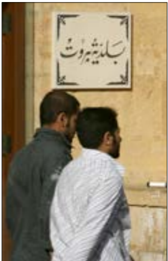
ليس المهذب من تقديم الحصص الغذائية مساعدة الفقراء، ما سيفتح الباب على التضييعات والمحسوبيات