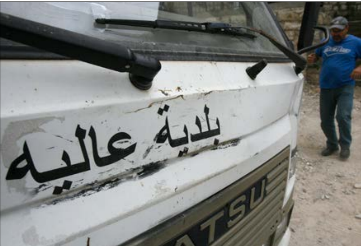
بلديات عدة قلّصت خدماتها وخفضت رواتب العاملين فيها

على رواتب تلك السلطات المحلية. فعندما يحين وقت الانهيار سيصبح نحو 15 ألف موظف بلدي، ما بين ثابت متعاقد ومياوم، على حافة الجوع مع عائلاتهم، ناهيك عن صانعيهم اليوم بلا أسبب مقومات الحياة بعد صرفهم من أعمالهم. وما يزيد الطين بلّة ويسرّع من الوصول إلى موعد الانهيار هو تدني