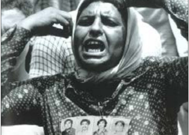
صديقة فارس (أم تيسير) تطالب في اعتصام لهالهي المفقودين والمختطفين بالكشف عن مصر يوها وهاولها الألالة - 1984 (فريم سميت)