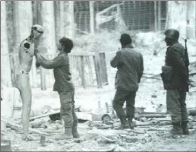
وسط بيروت. 21 تشرين الثاني 1976 (معدنات ناجي)

الناظر في مسيرة قيوهجيان، يلخص حتماً الهاجس الذي يسكنه كصحافي أولاً، وكلبناني يتحدر من جبل الحرب الأهلية. هاجس اعتقد أن حلقة أو مجموعة حلقات تلفزيونية قد تفي بالغرض، إلى أن توسعت الدائرة صيغة أخطر «بعد البعد» للوجوه والأماكن التي طأها تشويه الحرب، وربما تشويه آخر بعد الحرب، زادت بشاعة لا سيما الأماكن في بيروت جهوداً حثيثة للفرص في أرتشف والوضاحي.