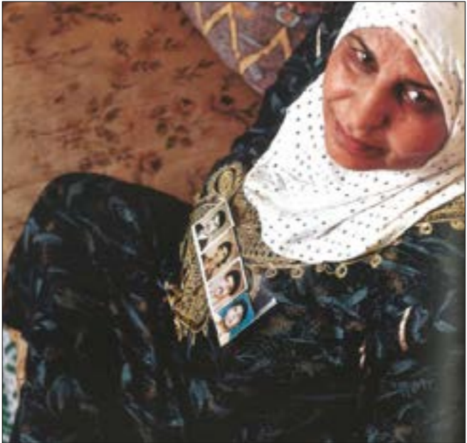
أم تيسير للنظر - 2002

الناظر في مسيرة قيوهجيان، يلخص حتماً الهاجس الذي يسكنه كصحافي أولاً، وكلبناني يتحدر من جبل الحرب الأهلية. هاجس اعتقد أن حلقة أو مجموعة حلقات تلفزيونية قد تفي بالغرض، إلى أن توسعت الدائرة صيغة أخطر «بعد البعد» للوجوه والأماكن التي طأها تشويه الحرب، وربما تشويه آخر بعد الحرب، زادت بشاعة لا سيما الأماكن في بيروت جهوداً حثيثة للفرص في أرتشف والوضاحي.