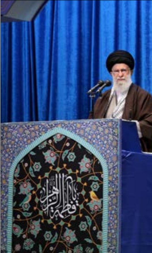
خامنئي، «إعلام العدو يتهم إيران بالارة حروب بالنيابة وهي قرية كبرى»، (من الوب)

الظالمين الجرمين، وأن تجعل سوريا ولبنان تحت سيطرة الحكومات التابعة لها والعميلة، وتريد العراق الشركات الناهية»، وتابع: «أعداؤنا ولتحقيق هذا الهدف المشؤوم، لا يتوانى عن ارتكاب الظلم والعدوان، الاستحسان العسبر الذي سرت به سوريا والفتن المتوالية في لبنان، والأعمال الاستفزازية والتخريبية المستمرة في العراق نماذج لذلك»، وهاجم الزعيم الإيراني الترويكا الأوروبية (ألمانيا وبريطانيا