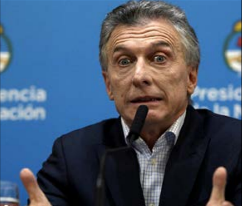
كان ماركري، يستخدم الرموز والمعالمات البيرونية بذكاء، (أف ب)

أميل، الذي برز في إدارة ماركي منذ أواخر التسعينيات قبل أن تتوتر العلاقات بينهما، أي تيار سياسي في الأرجنتين، فيما يؤكد ريكيلمي دائماً أن لا علاقة له بالسياسة، وأن كل تركيزه منصب على كرة القدم فقط، على رغم أن تصريحه الأخير عن أن «البلد كله يعلم أنه يتعين علينا الفوز» فسّر على أن هناك أهمية سياسية في التصويت (شهدت هذه الانتخابات أعلى نسبة تصويت في تاريخ الأرجنتين، حيث بلغ عدد المصوّتين أكثر من 38 ألف عضو، محطماً بذلك رقم الغريم ريفر بليت قبل عامين عندما بلغ عدد المصوّتين 18 ألفاً. كما أنه يمثل ثاني أكبر نسبة تصويت عالمياً بعد انتخابات نادي برشلونة الإسباني سنة 2010، والتي سجلت تصويت أكثر من 57 ألف عضو. مع هذا، تخلت الصحافة الأرجنتينية