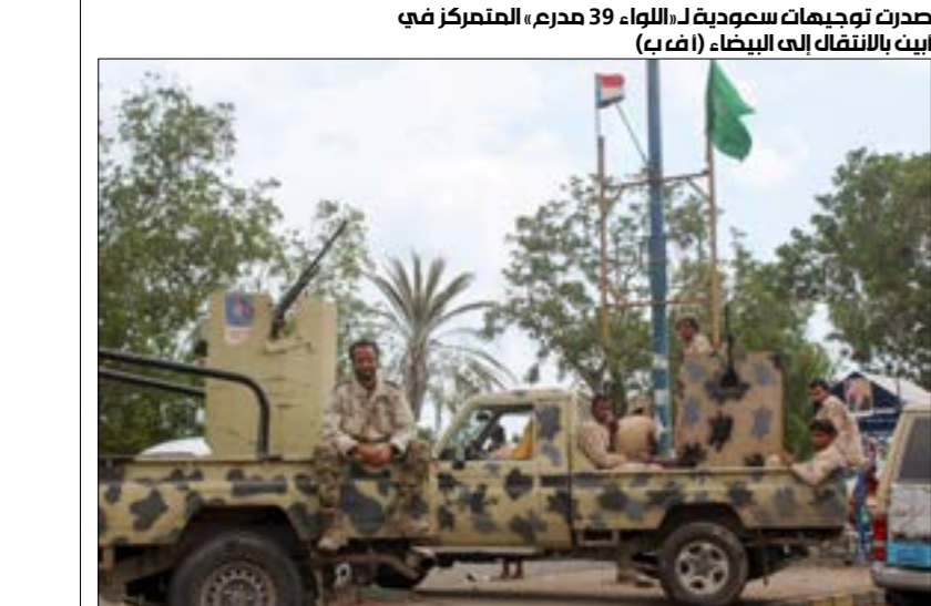
صدرت توجيهات سعودية لـ«الواء 39 مدرم، المتمركز في

كذلك، تجدر الإشارة إلى تكرار ذكر أعمال «اللجنة الدستورية» في تصريحات المسؤولين الروس والأتراك خلال اليومين الأخيرين. وللعارضه، وعلى رأسها الرياض. واستكملت الأخيرة خططاً لإعادة هيكلة «هيئة التفاوض»، مقرونة بنجيات لتعويم الأخيرة وفرض هيمنتها على واجهة المشهد المعارض، في مقابل فكفكة تدريجية لـ«التحالف المعارض»، المحسوب على انقرة بالدرجة الأولى. لكن إصرار هذا السيناريو لا يزال محكوماً بحسم انقرة لخياراتها، وفقاً لتوازنات مصالحها الإقليمية، مع تمسك موسكو بضرورة إرضاء اللاعب التركي، وإبقائه شريكاً في عواقم الملف السوري. كذلك، تبرّز عقبات أخرى تتخضّ بالمشهد الدولي بعمومه. وينبغي، في هذا السياق، التركيز على ما قاله وزير الخارجية الروسي سيرغي لافروف، أمس، من أن «عملية التسوية في سوريا وصلت إلى مرحلة متقدّمة، لكن مسار إعادة الإعمار لا يزال متأخراً بعض الشيء، بسبب موقف بعض الأطراف