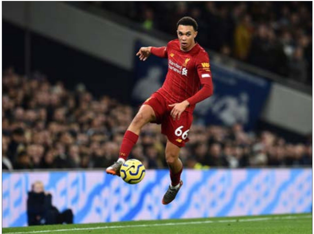
يعتبر ليفربول أفضل ناد في العالم اليوم

واتقاً الأحد للخروج بشباك نظيفة، خصوصاً في ظل إصابة نجم هجوم يونايتد ماركوس راشفورد. ومن جهته قال سولشاير: «لم أرغب بإشراكه، لكن كنا بحاجة للفوز. ارتد الأمر علينا». في المقابل، يستقبل سيتي ومدربه الإسباني بيب غوارديولا كريستال بالاس اليوم بعد نجاحه بالفوز 9 مرات في آخر 10 مباريات في مختلف المسابقات. ويأمل «سيتيزين» في استعادة