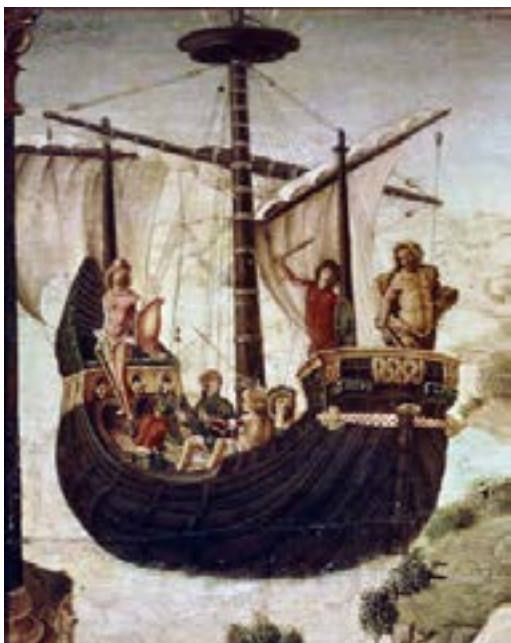
«أرغوس يغادر كولخيس، للإيطالي لورينزو كوستا (تفصيل - 90/1480)

ثمة صنم عربي يدعى شمس. وهو صنم شهير، وإن كنا لا نملك صورة له. وقد تسمت باسمه قبائل ويطون عربية من بينها بنو أمية بن عبد شمس: «شمس: صنم قديم. وعبد شمس: بطن من قريش، قيل: سموا بذلك الصنم» (لسان العرب). وقد ورد اسم هذا الإله في النقوش الصفائية العربية الشمالية المنقوشة على الصخور بأبجدية قديمة غير الأبجدية العربية الحالية. مثلاً، ورد الاسم في النقش الصفائي C 25: «فها شمس وها جدعوض وها لات عاقب بحرم ذي سلف وعور». والنص يطلب من الإلهة شمس وجدعوض واللات معاقبة من يخرب الكتابة.