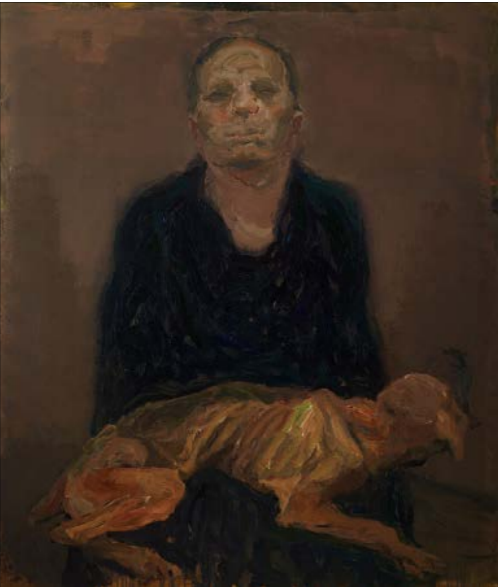
من دون عنوات للفتاة المرابي سنوان باران (كرويلك على كاتفااس _ 170 × 138 سنتم _ 2017)

على ترعج قمرنا وإغواء شمسنا لكي لا تشرق سوى عليهم؛ (هل تذكر المهرجان المسرحي؟ أما رأيناهم وهم يُنطقون الخواء؟) أتري؟ إن مقولات اليونان الأولى مقلوبة والبديهيات مقووبة فيما النشاز يؤسس انسجامه حيث اللامعقول يفرض سطوته