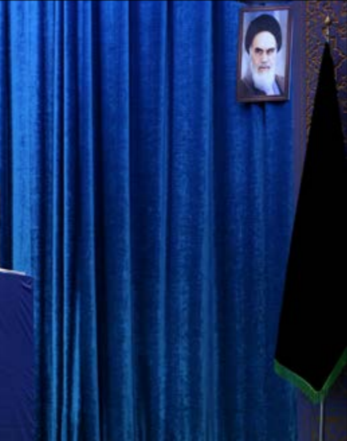
خامنئي، «إعلام العدو يتهم إيران بالارة حروب بالنيابة وهي قرية كبرى»، (من الوب)

وتوجه خامنئي في الختام بكلمة بالعربية أشاد فيها بكل من المهندس وسليمانى، ودعا العرب والمسلمين إلى إحياء الثقة بالنفس وعدم الرهبة من العدو والتعاون والتقارب علمياً وثقافياً واقتصادياً وعسكرياً: «التلاحم بين قوانا العسكرية سيبعد المنطقة كلها عن الحروب والعدوان، والارتباط بين أسواقنا سيحرر اقتصاد بلداننا من سيطرة الشركات الناهية»، وتابع: «أعداؤنا ولتحقيق هذا الهدف المشؤوم، لا يعداؤكم يريدون أن يحققوا تقدمهم الاقتصادي على حساب ثروات بلداننا، وأن يبنيوا عزتهم على حساب ذل شعوبنا، وسيخدوا تفوقهم بضمخ تفوقنا.. يريدون إبادةنا على أيدينا». وزاد بالقول: «أميركا تستهدف أن تجعل فلسطين دونما قدرة على الدفاع أمام الصهباينة