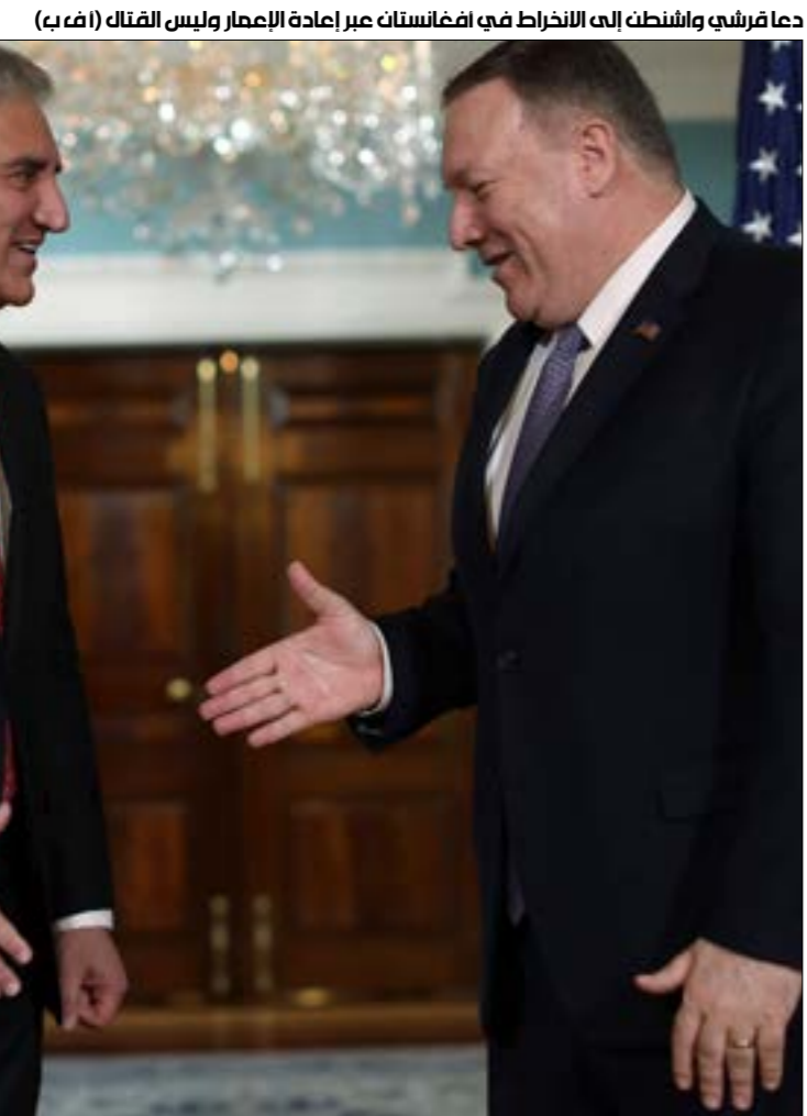
دعا قرشي واشنطن الى الانخراط في افغانستان عبر إعادة الاعمار وليس القتال

كما حدث بعد عام 1989 عقب انسحاب القوات السوفياتية منه تحت ضغط المقاتلين الإسلاميين المدعومين من واشنطن وإسلام آباد، قائلاً في كلمة له أمام «مركز الدراسات الاستراتيجية والدولية»، أول من امس، إنه «حتى لو تمّ إبرام اتفاق ناجح، فإن التحديات ستبقى ماثلة، لذلك يتعيّن على الولايات المتحدة أن تقوم مع صدقاتها وشركائها في التحالف بانسحاب أكثر مسؤوليّة». في موازاة ذلك، أكدت «طالبان» على لسان الناطق باسم مكتبها