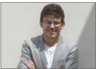
أنس البريحي: «أقنا الأرض»

رَكَز التشكيلي السوري أنس البريحي (1991 - الصورة) عمله في الفترة الأخيرة على العمال، سواء في أوقات فراغهم أم أثناء ممارسة أعمالهم الشاقة. بعد رحلات متكررة إلى مسقط رأسه السويداء، عاد البريحي بمجموعة جديدة تصور استمرار العمل اليدوي، خصوصاً في أوساط النساء، في أعقاب الحرب التي اشتعلت في البلاد خلال السنوات الماضية.