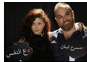
تعلّم التمثيل مع شادي ومايا

«إتيل عدنان: انتفاضة الألوان» (Etel Adnan: The uprising of colors) هو عنوان المعرض الجديد الذي تحتضنه غاليري «صغير زملر» (الكرنتينا - بيروت) بدءاً من 23 كانون الثاني (يناير) الحالي لغاية 11 نيسان (أبريل) 2020. في الحدث المرتقب، سيستمع الزوّار بمروحة واسعة من الأعمال القديمة والجديدة التي تحمل توقيع الشاعرة والفنانة اللبنانية البالغة 94 عاماً (الصورة). في ظلّ الأوضاع الصعبة التي تعيشها البلاد، يأتي المعرض بمحتوياته المنوعة الصاخبة بالألوان والضاحّة بالحياة، لبشكل فسحة أمل وسعادة. فهو يشمل مختلف الوسائط التي استخدمتها إتيل في أعمالها: لوحات على كنفاس، رسومات،