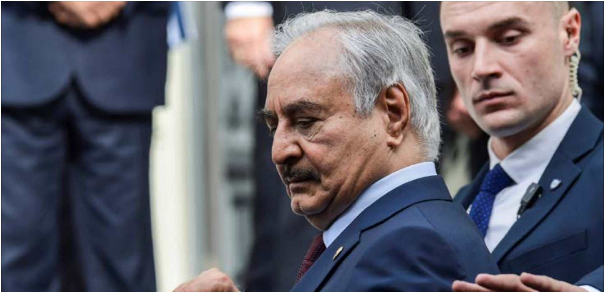
شهد يوم أمس محاولات لإقناع حفتر بالتعامل عقلياً مع مخرجات «مؤتمر برلين»، (أ ف ب)

أن تُشكّل قوة دولية لمراقبة خطوط وقف إطلاق النار. لكن الوقت لا يزال مبكراً للجزم بنجاح المؤتمر، وخصوصاً أن نمة العديد من الإشارات السلبية، ففي ما يبدو تصعيداً ميدانياً، أعلنت قبائل في شرق ووسط ليبيا، أمس، نخبّتها قطع إمدادات الذفع حتى لا تذهب موارده إلى حكومة «الوفاق». وعلى رغم أن سلطات شرق البلاد لم تتبنّ هذا التهديد، إلا أنها لم تُدنه. وبالنظر إلى سطوة حفتر في مناطق تلك القبائل، فالظاهر أنها تتحرك بتوجيهات منه، كي يبقى تهديدها ورقة يمكن استخدامها في المستقبل القريب. وعلى النحو ذاته، أعلن مدير إدارة التوجيه