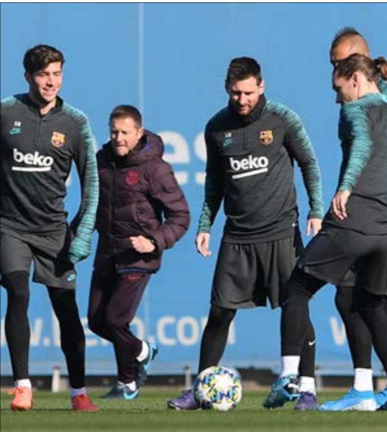
يحتل برشلونة نقاط قوية كبيرة في خط الهجوم

هي مباراة الصدارة. تحفة منتصف الأسبوع بيت الثنائي التاريخي للا «ليغا» الإسبانية برشلونة وريال مدريد. 35 نقطة لكل من الفريقين. تضمهما في المركزين الأول والثاني في ترتيب الدوري الإسباني. حالياً لا يزال فارغ الأهداف هو الضيف الوحيد بين التاديين، ولكن مباراة الليلة ستحسم هوية المتحدر بعدات تقاسما النقاط لجولات عدّة