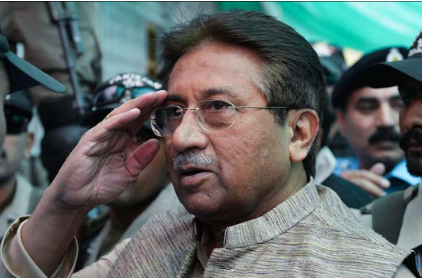
هي المرة الأولى التي يصدر فيها حكم بالإعدام في حقّ قائد سابق للجيش في باكستان