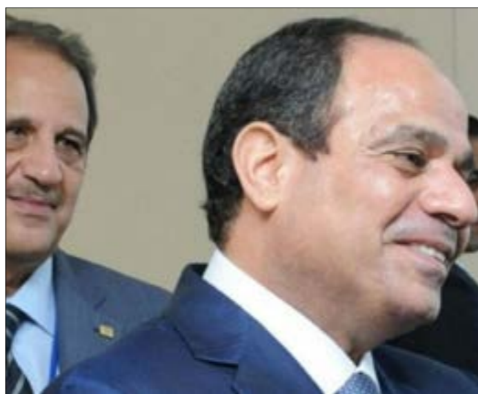
تعدّد كامل الظهور علناً أكثر من المعتاد وتحديداً بجانب الرئيس (من اليمين)

في مقاومة تنظيم «داعش» في سرت عام 2016، ومعربة عن أملها في أن تلعب مصر «دوراً جوهرياً يحظى بثقة الجميع، في إطار دعم الاستقرار والسلم الأهلي بدلاً من دعم تشكيلات