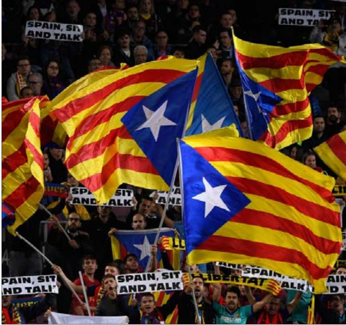
سخرم الجماهير لافتات مطالبه بالانفصال داخل الملعب

الأميني، ويتم اللجوء إليه للمرة الأولى في مباراة كرة قدم في إسبانيا. «سنحصر على إقامة المباراة سلامة تامة»، هكذا طمأن كبير مفوضي شرطة كتالونيا الخاصة إدوار سالبيت الجميع في مؤتمر صحفي عُرض خلاله التدابير التي سيتم اتخاذها من أجل ضمان إقامة المباراة وتفايدي التعقيدات. وفي حدث تاريخي آخر مرتبط بهذه القمة، سيتمك الفريقان في الغدق