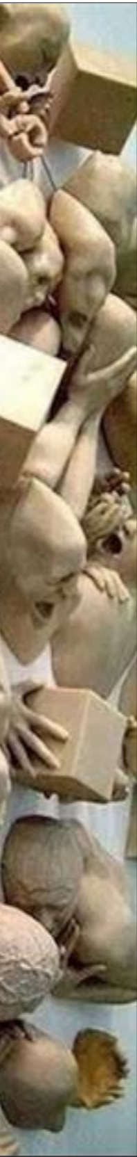
تجهيز لبنان للسباق ليحده ريكو

يرصد الباحثون بين الانقسام «الإثني» في بلدان عديدة، وبين عدم الفعالية الاقتصادية فيها. فيتمسّب السياسيون بانعدام هذه الفعالية حين يستخدمون الموارد العامة لإرضاء من يدعومونهم، الأمر الذي يجعل الانقسام العام «إنشاقاً على المحاسيب» (patronage spending) (ميكال، 2005: 1). يعتمد الرُعيم «الإثني» سياسات تمييزية في رصد الموارد وتوزيع المنافع، تستغل على التوظيف في القطاع العام، ورصد الموارد العامة بشكل غير عادل بين المناطق والأقاليم، وتوفير أشكال مختلفة من الدعم (subsidizing) غير الفعّال للجمهور «الإثني». كذلك، تعكس خيار الرُعاة توزيع مداخيل