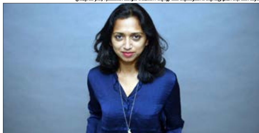
فازت الكاتبة الموريتانية - الفرنسية عن رواية «السماء فوق السطح» (دار غاليمار)

اللقاء الثاني من ورشة «الدولة العلمانية - النماذج التطبيقية»: اليوم - الساعة الخامسة والرابع بعد الظهر - «معهد المعارف الحكمية للدراسات الدينية والإسلامية» (حي الأميركان - مجمع الإمام المجتبي) - الطبقة الرابعة). للاستعلام: 05/462191 أو 76/549219