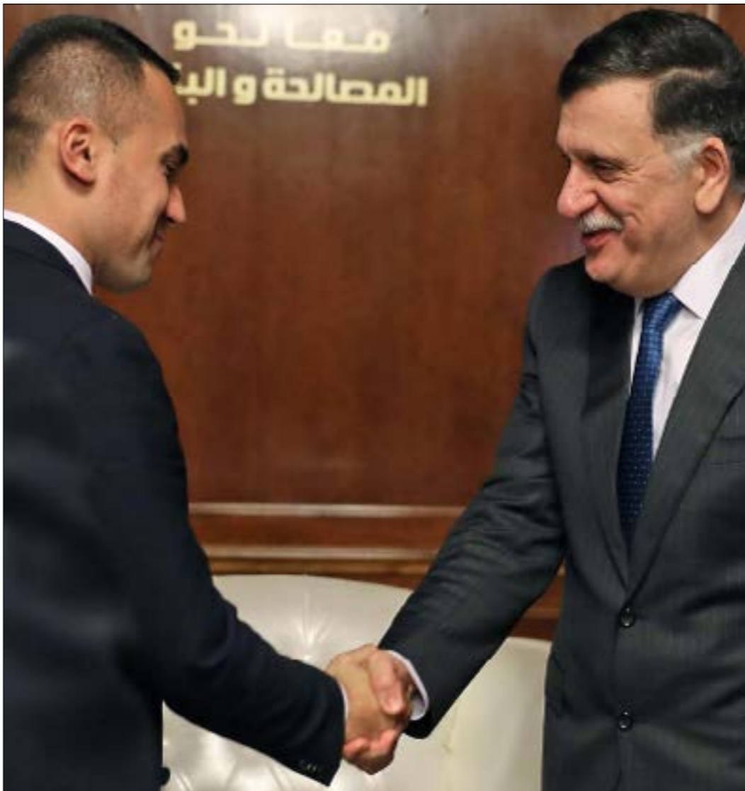
التقى امس وزير الخارجية الإيطالي لويجي دي مايو، في طرابلس، رئيس حكومة «الوفاق»، فائز السراج

تنقل مصادر كان بناءً على رغبة من اللواء الذي عمل مع الرئيس منذ نحو 20 عاماً، بأنه يؤكد بهذا بقاءه في منصبه على رغم الأحاديث المتعددة عن استبعاده قريباً بسبب تقديرات مواقف كانت غير صائبة في إدارة ملفات عدّة. مشهد آخر في المنتدى عكس تجاهل السيسي مقترحات وزير المخابرات التي شنّ