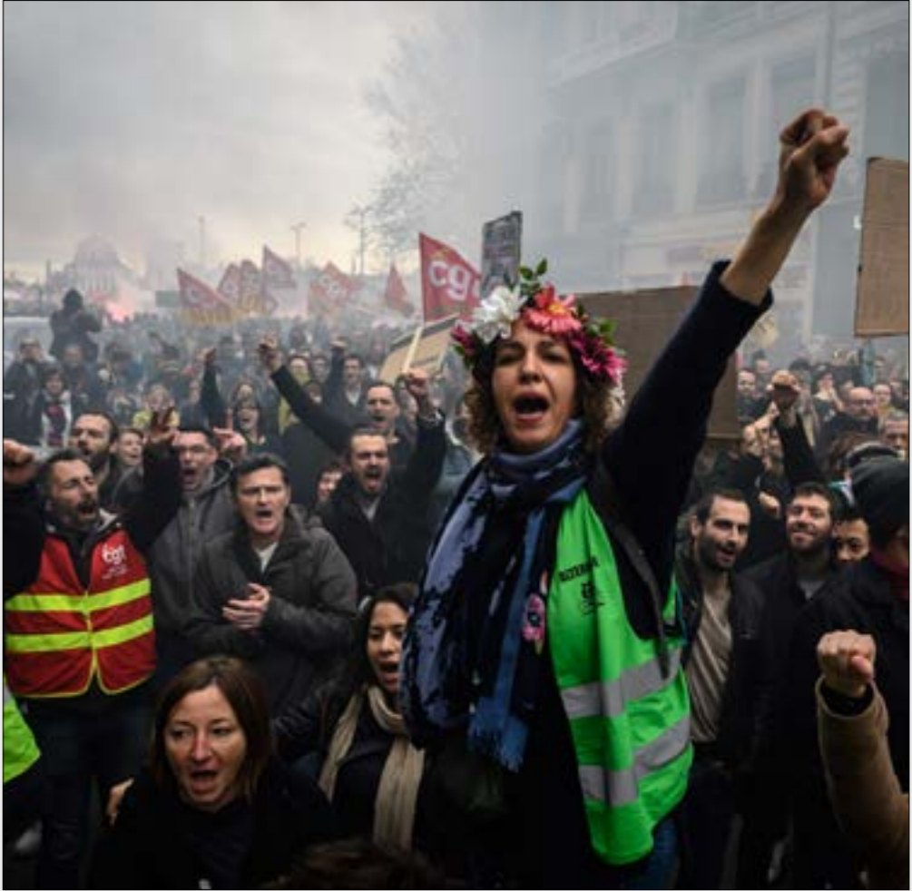
شارك فيه تحرك امس عقال السكك الحديد ومعلمون وموظفون ومحامون وقضاة