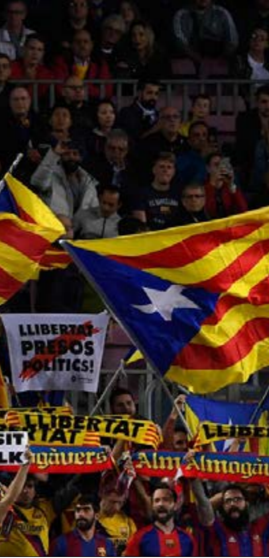
سخرم الجماهير لافتات مطالبه بالانفصال داخل الملعب

«كلاسيكو تاريخي» هو التعبير الأنسب لوصف المباراة التي ستلعب اليوم على ملعب «كامب نو» بين برشلونة وريال مدريد. عدم إمكانية ضمان الأمن وسلامة الجماهير واللاعبين كان السبب الرئيسي لتأجيل المباراة منذ أكثر من شهر. في تلك الفترة اجتاحت إقليم كتالونيا تظاهرات تخللتها أعمال شغب من قبل مؤيدي الاستقلال، احتجاجاً على الأحكام القاسية التي صدرت في حق بعض «السياسيين الانفصاليين» الذين بحسب حكومة مدريد، «انتهكوا الدستور الإسباني» وأقدموا على إقامة استفتاء شعبي وصف بغير القانوني من أجل تقرير مصير المقاطعة، ومن ثم إعلان الاستقلال. لم تتوقف التظاهرات منذ صدور الأحكام، ولكن الوثيرة لم تكن ذاتها. خلال الأيام الماضية كانت الأجواء هادئة نسبياً، ولكن هذا لا يعني أنها ستكون كذلك خلال يوم المباراة. الأکید أن المطالبين بالانفصال عن إسبانيا لن يدعوا فرصة الكلاسيكو تمر، فهم سيستغلون هذا الحدث العالمي الذي سيشاهده حوالي 650 مليون شخص في العالم من أجل إيصال صوتهم. «تسونامي ديمقراطي» هي مجموعة احتجاجية انفصالية منظمة تعمل على قدم وساق منذ تحديد موعد إقامة المباراة من أجل استغلالها. خطوة «تسونامي» الأولى كانت بدعوة مناصريها إلى التجمع حول ملعب «كامب نو» منذ الساعة الرابعة بتوقيت إسبانيا، والمركز في نقاط حدثتها من أجل إحاطة الملعب بالكامل. لم تتضح أهداف هذا التحرك الحقيقية بعد، فالحديث منذ أسبوعين كان عن منع وصول الفريقين إلى الملعب وبالتالي منع إقامة المباراة. غير أن المعطيات بدأت تتغير مع اقتراب الموعد، فقد عبّرت المجموعة في بيان رسمي نشرته على وسائل التواصل أنها لا تهدف إلى منع إقامة اللقاء، ما لم يمنعها نادي برشلونة من التجمع عن موقعها عبر رفع لافتات داخل الملعب تحمل هاشتاغ