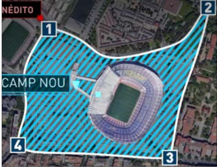
منطقة الانتظار الملعب في محيط ملعب كامب نو

في صفوفه، ميسي، ومنذ عودته من الإصابة التي أعيدته حوالي الشهرين، ما بين بداية المباريات التحضيرية للموسم الحالي وبداية مباريات الدوري الإسباني (غاب ليو ميسي عن المباريات الخمس الأولى من الليغا)، يقدم مستوى مميزاً، كما أنه عاد لتقاسم صدارة الهذافين مع المهاجم الفرنسي كريم بنزيما لاعب ريال مدريد (12 هدفاً لكل منهما). ميسي لم يتكف بصدارة الهذافين، بل إنه يتصدر ترتيب أفضل صانعي الأهداف في «الليغا» أيضاً برصيد 6 تمريرات حاسمة. ليو يعيش أفضل فتراته حالياً، باستثناء اللقاء الأخير أمام ريال سوسيداد الذي لم يظهر فيه بالشكل المطلوب. إضافة إلى تألق ميسي، فعودة اللاعب الفرنسي أنطوان غريزمان لاكتشاف حسنة التهديفي تعتبر نقطة إيجابية لمصلحة برشلونة، والتي من الممكن أن تكون علامة فارقة في لقاء الليلة. بالنسبة إلى ريال مدريد، سيعتمد المدرب الفرنسي زين الدين زيدان على لاعب خط وسطه الأوروغواياني فيديريكو فالفيديري صاحب الـ 21 عاماً الأخير، قدم مستوى مميزاً خلال المباريات التي شارك فيها أساسياً مع النادي الملكي، وهذا ما ولد ثقة بينه وبين مدربه زيدان، الذي أصبح يُشركه بصورة أساسية في أغلب الأوقات. إلى جانب فالفيديري، سيكون الخنائي طوني كروس الألماني، والبرازيلي كاسميرو. لاعب بورغو السابق، سيواجه مشكلة لطالما عانى منها في مباريات الكلاسيكو السابقة هي مراقبة ميسي، والتي تعتبر من أكثر المهتمات صعبة على أي لاعب في العالم. لا شك في أن قوة مدريد في المباريات السابقة تمثّلت بتوازن خط وسطه، الذي بدأ يتأقلم ويتسجم، حتى أصبح