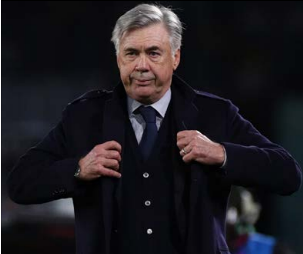
أمال نادج نابولج كارلو أنشيلوتي قبل ايام

النقل التلفزيوني وغنى الأندية، انفرد الدوري الإنكليزي بطليعة أكثر الدوريات درأً للأموال، نظراً إلى تمتّع الـ«بريميرليغ» بقاعدة جماهيرية كبيرة حول العالم. ساهمت العائدات الاستثنائية للدوري الإنكليزي بتوسيع الهوة بينه وبين باقي الدوريات الأوروبية الكبرى، لتصبح إنكلترا الوجهة الأفضل للاعبين. أصبحت أندية إنكليزية «متوسطة» تحصد العديد من المواهب الشابا والأسماء اللاعبة على حد سواء، غير أنّ الأمر تخطى نطاق اللاعبين في الفترة الأخيرة، ليشمل دخول بعض المدربين إلى معادلة الريح والفير.