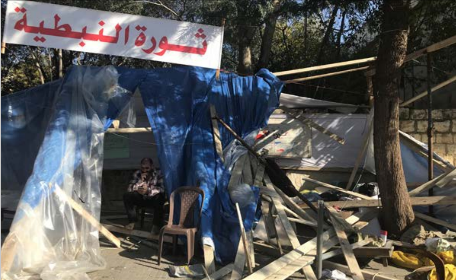
خيمة النبطية، أمس، قبل إحراقها ليلاً (الأخبار)

المؤشرات المتداولة عشية الاستشارات ترقّع من احتمال إرجائها مرة أخرى، علماً بأن «أجواء القصر الجمهوري تؤكّد تمسك عون بموعدها، وليست من يُسمّى» على عكس الحريري الذي يُفضّله بعد اتفاق مع الأقرء» نتيجة هبوط تصديده السياسي (تحديداً المسيحي)، وأنشأف مكانته الدولية. ما حصل يؤكّد أن السحر انقلب على الساحر. فالحريري الذي ظلّ يتصرّف منذ استقالته من موقع المرّاح، فيما الآخرون محشورون، اتّحان الى جانبه على حلبة المنافسة: النائب فؤاد الخزومي الذي يتمسك به الرئّس ميشال عون والدرجة