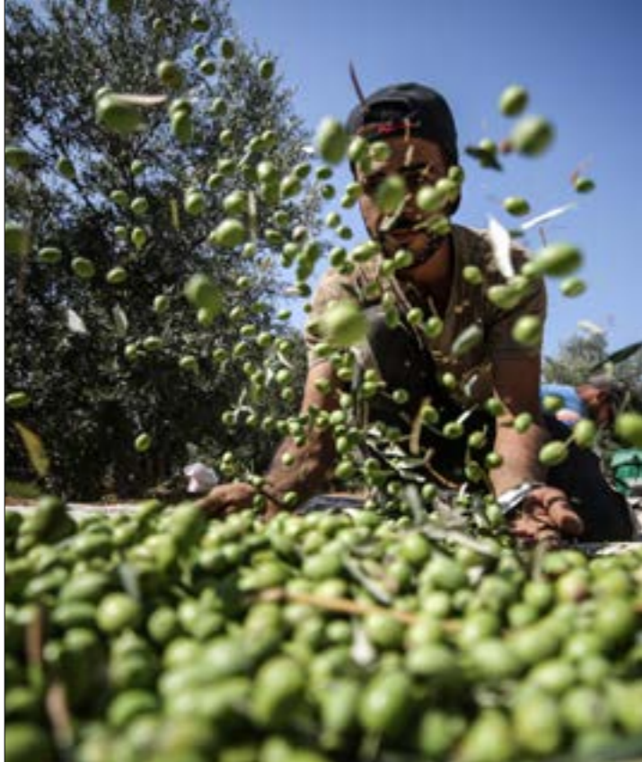
محصول الزيتون المتوقف في غزة هذا العام يقدر بنحو 30 الف طن (الناظر)

القانون على المترشحين الاعتراف ب«منظمة التحرير... مخطأً شرعياً ووحيداً»، وكذلك بإعلان الاستقلال، وأحكام القانون الأساسي. أما في حال جرت الانتخابات في الضفة المحتلة من دون غزة، فإن «حماس» ستعتبر ذلك «فصلاً حقيقياً لقطاع