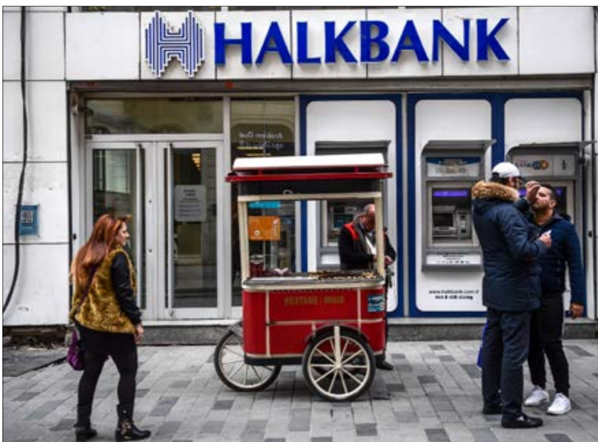
نفى المصرف مشاركته في التحاليل على العقوبات وشدد على أنه لا يخضع لسلطة وزارة العدل الأميركية (أ ف ب)

لتأمين حدودنا ونشر السلام في المنطقة». ونفى المصرف مشاركته في التحاليل على العقوبات ضد إيران، وشدّد على أنه لا يخضع لسلطة وزارة العدل الأميركية نظراً لعدم امتلاكه أي فرع أو موظفين في الولايات المتحدة، معتبراً أن «قرار توجيه الاتهام هو تجاوز قانوني غير مسوق». في غضون ذلك، قال الرئيس الإيراني حسن روحاني، أمس، إن بلاده مدينة لجيرانها وبعض الدول الأخرى التي تواصل