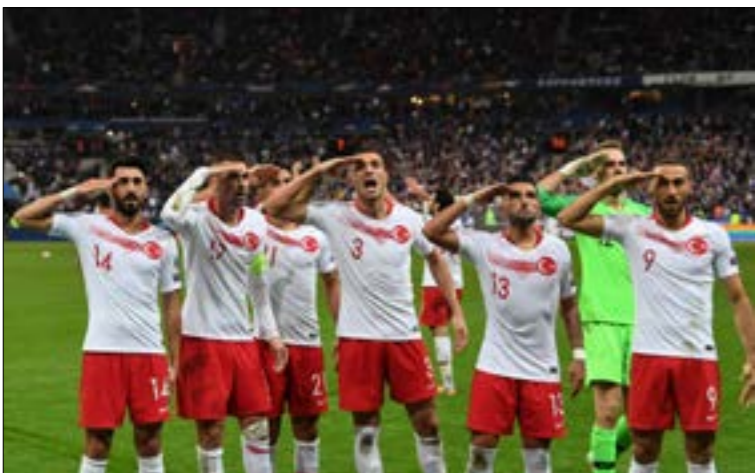
أخذ لاعبو تركيا التحيّة العسكرية في آخر مبارياته

للدخول في منافسات «البريمير ليج» في العامين الأخيرين، تحديداً بشأن العروض العربية المتحدّة تمتلك حصّة الأسد من الاستثمار الخليجي في الأندية الإنكليزية. وكان الشبخ منصور بن زايد آل نهيان رئيس شركة أبو ظلي لتطوير والاستثمار