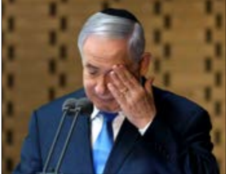
الرئيس السابق لـ«الطائرات

بيتنا، أفيغدور ليبرمان، قد يدفعهم إلى تليين شروطهم، وخاصةً أن الخيارات في ضوء المواقف الحالية محصورة بين حكومة وحدة، أو حكومة يمينية مع «الحريديم»، أو حكومة برئاسة غانتس بمشاركة الأحزاب الفلسطينية ويرى القيادي في «أزرق أبيض» عوفر شيلح، أن التفسير المنطقي لاداء نتنياهو هو أنه يسعى إلى أن يكون رئيس حكومة بائٍ طريقة في اليوم الذي يمثل فيه أمام المحكمة. ويضيف إنه ربما توصل إلى استنتاج بأن انتخابات ثالثة على كتاب تكليف تأليف الحكومة، أن يرموا كل فلقهم لإقناع أعضاء «الكنيست» في الأماكن العشرة الأخيرة من كتلة «البيكور، بأن نتنياهو قرّر الغياب إلى جولة انتخابات ثالثة، وبأنهم من سيقدم شف تلك الجولة، ذلك بهدف شقّ كتلة «البيكور» من الداخل.