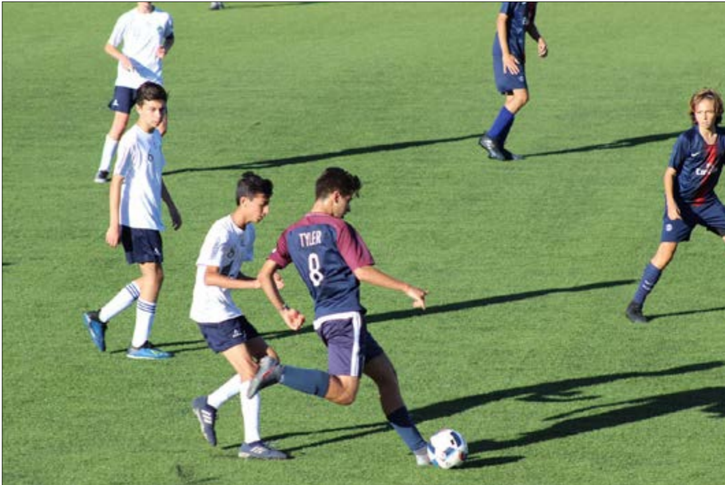
ارتبطت أكاديمية «BFA» بنادي باريس سان جيرمان والتليكو بنادي لوبن موقع أكاديمية BFA،

ويقول سعادة: «حتى في اوروفا ولدى الأندية الكبيرة، هناك ما يسمى الأكاديمية، وهناك ما يطلق عليه اسم المدرسة (سكول)، والفارق بين الأكاديمية والمدرسة كبير، إذ أن الأولى تعمل بشكل احترافي، بينما