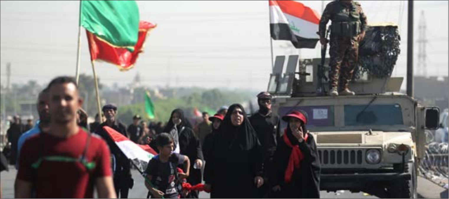
توّجه كثير من البغداديين إلى كربلاء للمشاركة ضي الرعيبة الإمام الحسين (ع)

الجيش في مدينة القامشلي التحضير لتنفيذ بنود التفاهم العسكري مع «قسد»، ودخول مناطق الشريط الحدودي شرق القامشلي، وتكشف مصادر ميدانية لـ«الأخبار» أنّ «الجيش سينتشر في الشريط الحدودي بين المالكية واليعربية»، موضحة أنّ «وحدات مدينة الدرباسية وصولاً إلى أطراف رأس العين، لتأمينها من أي توسع تركي». ويتسم انتشار الجيش السوري في مناطق الشريط الحدودي في محافظة الحسكة باهمية كبرى، نظراً لكونها مناطق زراعية خصبة، بالإضافة إلى غناها بآبار النفط. وتؤكد مصادر سورية مطلعة أنّ «الحكومة تعمل على التفاهم لعودة هذه المناطق إلى إدارة الدولة». كما أنّ دخول الشريط الحدودي الشمالي في الحسكة يعني أنّ الدولة السورية ستستلم قريباً معبر اليعربية الحدودي، ثاني أكبر المعابر مع العراق، بشكل رسمي، ما يشكل إضافة اقتصادية مهمة للبلاد.