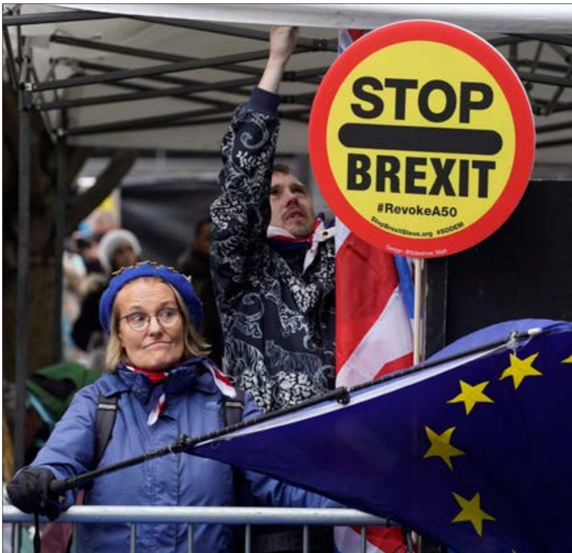
قد يطرح أعضاء في «العراق» إجراء استفتاء، لأن على الاتفاق النهائي مع الأوروبيين (أ ف ب)

تواصلت في بروكسل، يوم أمس، محادثات حاسمة سعيًا للتوصل إلى تنفيذ «بريكست» باتفاق بين الاتحاد الأوروبي وبريطانيا. اتفاق يبدو احتمالاته عالية، وسط الأجواء الإيجابية التي أشاعها رئيس المجلس الأوروبي، دونالد توسك، بإعلانه أن أسس اتفاق «بريكست» باتت «جاهزة»، ويمكن أن تصبح واقعا ملموسا خلال ساعات. توسك اضاف إنه «نظريا ستكون قادرين غداً على إقرار هذا الاتفاق مع بريطانيا»، لكنه لم يكن مفرطاً في تفاؤله. إذ قال: «مع بريكست وشركائنا البريطانيين، كل شيء ممكن... مساءً الساعة (الثلاثاء) كنت مستعداً للمراهنة بأن كل شيء بات جاهزاً. لكن ظهرت اليوم بعض الشكوك لدى الجانب البريطاني». يأتي ذلك على ضوء المعطيات التي تفيد بأن كبير مفاوضي الاتحاد الأوروبي، ميشال بارنييه، قال لوزراء الشؤون الأوروبية في لوكسمبورغ إن خروج بريطانيا من دون اتفاق سيكون «كارثة»، إذ سينسبّ