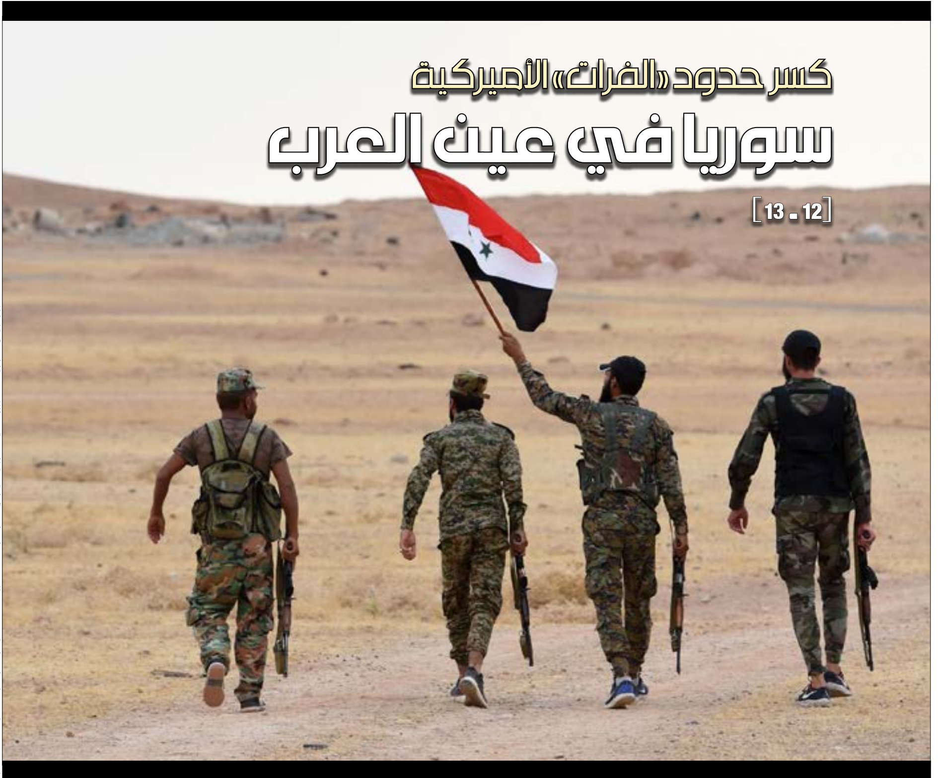
عبور الجيش السوري من مخرج إلى عين العرب ينهي رمزية نهر الفرات كفاصل بين مناطق سيطرة الدولة وحسابي «قسدي»