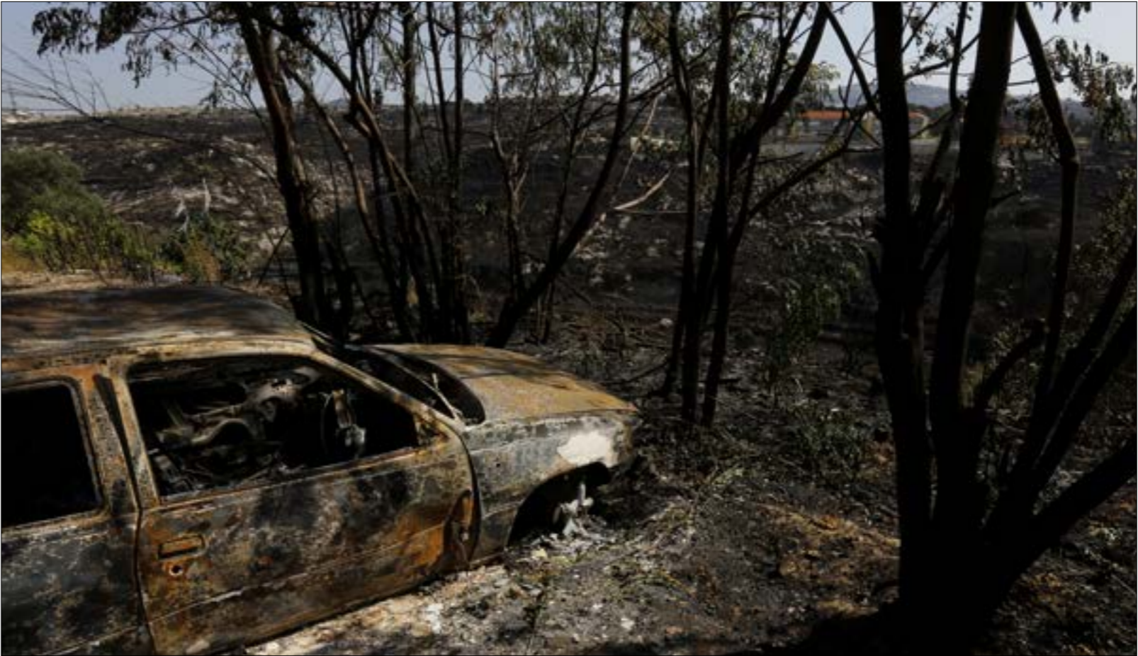
علمه المحققبت تحديد دائرة «مسرح الجريمة، وعزلها لحماية الأدلة الجنائية (مروان طحطم)

بعد وضع التقرير الاول،ي على المحققين تحديد دائرة «مسرح الجريمة»، وفي ما يتعلق بالامكنة التي بدأت النيران بالاندلاع فيها، يفترض تحديد ما اذا كانت قد شهدت أي حوادث او تحركات غير مألوفة، وجمع معلومات مفصلة عن ذلك من خلال تحديد الشهود واستجوابهم في مرحلة لاحقة مع