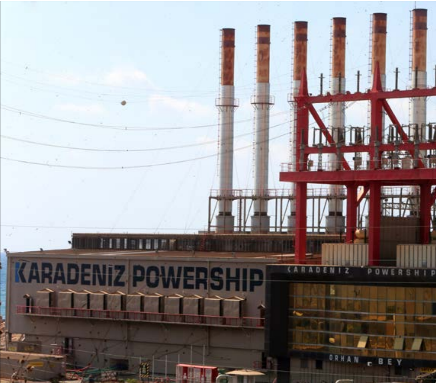
«أطل، نرىض البواخر ضي الزهراني (هيلم الموسوي)»

معمل سلعانا، حيث لا يبقى اقتراح وزارة الطاقة بنقلها من حنوش إلى سلعانا قبولاً لدى معظم أعضاء اللجنة، الذين يصفون حجة وزارة الطاقة بالضعيفة. لكن، إذا كانت اللجنة، التي تفصل عن إنجاز بناء المعامل الخاصة لإنتاج الطاقة) وإلها بالنسبة إلى المرحلة المؤقتة تصل إلى حد