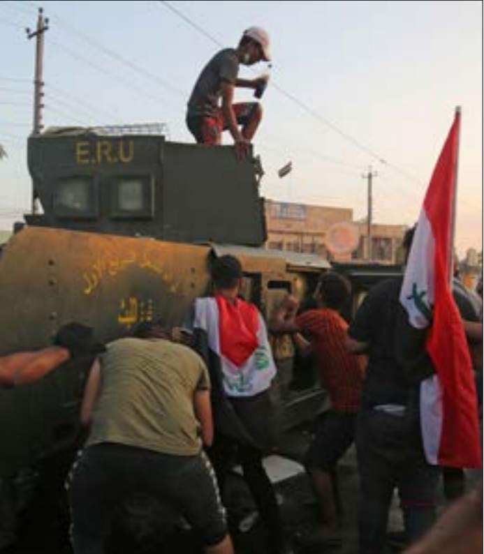
تسلمه بغداد إلى «تثبيت الحذّ، بين المظاهرين السلميين والمخزيين (أ ب، ف)

الاستخبارية، يقضي بتخريك تظاهرات مطلبية، واستنمارها وخرقها ودفعها تالياً باتجاه العنف، وخلق حالة من الفوضى واللبلية في البلاد، ما يؤدي -