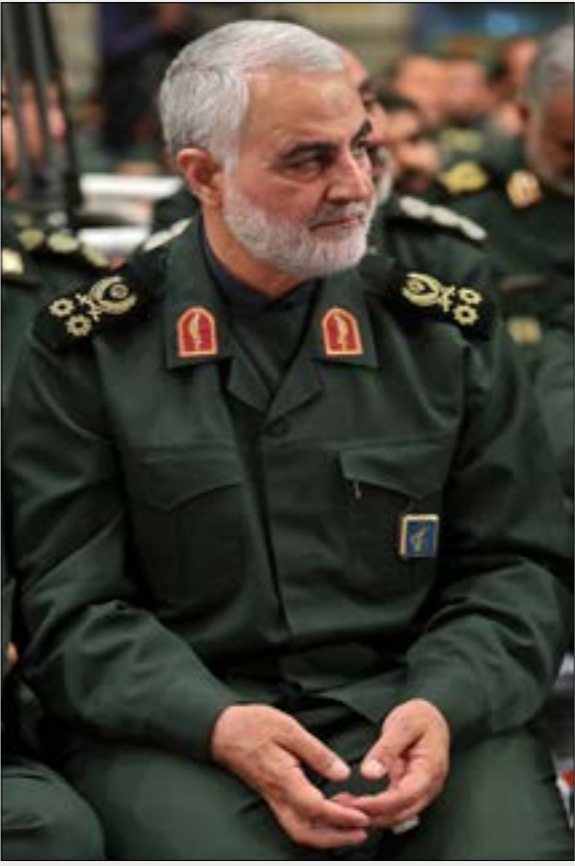
اقبض المخطط استهداف قائد قوة القدس في الحرس الثوري في محافظة كرمان الإيرانية