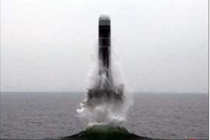
أكدت بيونغ يانغ انها اخترت، بنجاح، صاروخا باليستيا من نوع جديد، (ف ب)

التي تنطلق من الغواصات ينطوي على دلالة كبيرة، إذ إنه يؤذن بمرحلة جديدة في احتواء التهديد الذي تمثله قوى خارجية على جمهورية كوريا الديمقراطية الشعبية، ويزيد من تعزيز قوتها العسكرية للدفاع عن النفس».