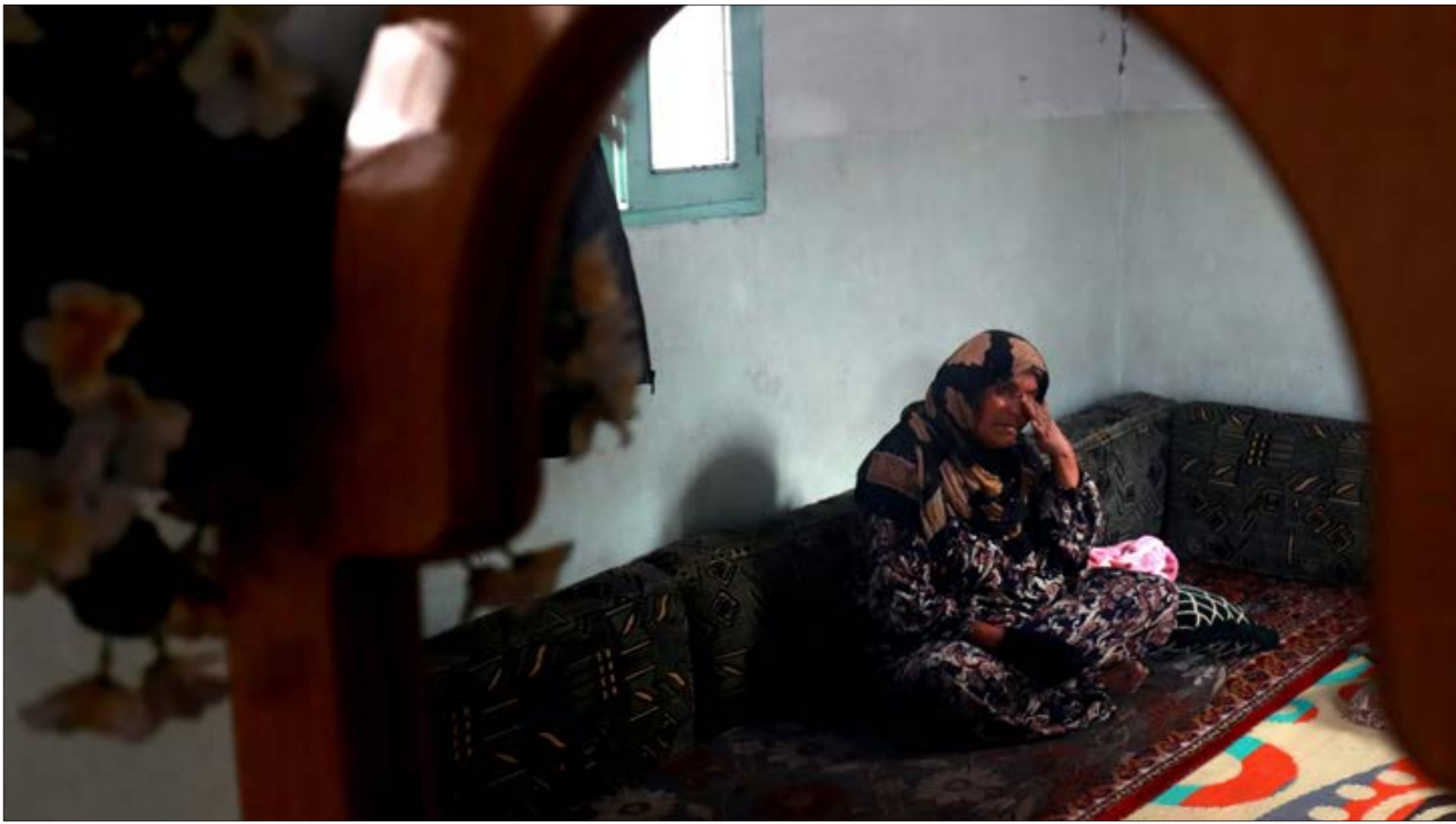
لا يزال ملف المحفودين (مختطفين ومعتقلين) جرحاً مفتوحاً رغم طرحه في محافلة عذّة (الريف - اف ب)