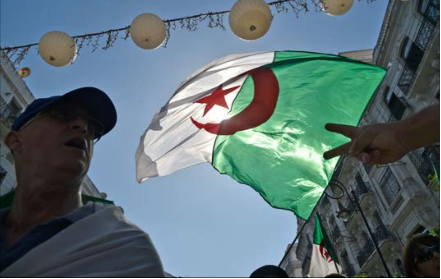
خلك تظاهرة يوم الجمعة الماضي في العاصمة الجزائرية

الطلبية والمعيشية أي نقابته، ولهذا كانت الانتخبات في نقابة الأطباء والأجواء المحيطة بها تجري على السدوام ضمنّ الثوابت التالية: