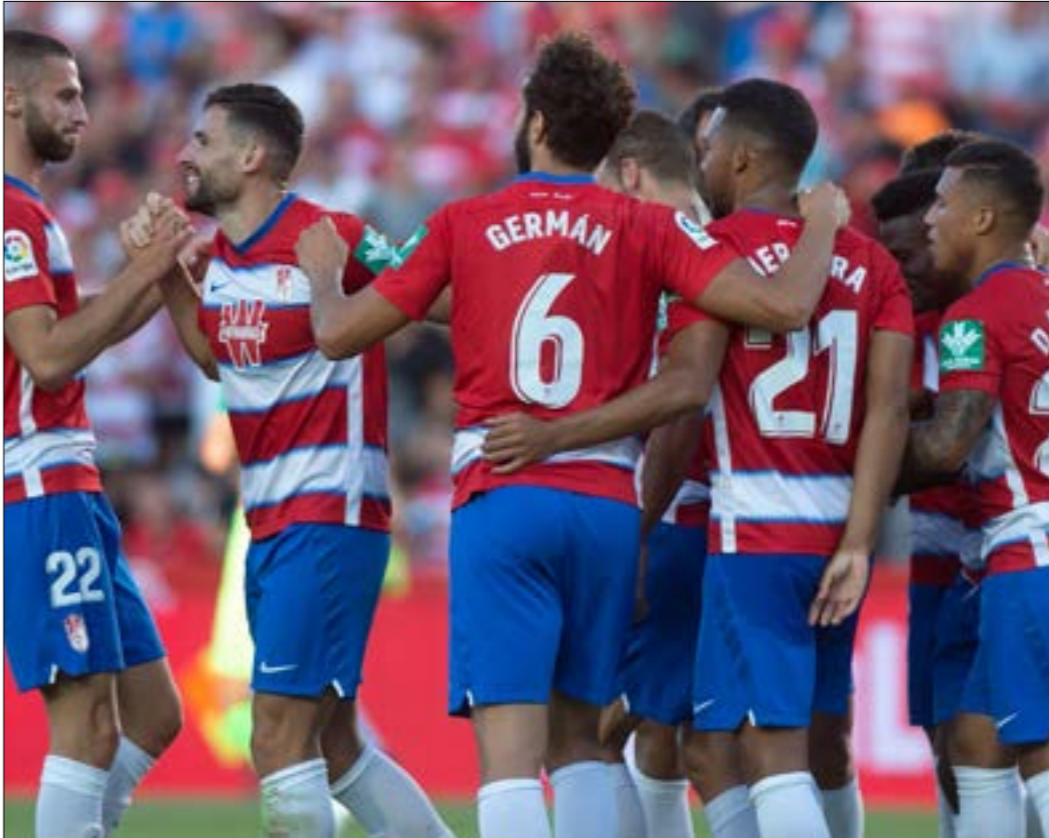
استقبلت شبك الشريف هدفاً واحداً في 5 مباريات

الخامس من الدوري، ويهدفين من دون رد. قبل أن ينتهي اللقاء حينها بـ8 دقائق فقط، أي عند الدقيقة 82 من عمر المباراة بين برشلونة وغرناطة، كانت أول تسديدة للنادي الكاتالوني على مرعى الحارس البرتغالي روي سيلفا. في طبيعة الحال، برشلونة من بين الأندية التي تعاني هجوماً في الأونة الأخيرة، إلا أن صمود أبناء غرناطة أمام برشلونة طوال هذه المدة هو امر جدير بالاحترام، وإذا ما دل على شيء، فإنه يدل على العمل الجاد في الفوز الذي حققه الأندلسيون على حارس حراسة المرمى في كأس ملك إسبانيا،