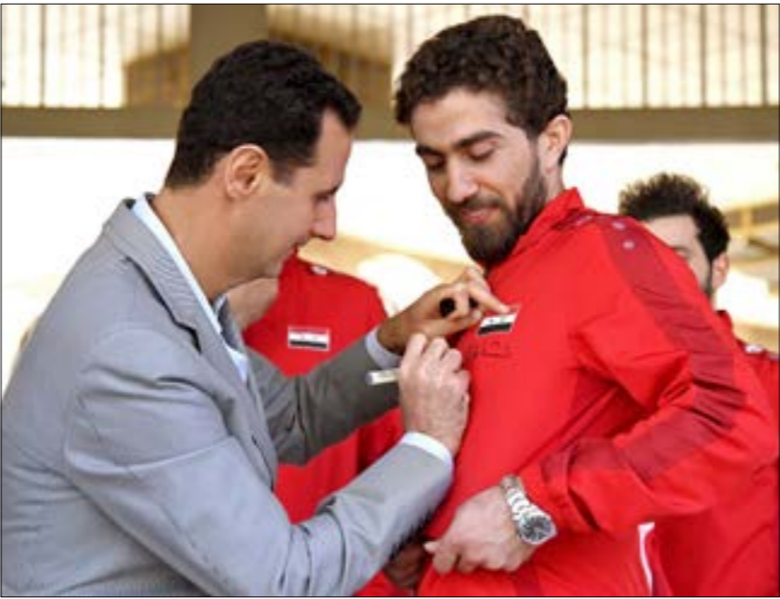
عاد الخطيب إلى المنتخب عام 2017

أعلن فراس الخطيب الهذاف التاريخي للمنتخب السوري لكرة القدم، اعتزاله اللعب بعد مسيرة لأكثر من عقدين في الملاعب السورية والعربية، مؤكداً أن «القادم أفضل»، بعد تلميحته إلى خوض مسيرة تدريبية. وكتب الخطيب عبر حسابه الرسمي على تويتر أمس الاثنين «بعد 26 سنة لا يمكن أن أنساهما جميع تفاصيلها. أعلن انتهاء مسيرتي في ملاعب كرة القدم كلاعب، والقادم أفضل إن شاء الله». ويأتي إعلان الخطيب بعد أيام من كشف مدرب المنتخب فجر إبراهيم أن اللاعب البالغ 36 عاماً، بات خارج حساباته. وشارك الخطيب نهاية الأسبوع الماضي في برنامج تلفزيوني حيث قال «فراس الخطيب اعتزل كرة القدم اليوم»، مؤكداً أن قرار الاعتزال يشمل اللعب على