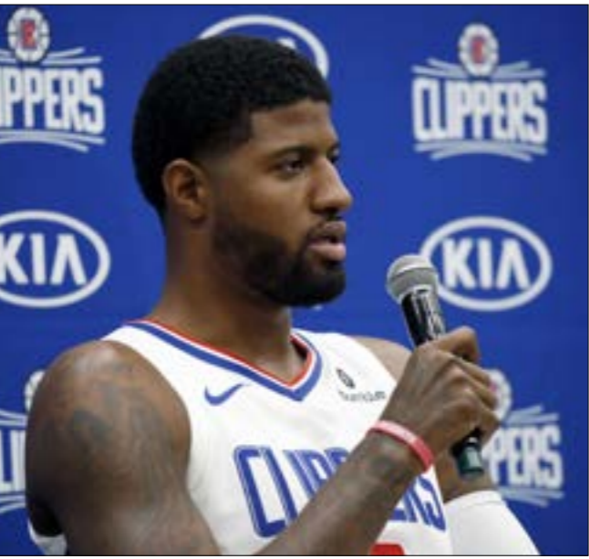
تلقاه كليبرز مع جورج ويلنارد

سيتي ثاندر إلى عملية جراحية مطع أيار/مايو الماضي بعد خروج فريقه من الدور الأول من البالي أوف المحترفين في بورتلاند ترايل بلايزرز (4-1)، حيث كان يعاني من تمزق في وتر الكتف اليمنى، واستغل الجراحون الفرصة لإجراء عملية جراحية في الكتف الثانية، حيث كان يعاني من إصابة أيضاً. وقدم جورج موسماً رائعاً مع أوكلاهوما