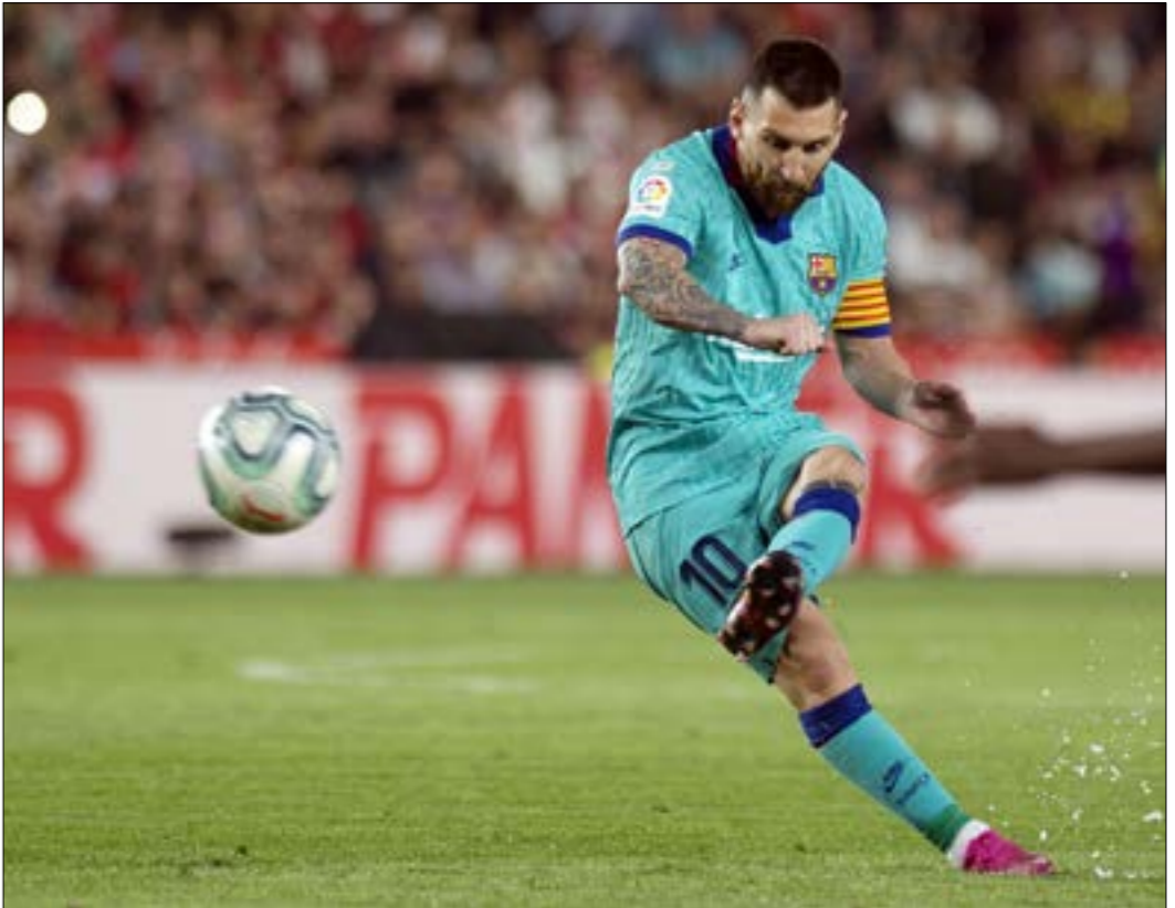
تعرض ميسِّي للتحذير بعدة مرّات